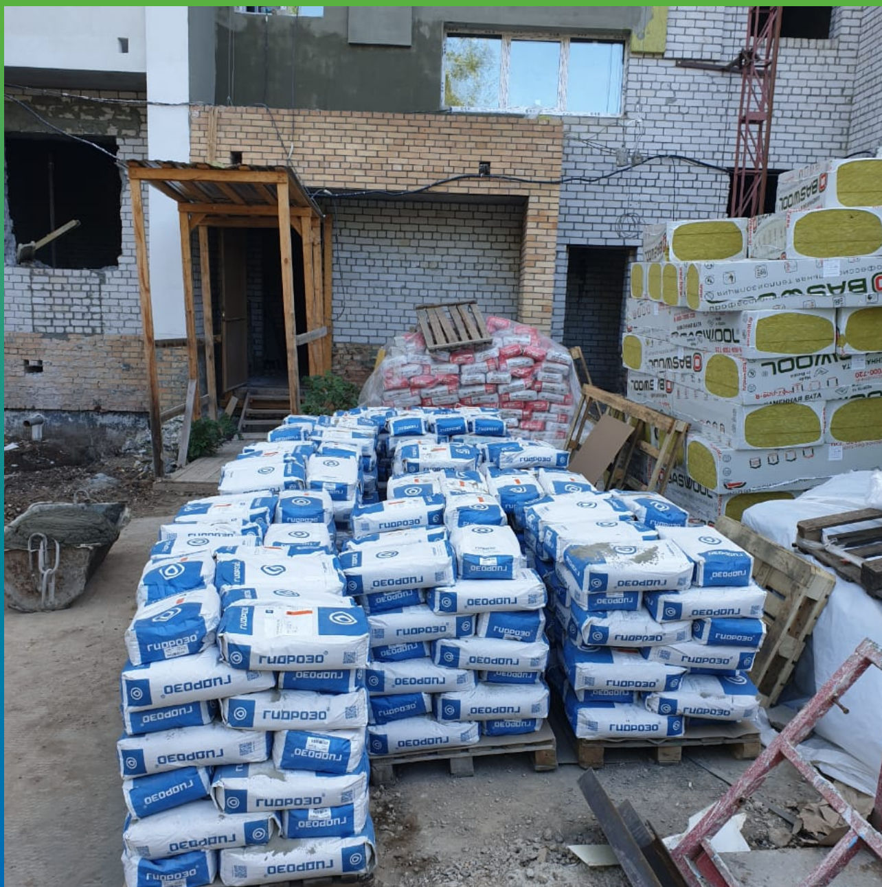
Стармекс ТМ6 на объекте