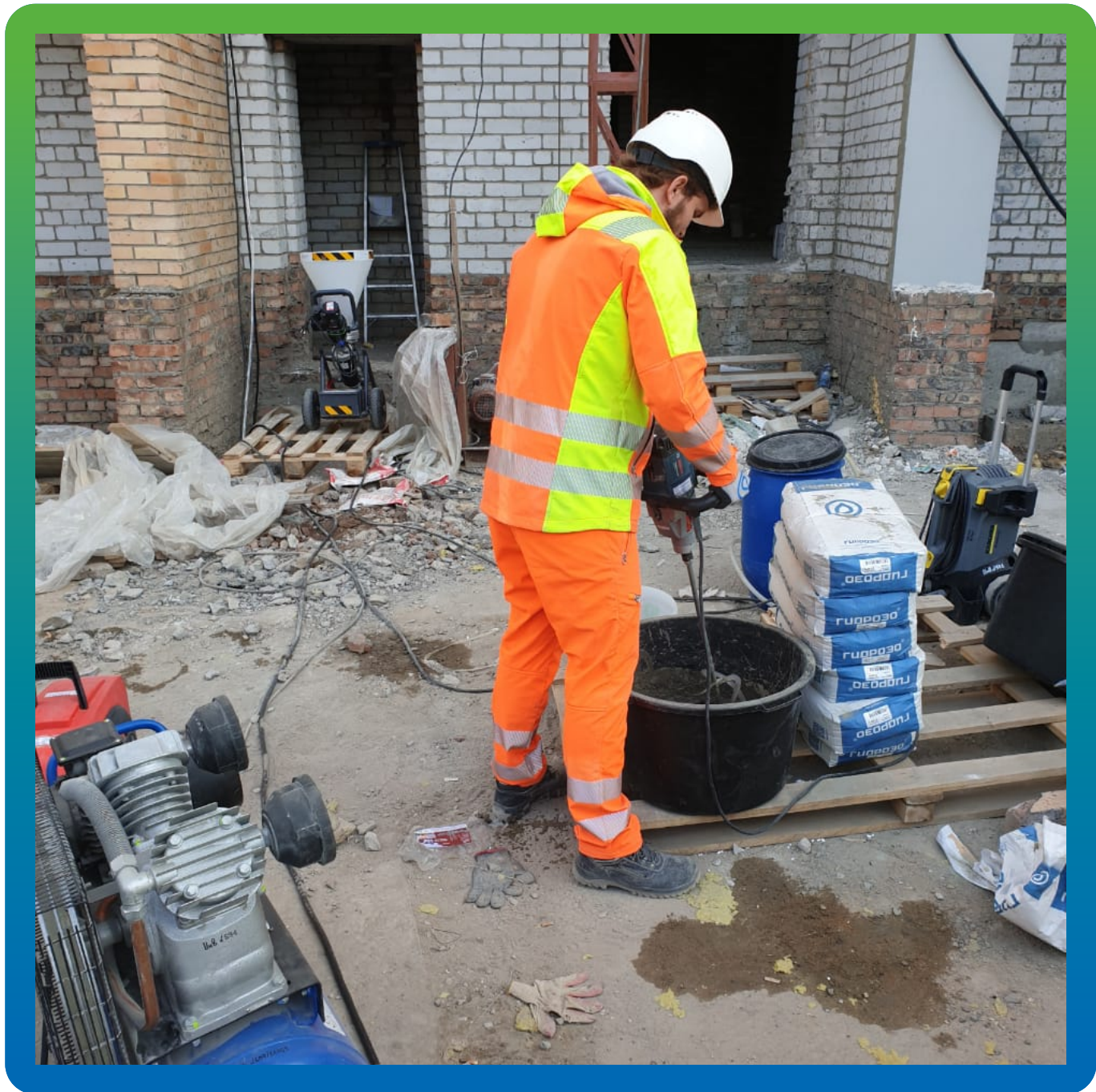
Подготовка смеси Стармекс ТМ6