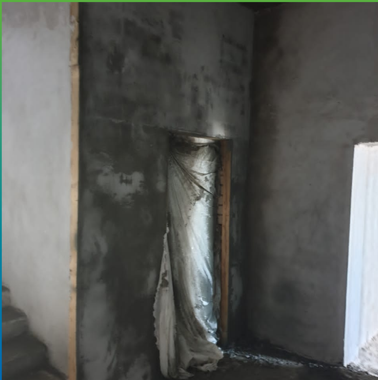
Лифтовые шахты после нанесения Стармекс ТМ6