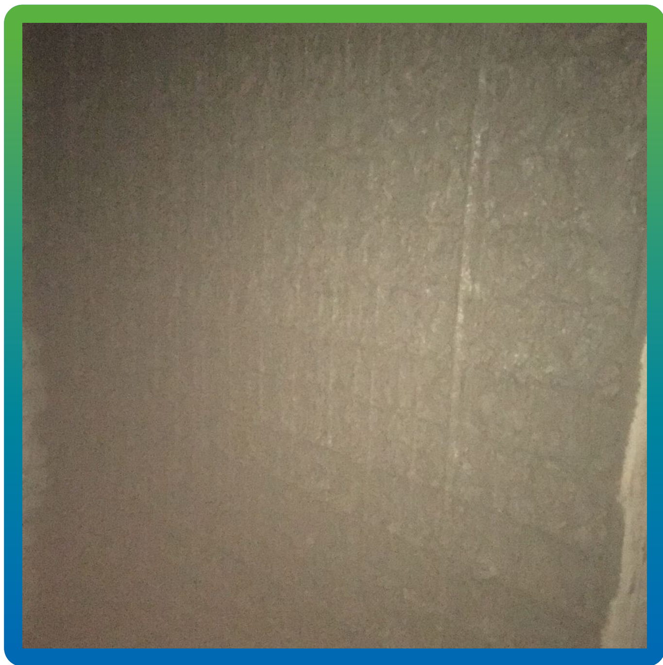
Нанесение слоя 60 мм