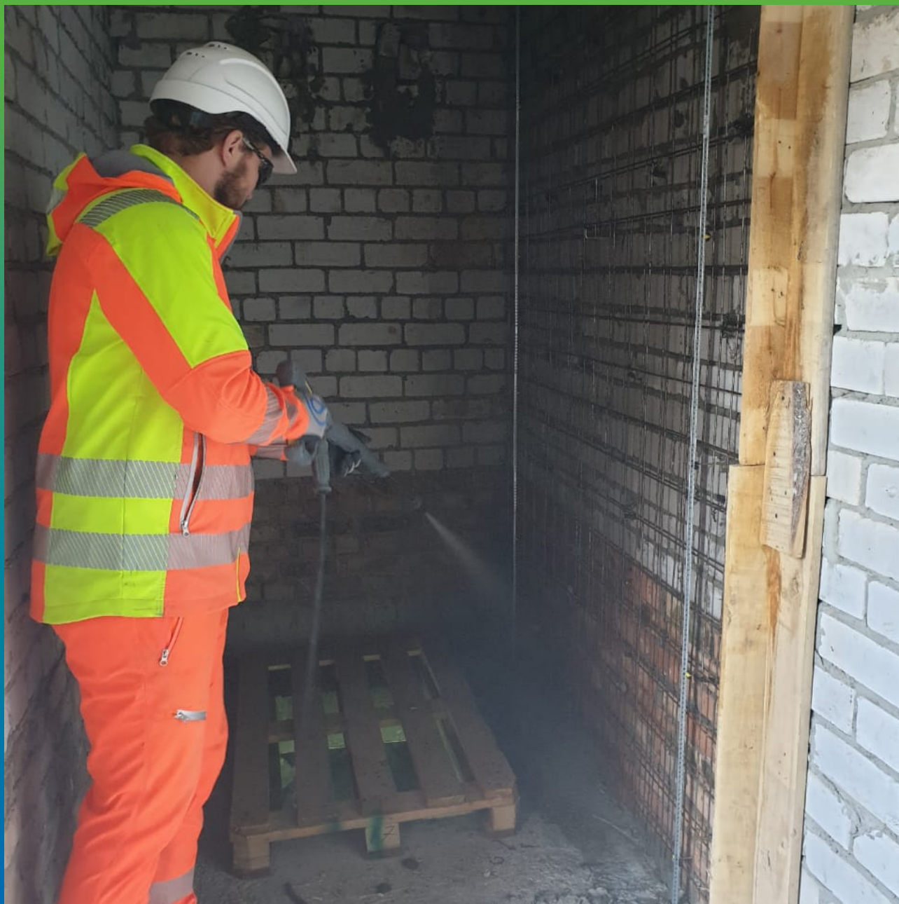
Увлажнение поверхности перед нанесением материала