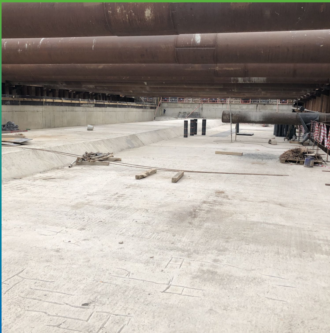
Состояние бетона до ремонта