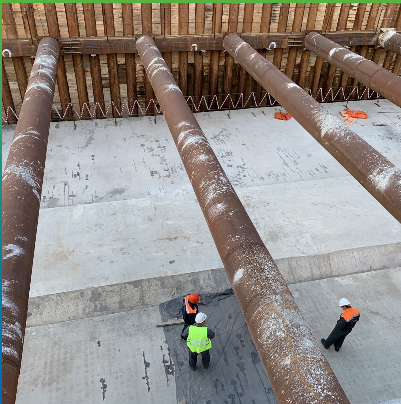
Финишный вид отремонтированных трещин