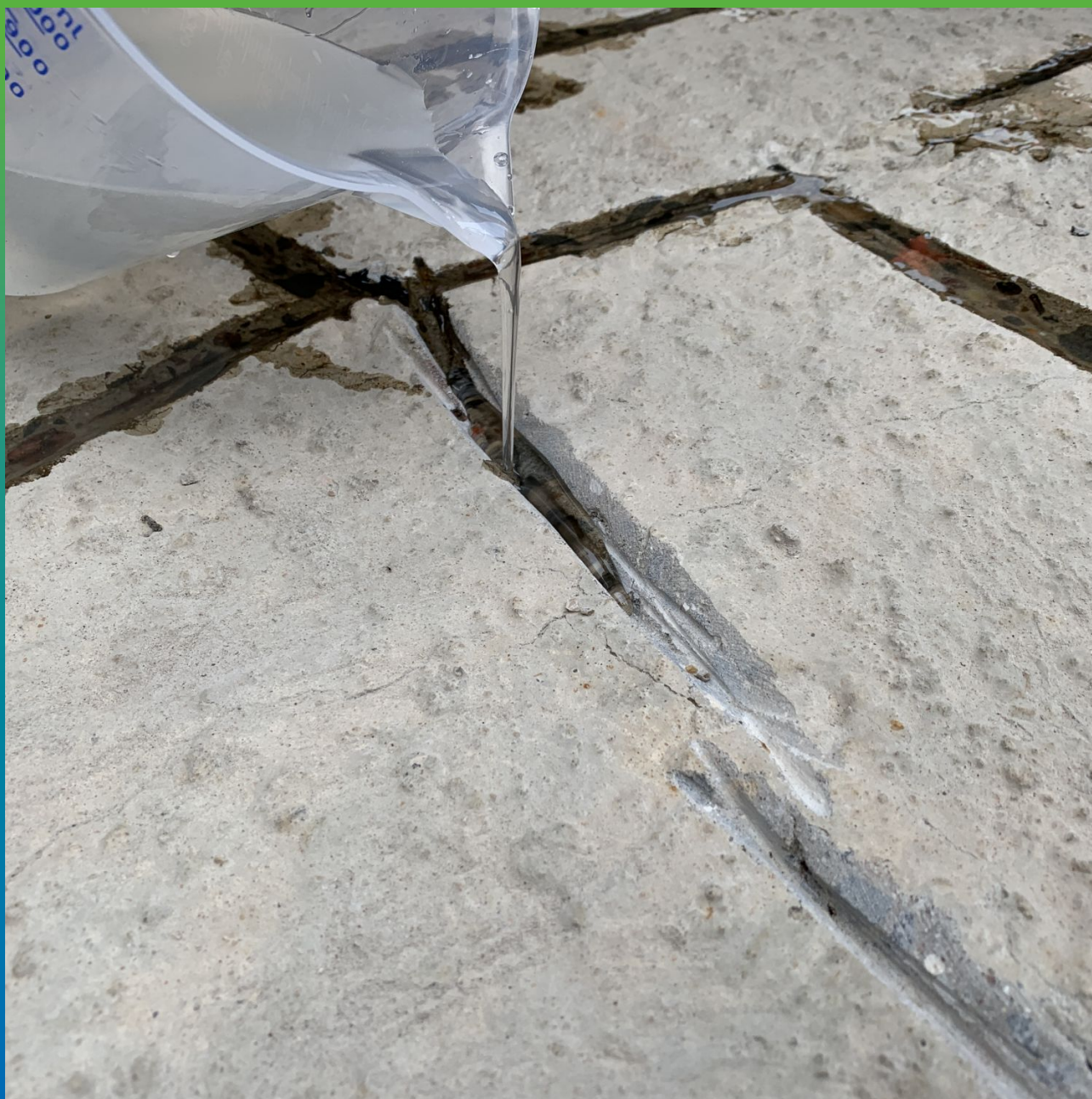
Ремонт трещин методом проливки