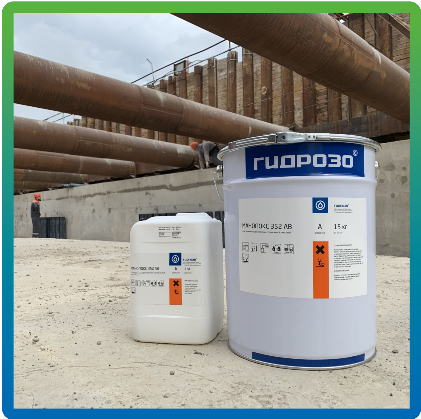
Манопокс 352 ЛВ