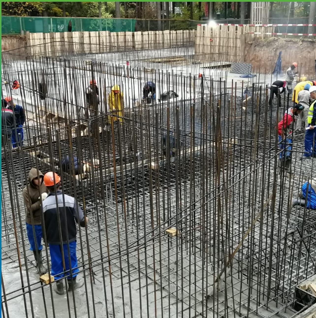
Подготовка к просыпке.