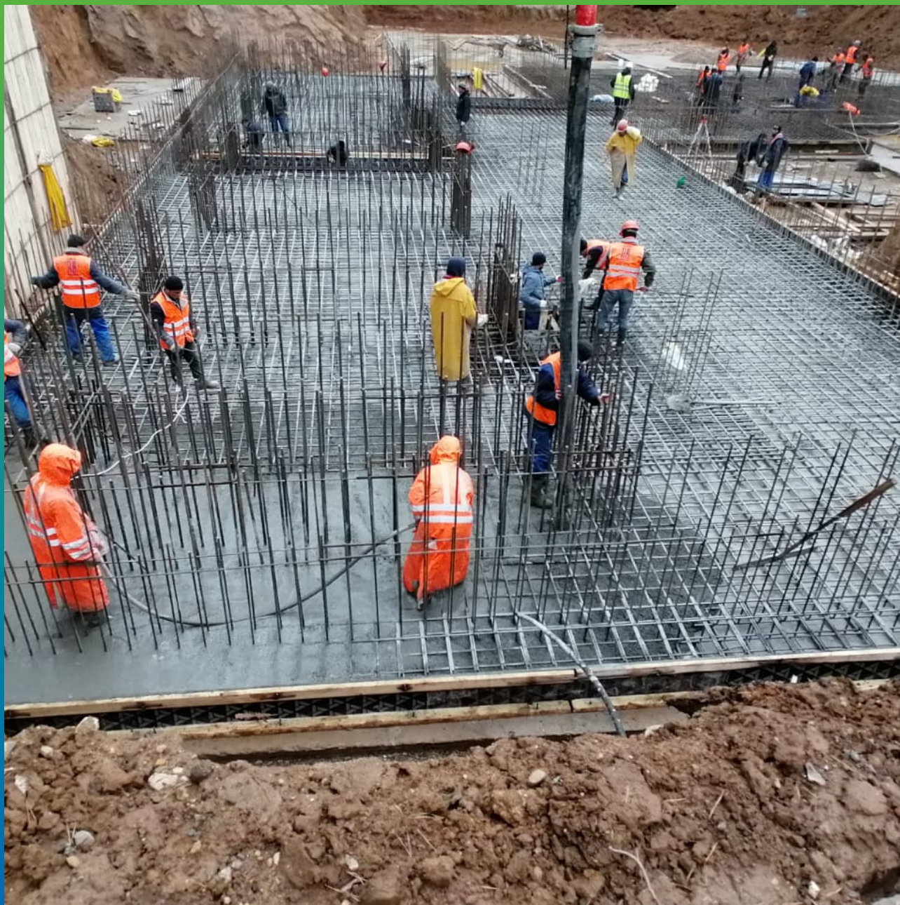
Бетонирование после гидроизоляционных работ