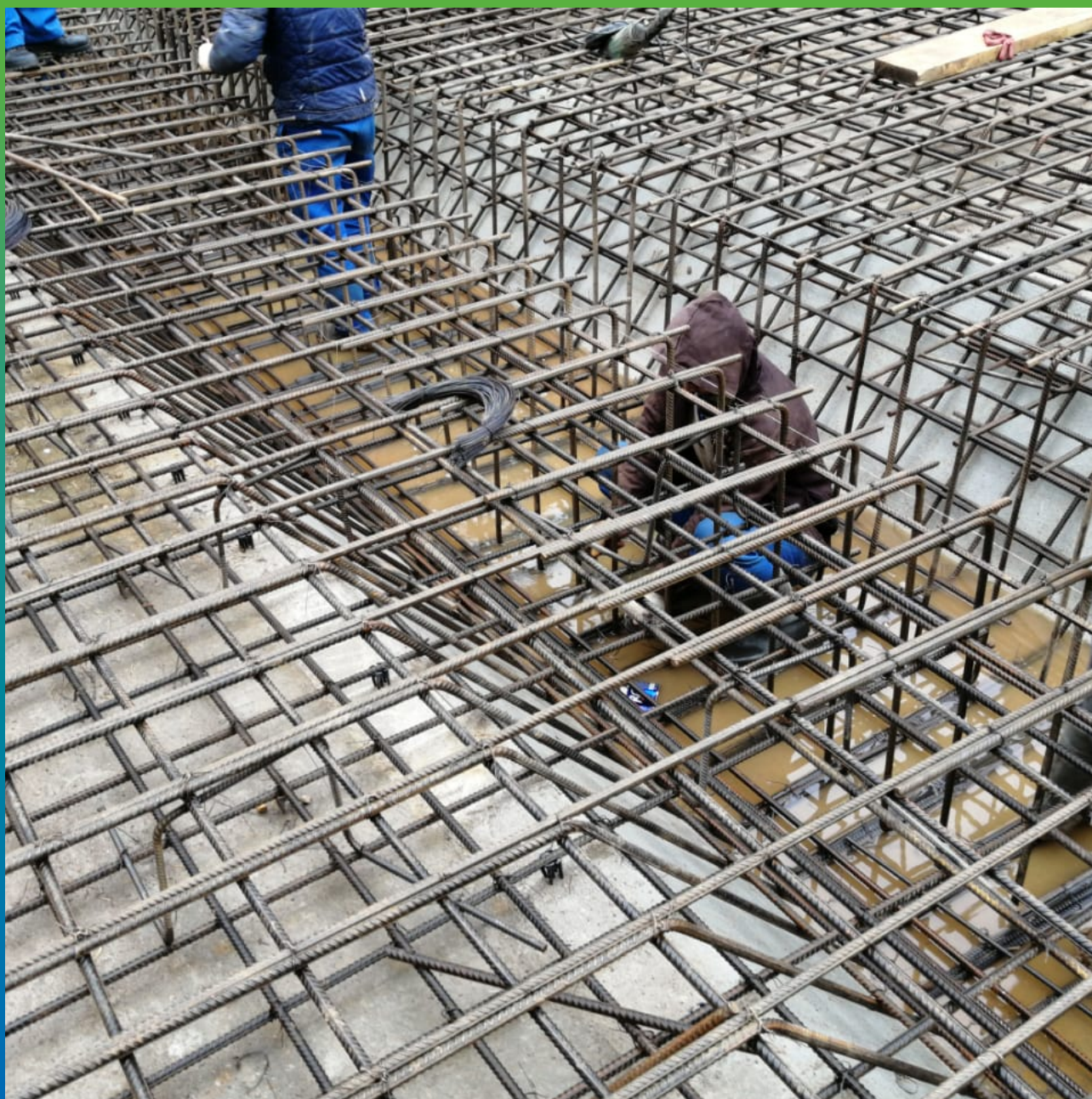
Обвязка арматуры перед проведением работ