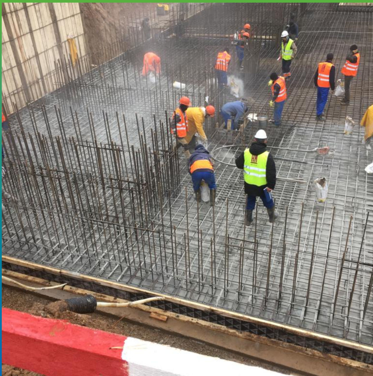
Проведение работ по просыпке