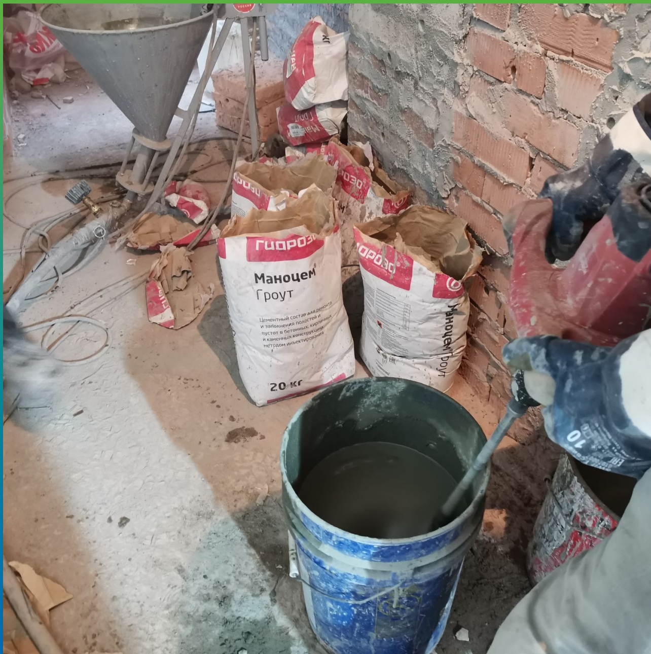
Приготовление текучего, высокопрочного состава Маноцем Грут для усиления внешних стен здания