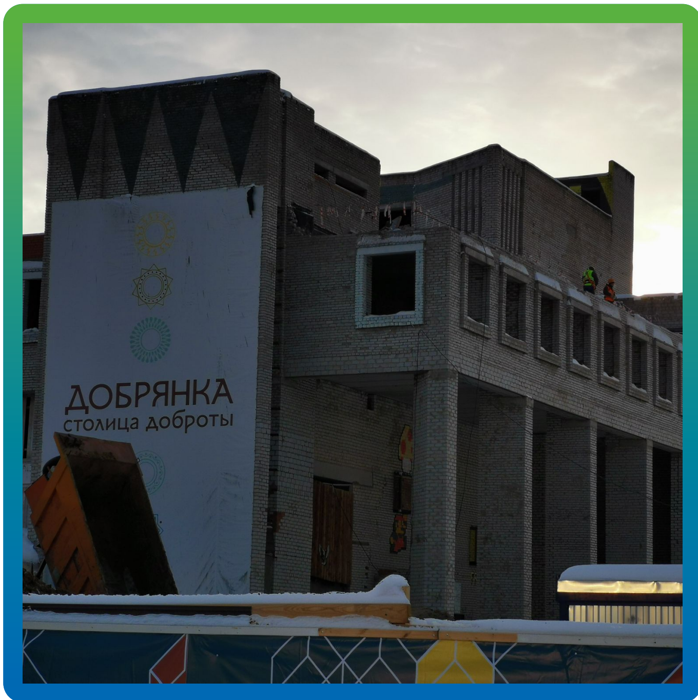
Вид объекта до проведения работ