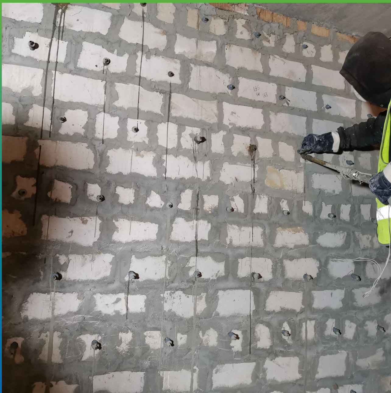
Усиление кирпичной кладки внутренних стен здания Маноцем Гроут