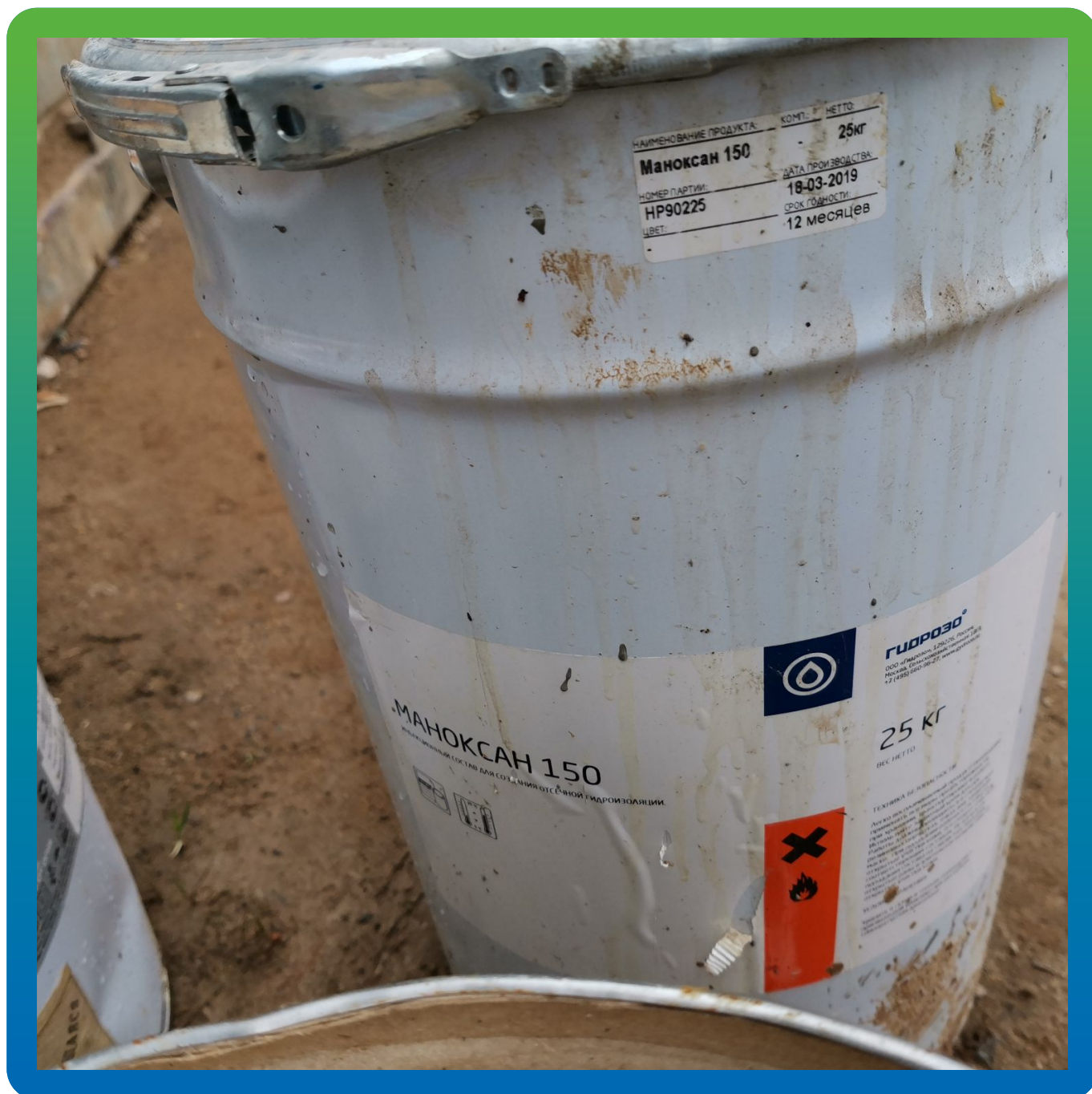
Создание отсечной гидроизоляции с помощью Маноксан 150, смолы на основе силиконов