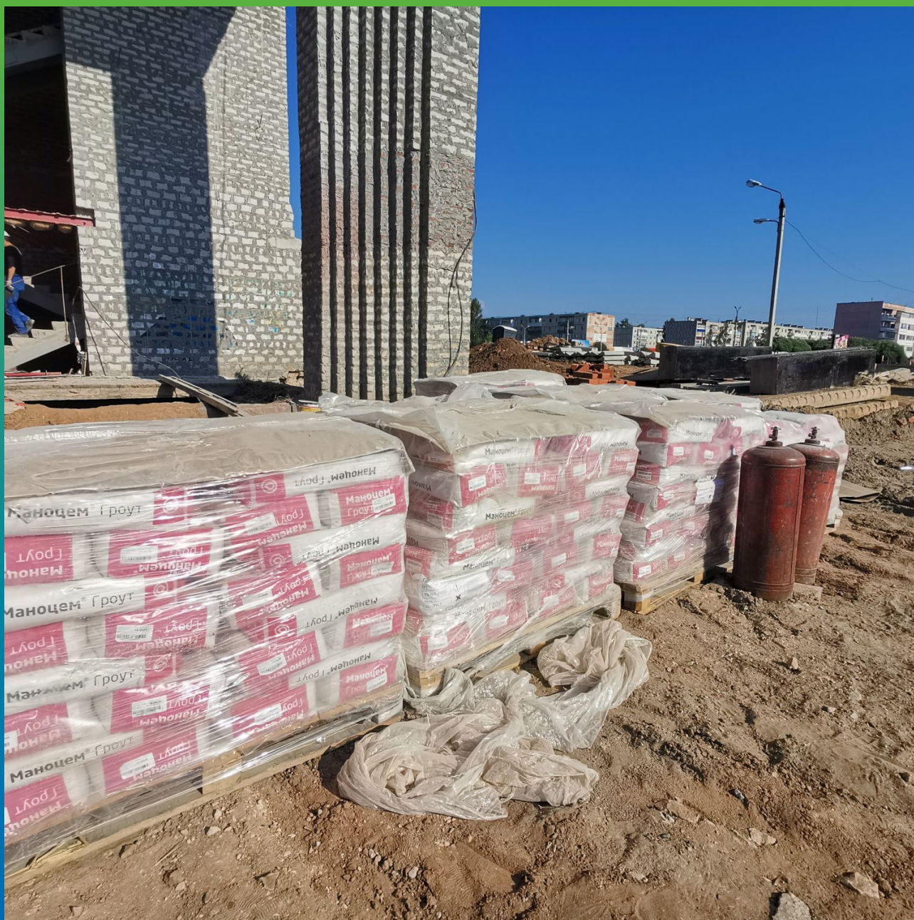
Материалы Гидрозо для усиления внешних стен здания