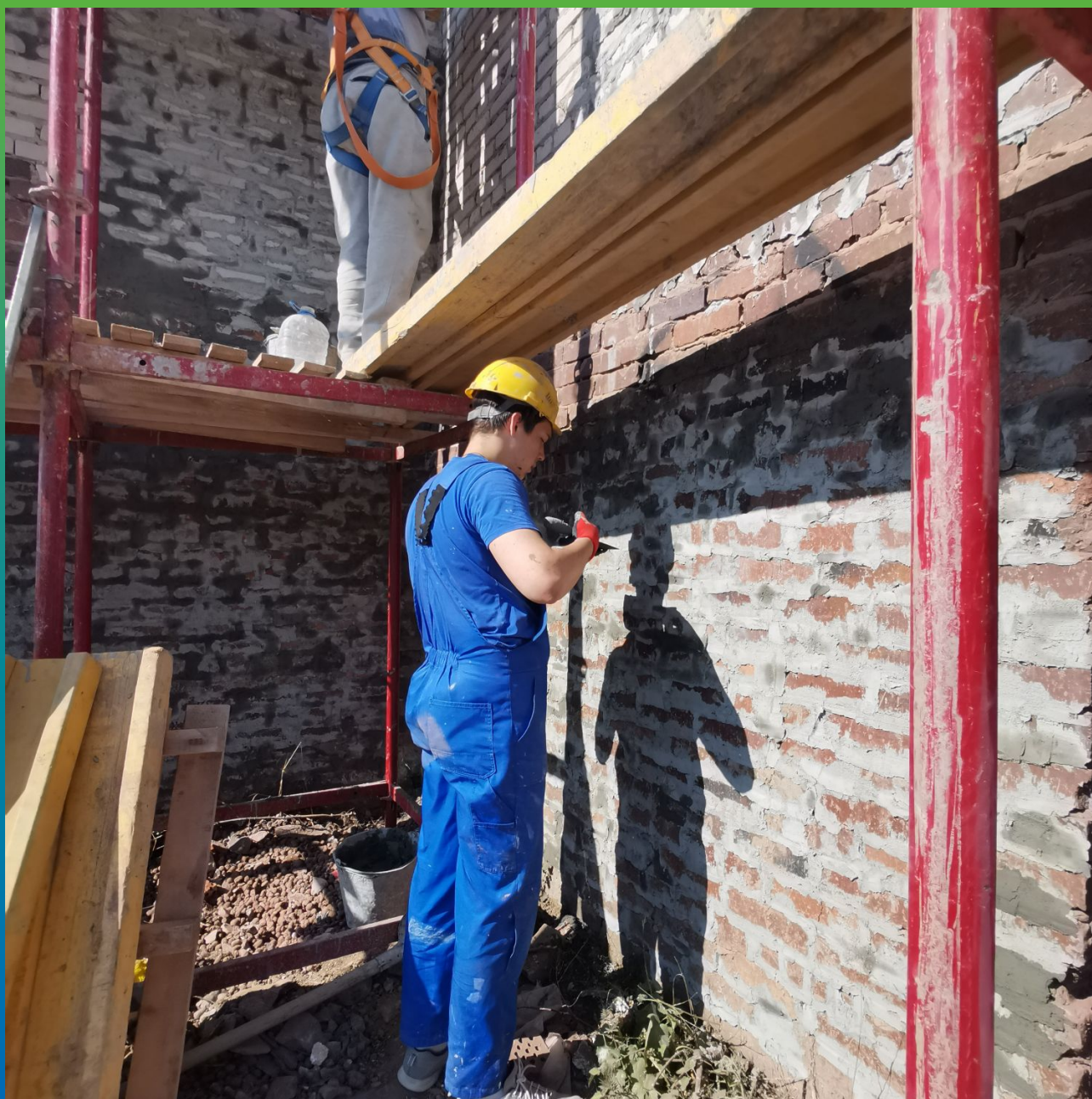
Ремонт швов кирпичной кладки Стармекс РМЗ на внешних участках здания