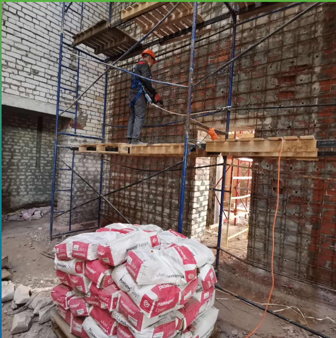
Бурение шпуров для усиления внутренних стен здания