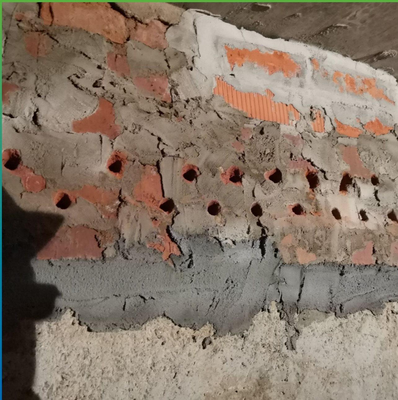
Бурение шпуров в два ряда под отсечную гидроизоляцию