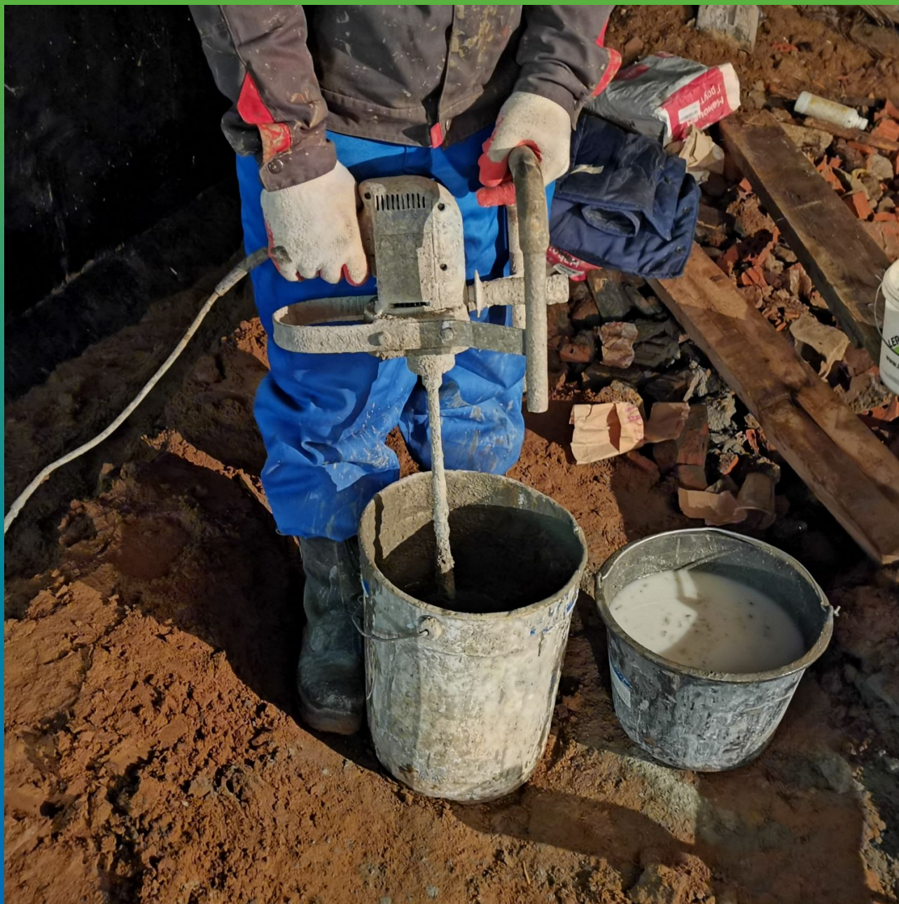
Процесс приготовления инъекционного состава Маноцем Гроут для уплотнения кладки нижнего ряда шпуров