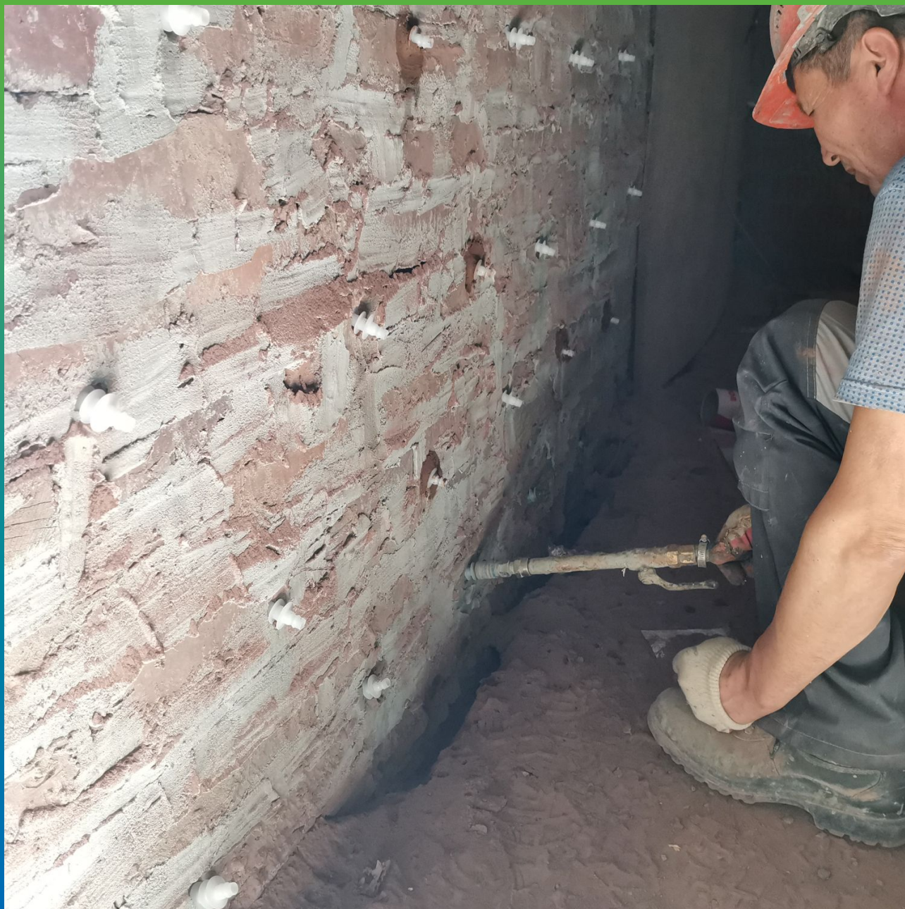
Усиление Маноцем Гроут внешних стен здания