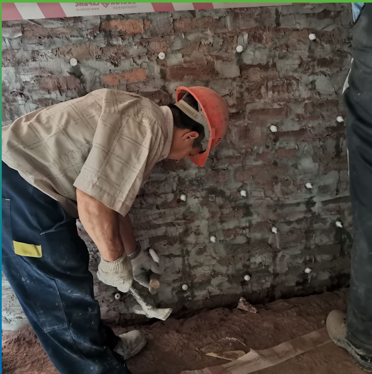
Установка в пробуренные шпурсы пакеров для проведения инъекционных работ с внешней стороны здания