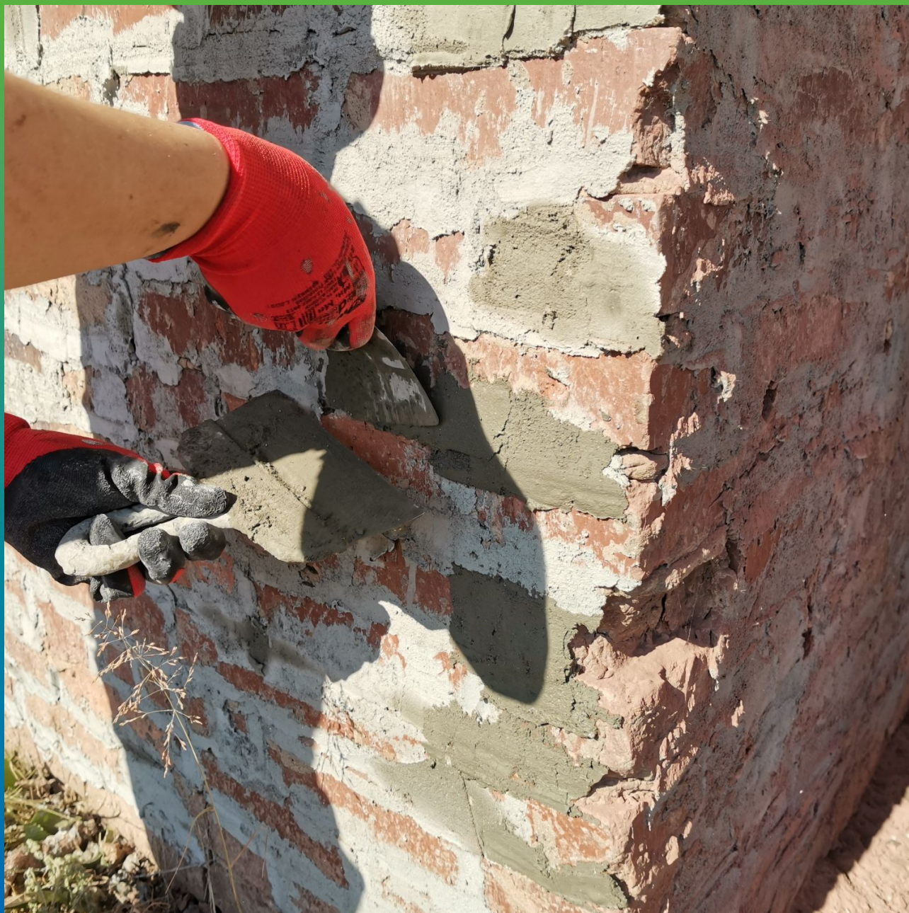
Ремонт внутренних швов кирпичной кладки