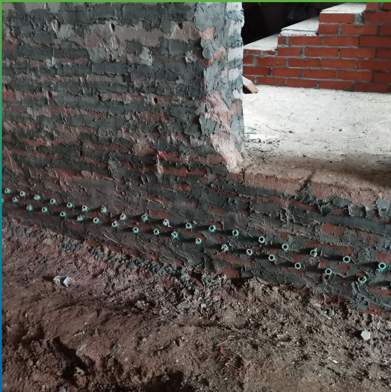
Установка пакеров для проведения отсечной гидроизоляции подвала