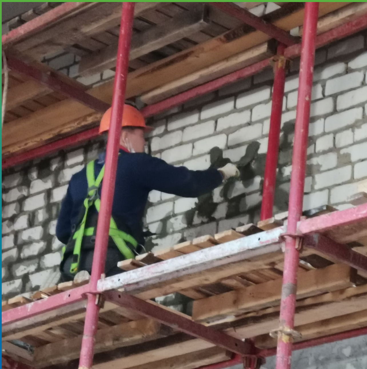
Ремонт Стармекс РМЗ внешних стен здания