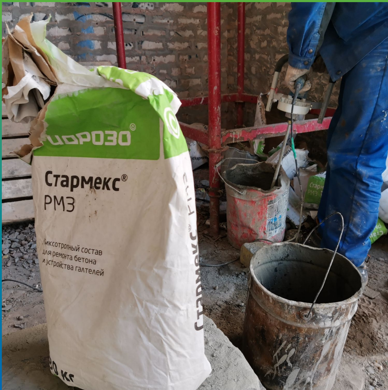
Приготовление высокопрочного состава Стармекс РМЗ для ремонта внешних швов и дефектов кладки здания