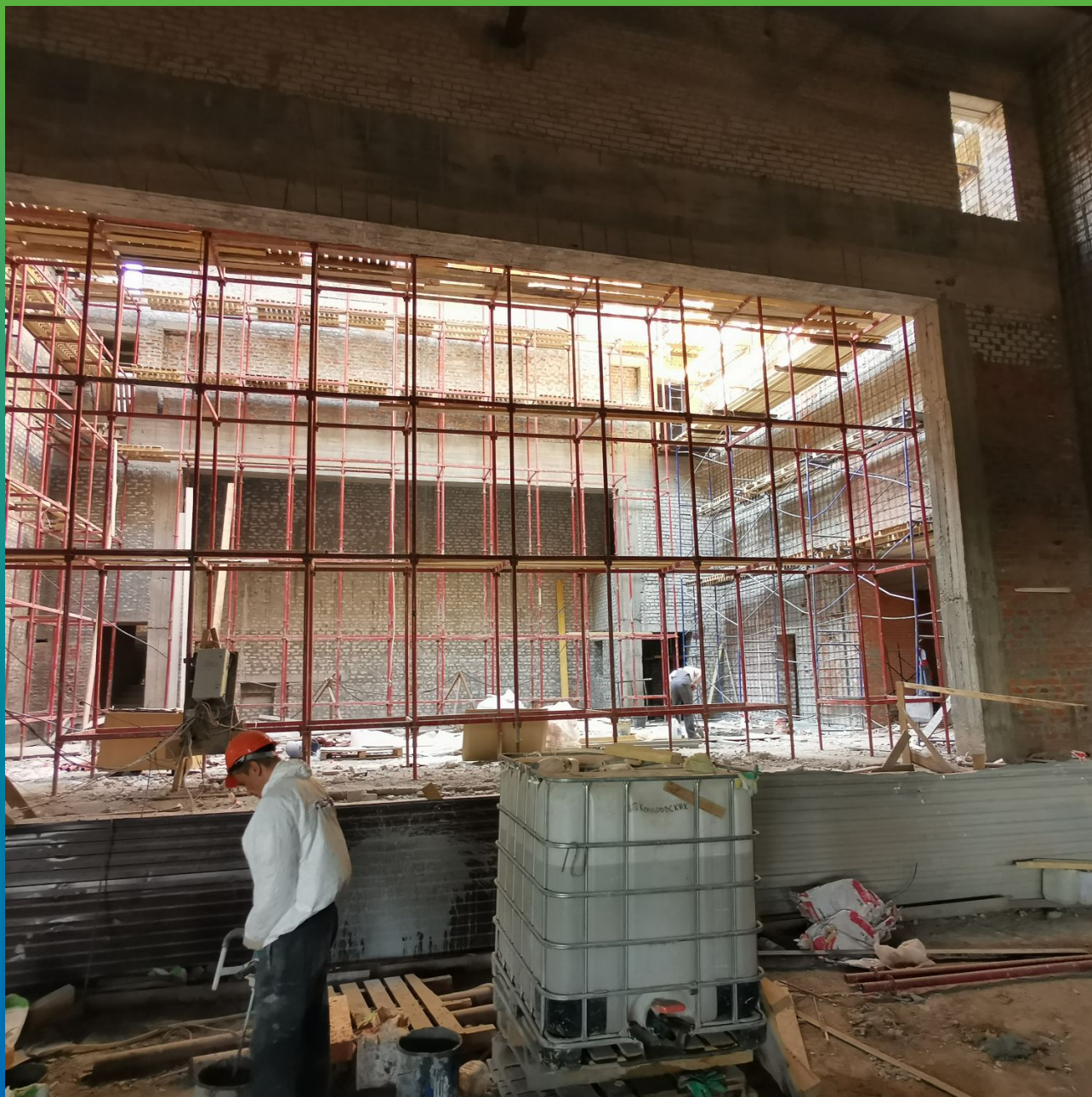
Приготовление высокопрочного состава Стармекс РМЗ для ремонта швов кирпичной кладки изнутри здания