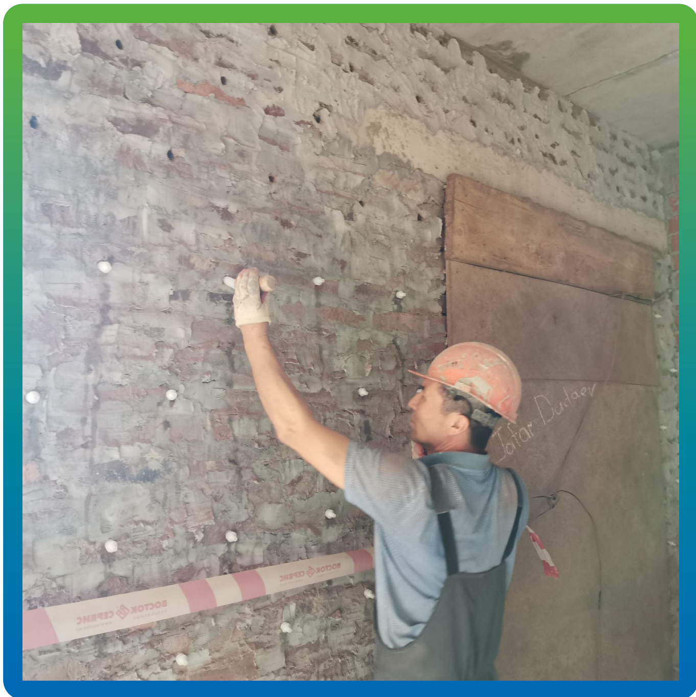
Установка пакеров в пробуренные шпуры