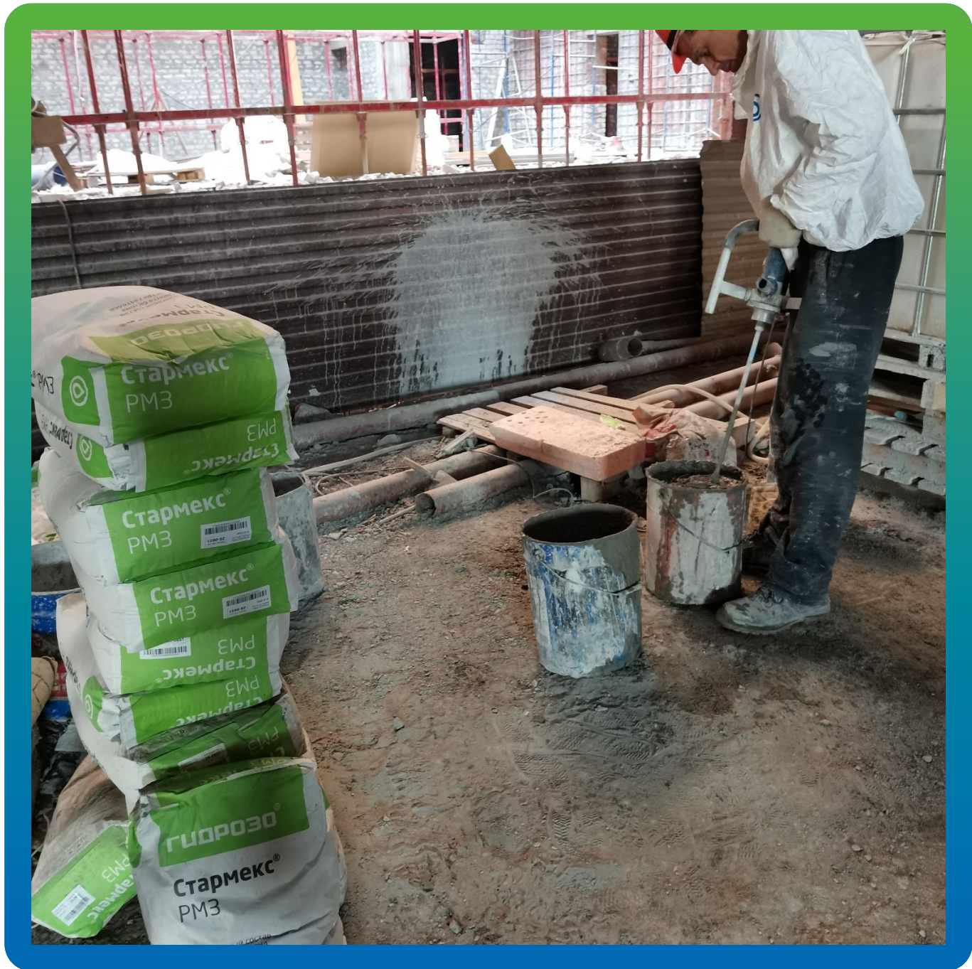
Затворение с водой ремонтного состава Стармекс РМЗ