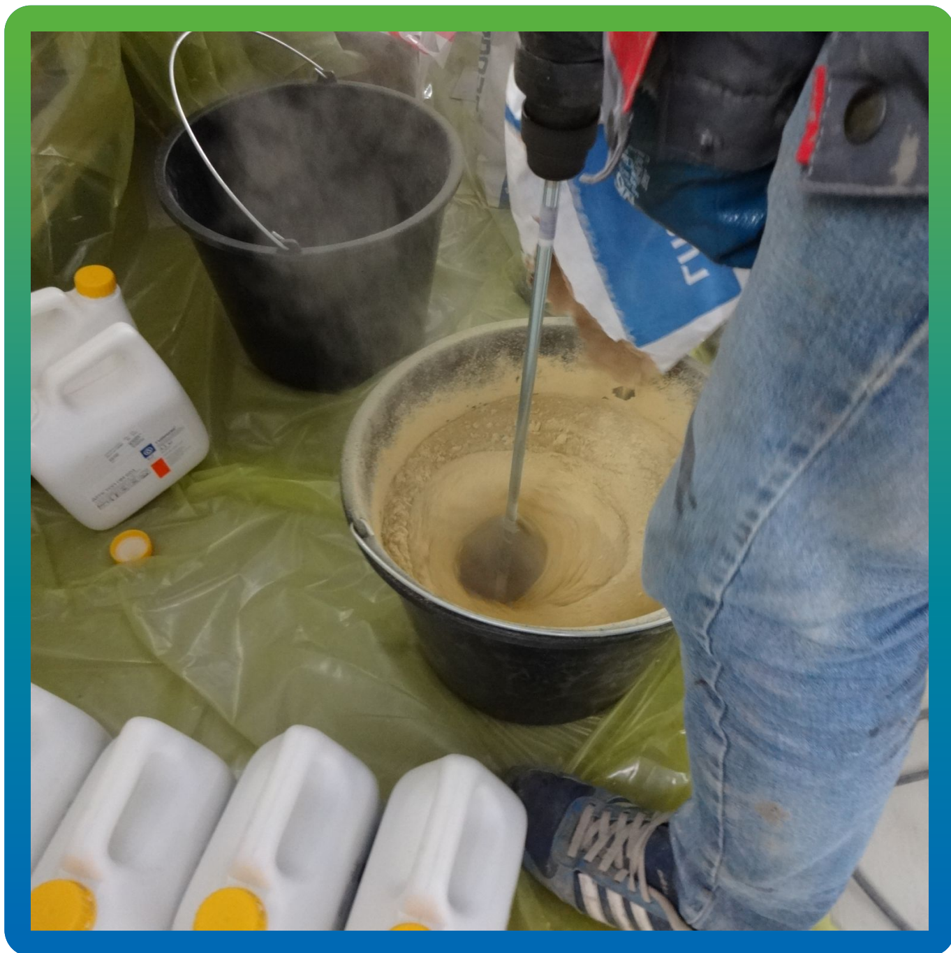
Перемешивание трех компонентов грунтовочного состава ДенсТоп ПМ 601