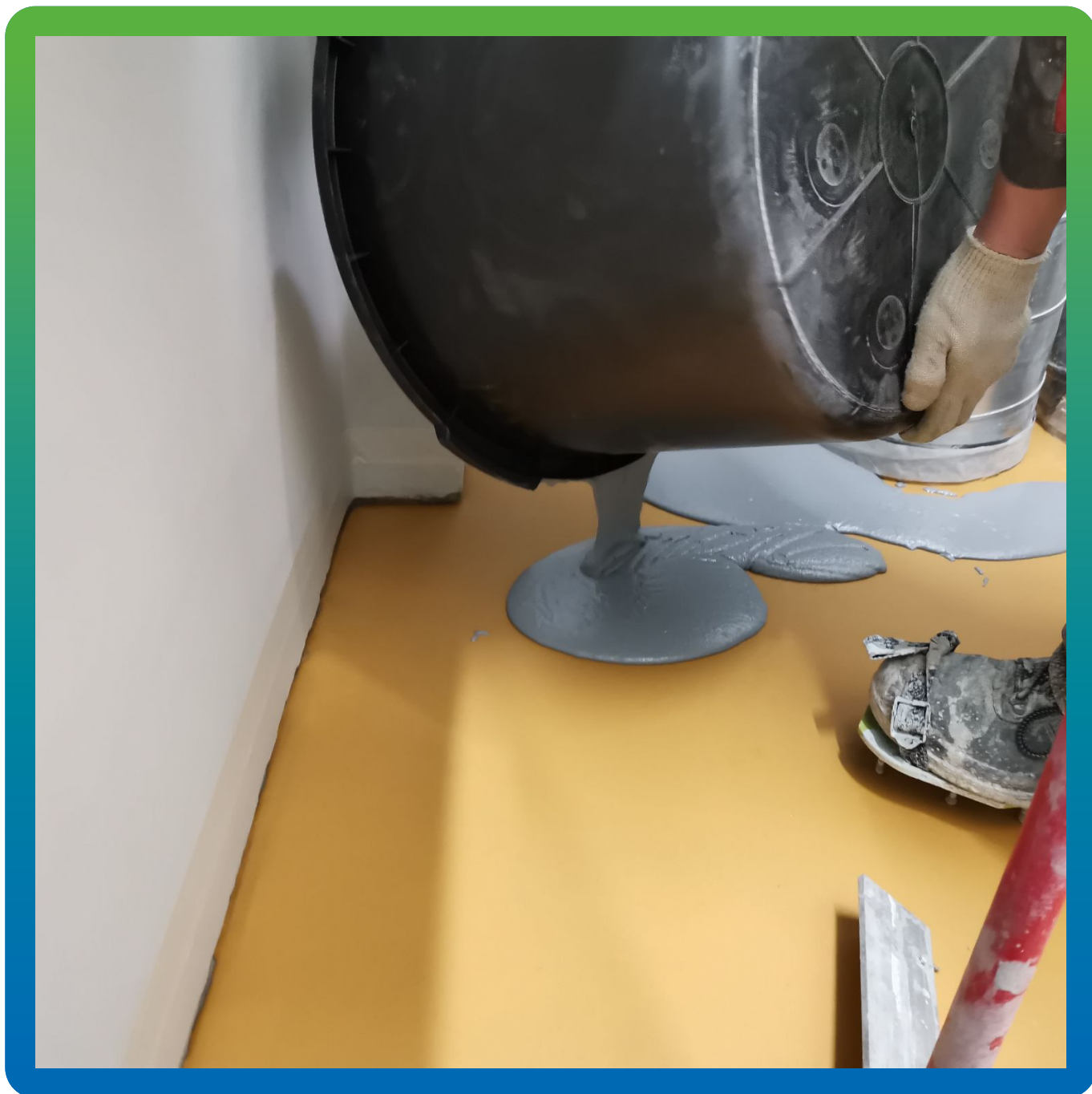
Нанесение особого химически стойкого покрытия ДенТоп ПМ 605 Флоу на загрунтованное основание