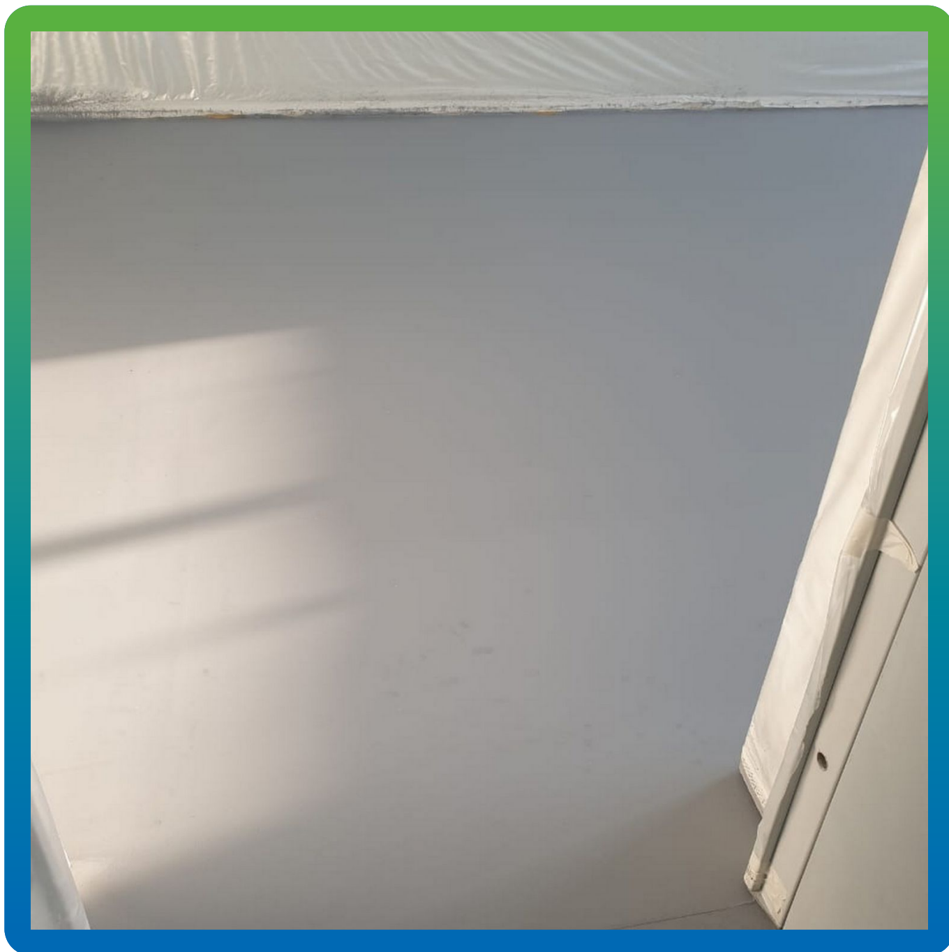
Вид покрытия после полимеризации покрытия