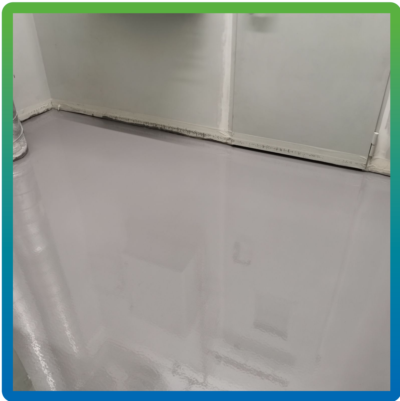
Вид покрытия после производства работ по укладке