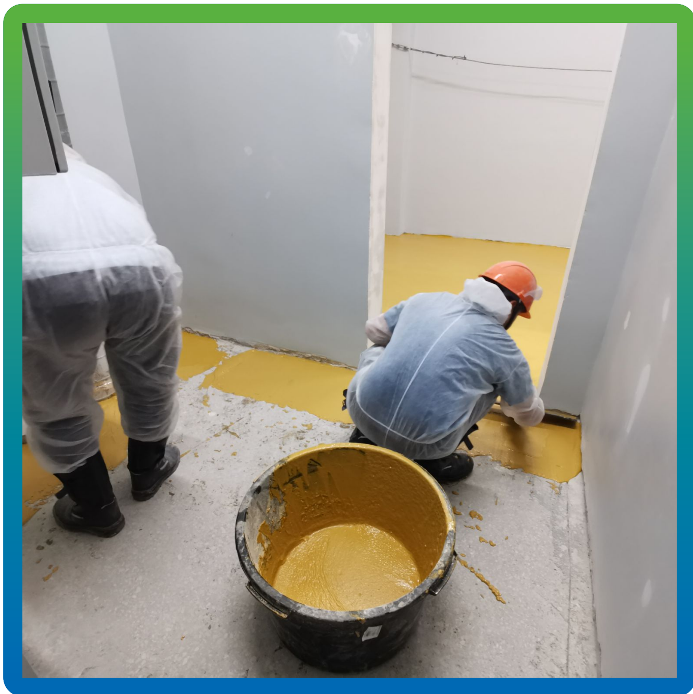
Нанесение грунтовочного состава на основание