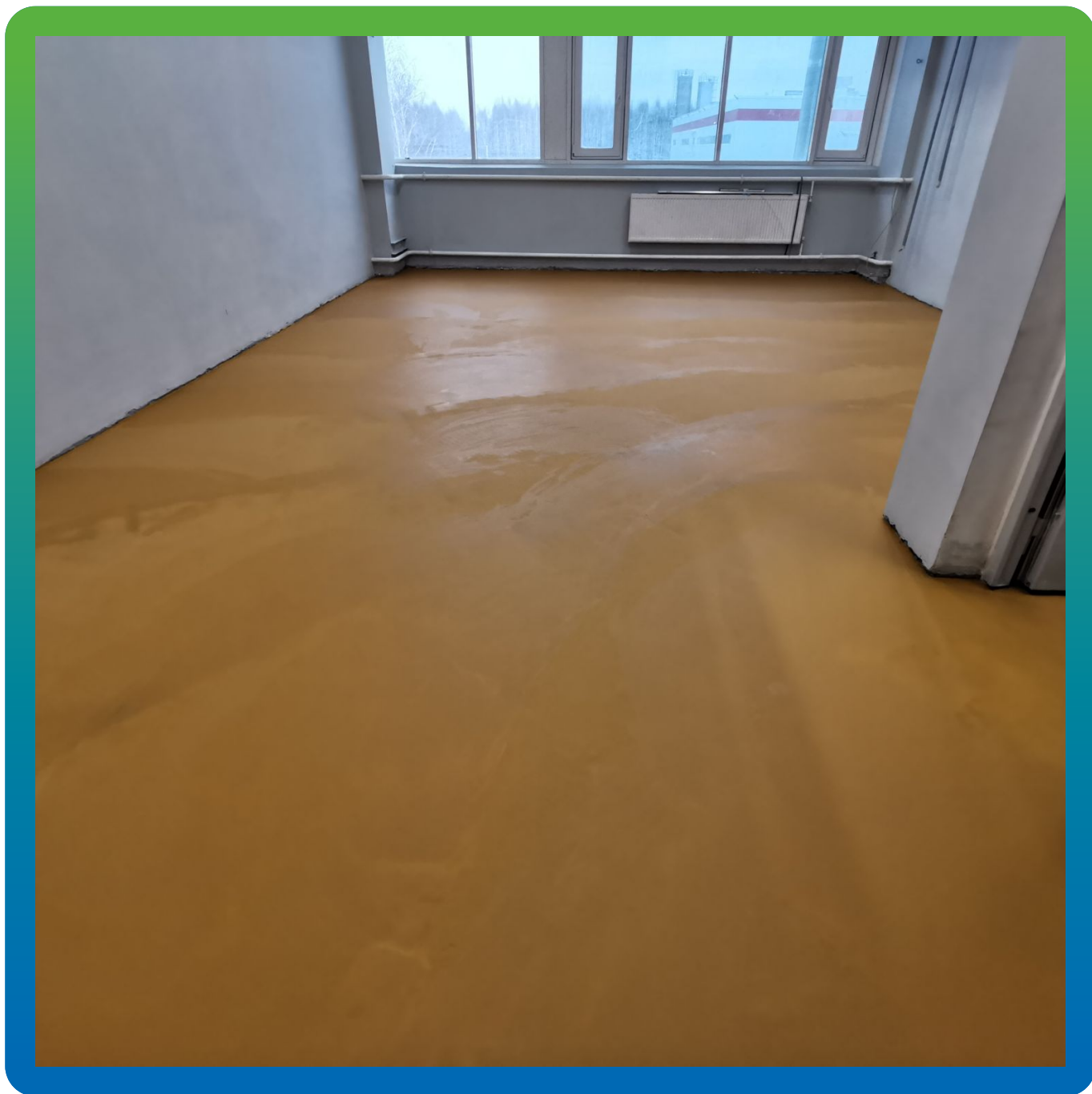
Загрунтованное основание ДенсТоп ПМ 601