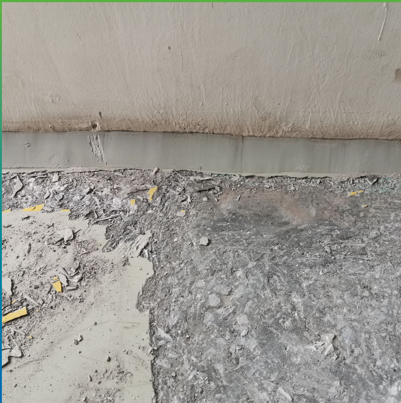
Демонтаж старого покрытия