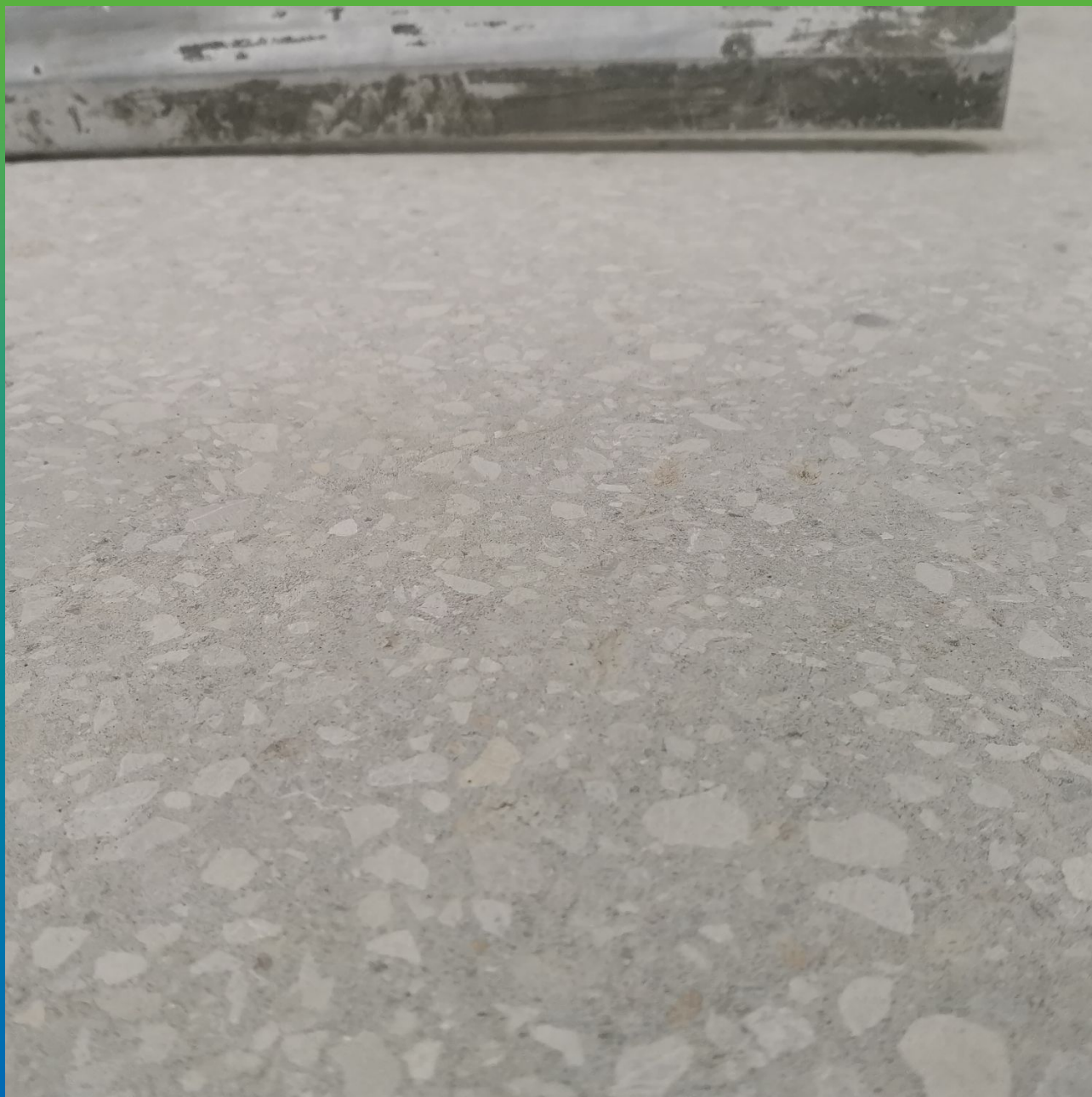
Основание готовое для нанесения цемент-полиуретановой системы ДенсТоп ПМ 605 Флоу