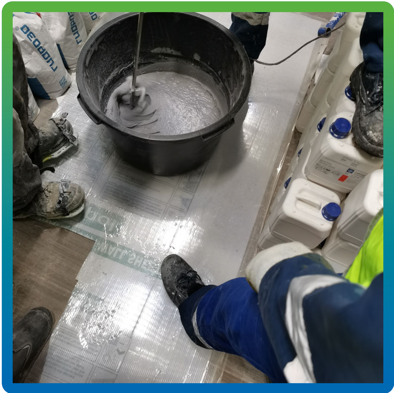
Перемешивание трех компонентов состава ДенсТоп ПМ 605 Флоу