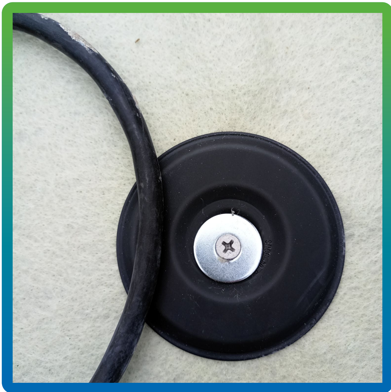
Установленные шайбы Центрикс