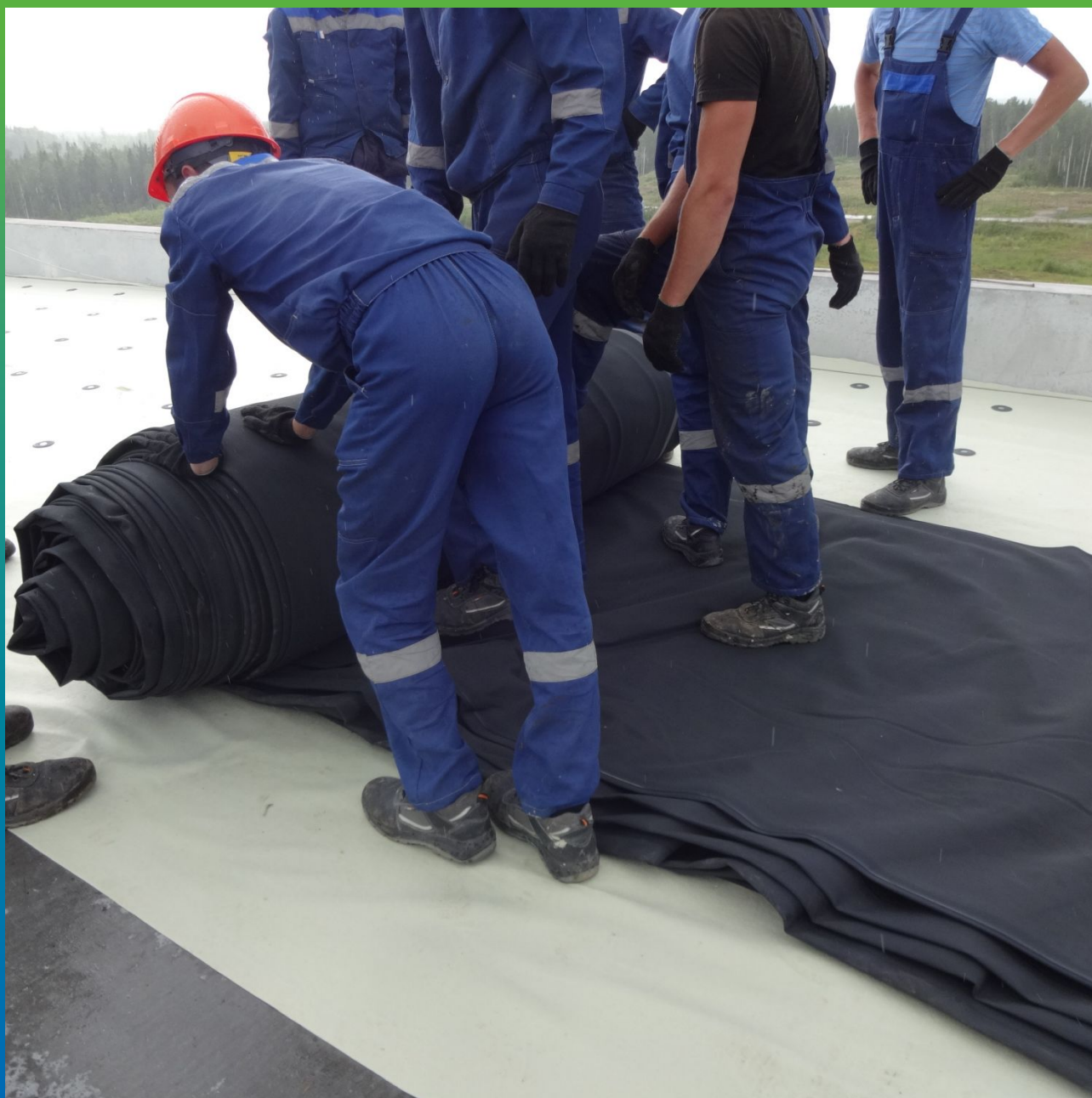
Укладка мембраны на основание