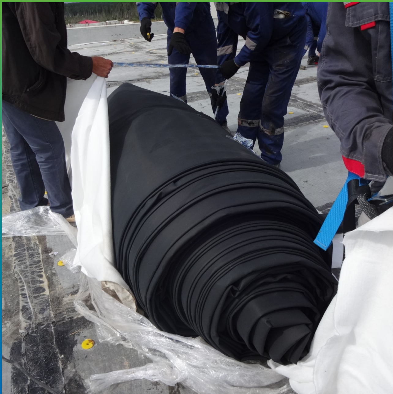
Распаковка мембраны Преласта СТ 1,2 мм. на строительной площадке