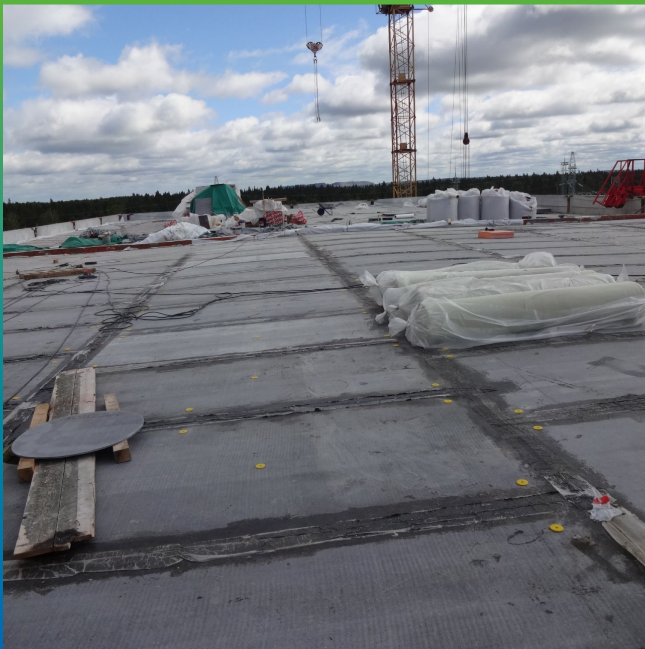
Вид кровли перед монтажом утеплителя