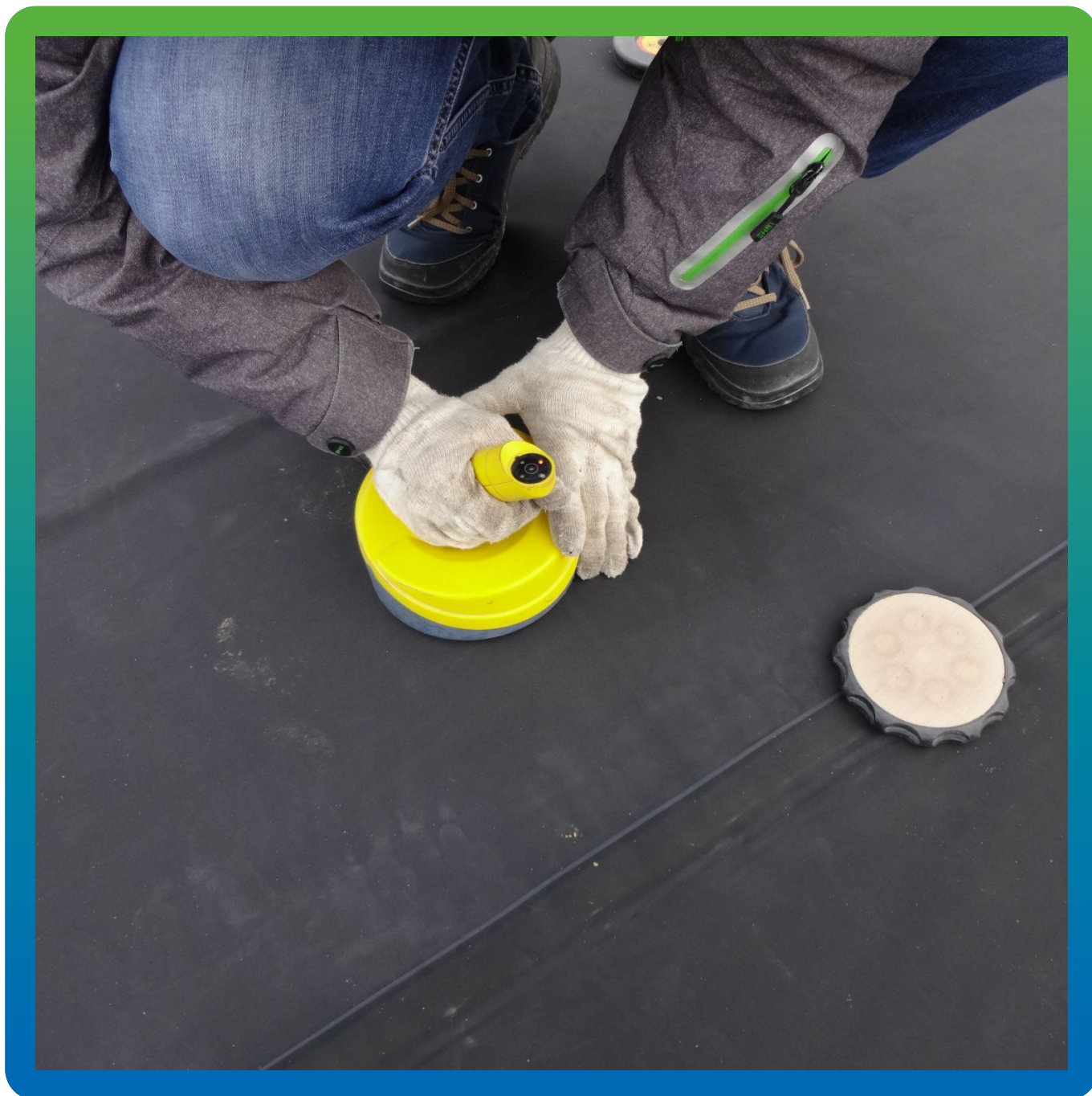
Процесс приварки мембраны Преласты СТ 1,2 мм к шайбам Центрикс с помощью индукционного аппарата