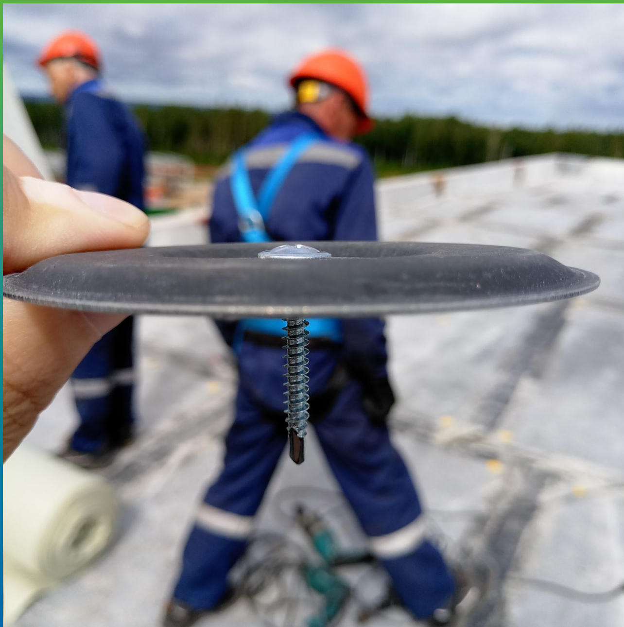
Шайба Центрикс с крепежом для фиксации мембраны к основанию, без прокола мембраны