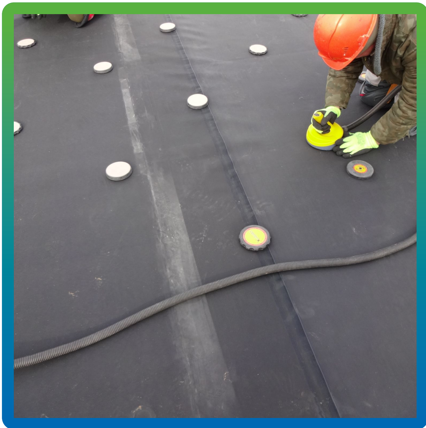
Установка специальных магнитов для фиксации мембраны и шайбы, а также охлаждения сваренного участка