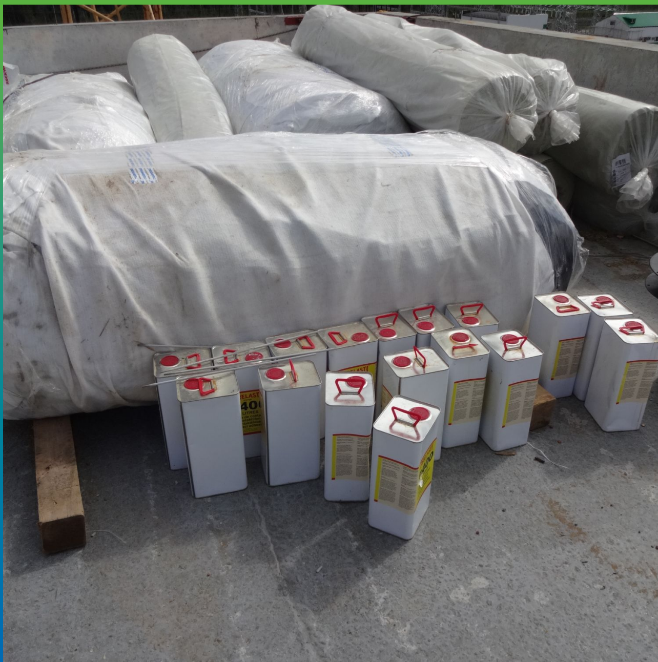
Мембрана Преласты СТ 1,2 мм. сваренная и упакованная специальным образом