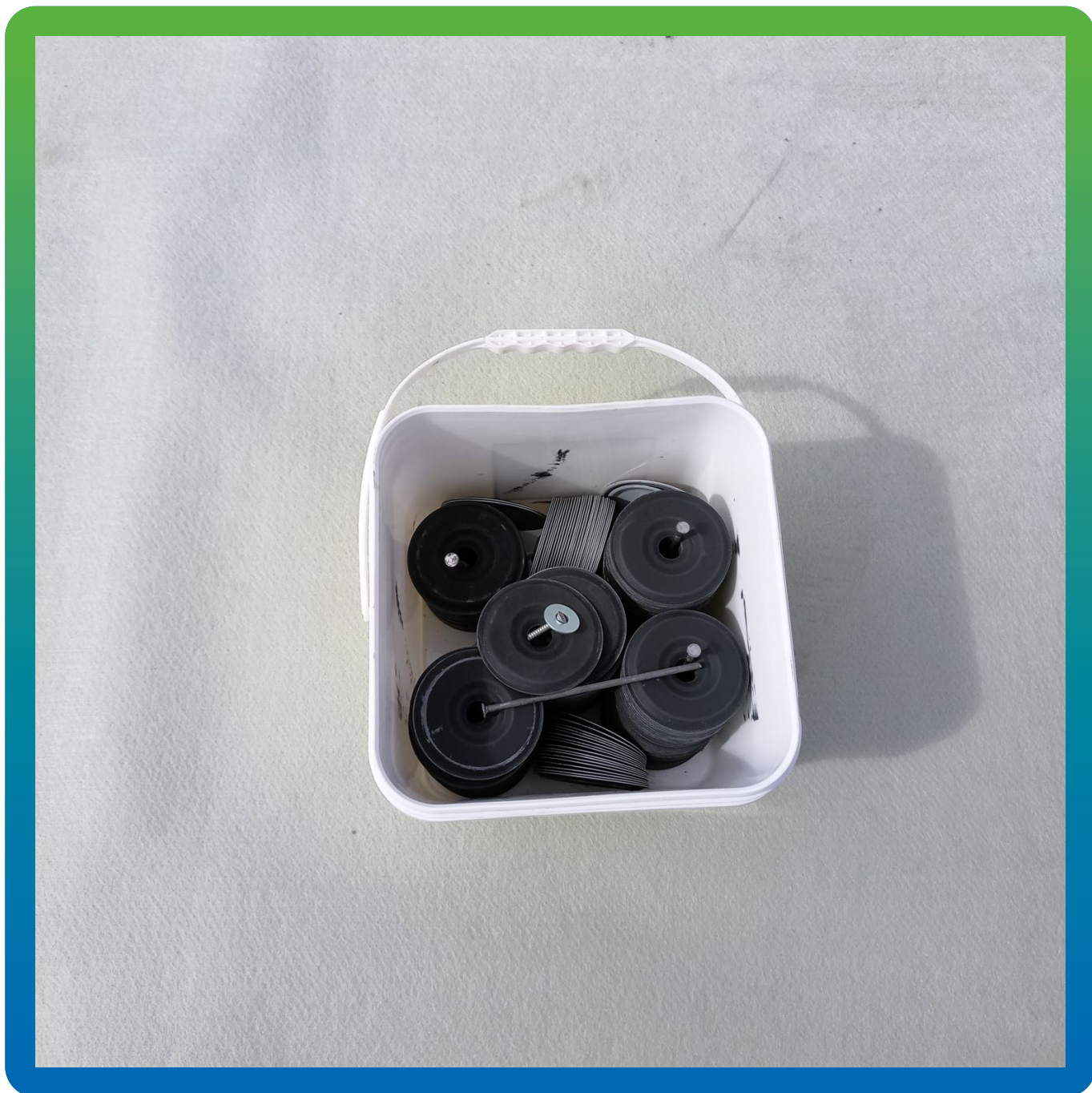
Шайба Центрикс в заводской упаковке