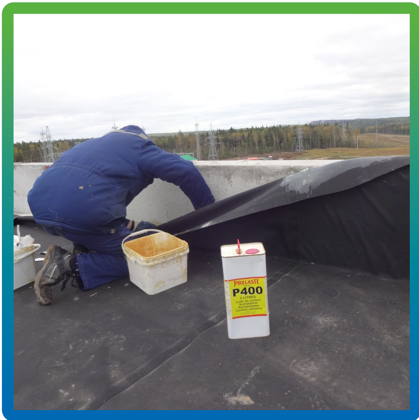
Процесс приклеивания мембраны к парапетам кровли на клей П-400