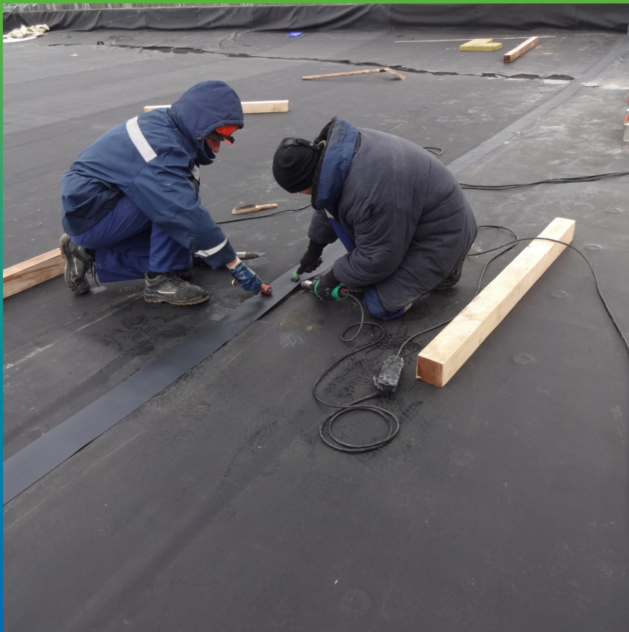
Сварка строительным феном на объекте двух полотен мембраны м/у собой с помощью ленты Термобонд