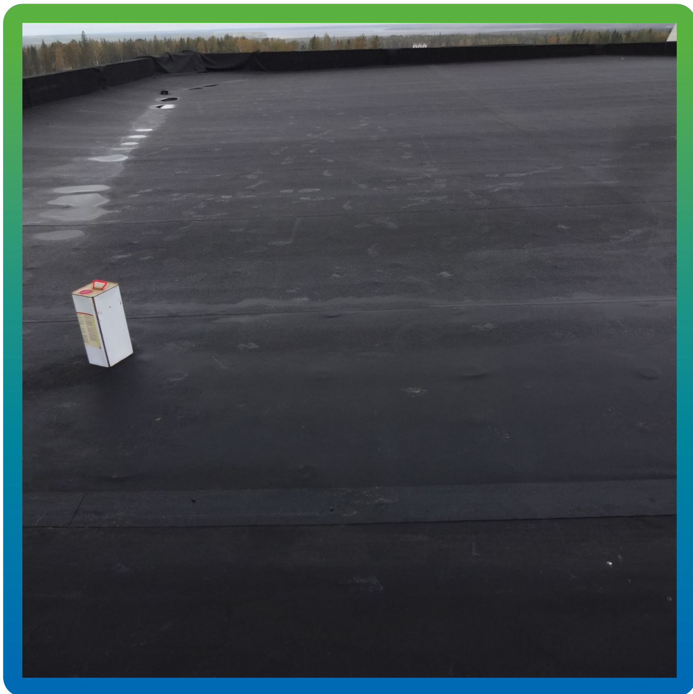
Вид кровли после производства работ