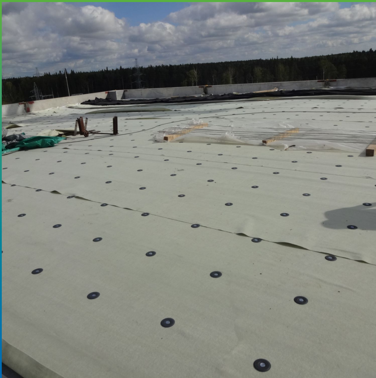
Монтаж шайб Центрикс с расходом 5 шт./1 м 2