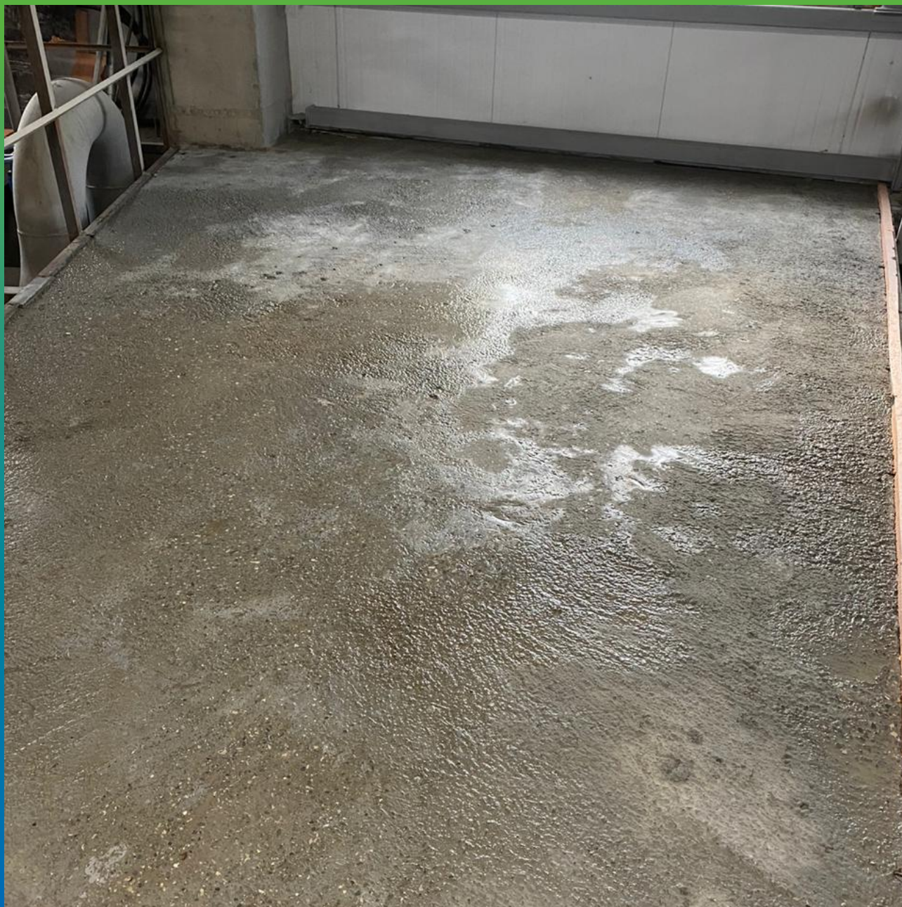
Подготовленное увлажненное основание