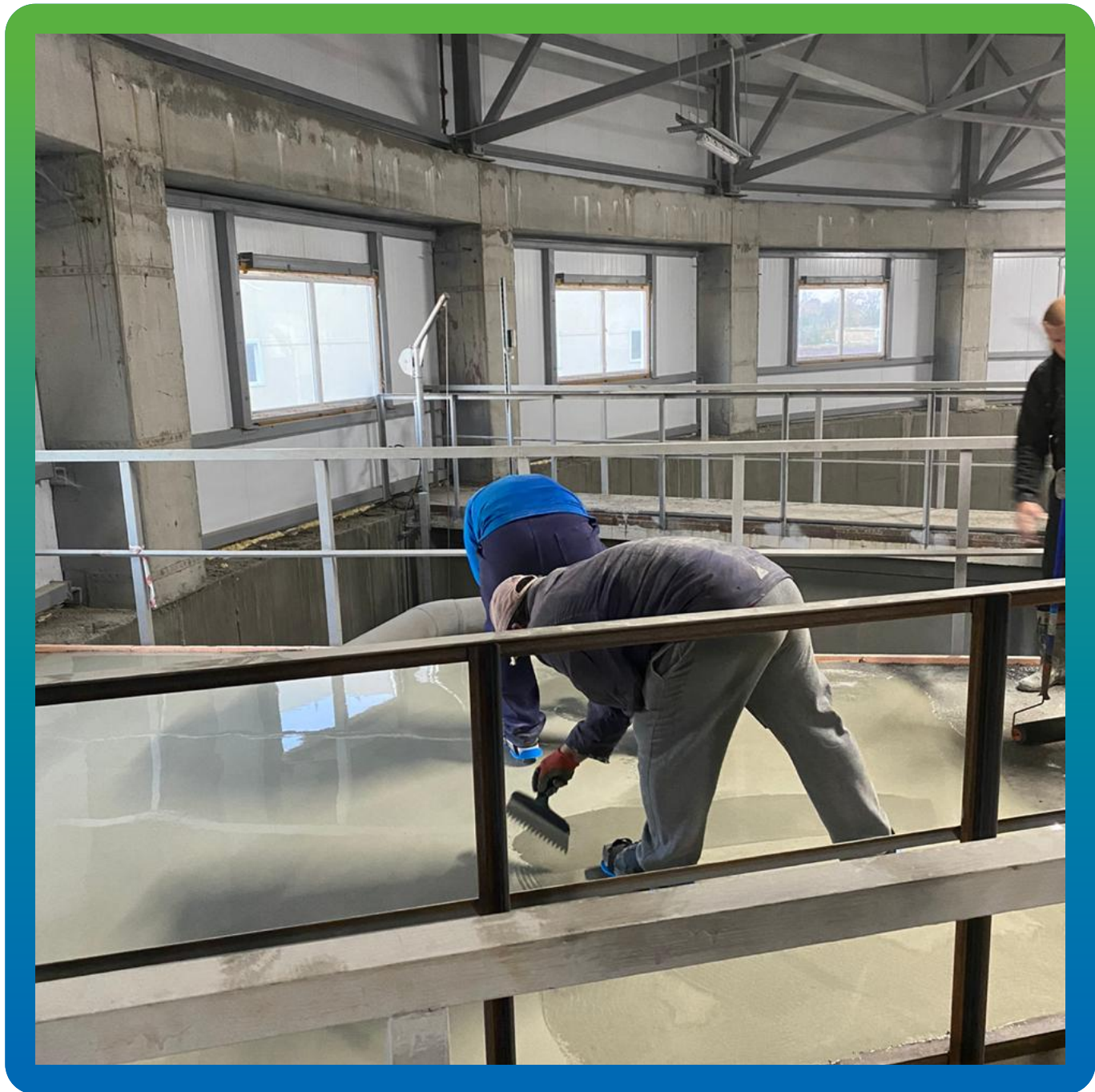
Распределение состава по площади