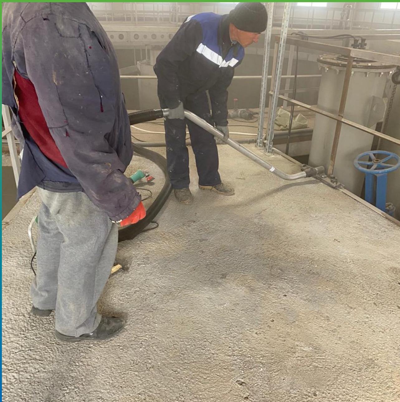
Обеспыливание поверхности перед проведением работ