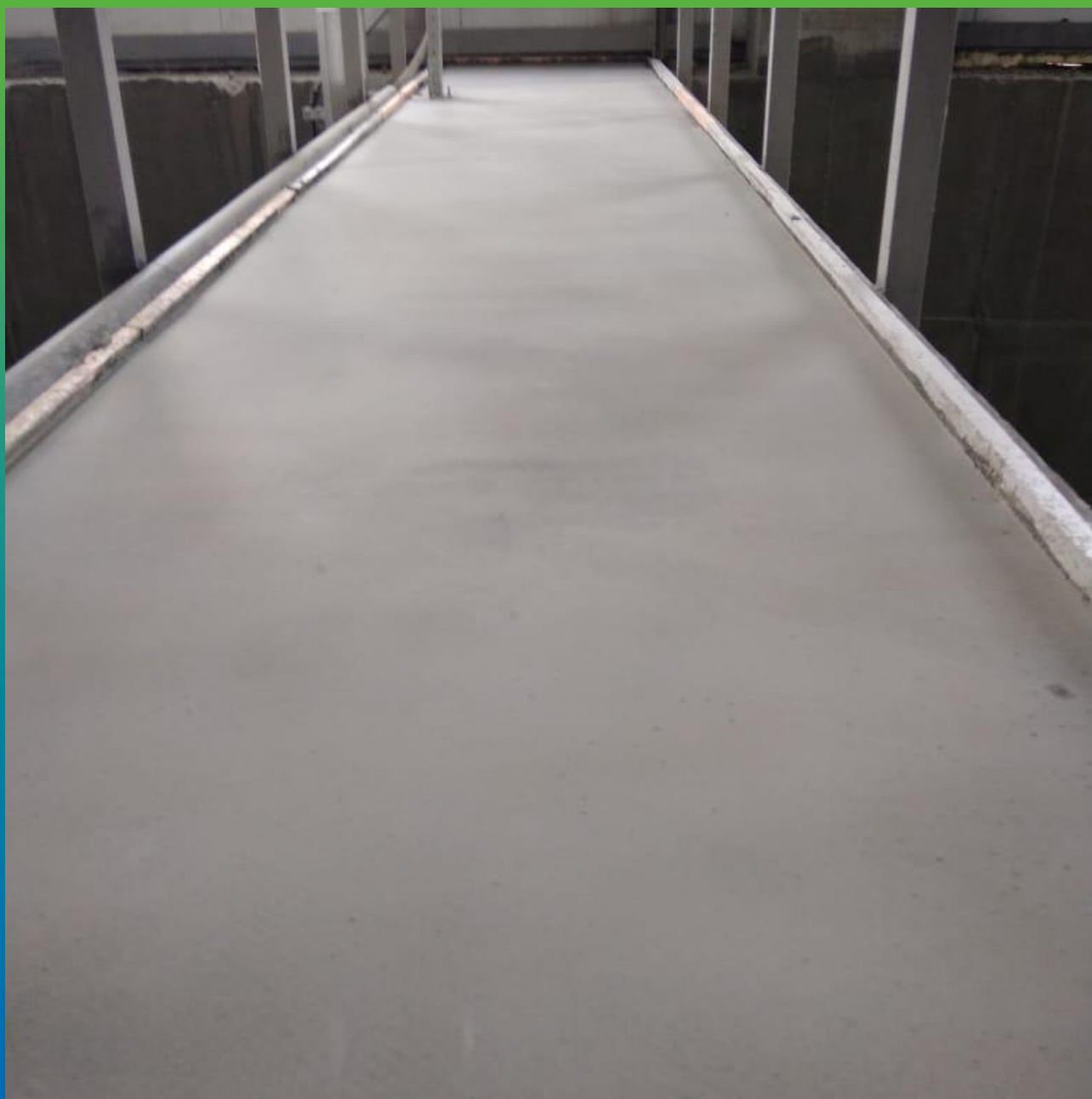
Финальный вид покрытия после полимеризации