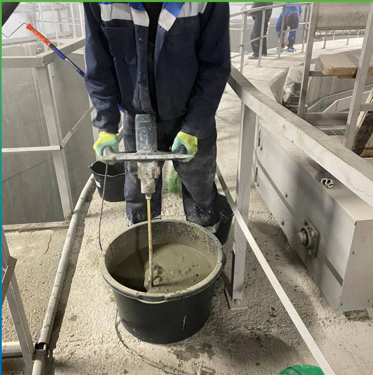
Замешивание состава Стармекс Флоу