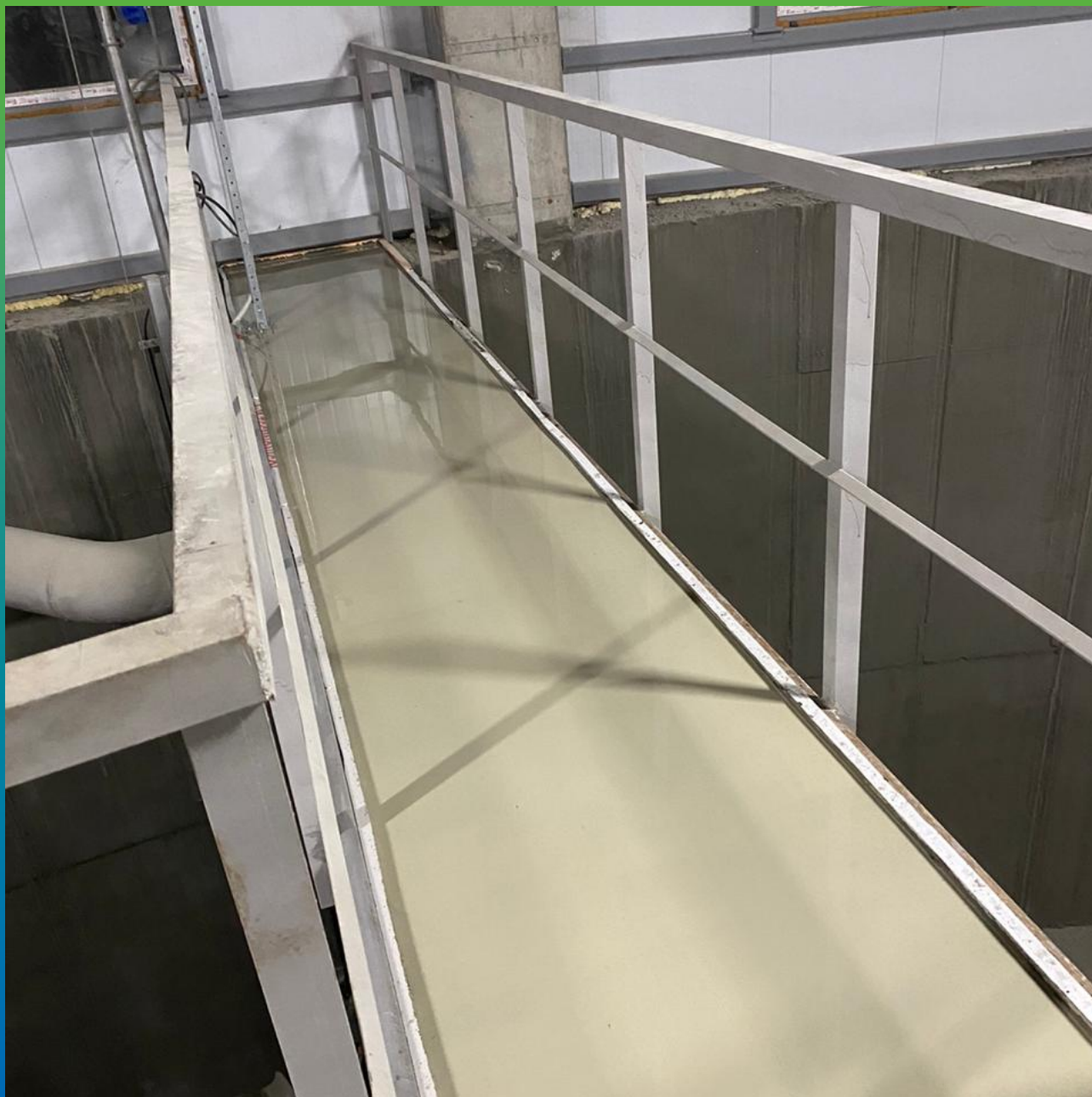
Финальный вид покрытия