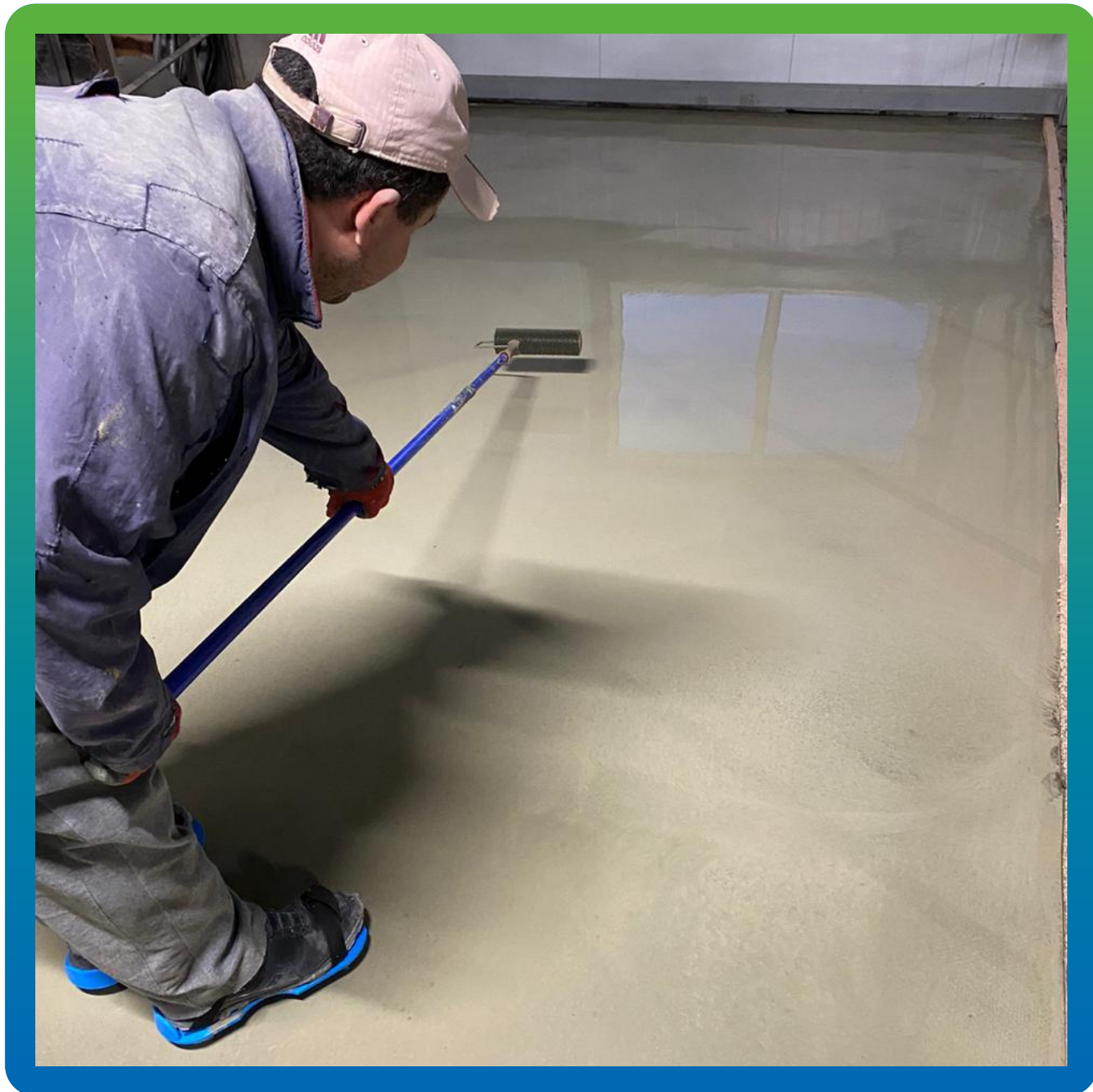
Удаление воздуха с помощью игольчатого валика