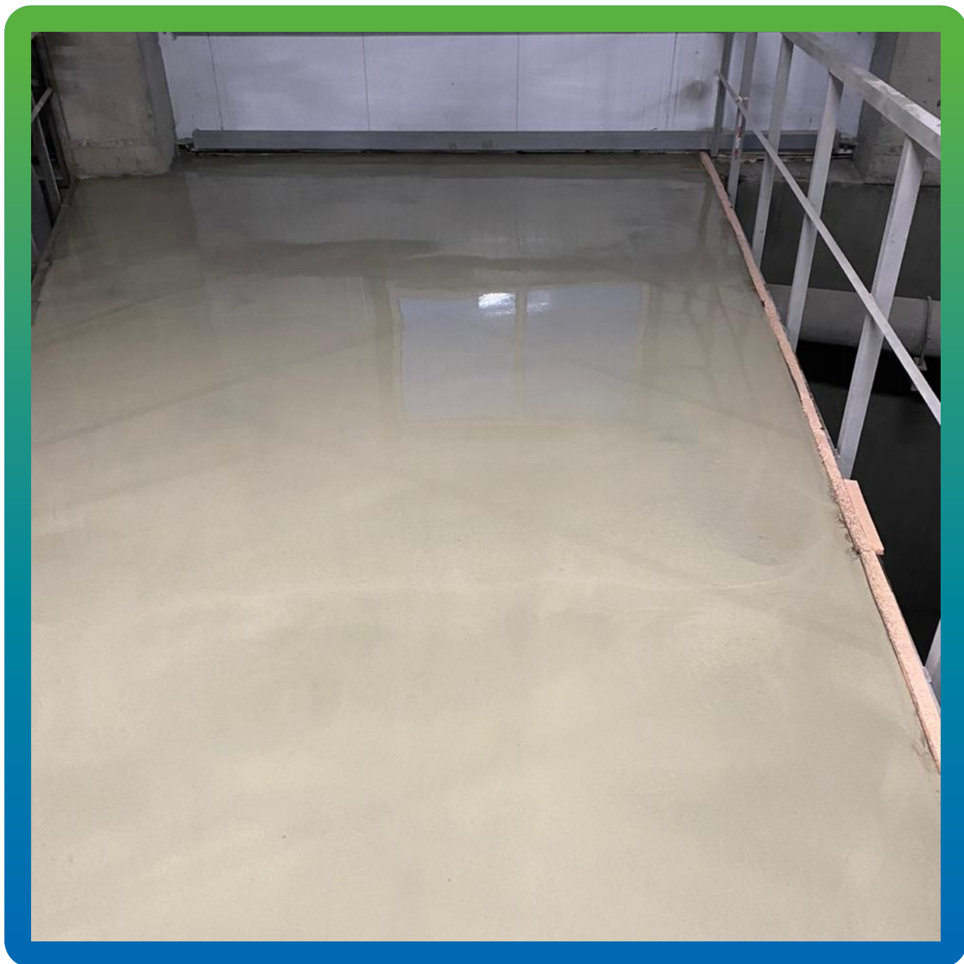
Финишный вид покрытия до полимеризации