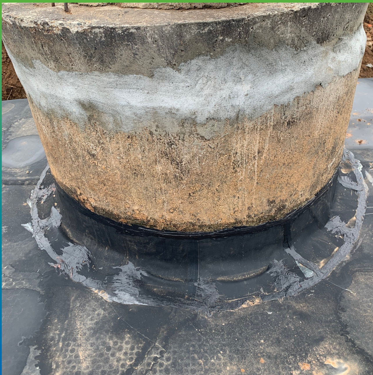
Герметизация примыкания к колодцу