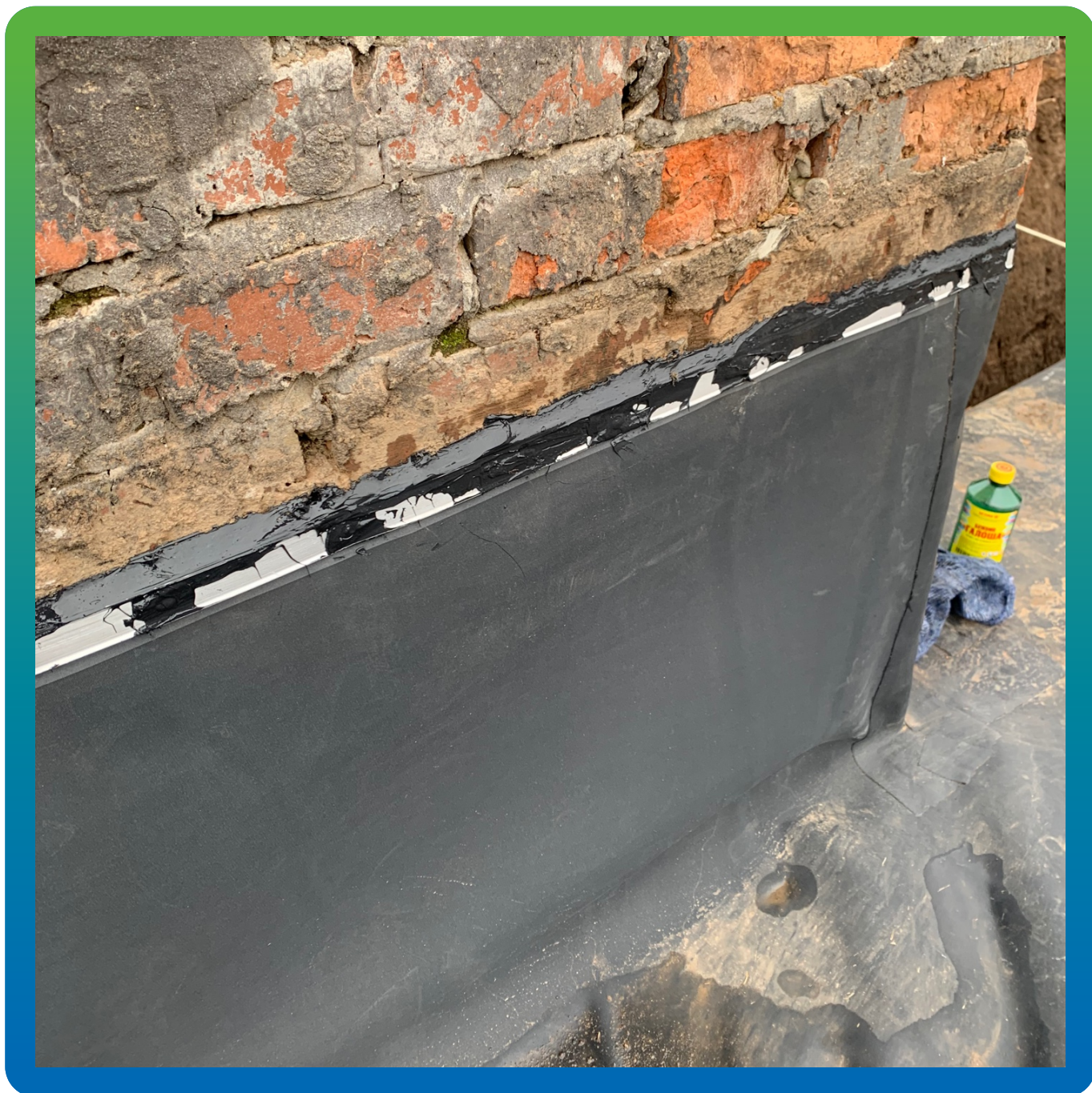
Герметизация примыкания к стене