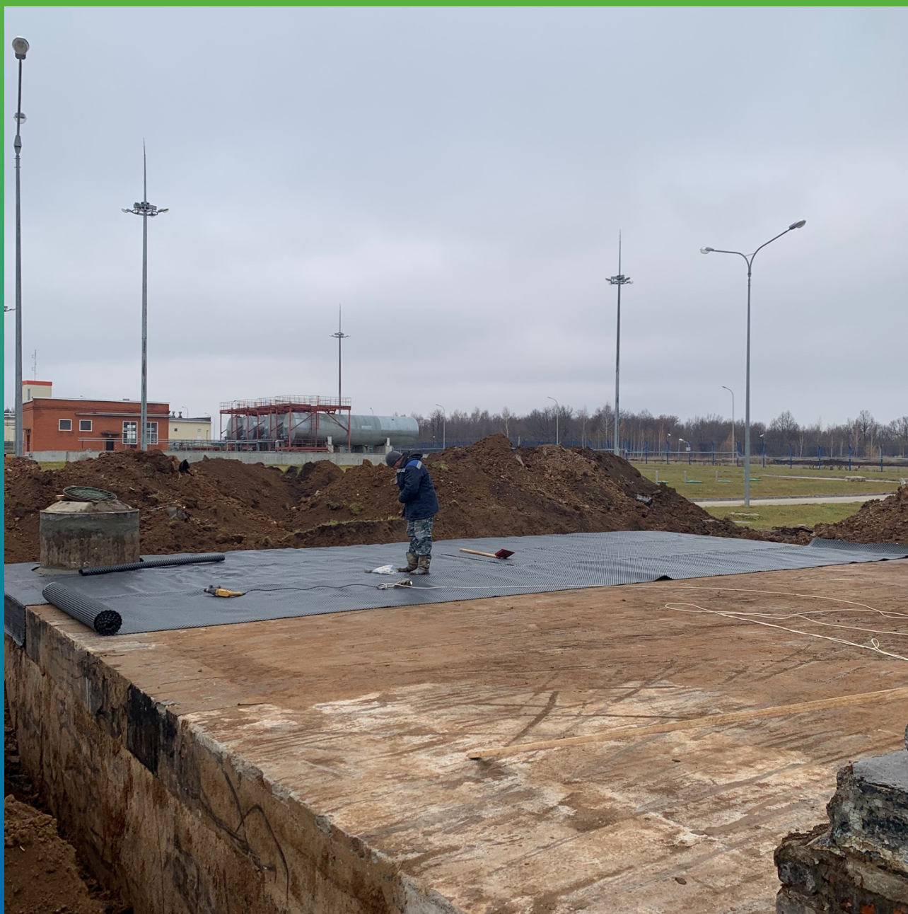
Подготовка основания перед укладкой мембраны