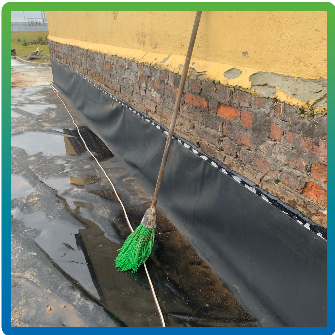
Герметизация примыкания к стене.