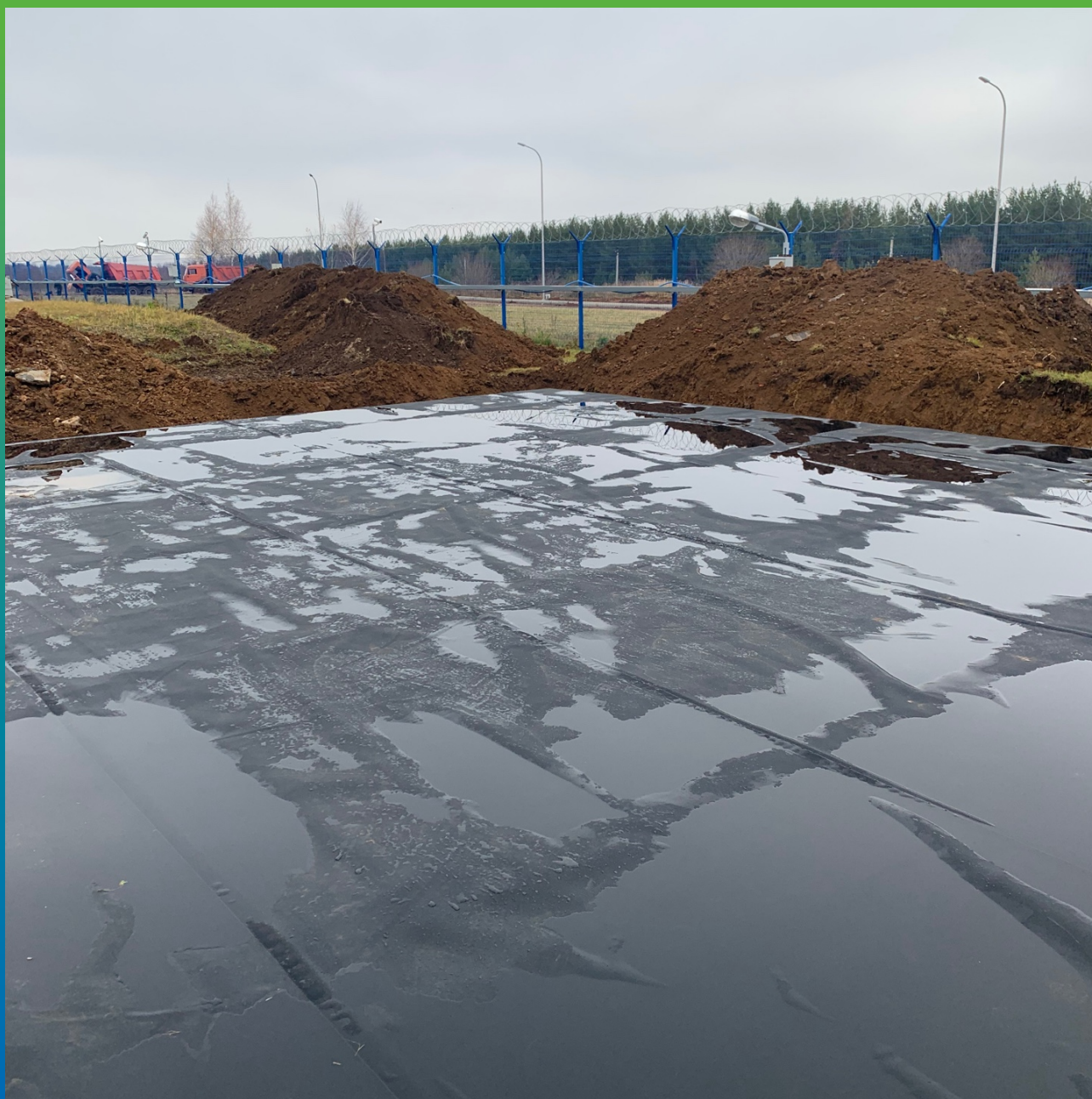
Уложенная ЭПДМ мембрана