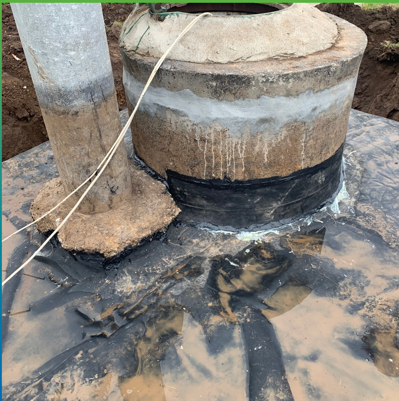
Герметизация примыкания к колодцу