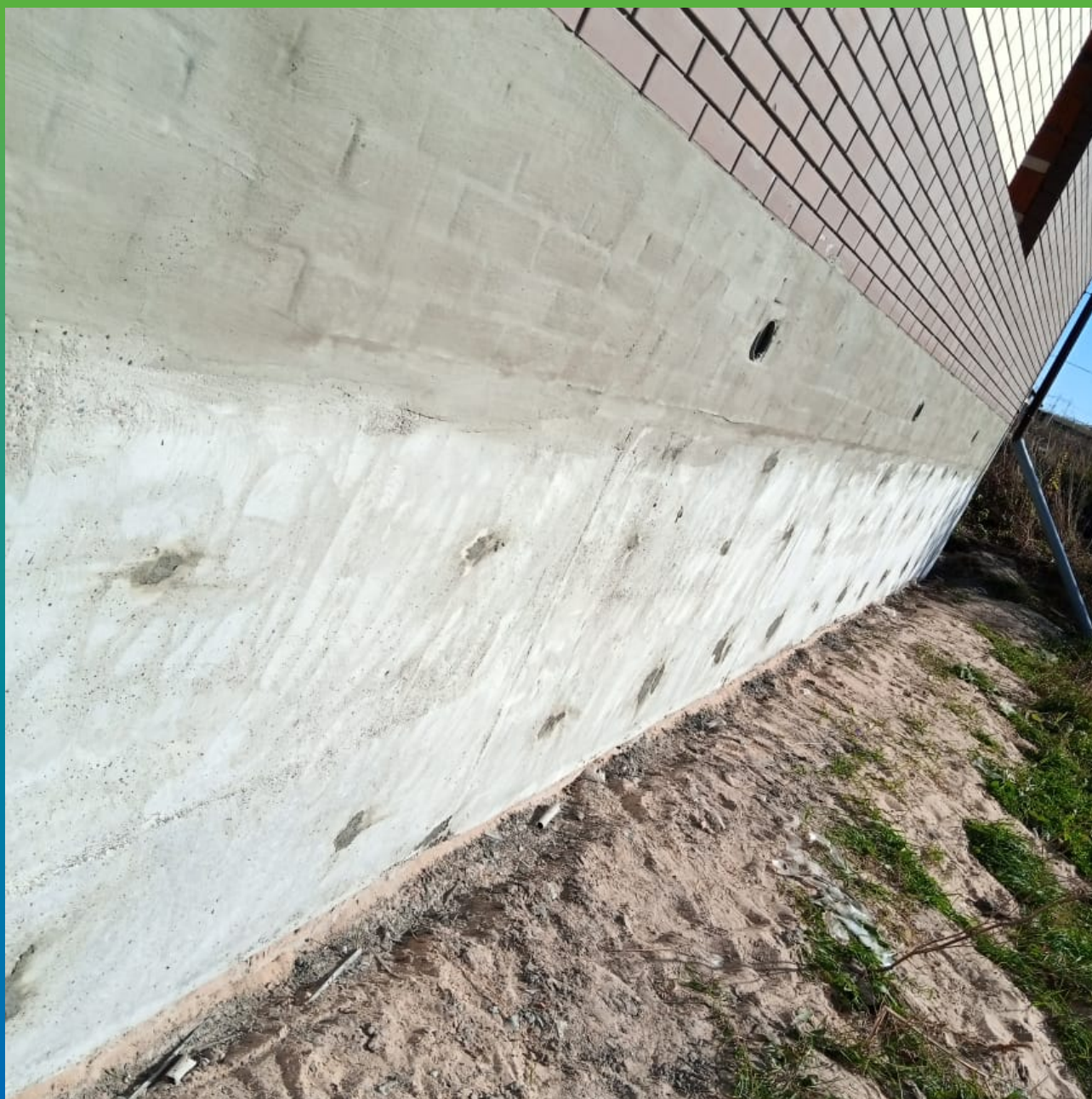
Основание, подготовленное к нанесению состава Стармекс Эласт