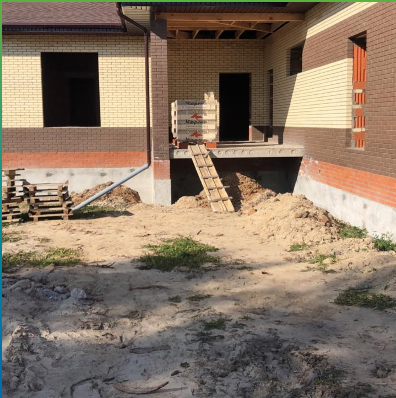
Зачеканка опалубочных отверстий