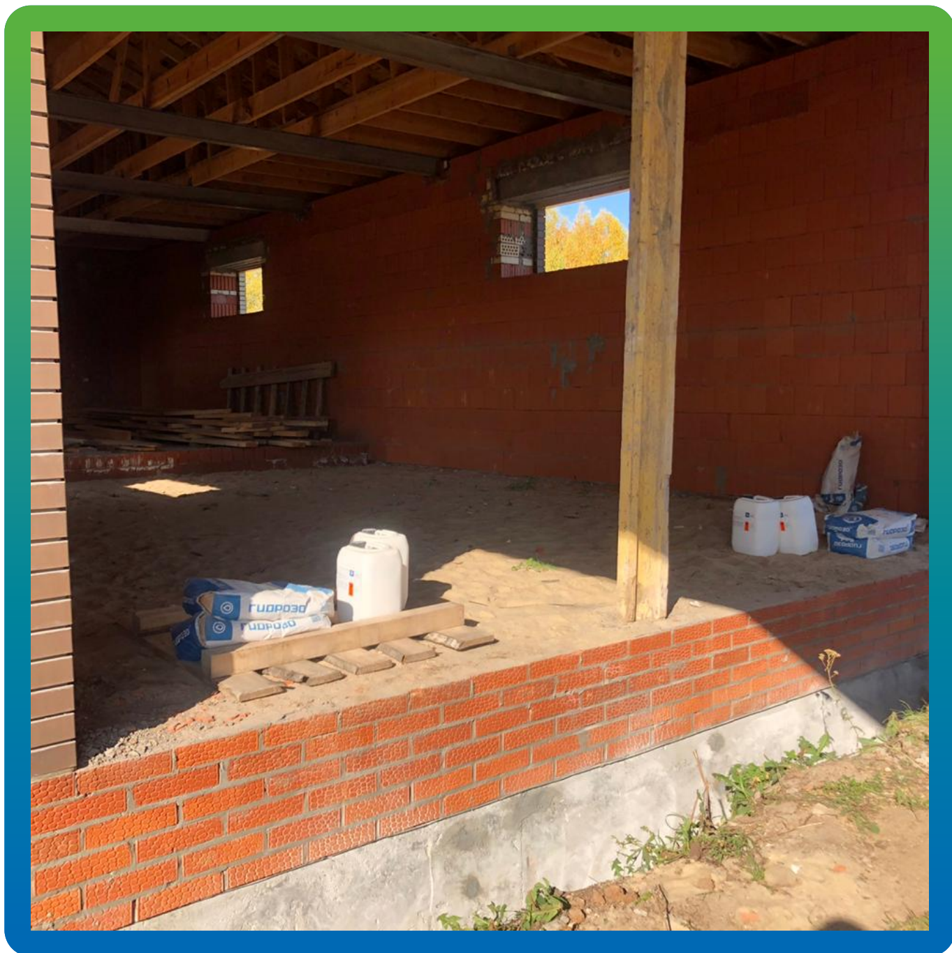
Гидроизоляция цоколя жилого дома