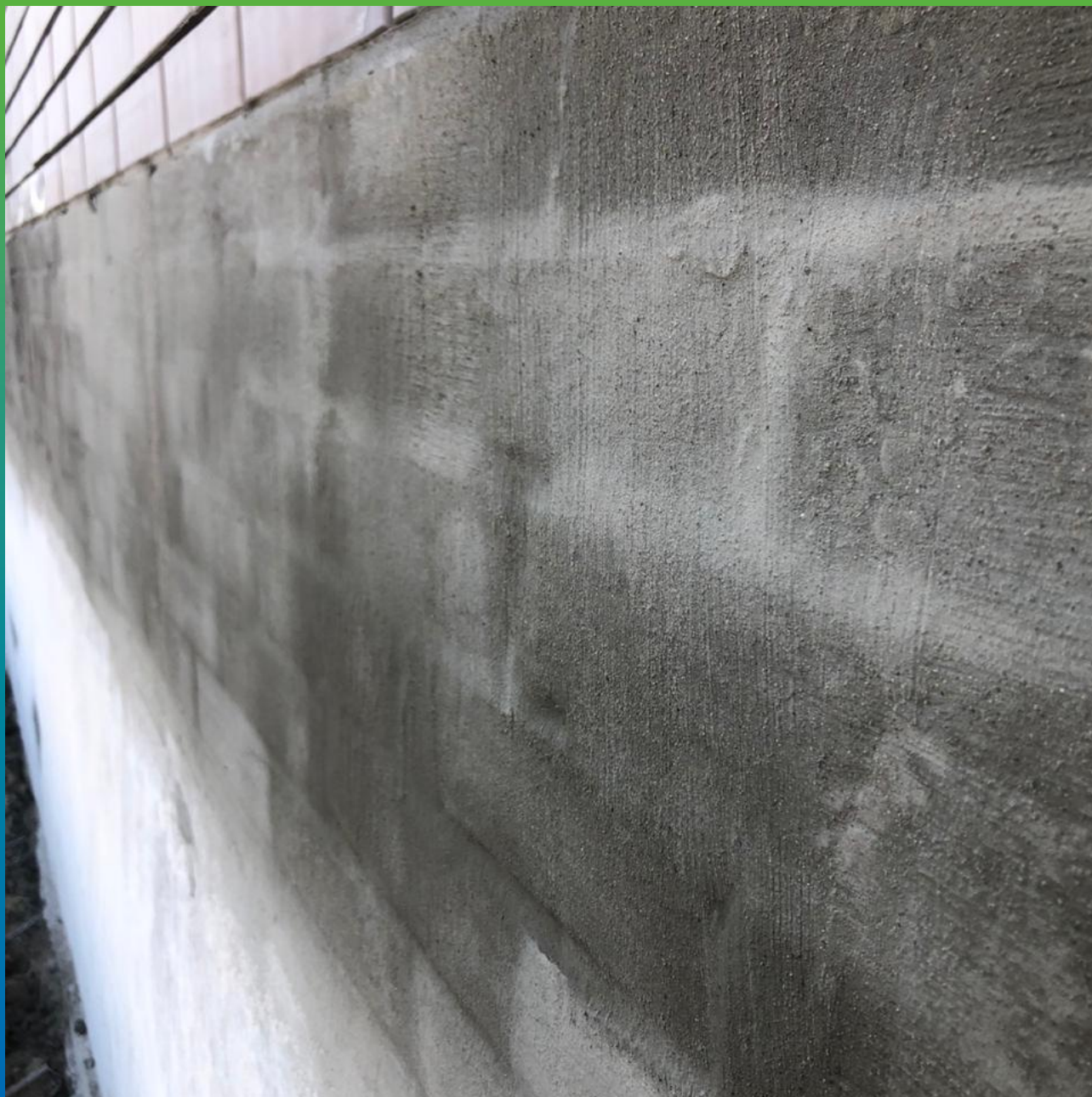
Основание, подготовленное к нанесению состава Стармекс Эласт