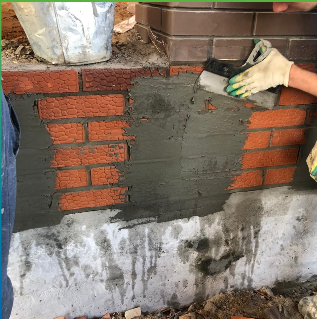
Оштукатуривание кирпичной кладки перед нанесением гидроизоляционного состава Стармекс Эласт