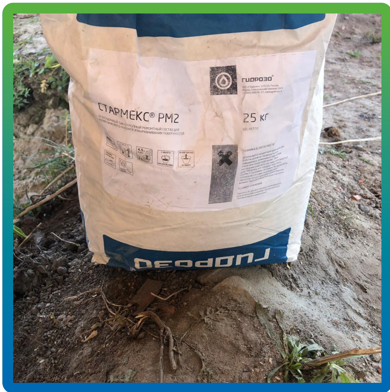
Стармекс PM2 - ремонтный состав для оштукатуривания кирпичной кладки