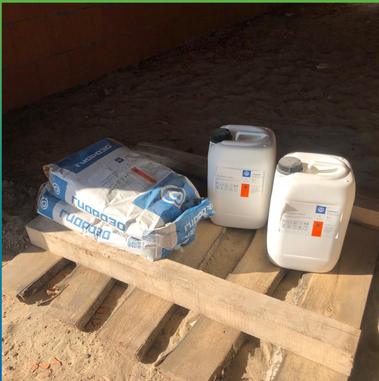
Обмазочный эластичный гидроизоляционный состав Стармекс Эласт