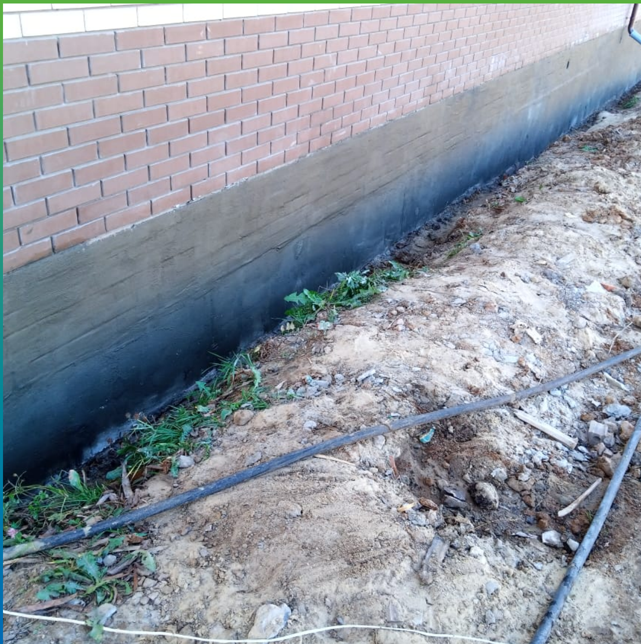
Гидроизолированный цоколь здания