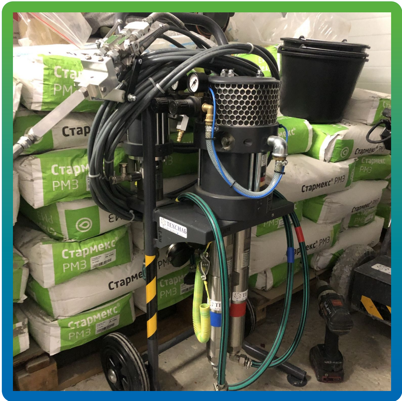
БМ 1425 на объекте