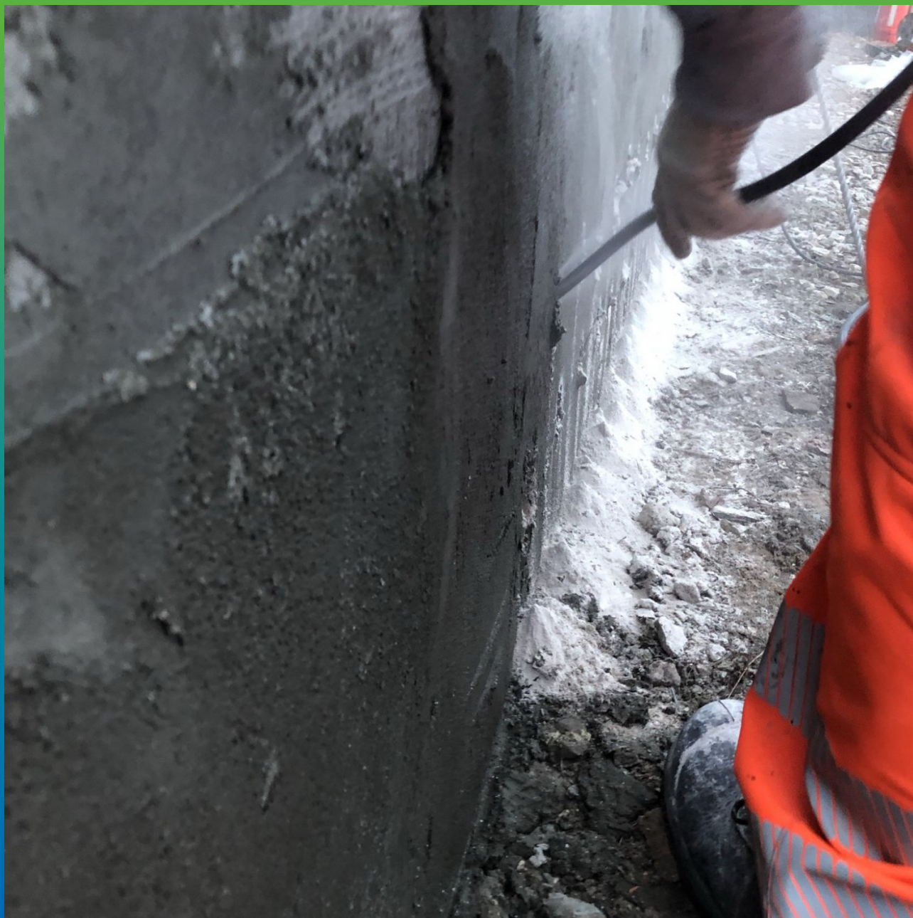
Очистка с использованием сжатого воздуха