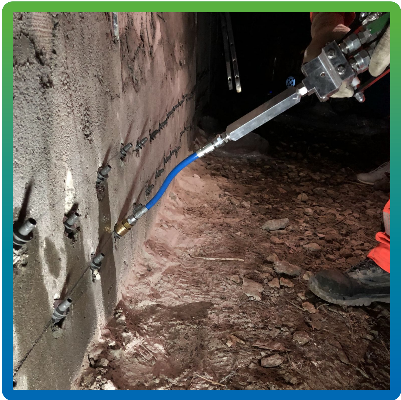
Устройство отсечной гидроизоляции при помощи Манокрил Гель Р