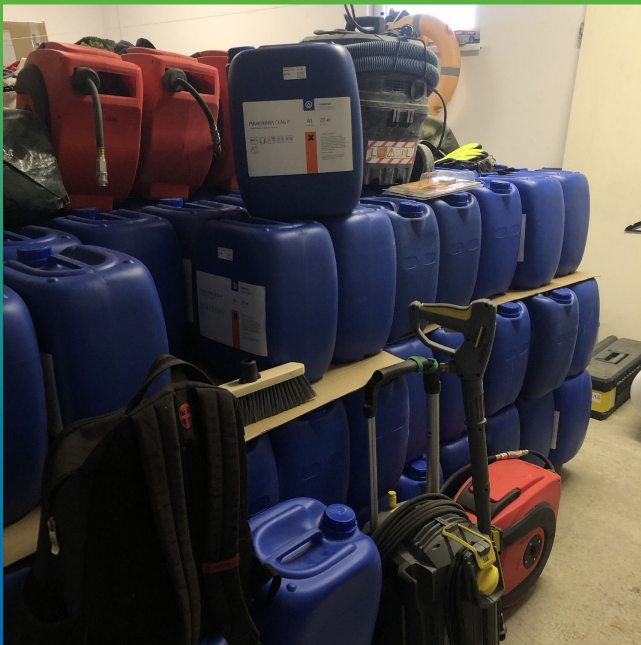
Манокрил Гель Р на объекте