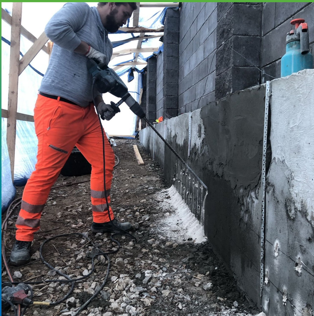
Бурение сети шпуров