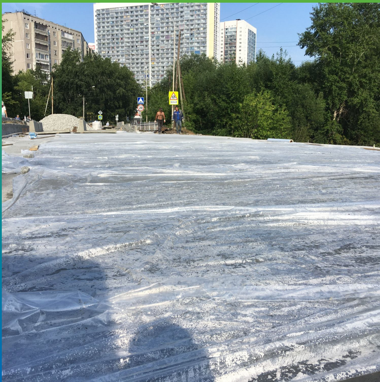
Вид укрытого состава Стармекс ФМ7