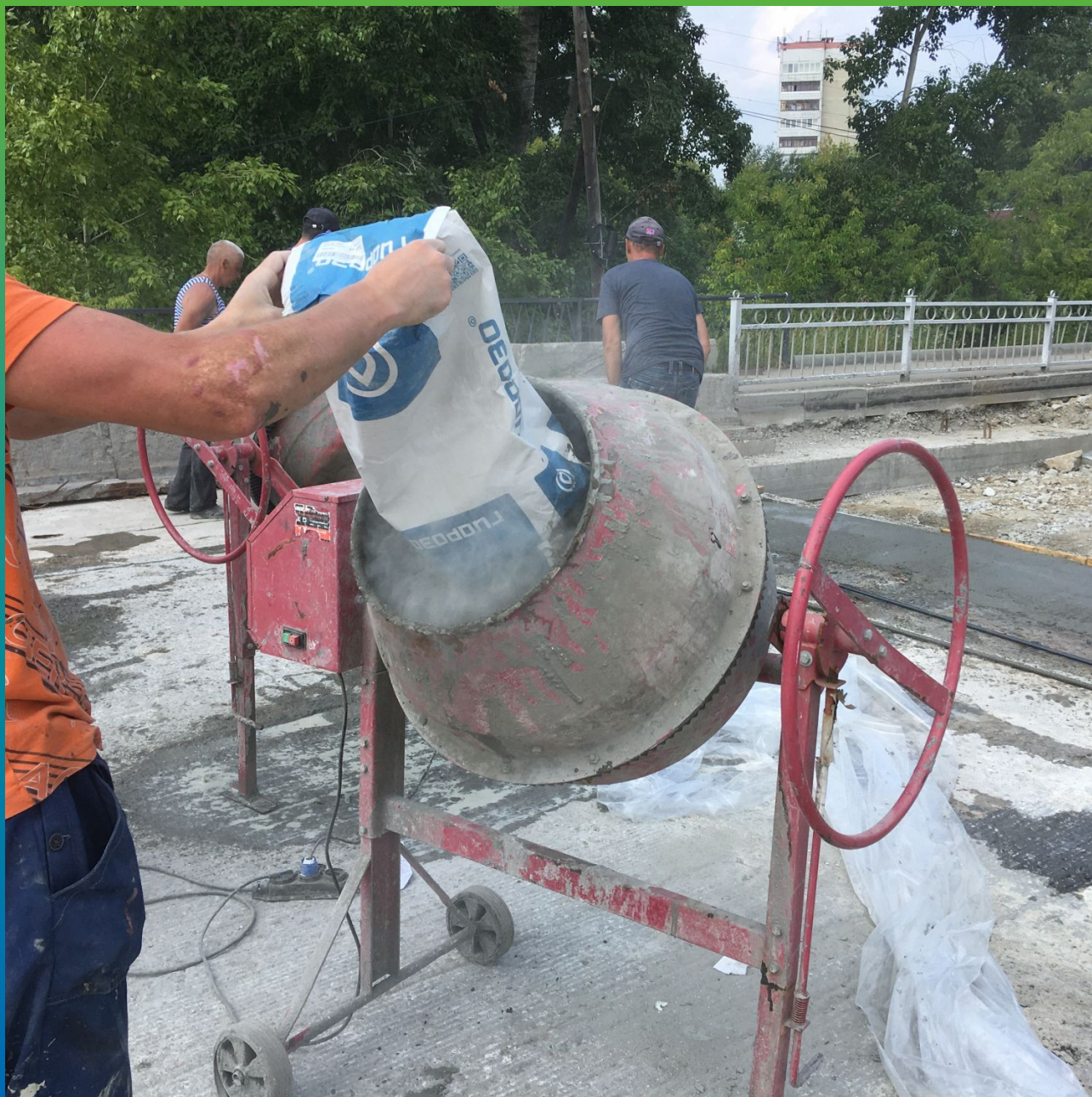
Затворение состава Стармекс ФМ7