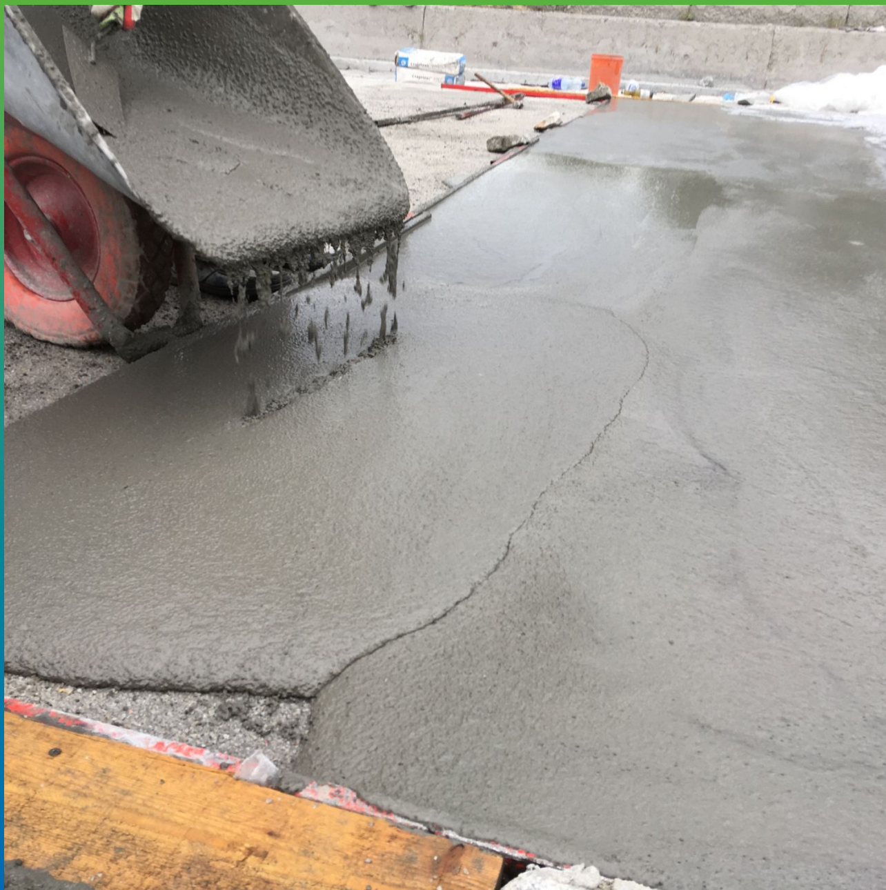
Заливка выравнивающего слоя с помощью Стармекс ФМ7