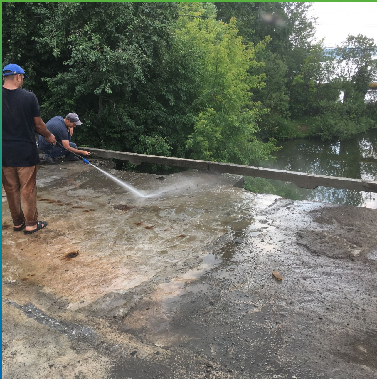
Гидроструйная очистка поверхности перед заливкой выравнивающего слоя