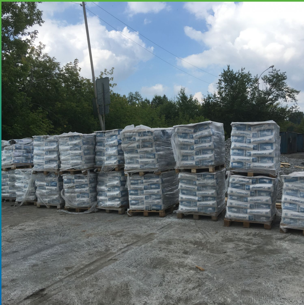
Стармекс ФМ7 на объекте