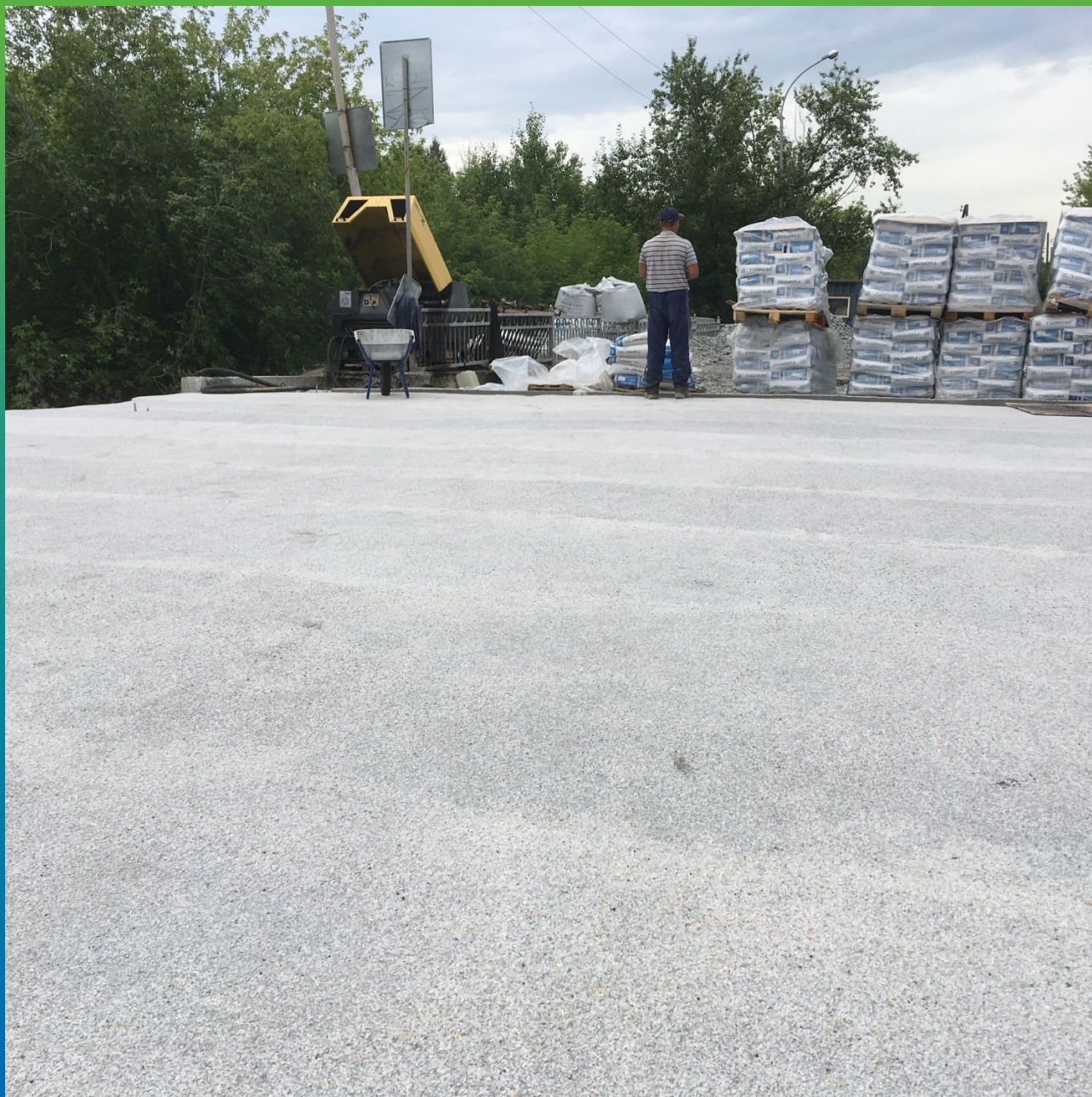
Вид гидроизоляционного слоя с присыпкой кварцевым песком