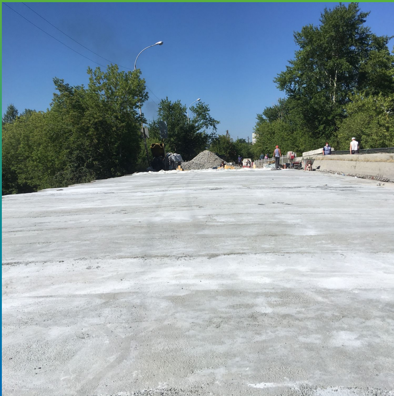
Вид готового выравнивающего слоя, выполненного с помощью Стармекс ФМ7