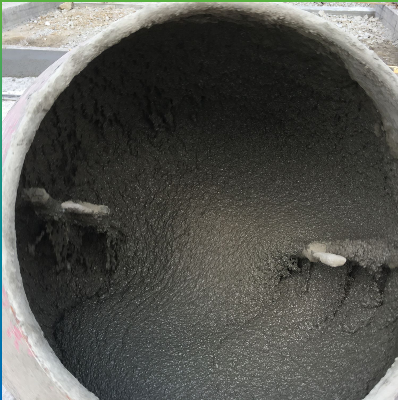
Затворение Стармекс ФМ7 для устройства защитного слоя