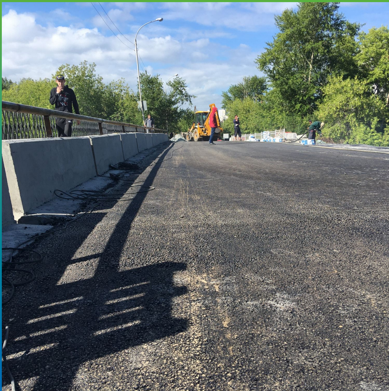
Итоговый вид моста после укладки асфальта