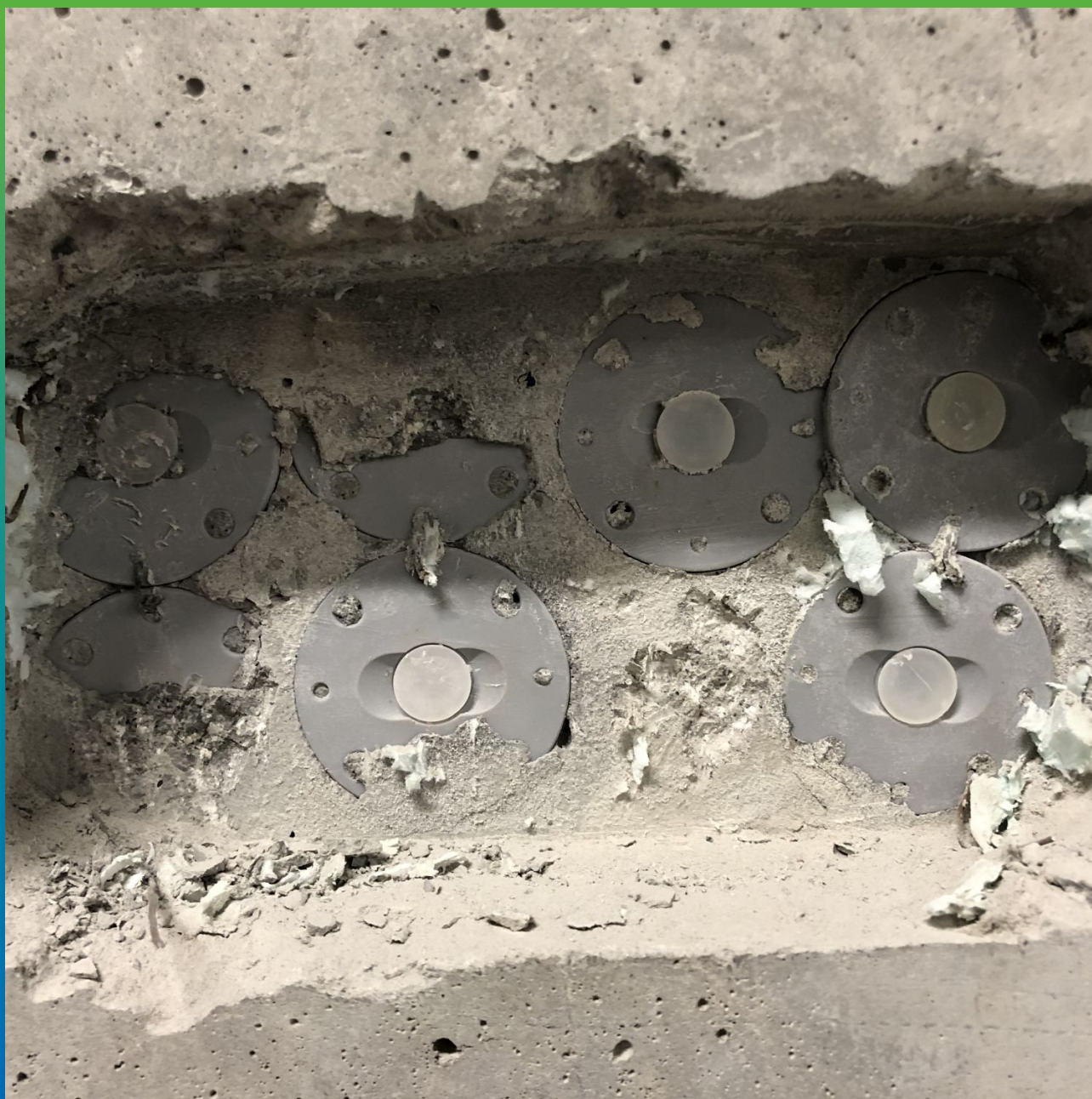
Вскрытие розеток инъекционной системы активной гидроизоляции Инжпайп