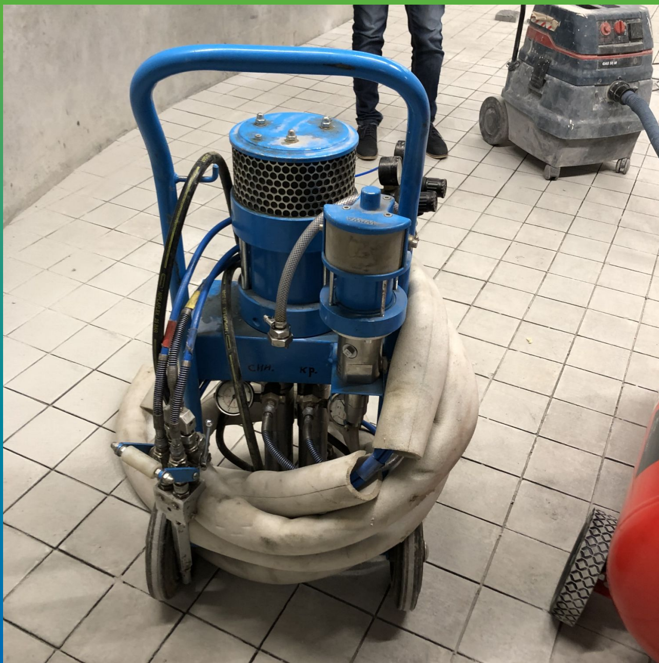
Оборудование на площадке