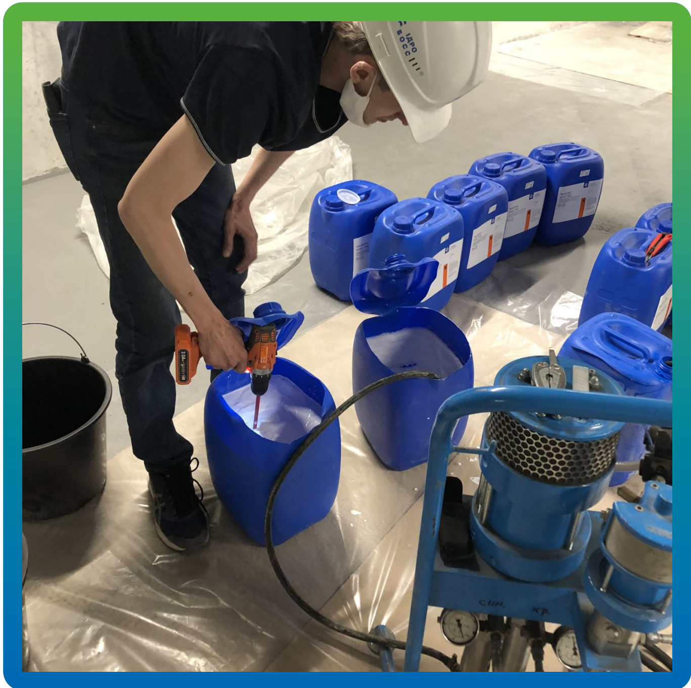
Подготовка и смешивание компонентов Манокрил Гель Р + Манокрил Флекс