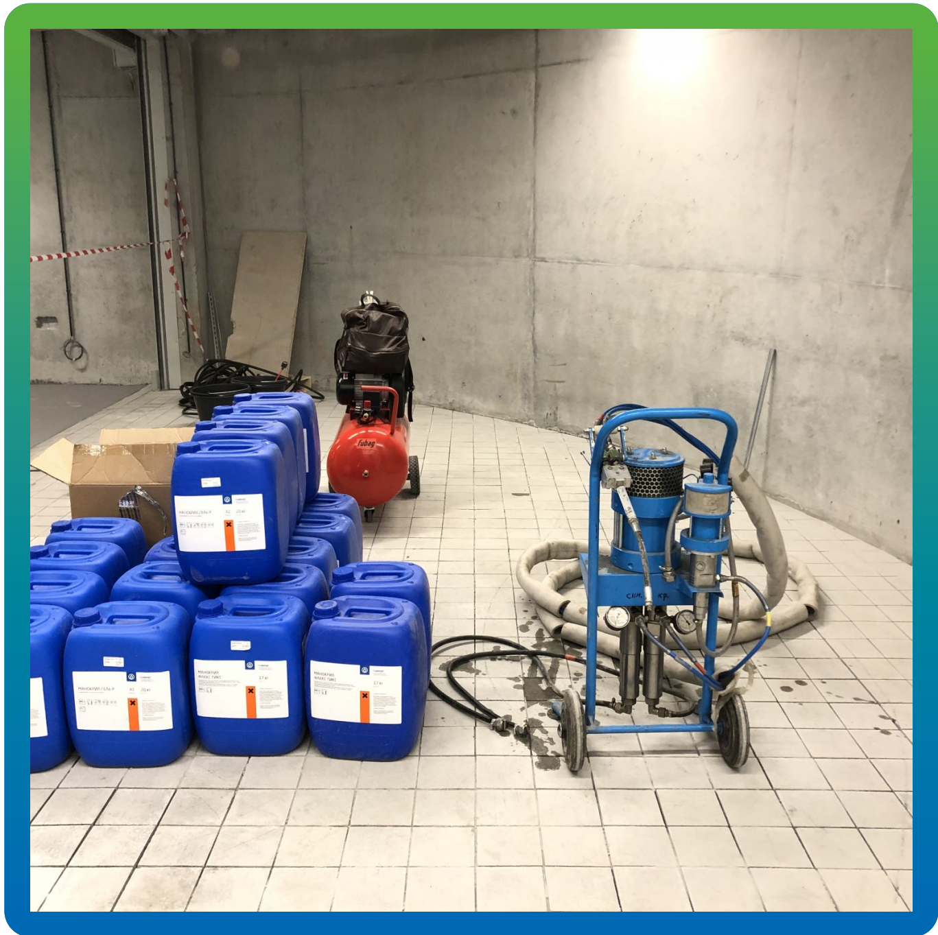
Материалы Гидрозо и оборудование на объекте