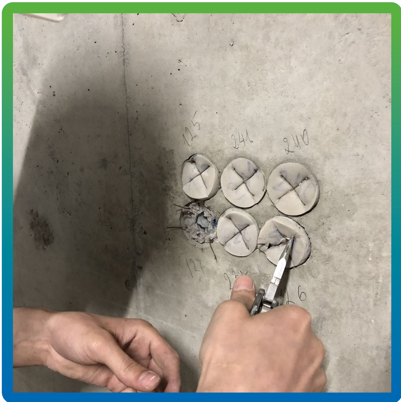
Вскрытие и подготовка инъекционных розеток