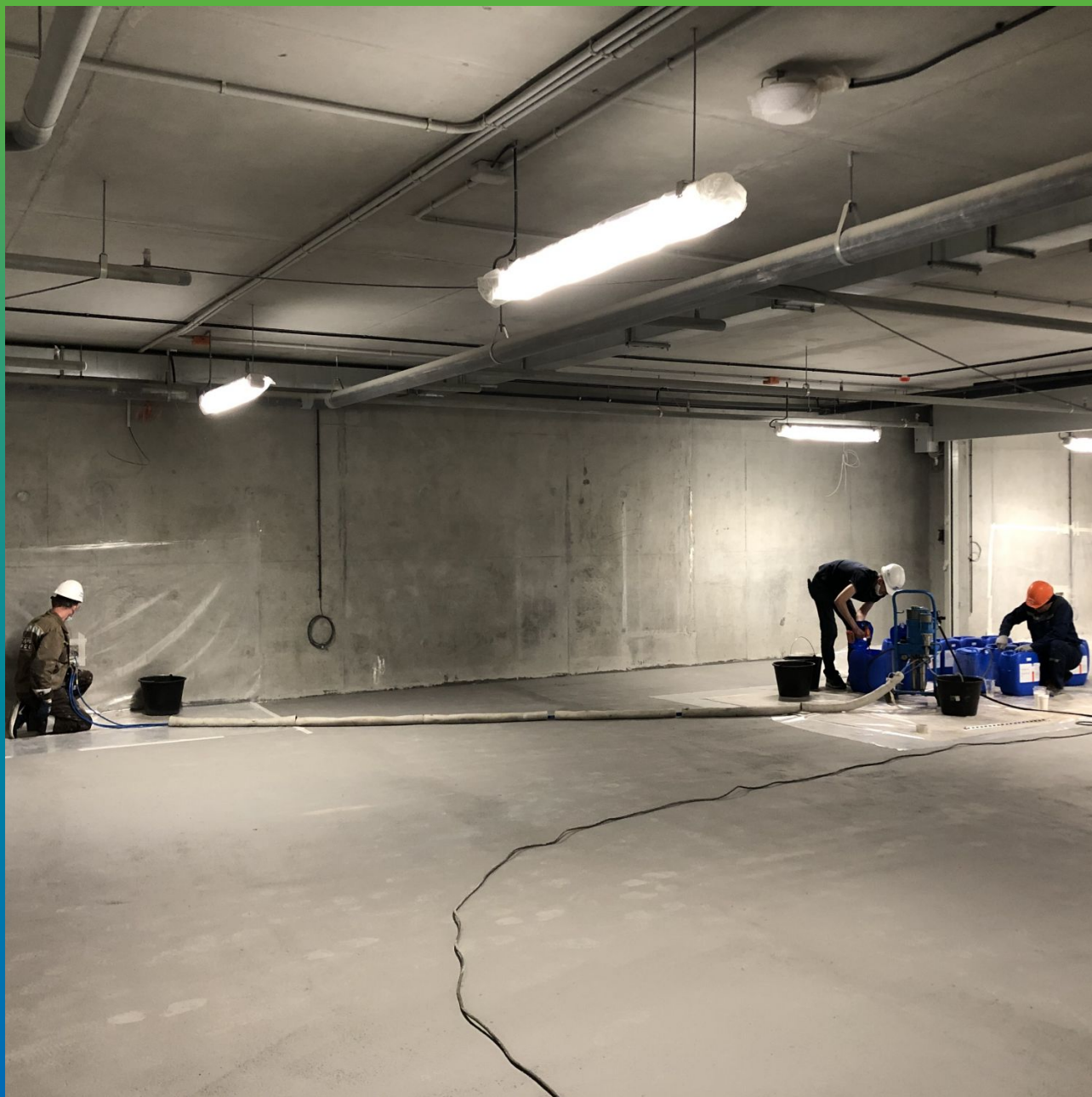
Общий вид процесса инъецирования