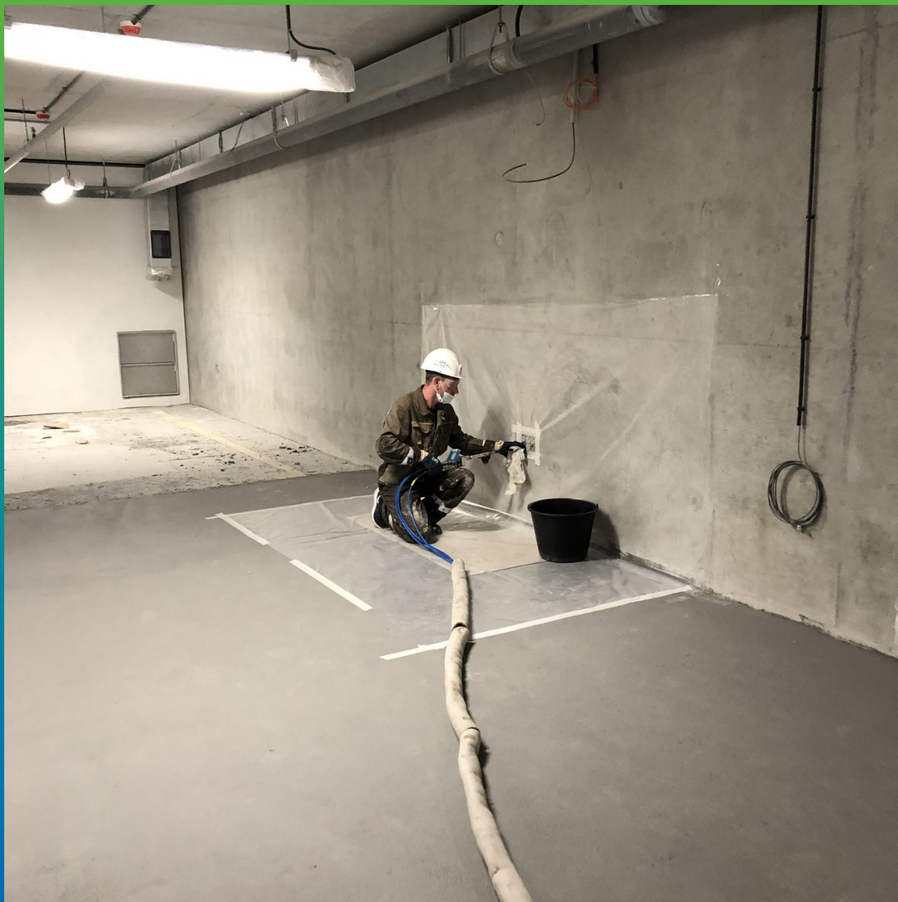
Подключение насоса к розетке и процесс инъецирования