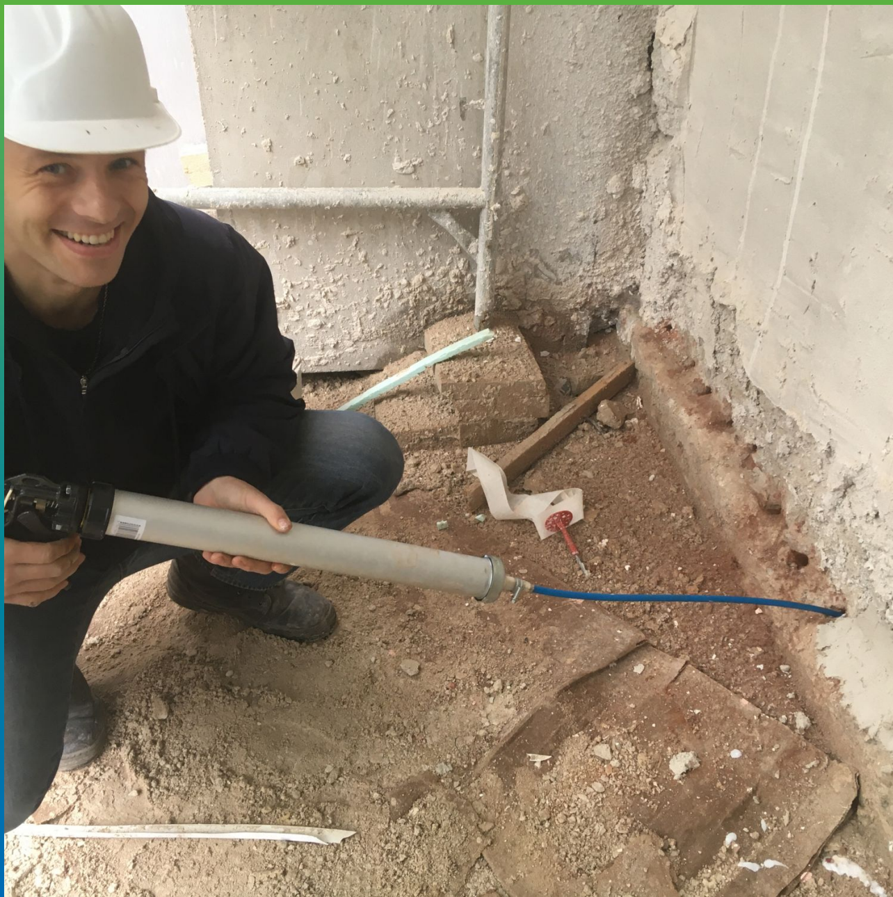
Инъектирование Маноксан 151 Крем после продувки шпуров.