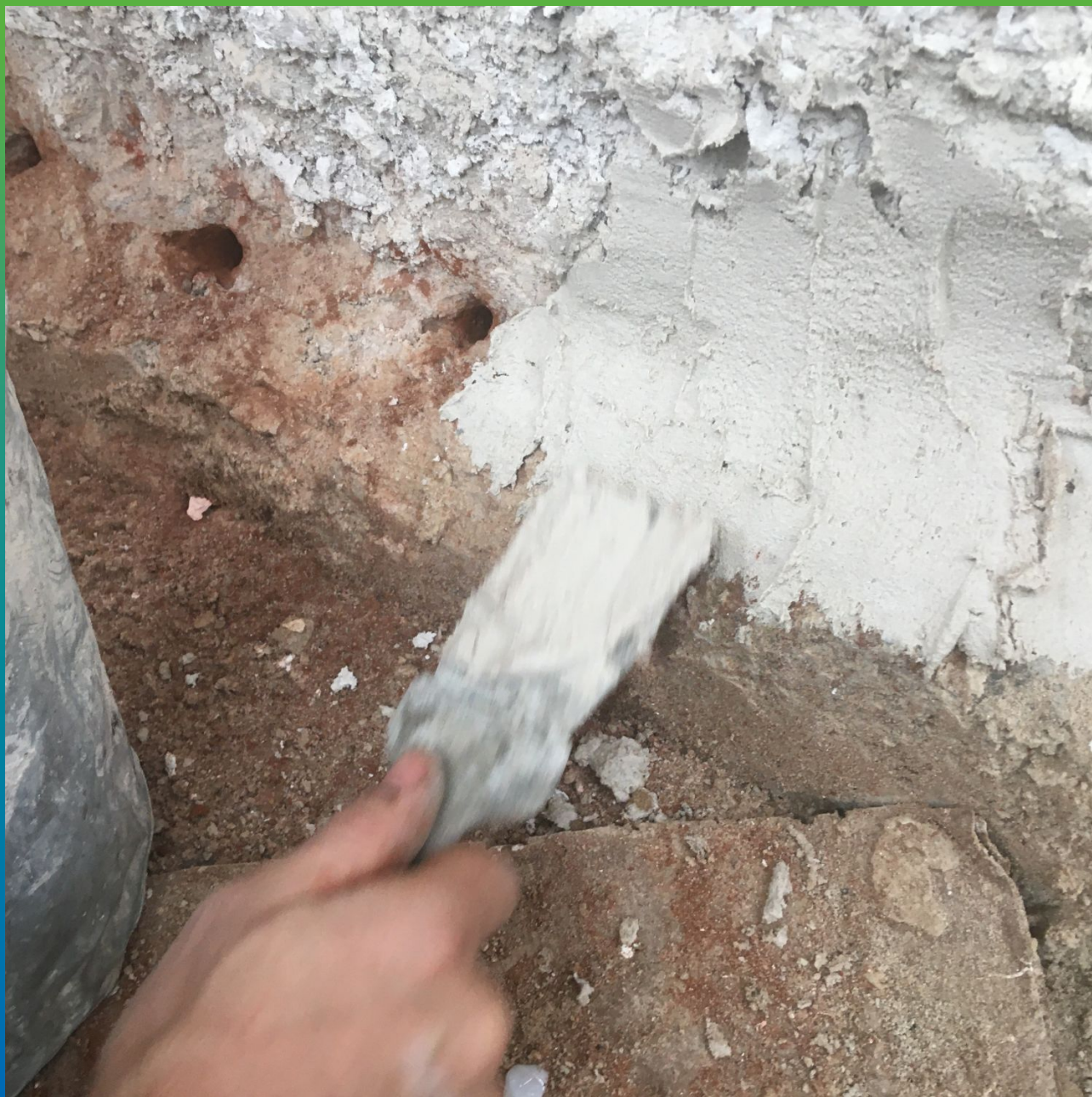
Зачеканка проинъектированного шрупа.