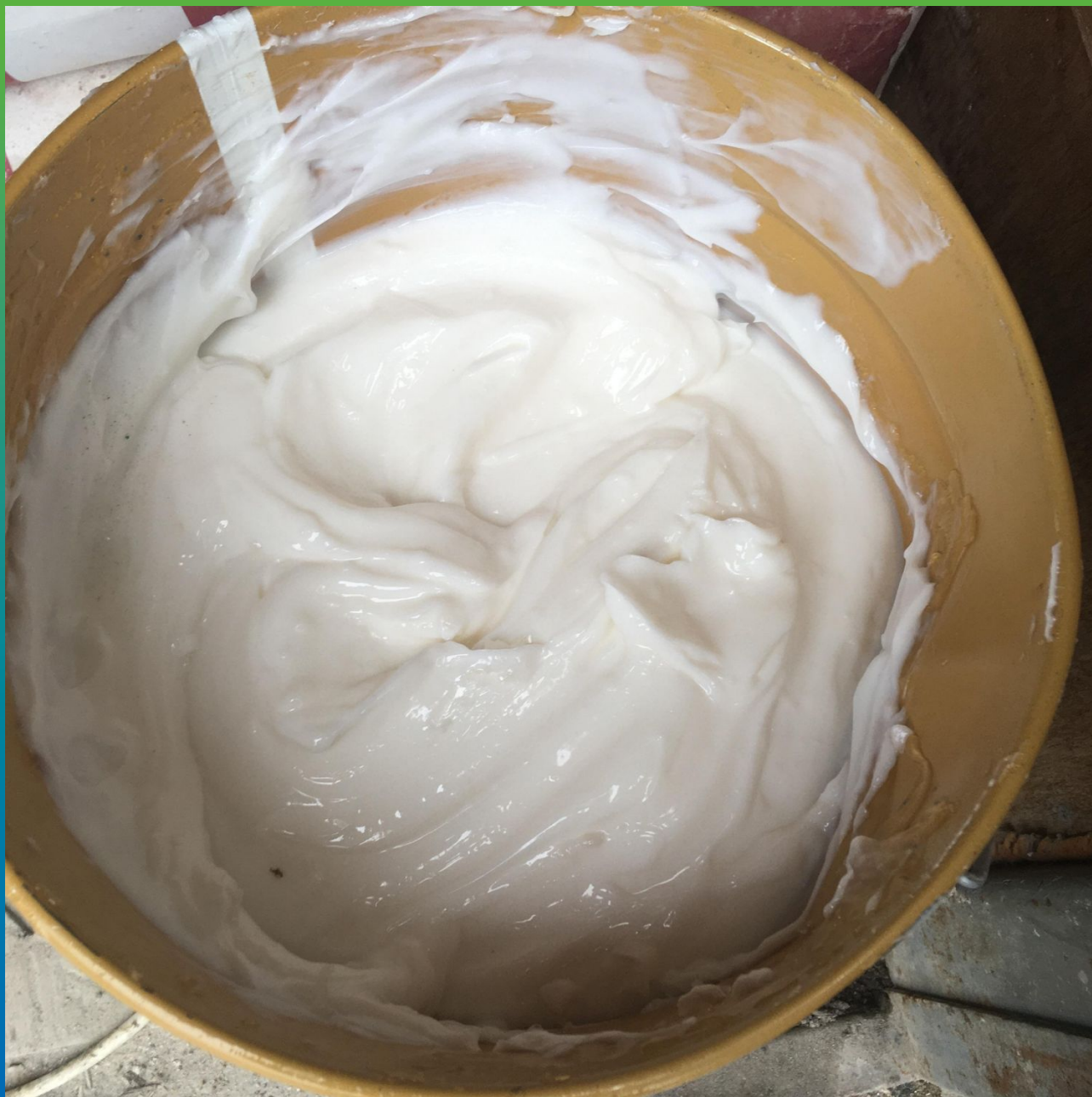
Маноксан 151 Крем