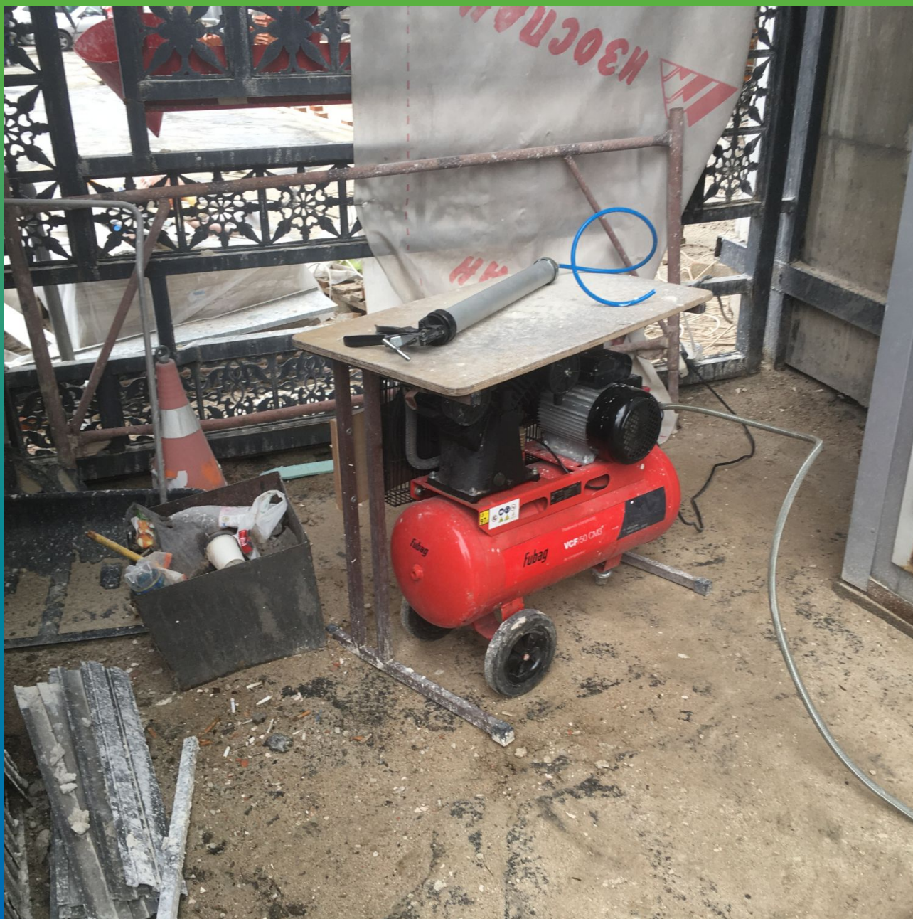
Компрессор для продувки шпуров