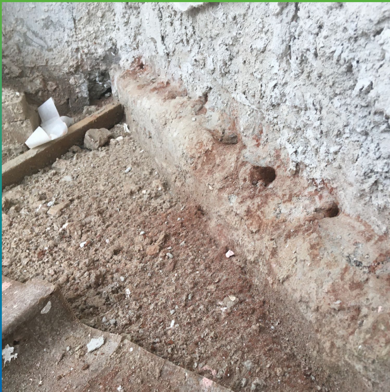
Шпуры с шагом 120 мм.