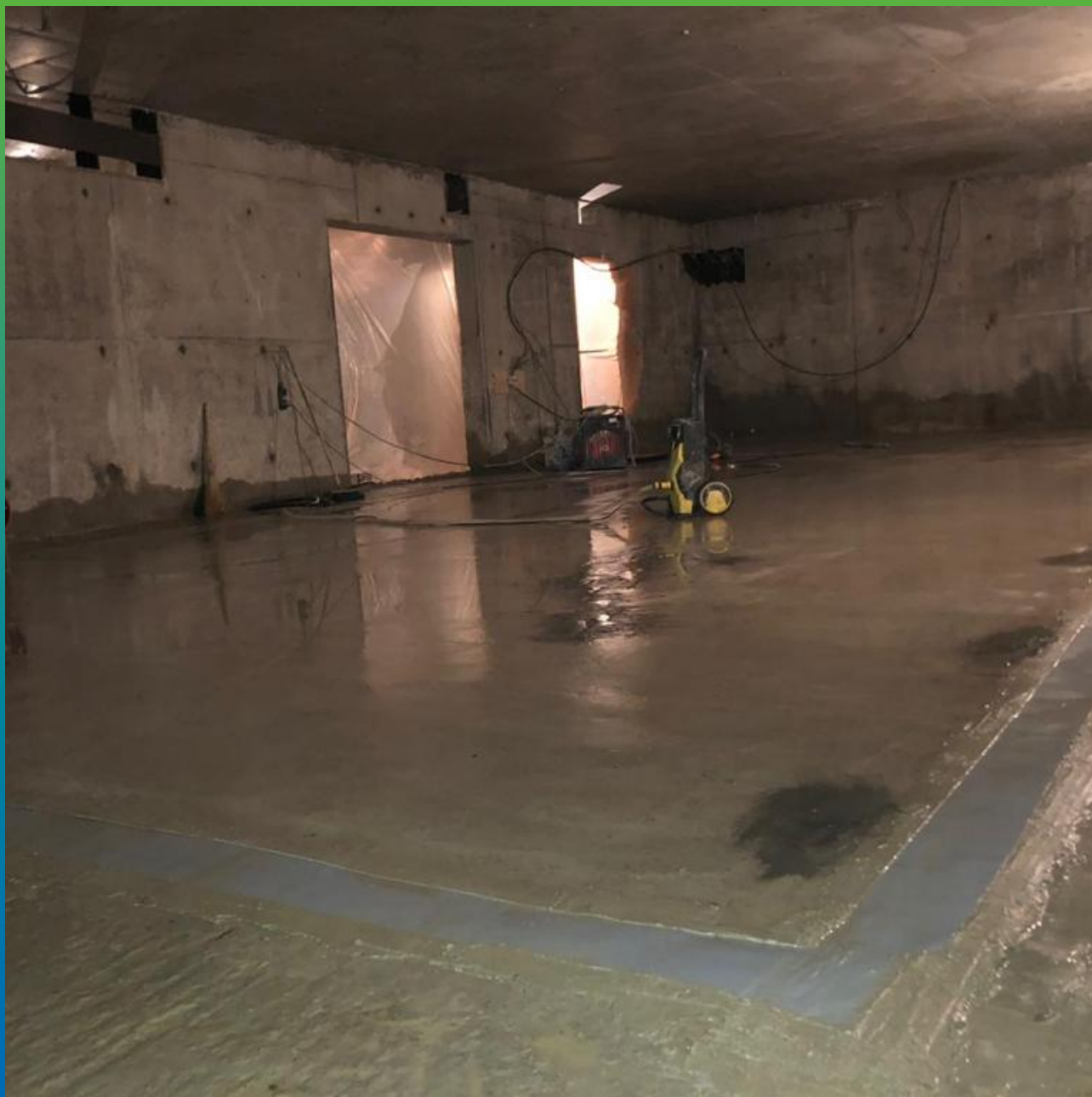
Гидроизоляция деформационного шва лентой Манодил Про, приклеенной на тиксотропный эпоксидный состав Манопокс 331