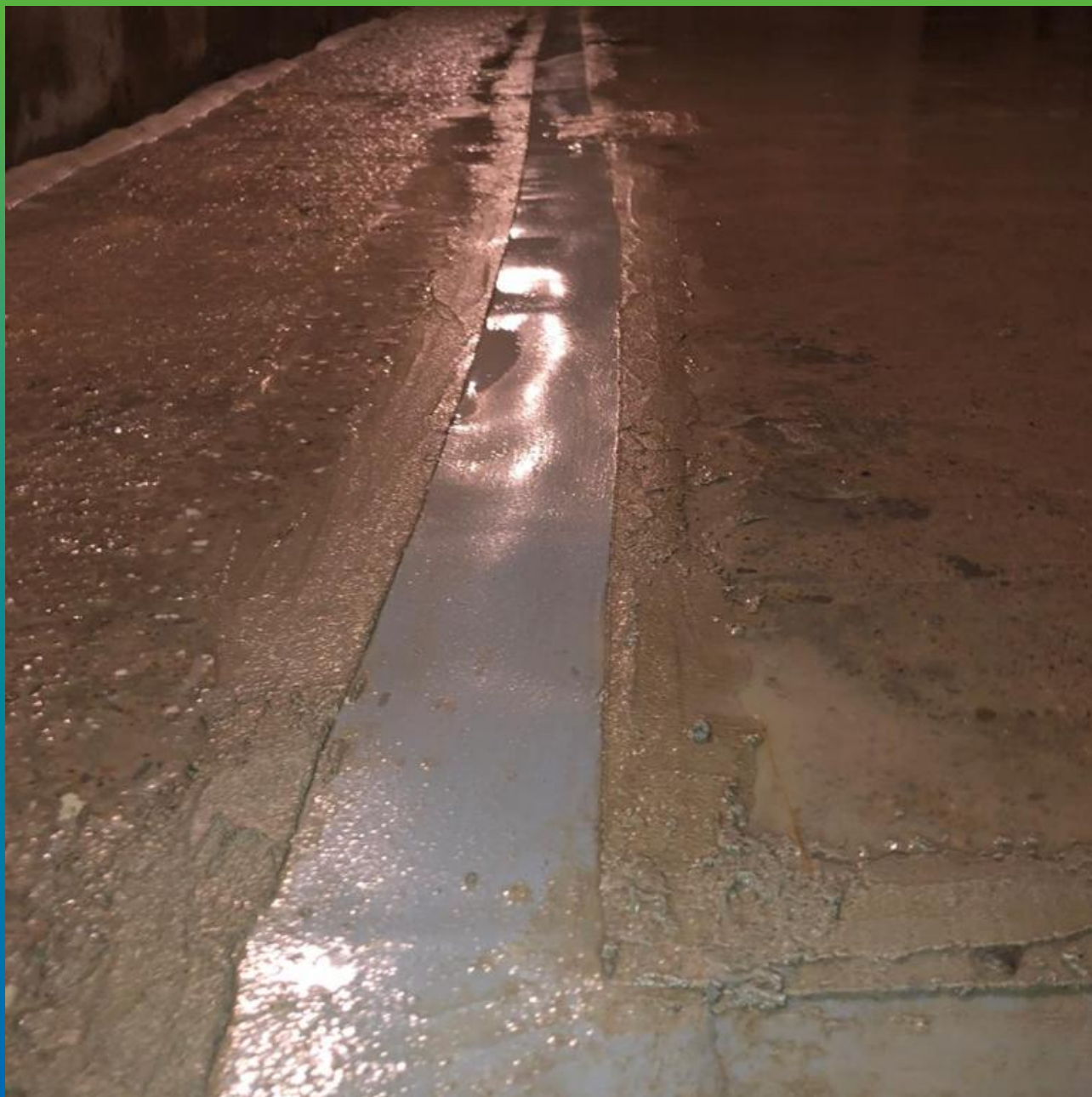
Гидроизоляция деформационного шва лентой Манодил Про, приклеенной на тиксотропный эпоксидный состав Манопокс 331