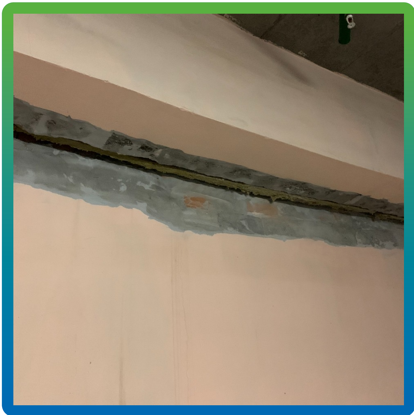
Очистка и шлифовка швов