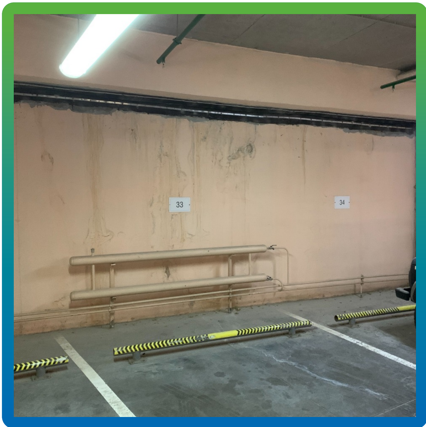
Лента Преласта СТ, монтированная на шов