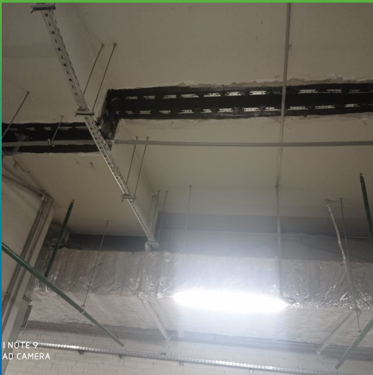
Лента Прелести СТ, монтированная на шов