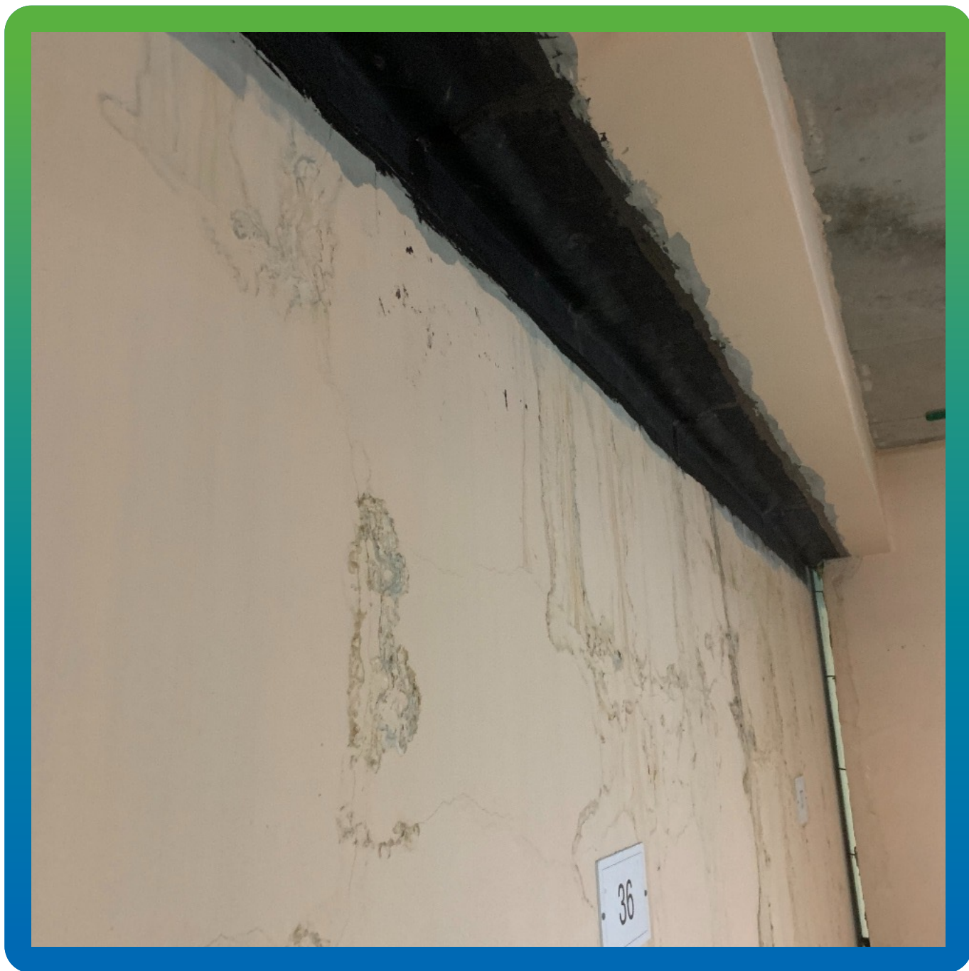
Лента Прелести СТ, монтированная на шов