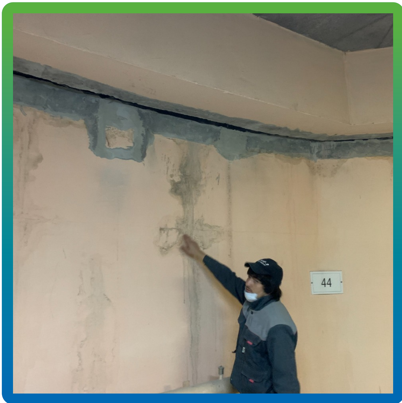
Очистка и шлифовка швов