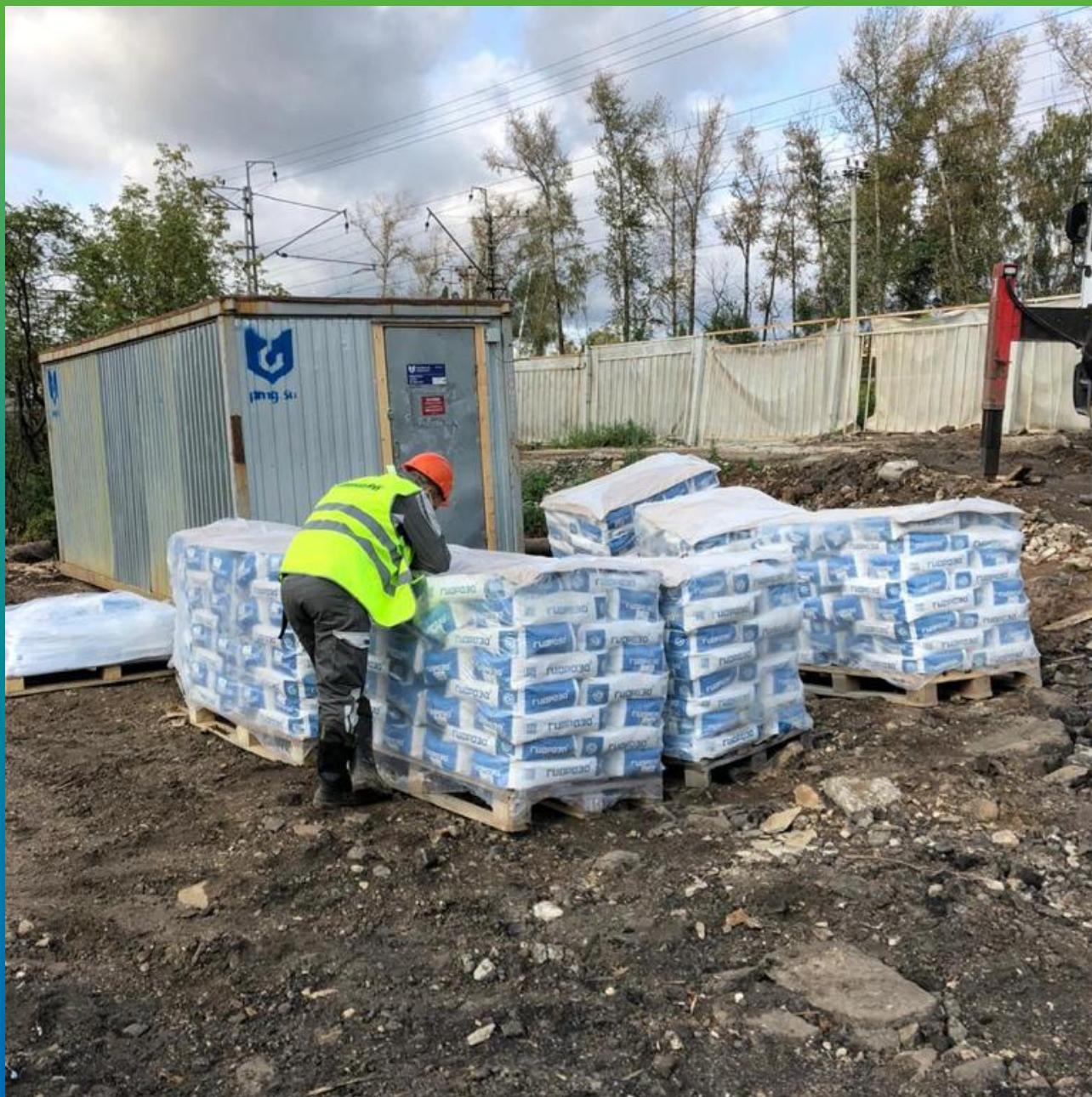
Материал Маноцем Микс на объекте