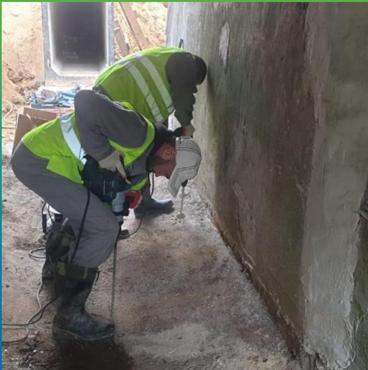
Бурение инъекционных шпуров