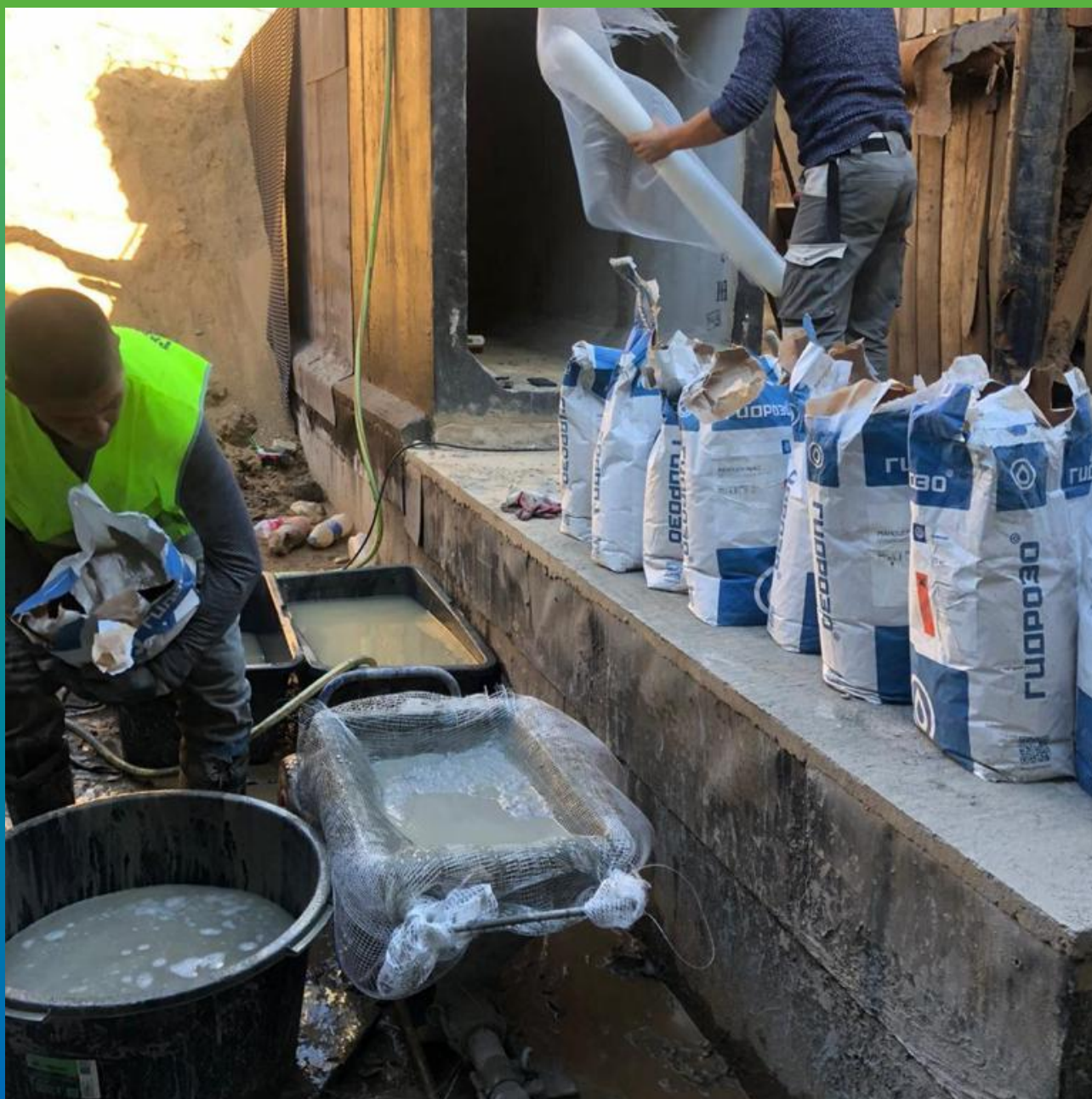
Подготовка растворной смеси