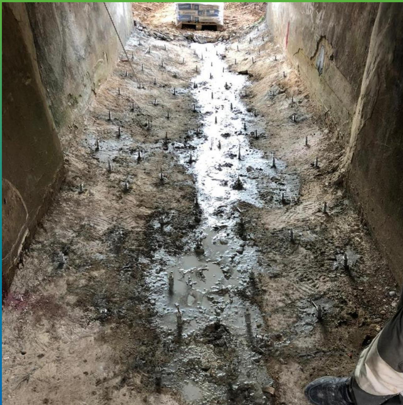
Общий вид после инъектирования