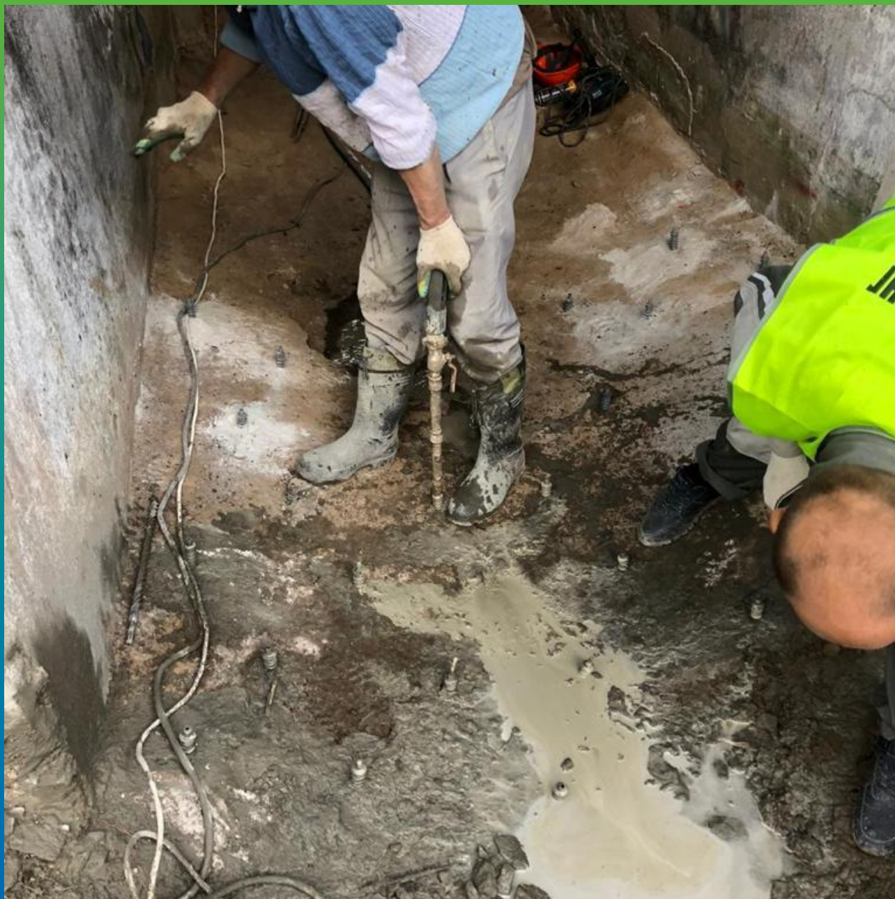
Инъектирование Маноцем Микс при помощи шнекового насоса