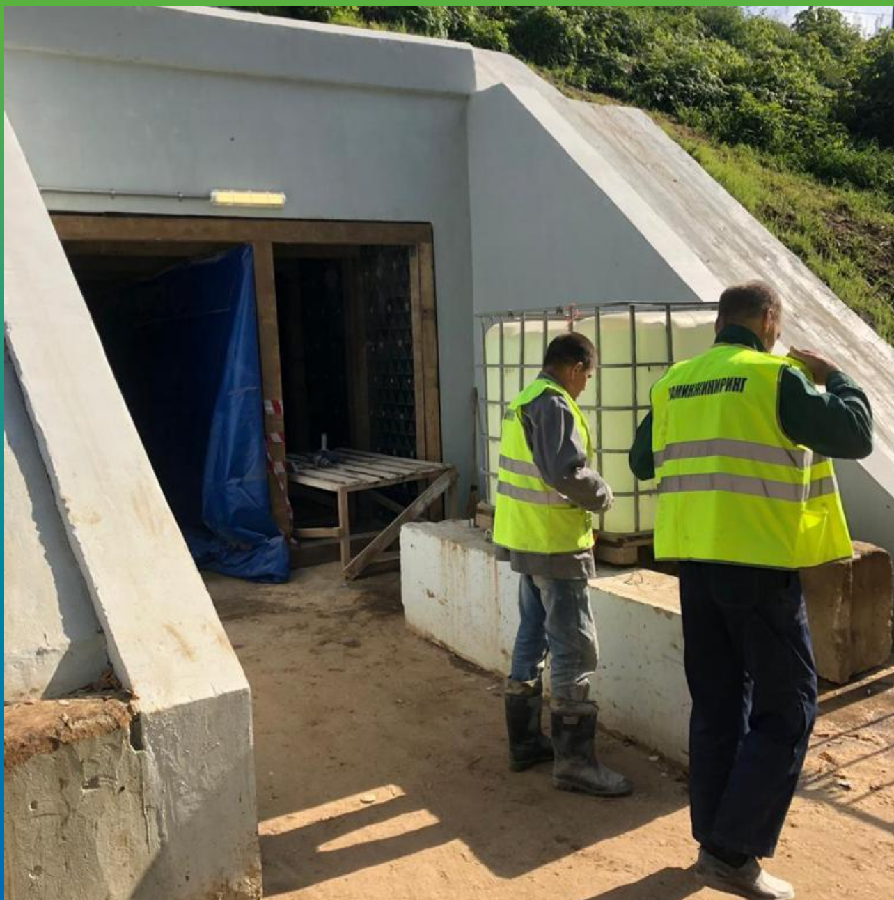
Объект во время строительства