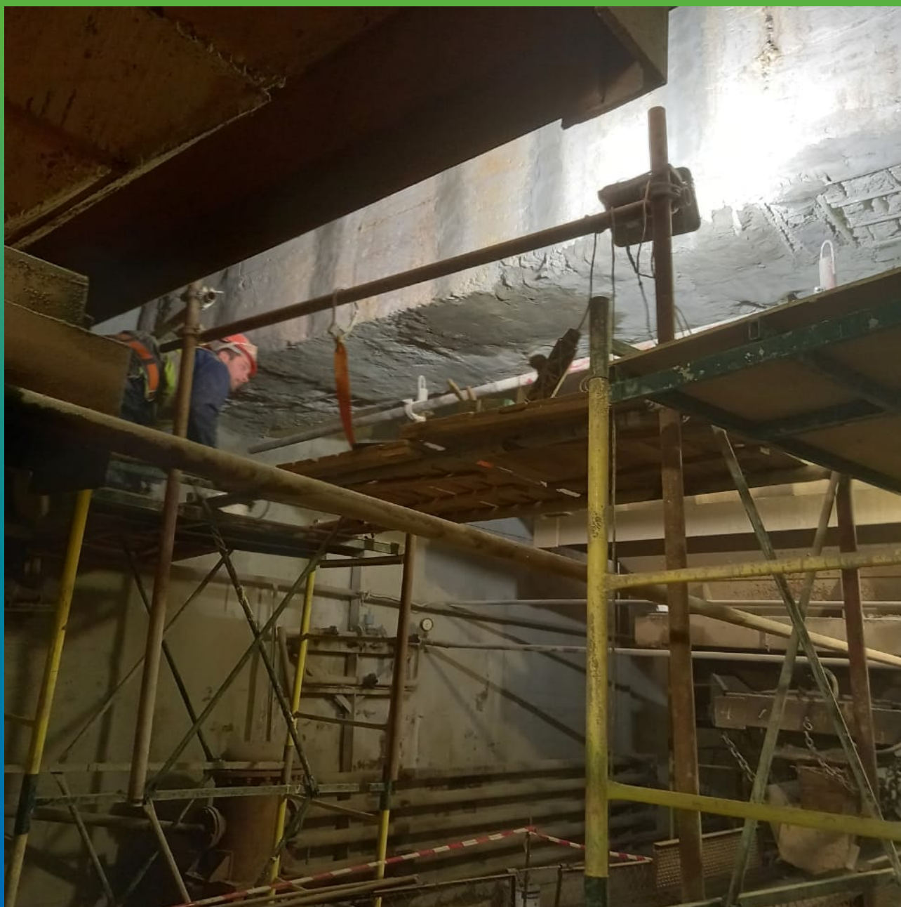
Обработка арматуры при помощи Стармекс МКП