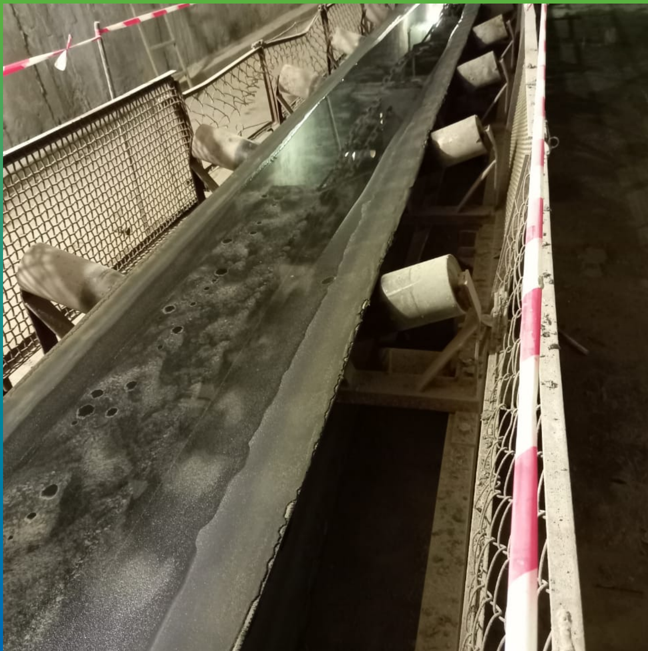
Фильтрация воды через конструкции опирания конвеерной ленты