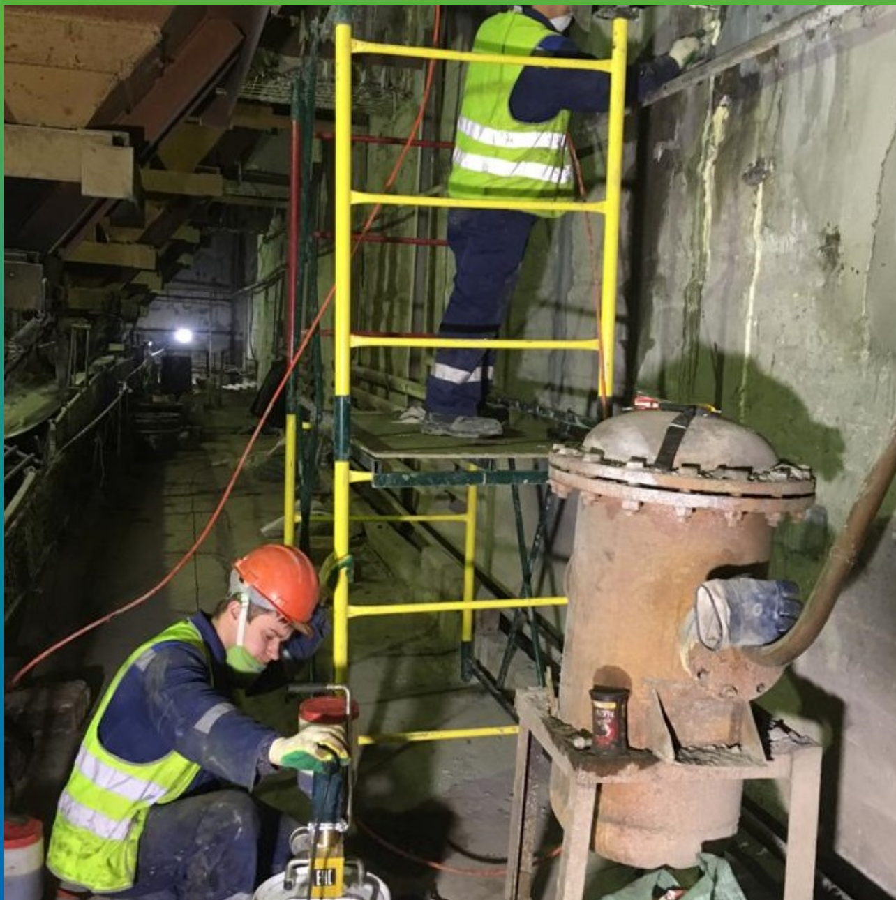
Устранение активной фильтрации воды методом двухстадийного инъецирования Манопур 15 и Манопур 143