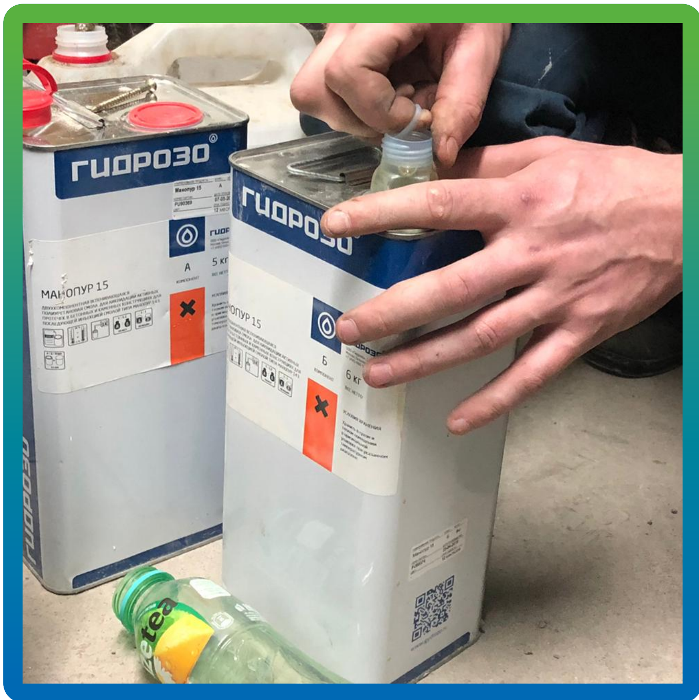
Инъекционная смола Манопур 15