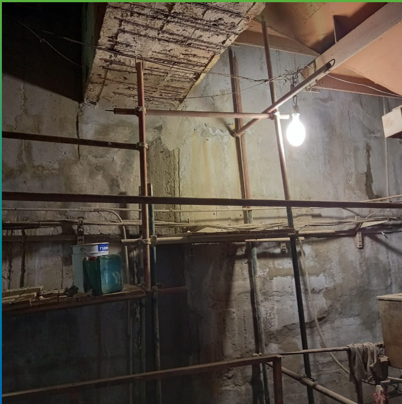
Удаление структурно непрочного бетона