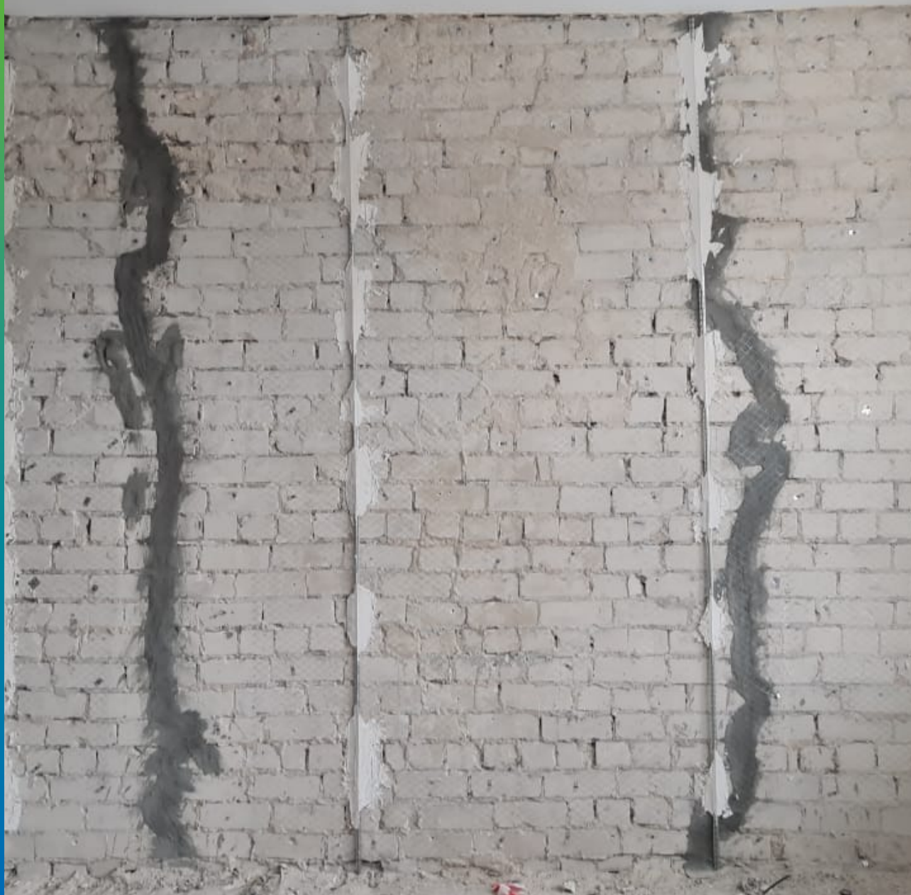
Зачеканка трещин составом Стармекс РМЗ. Подготовка к инъектированию.