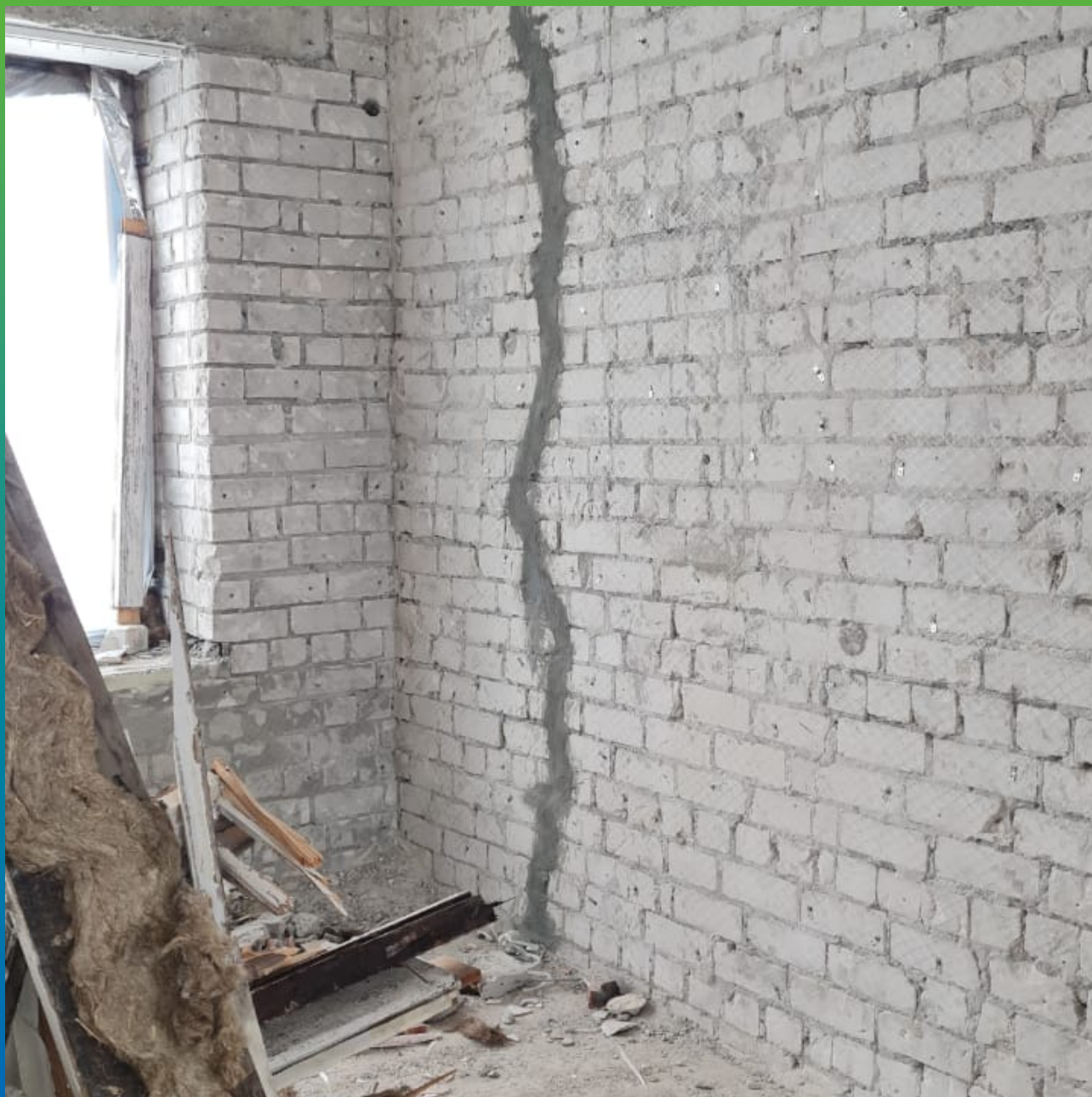
Зачеканка трещины составом Стармекс РМЗ. Подготовка к инъектированию.