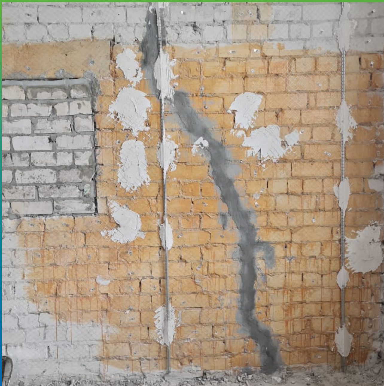
Зачеканка трещины составом Стармекс РМЗ. Подготовка к инъектированию.