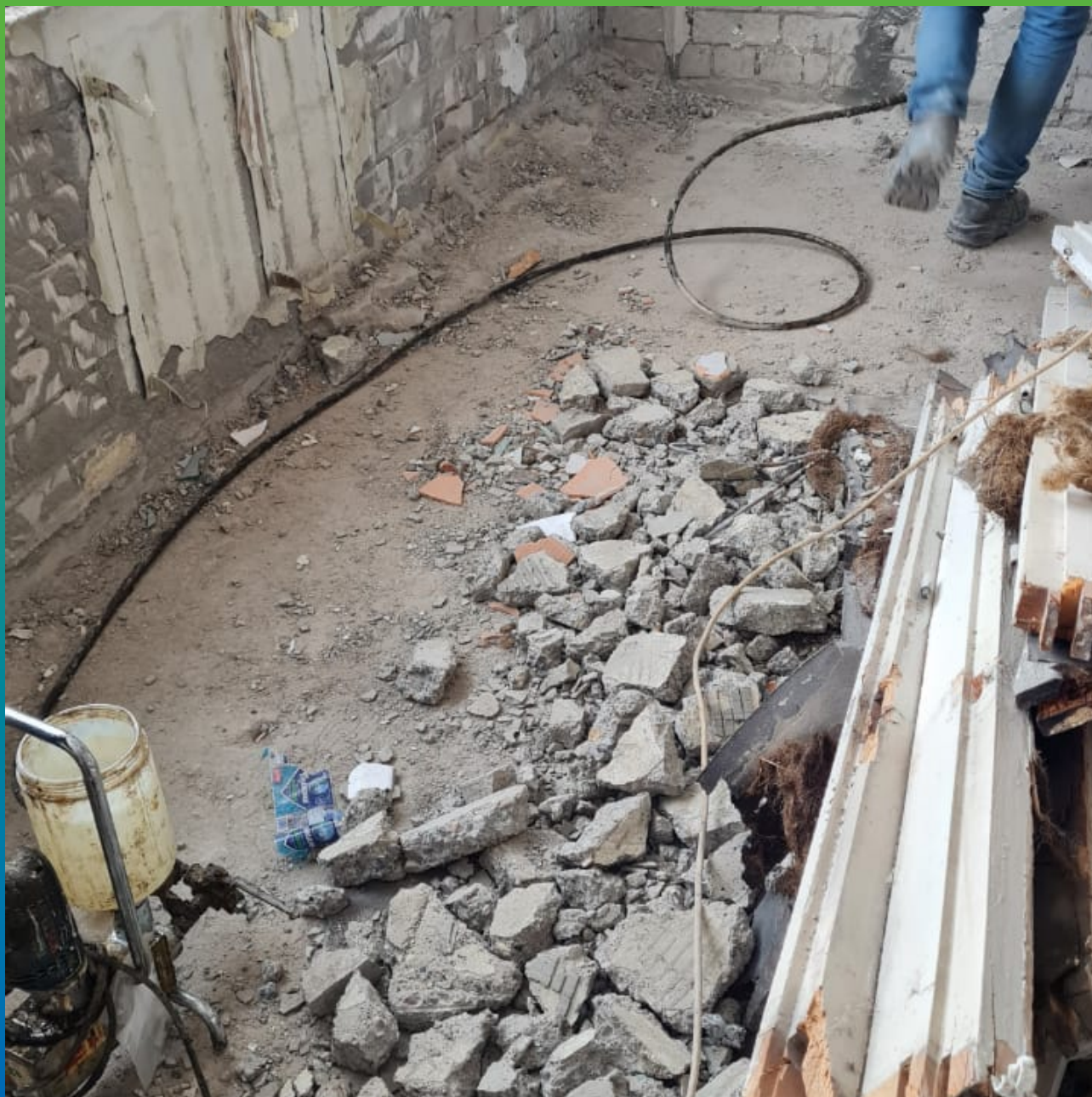
Инъектирование трещин кирпичной кладки эпоксидным составом Манопокс 352