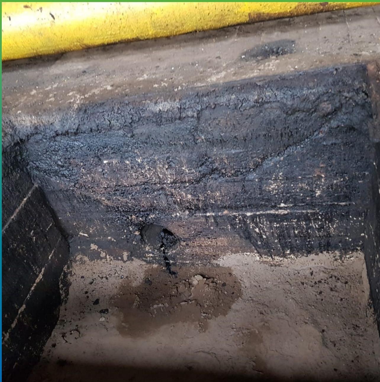
Состояние приемков до проведения ремонтных работ.