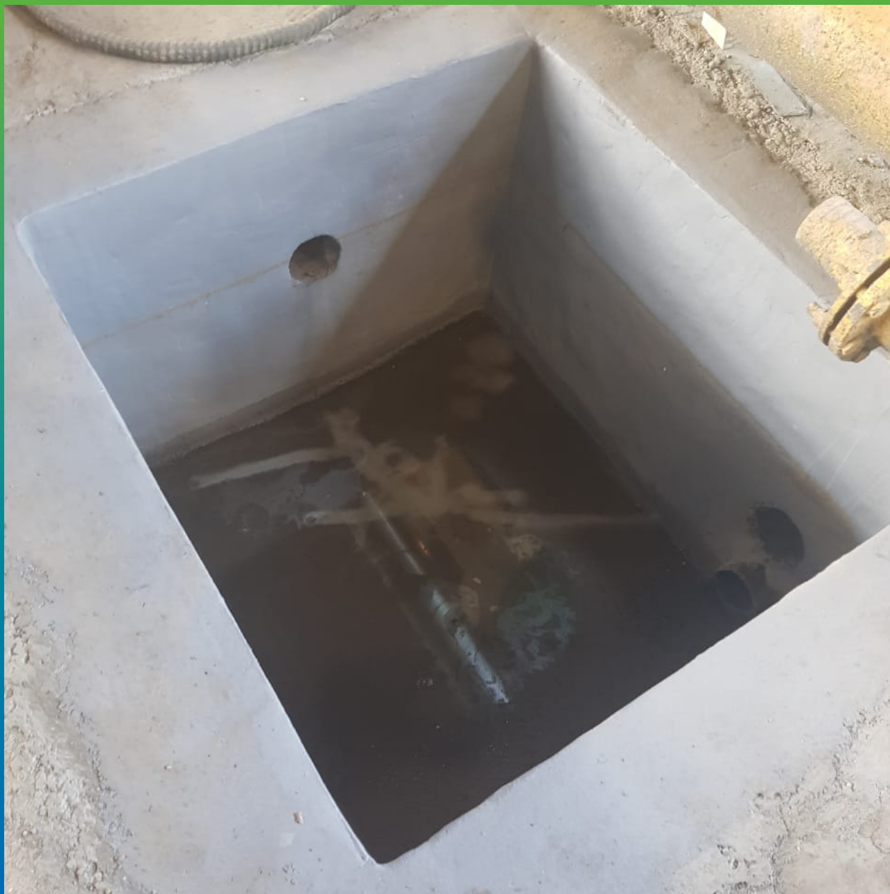
Приямок, покрытый химстойким полимерцементным составом ДенсТоп ПМ 605 ФК