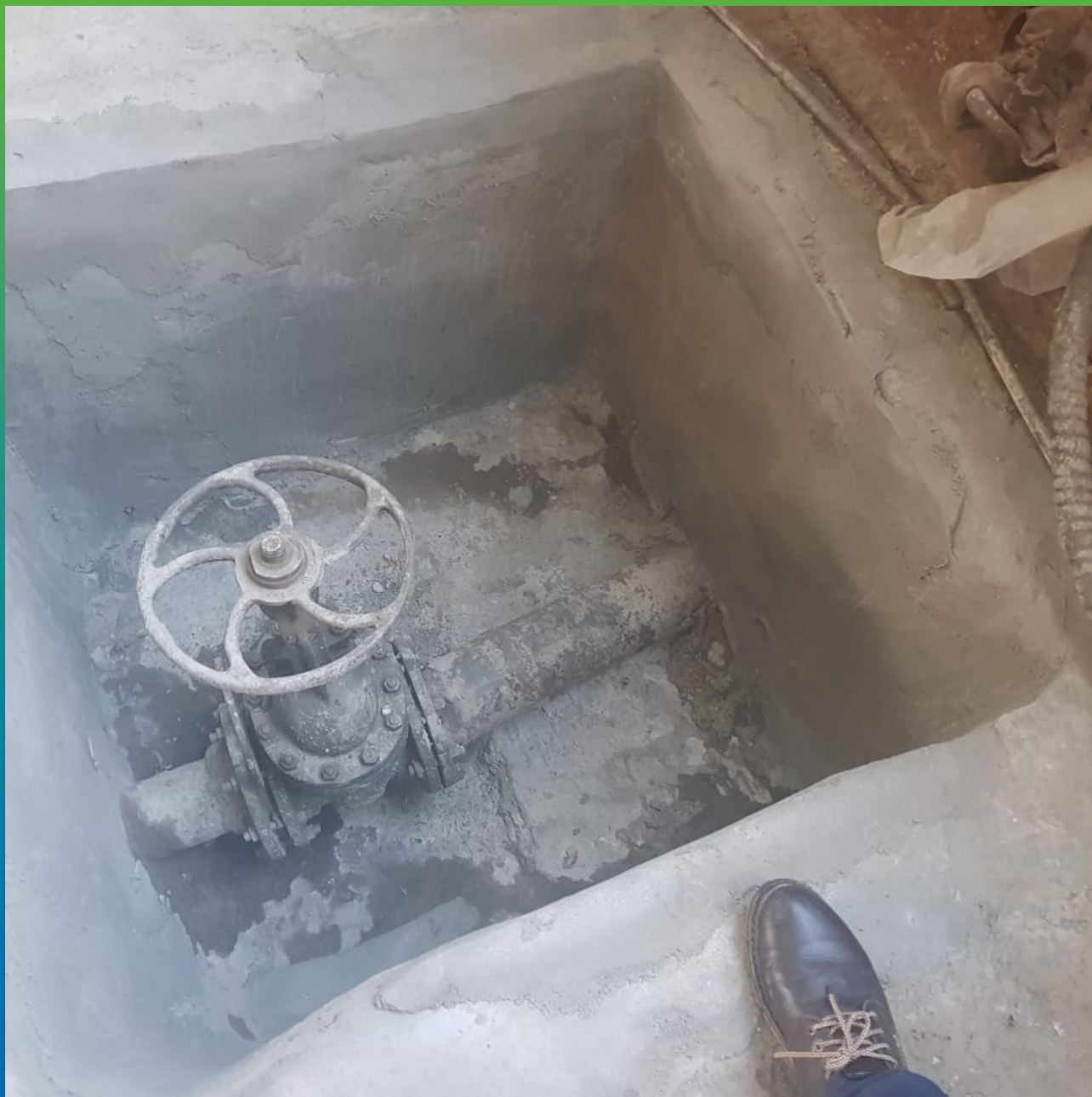
Отремонтированное основание приемка