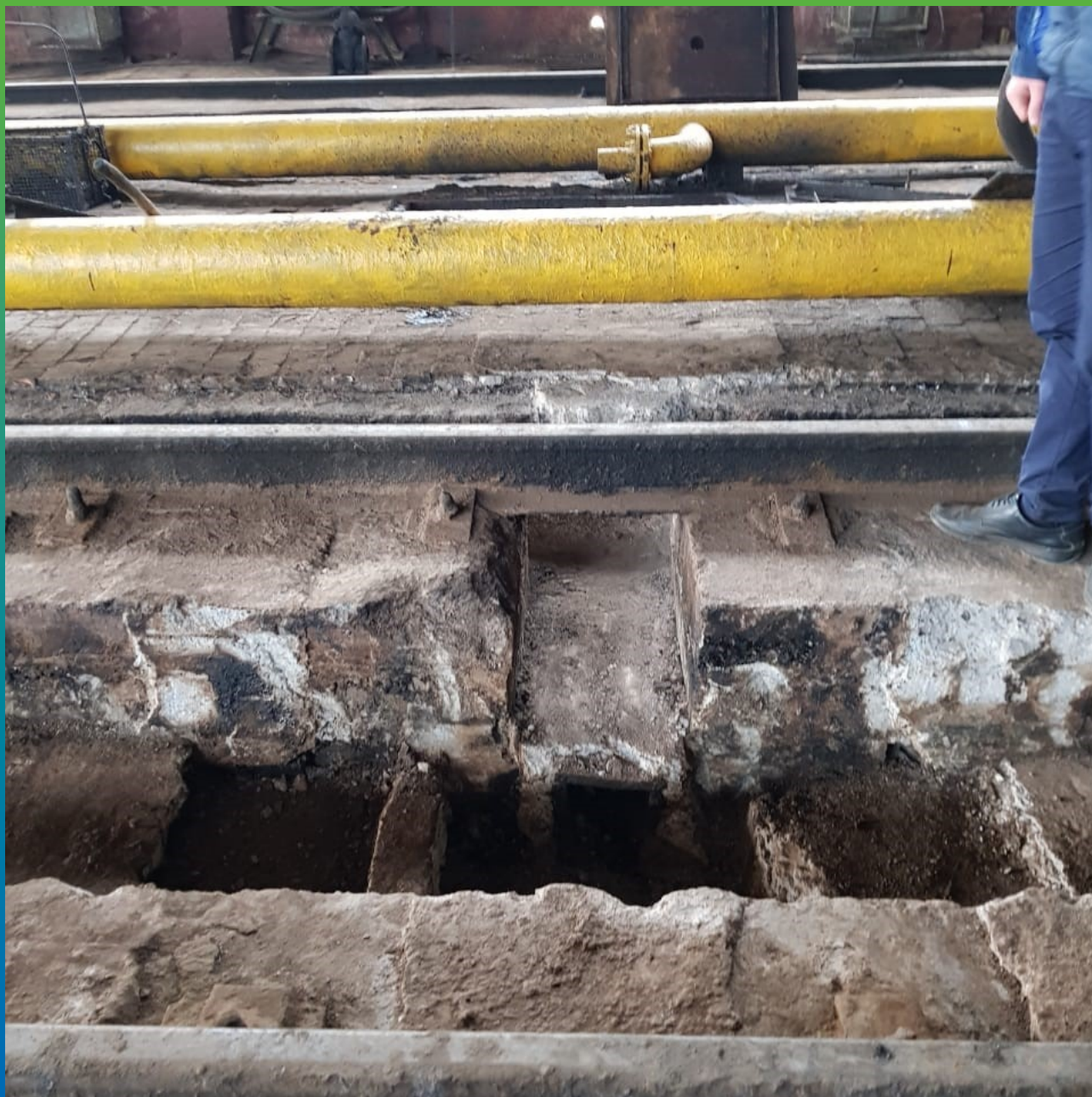
Приямки, требующие гидроизоляции.