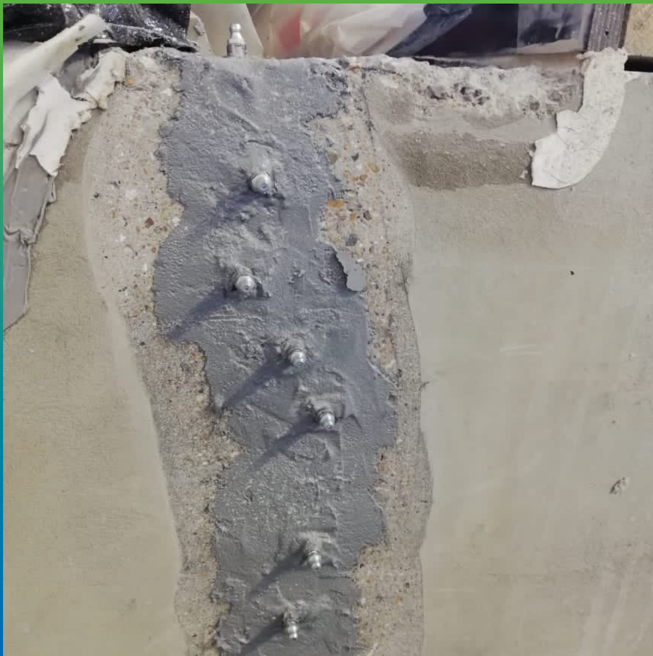
Монтаж пакеров БМ 1189