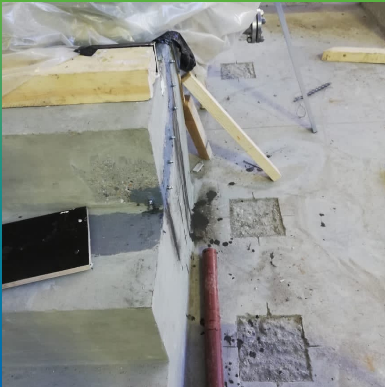
Трещина, проинъектированная Манопокс 352ЛВ