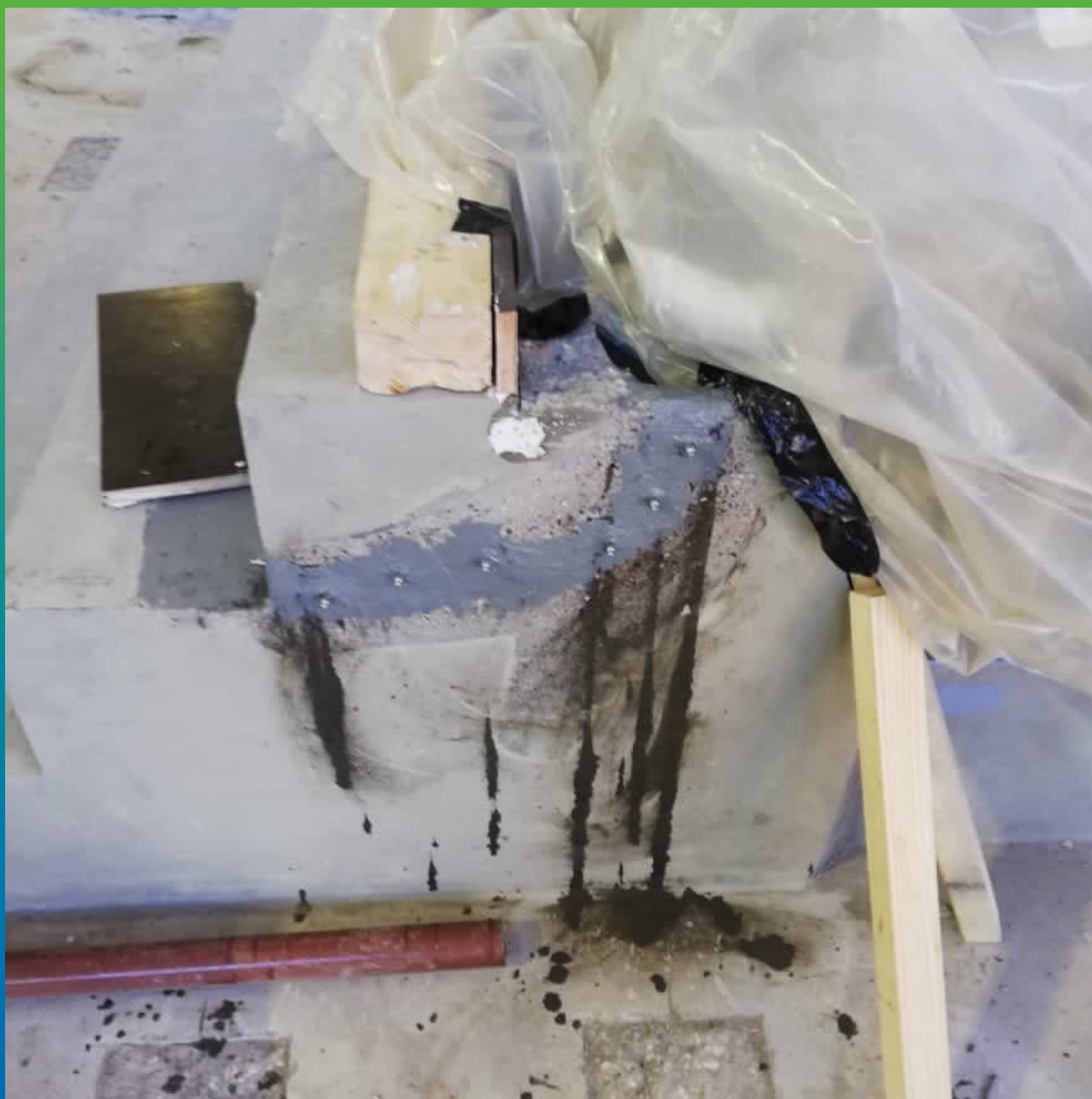
Трещина, проинъектированная Манопокс 352ЛВ