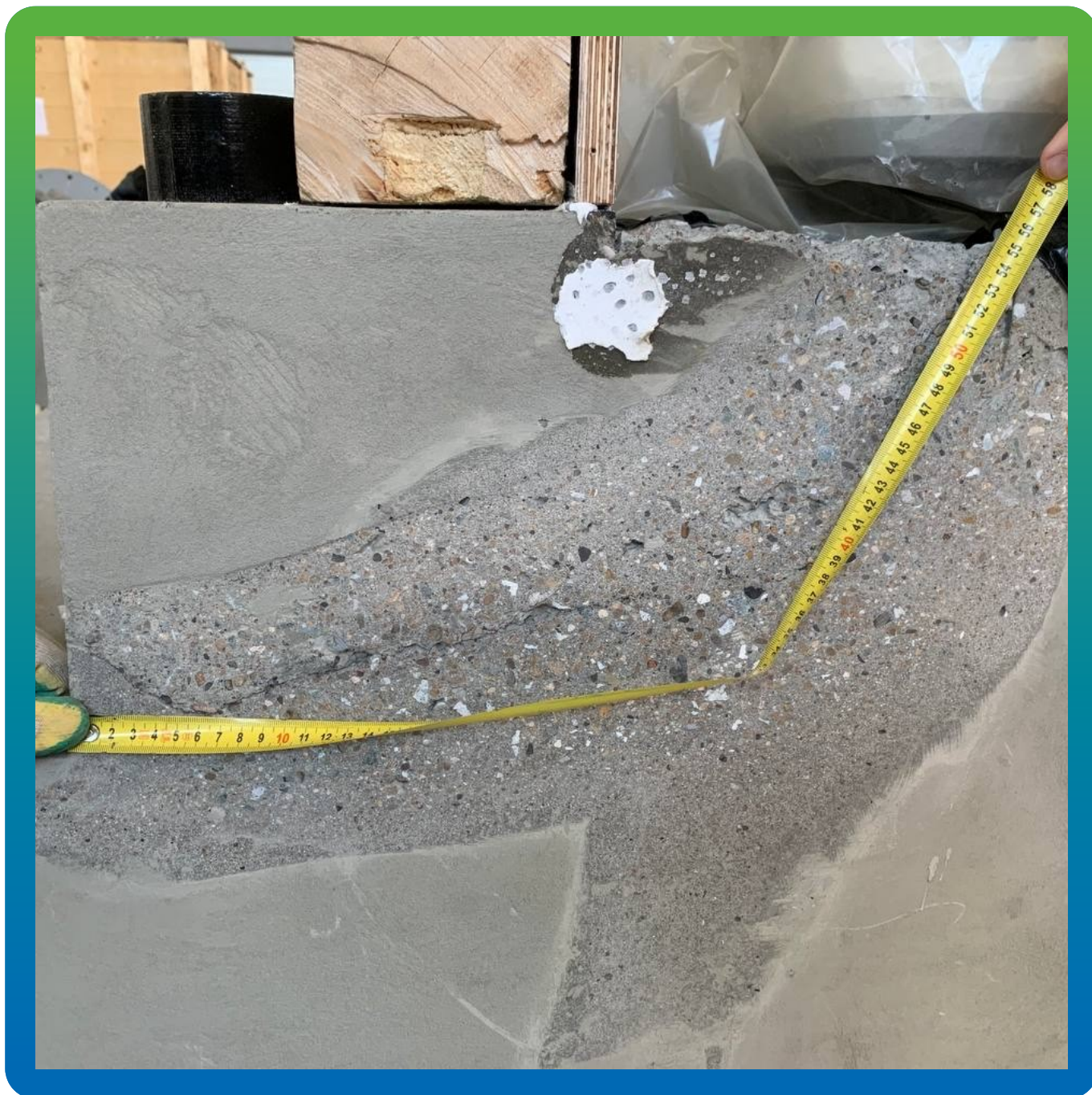
Трещины в бетонном подиуме