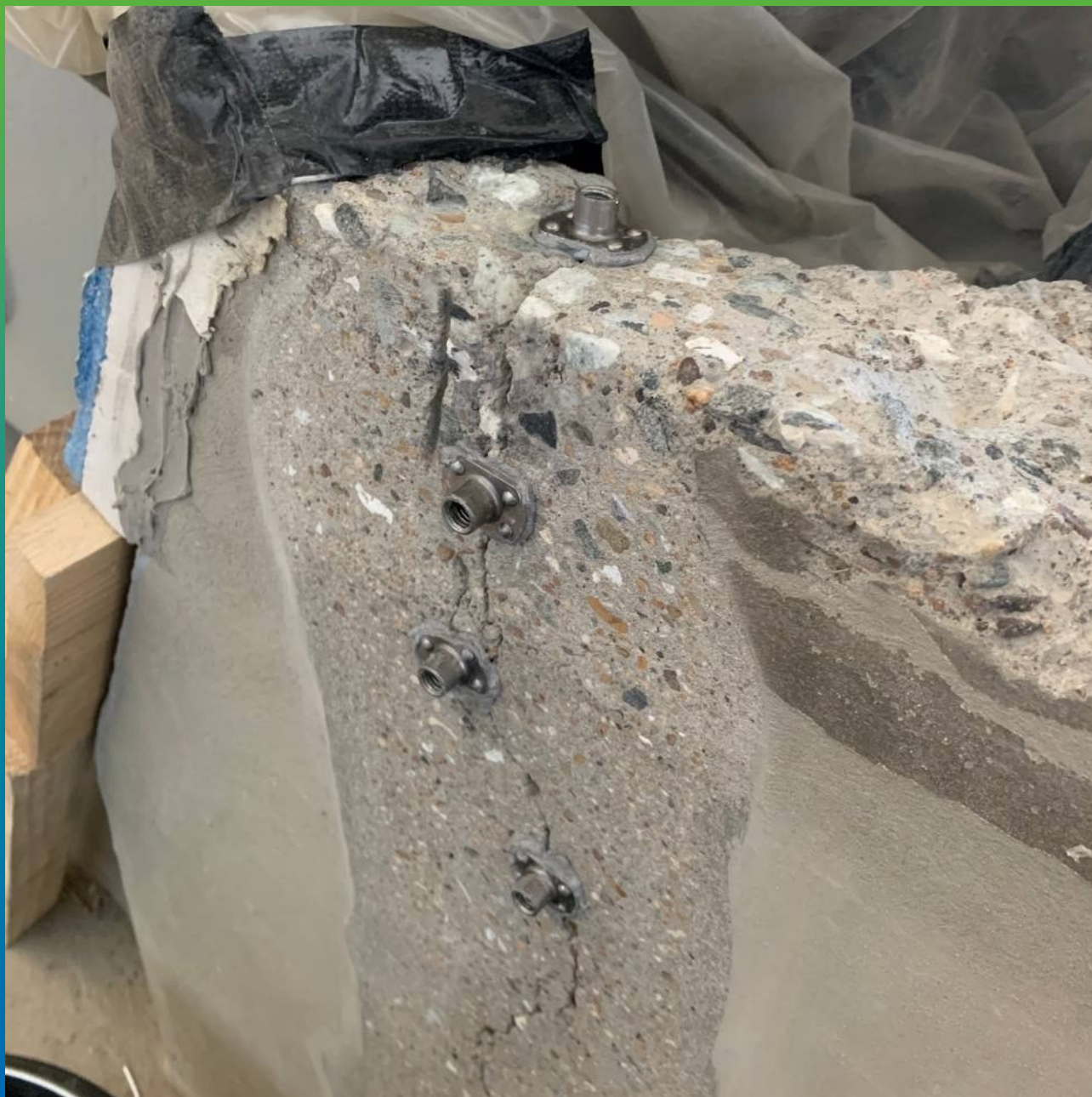
Монтаж пакеров БМ 1189