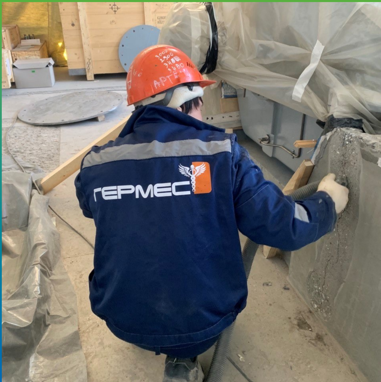
Монтаж пакеров БМ 1189