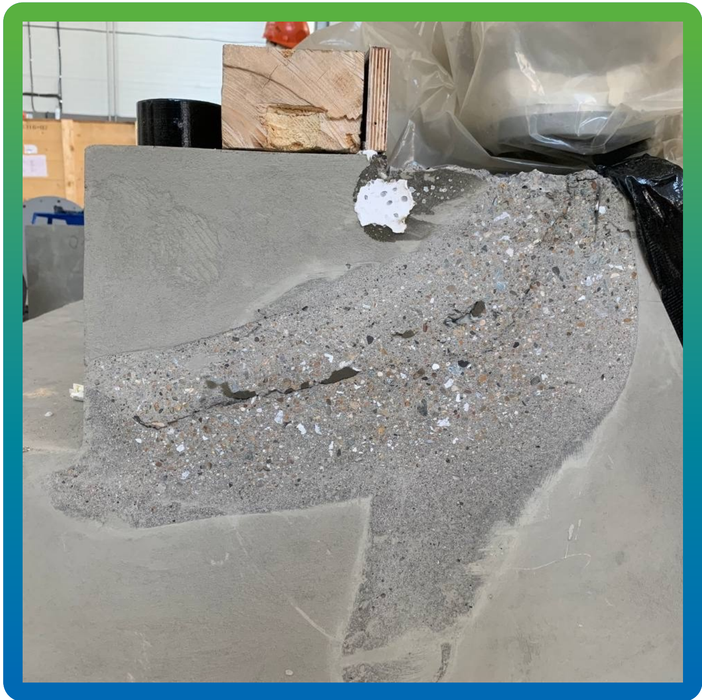
Трещины в бетонном подиуме