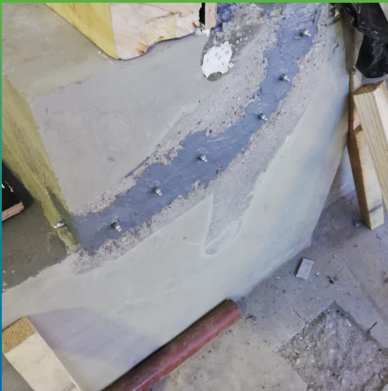
Трещина, проинъектированная Манопокс 352ЛВ