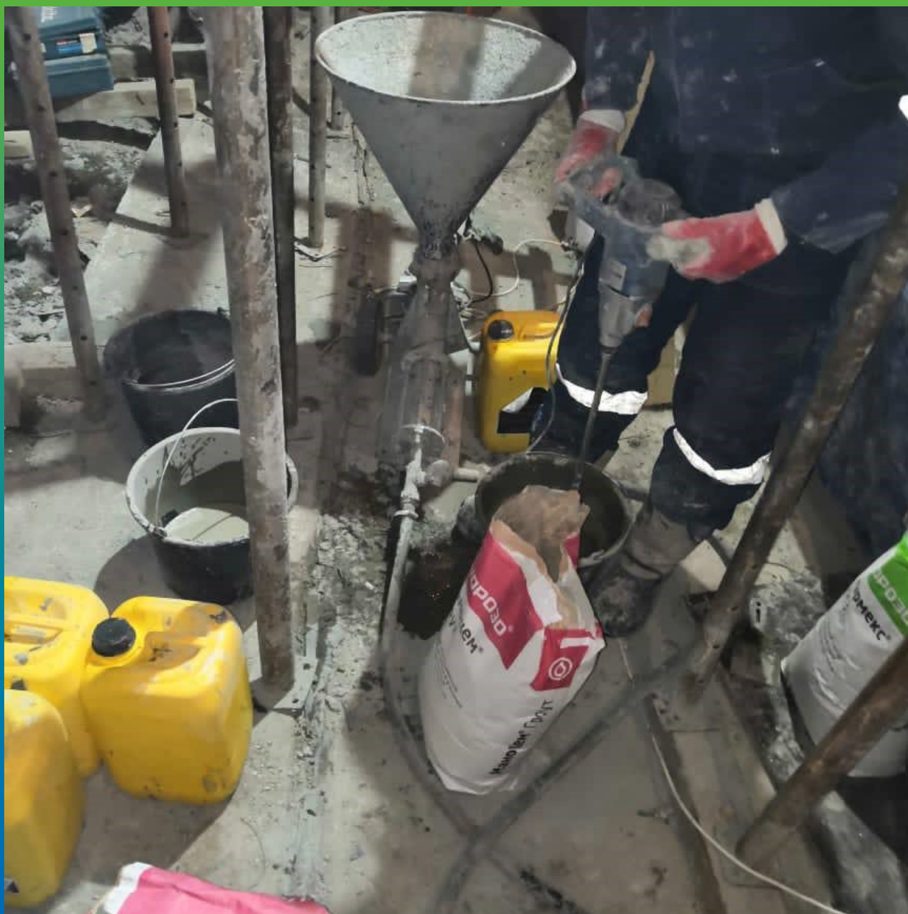
Подготовка насоса и состава Маноцем Груит