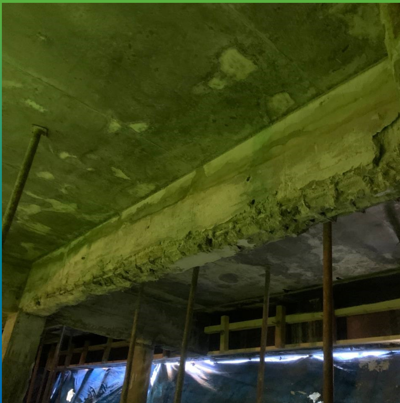
Дефекты жб балок