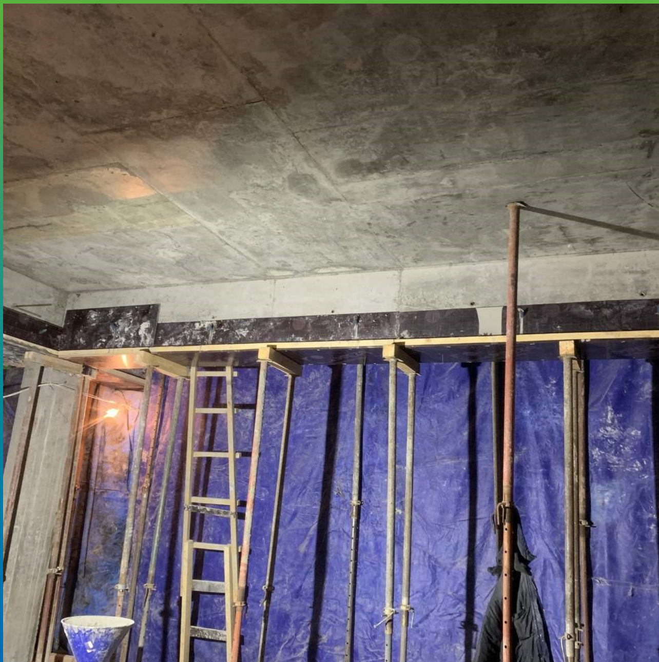
Опалубка, монтированная на поврежденные жб балки