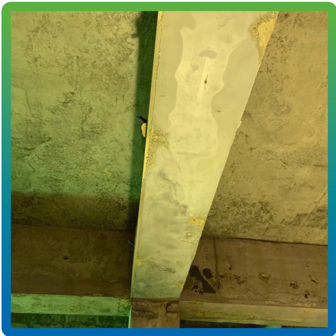
Вид балок после инъектирования и снятия опалубки