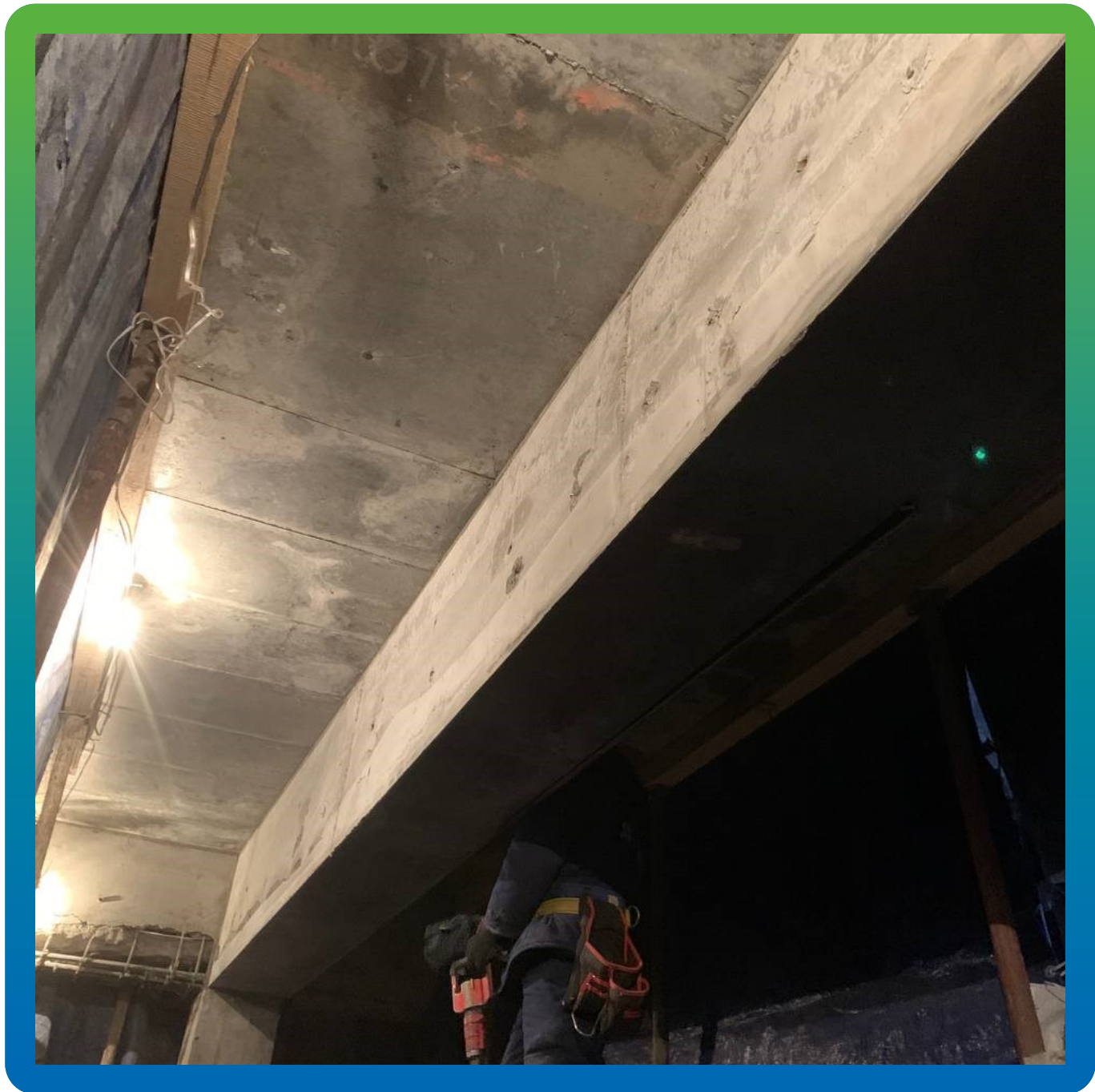
Вид балок после инъектирования и снятия опалубки