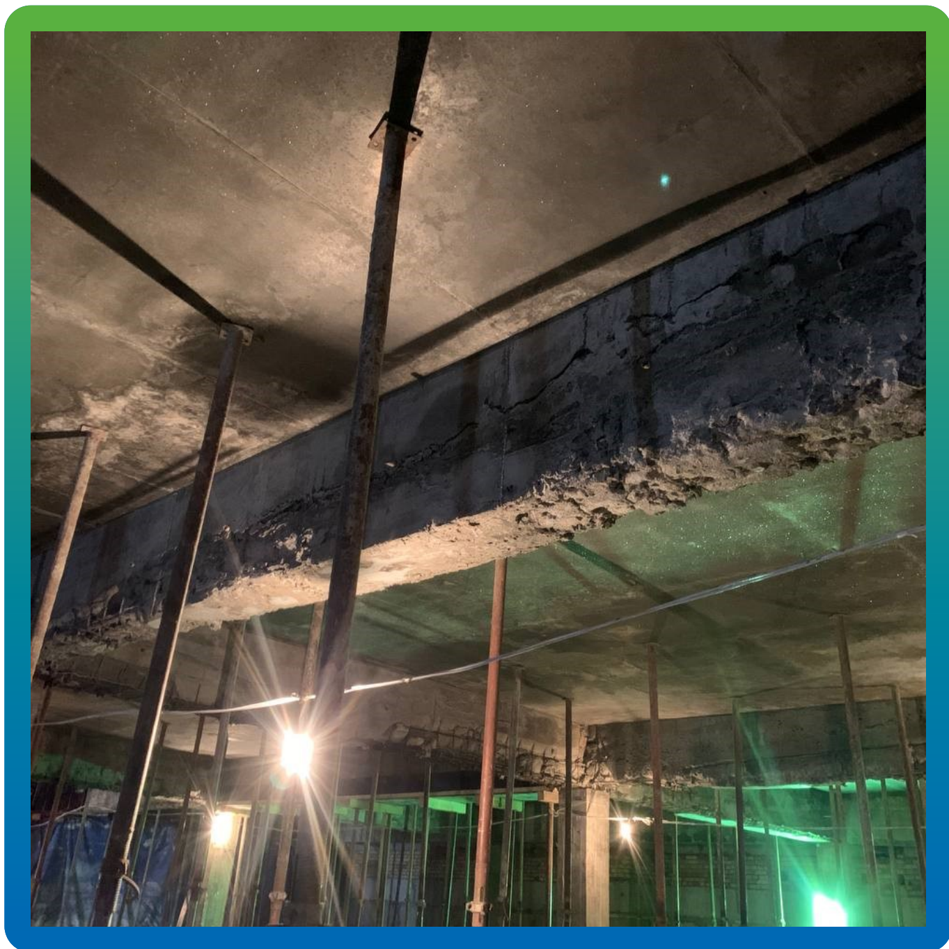
Дефекты жб балок