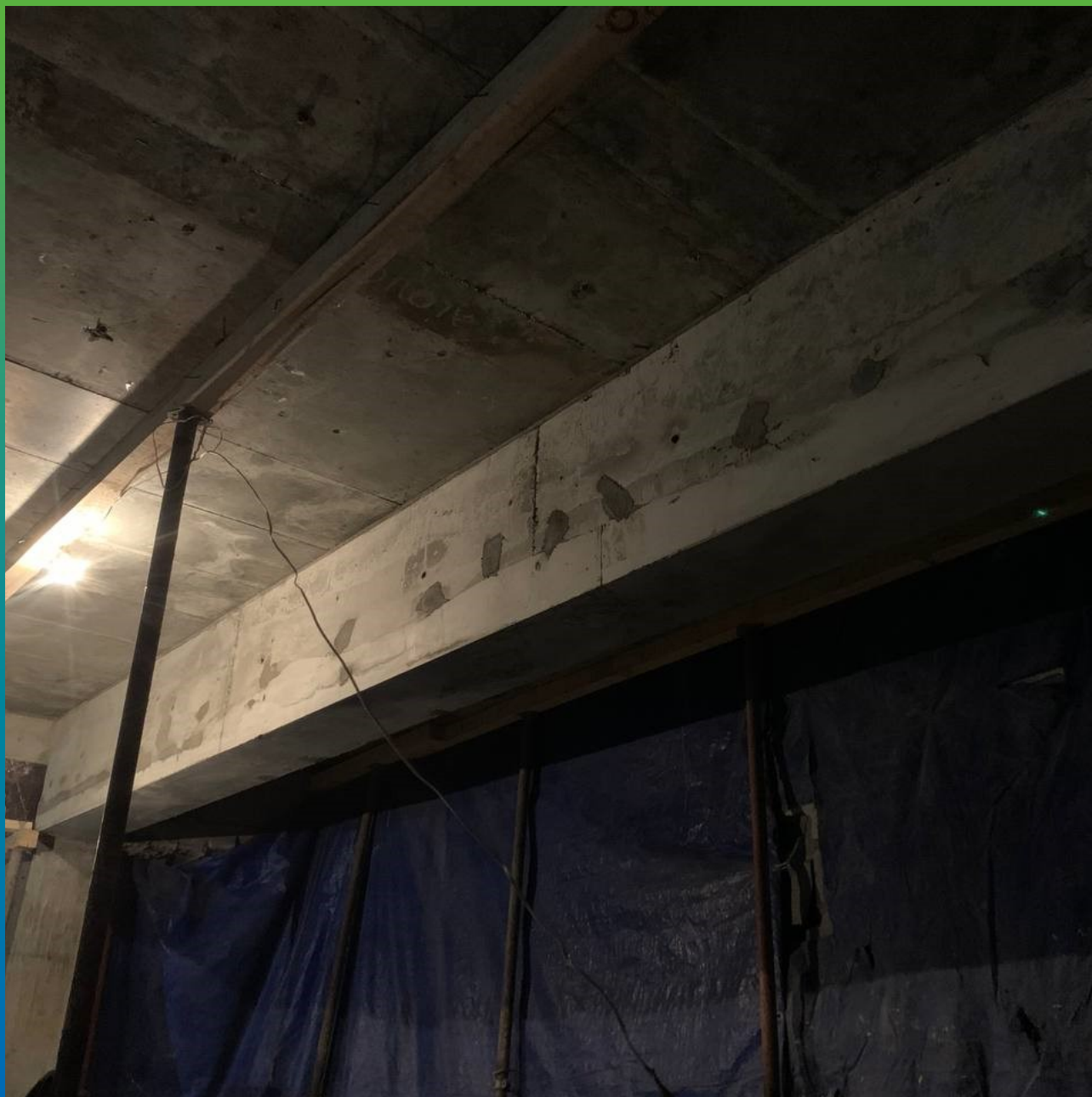
Вид балок после инъектирования и снятия опалубки