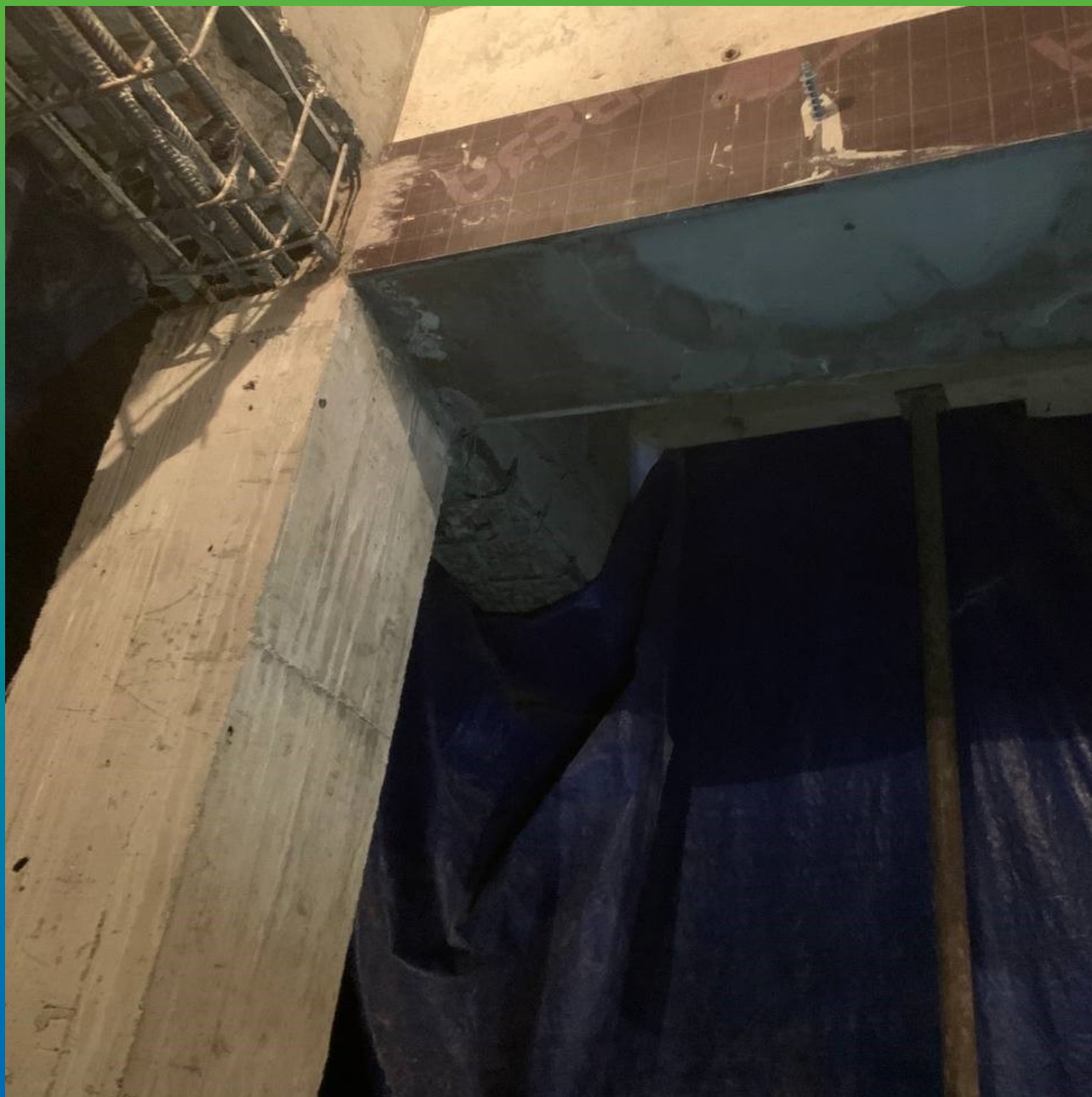
Опалубка, монтированная на поврежденные жб балки