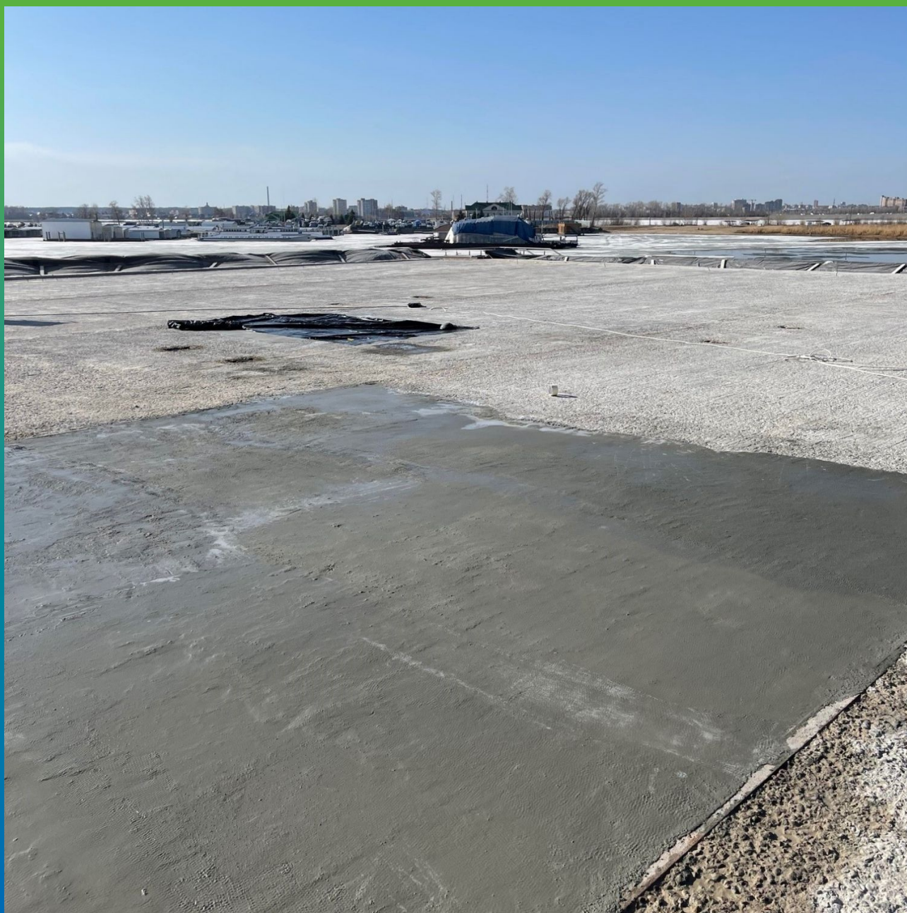
Состав Стармекс ФМ7 на поверхности вертолетной площадки