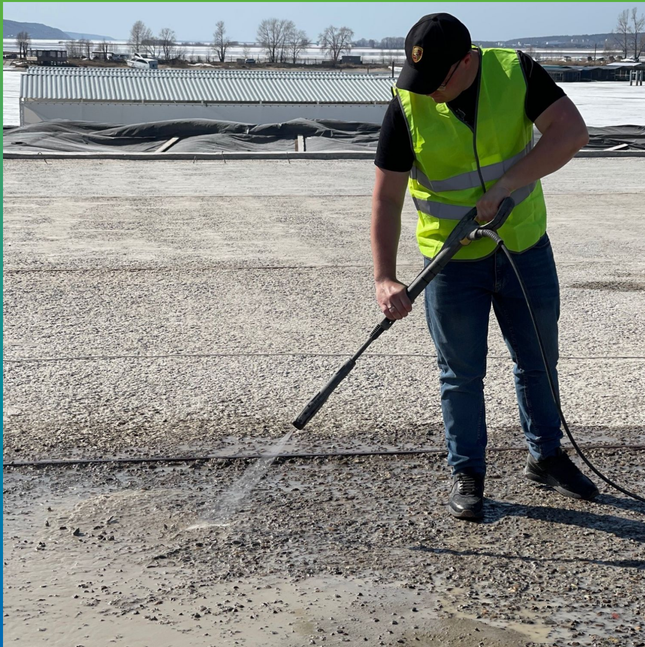
Очистка поврежденного основания