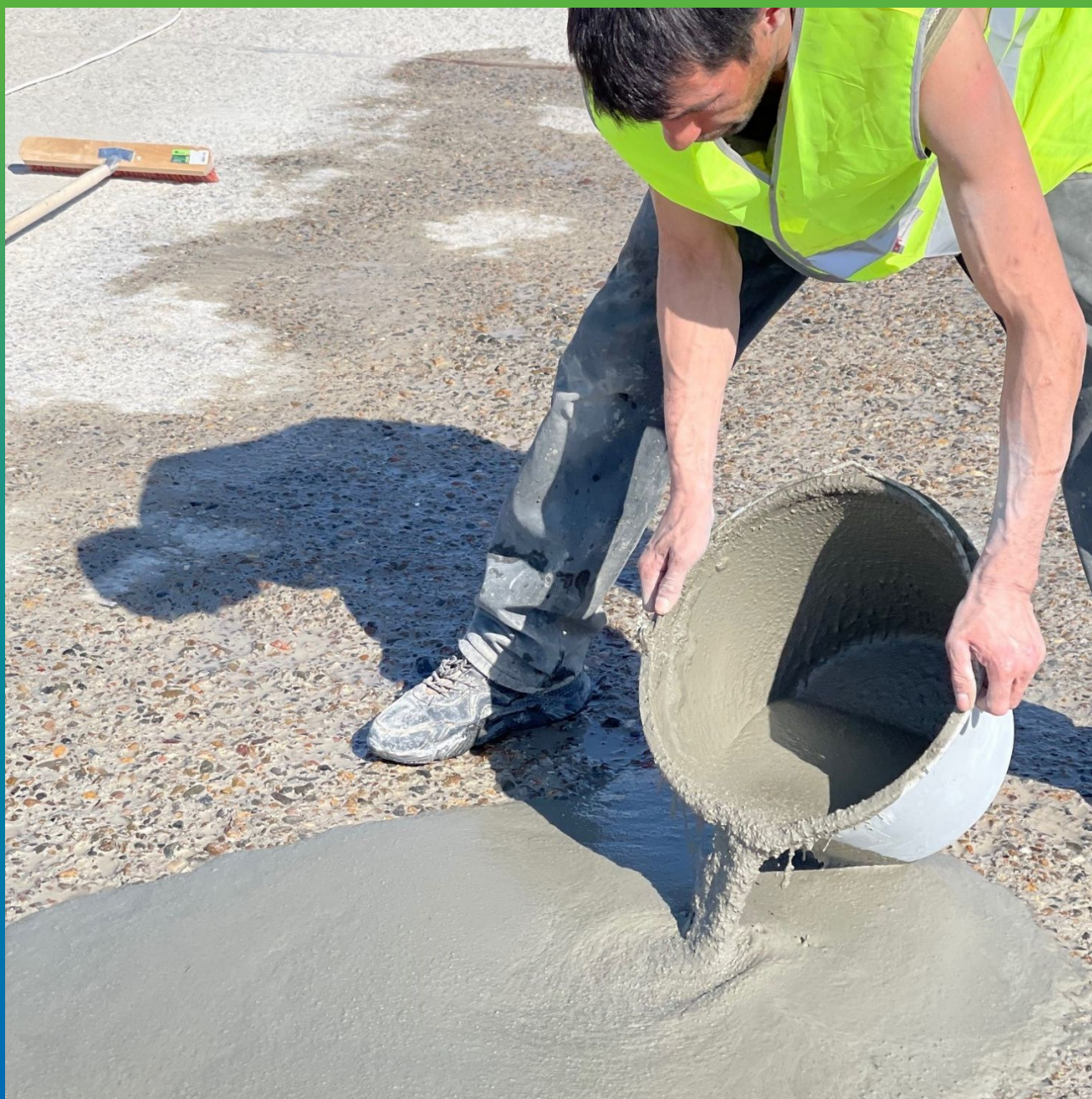
Распределение состава по деффектной поверхности