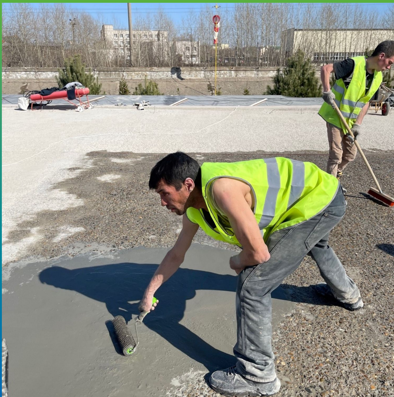
Распределение состава по деффектной поверхности