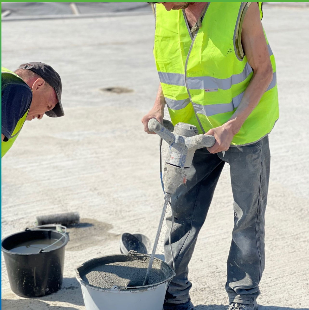
Затворение состава Стармекс ФМ7 водой