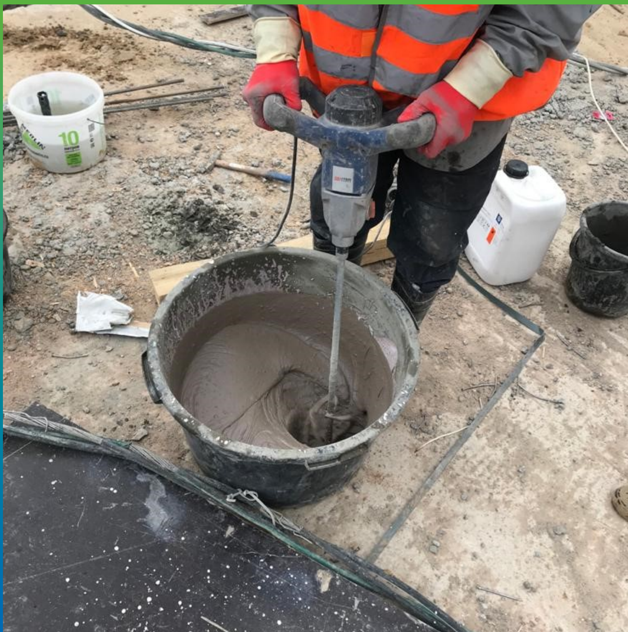
Подготовка состава Стармекс Эласт к работе