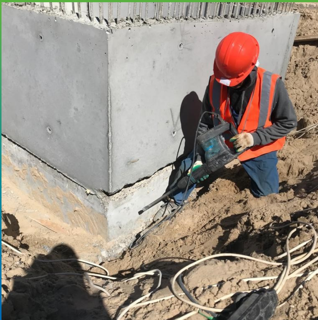
Расшивка холодного шва