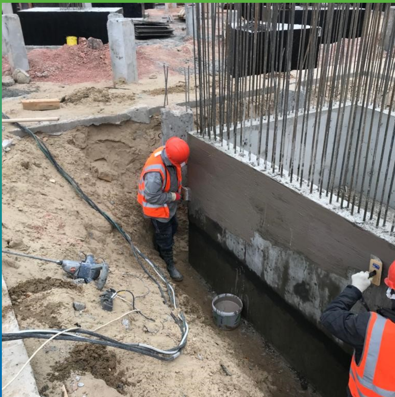
Нанесение состава Стармекс Эласт