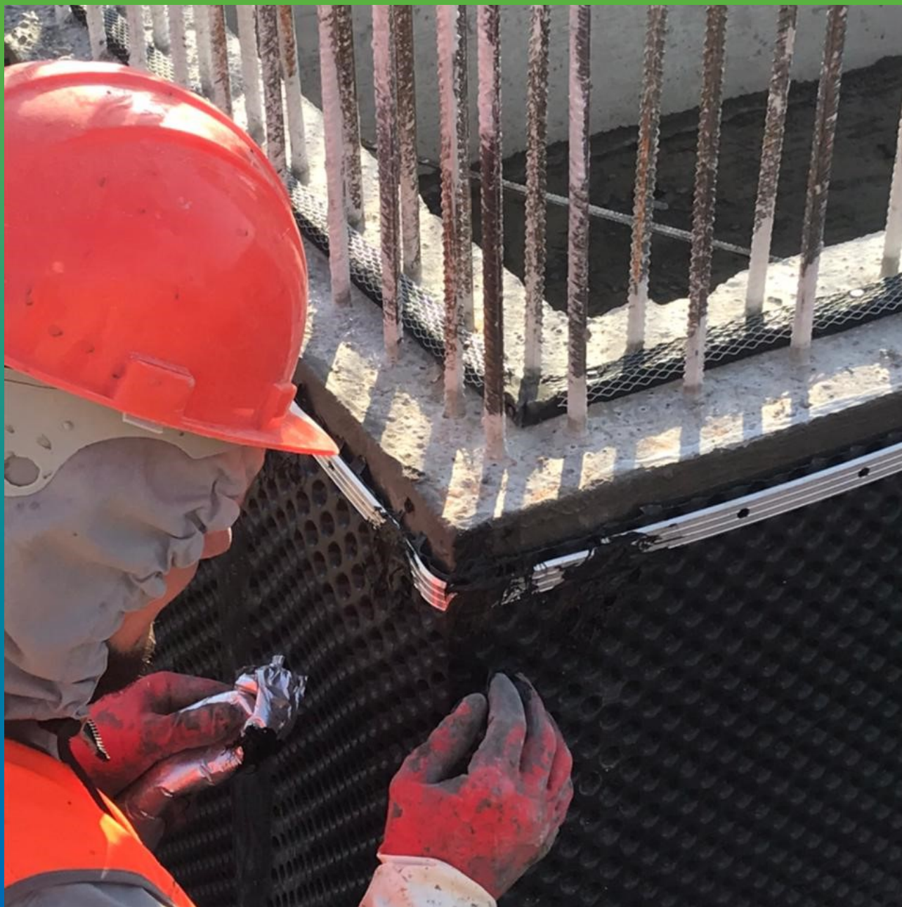
Защита гидроизоляции ПВХ материалом