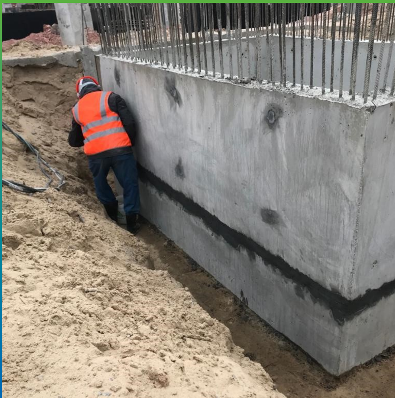
Шов, заполненный составом Стармекс РМЗ