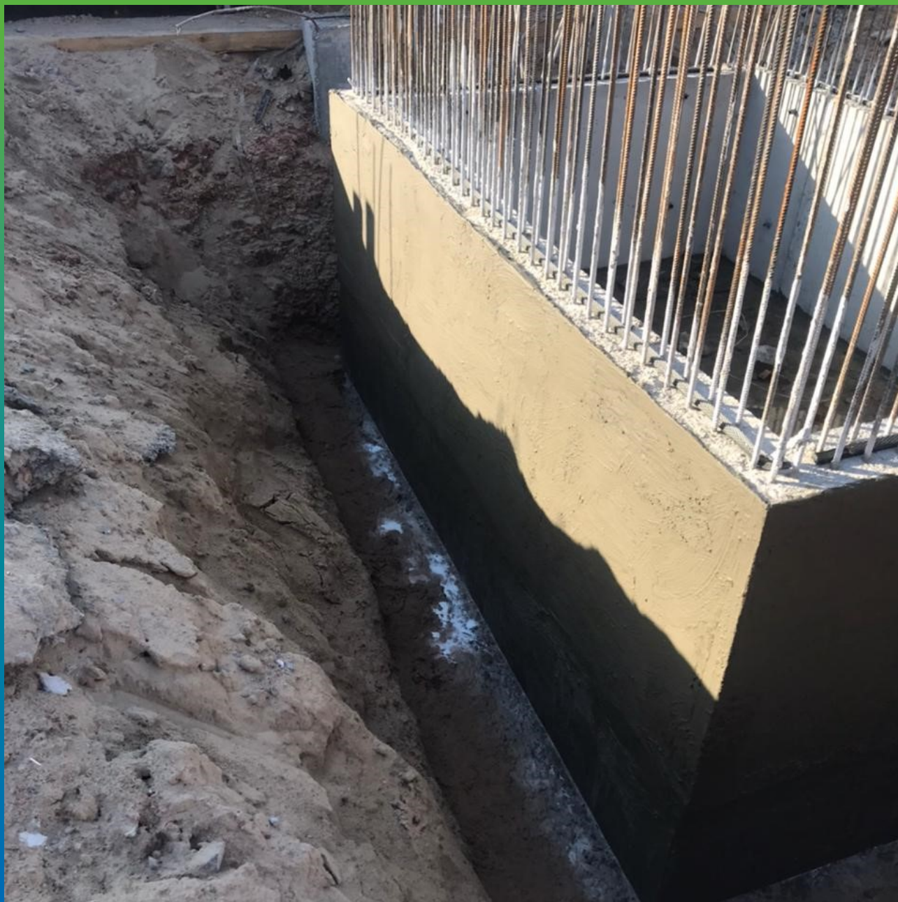
Прямок, обработанный составом Стармекс Эласт