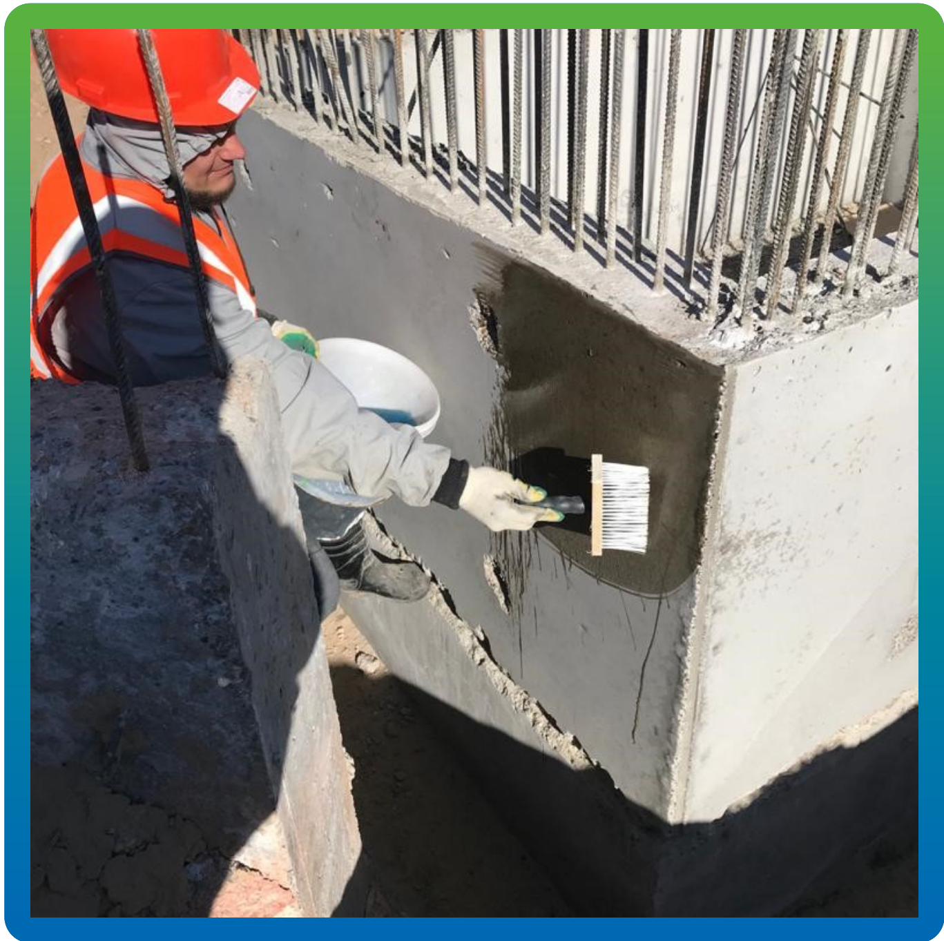
Увлажнение поверхности перед нанесением состава Стармекс Эласт