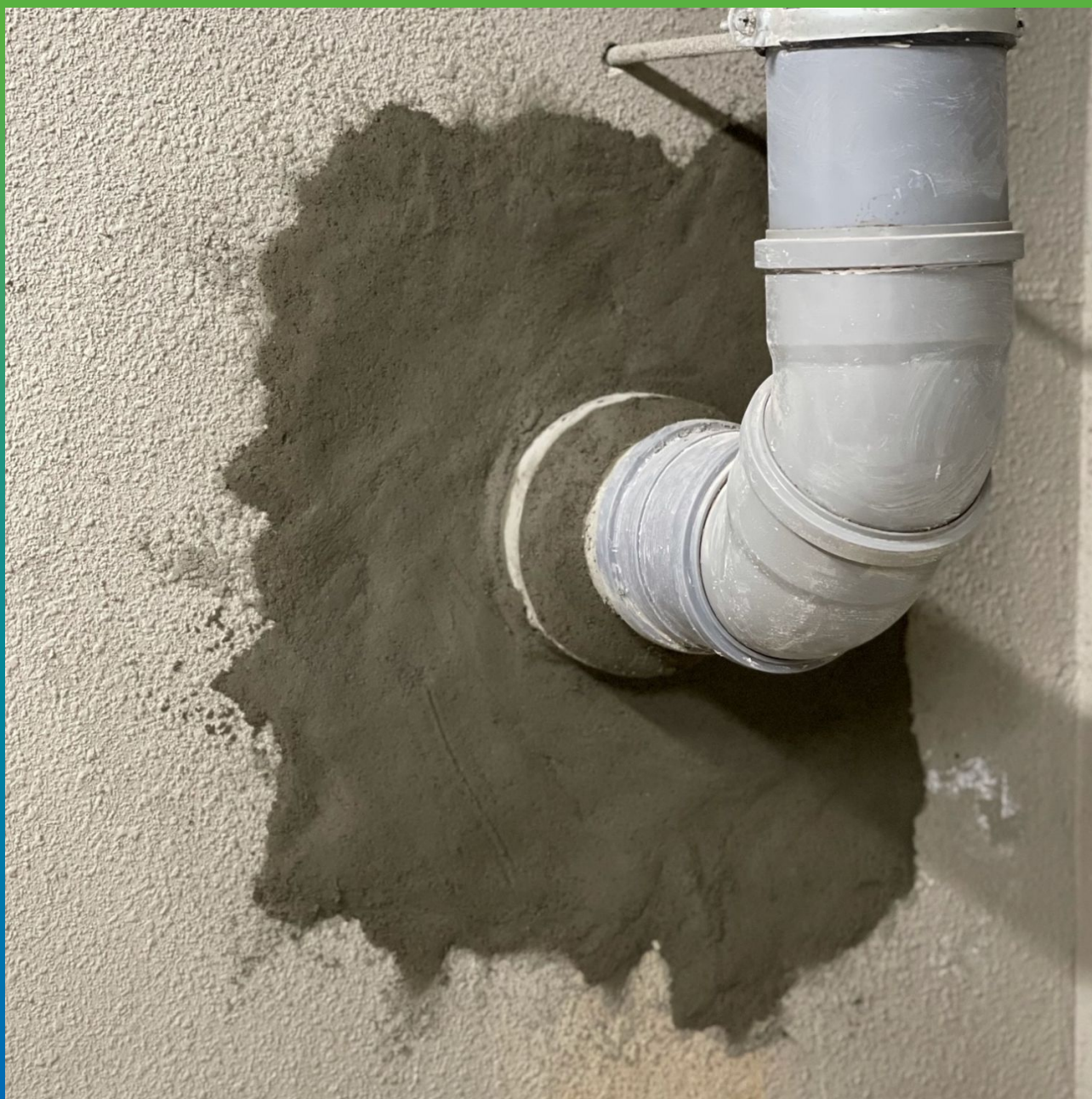
Ввод коммуникаций, заполненный составом Стармекс РМЗ