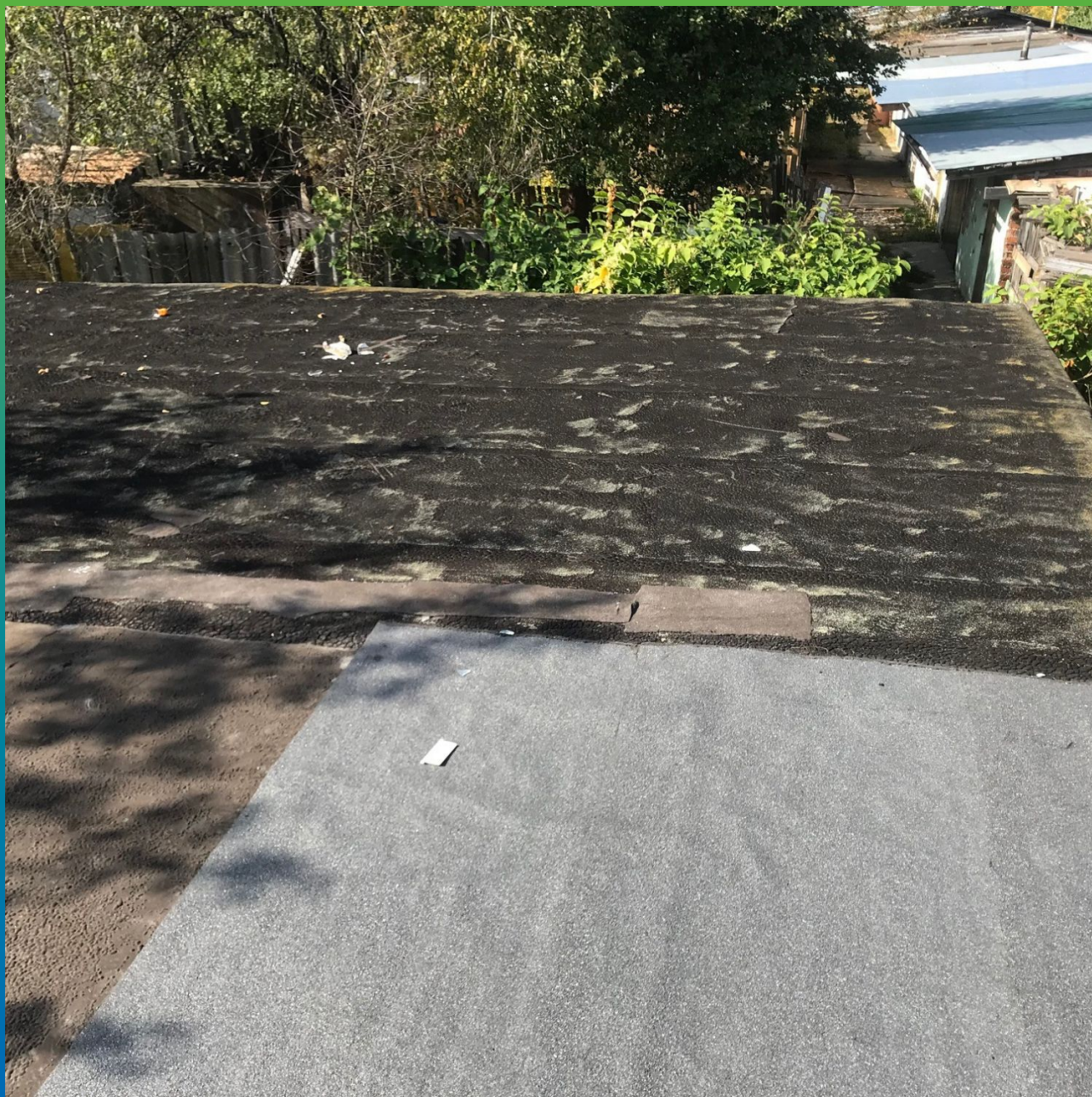
Вид старой битумной кровли