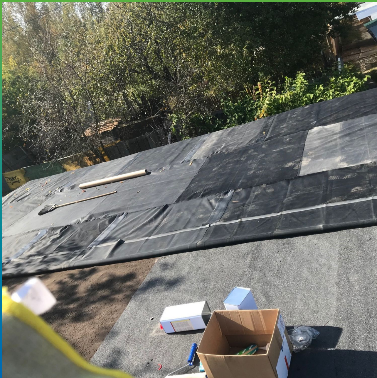
Раскатка мембраны ЭПДМ Преласта СТ1.2 по основанию