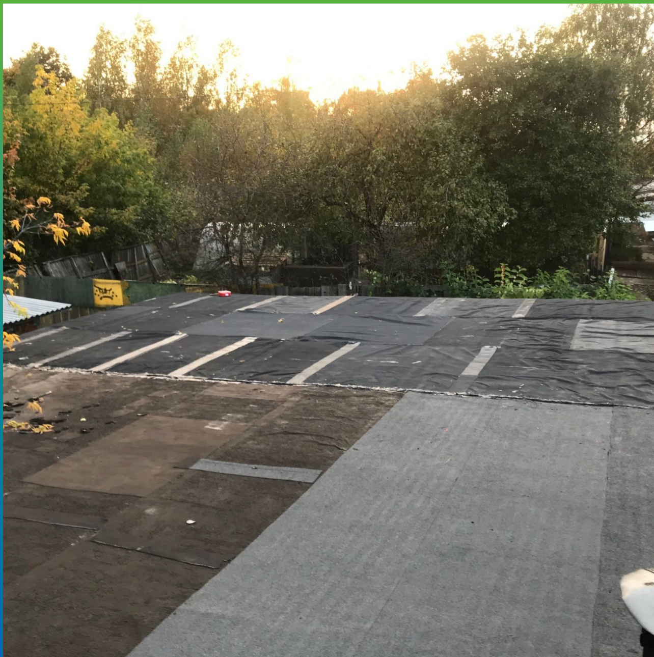
Итоговый вид мембраны после клеевого метода монтажа