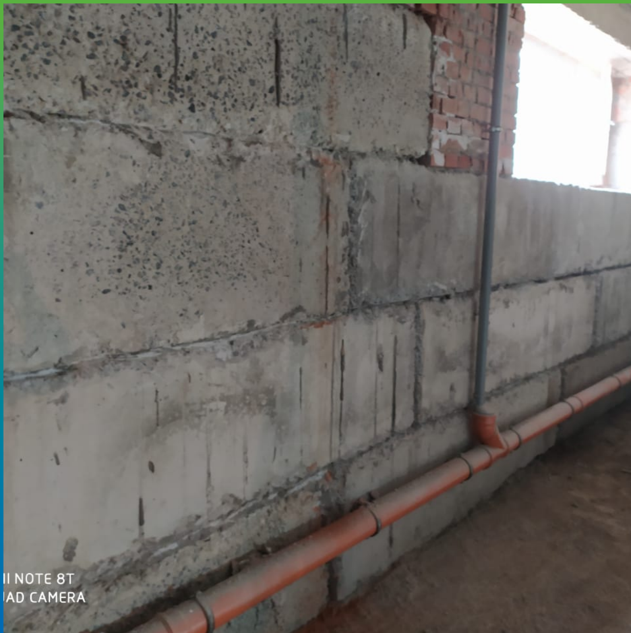
Вид швов ФБС до гидроизоляции