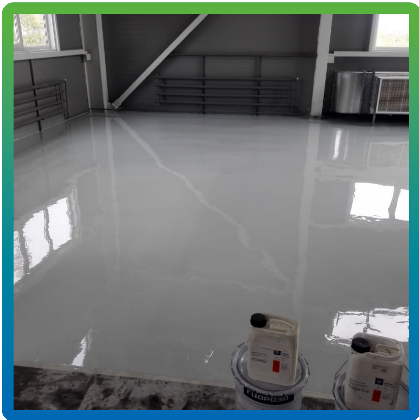
Финишный вид цветного эпоксидного покрытия ДенСтол ЭП 501