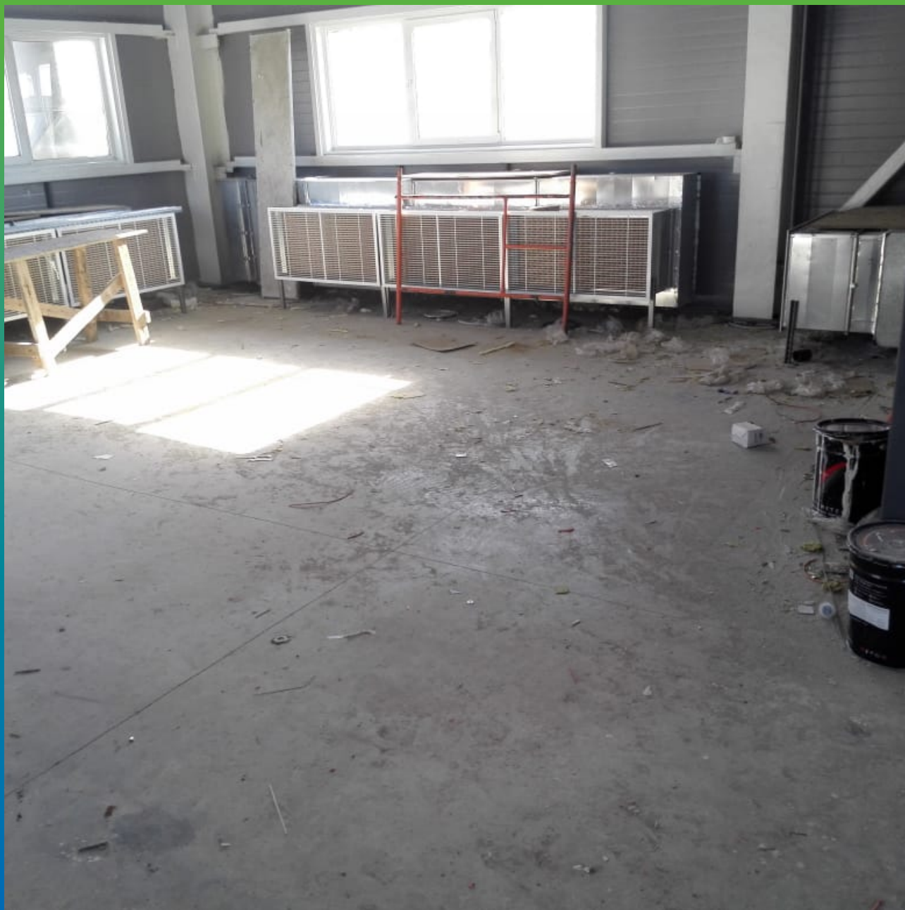
Вид бетонного пола до нанесения покрытия