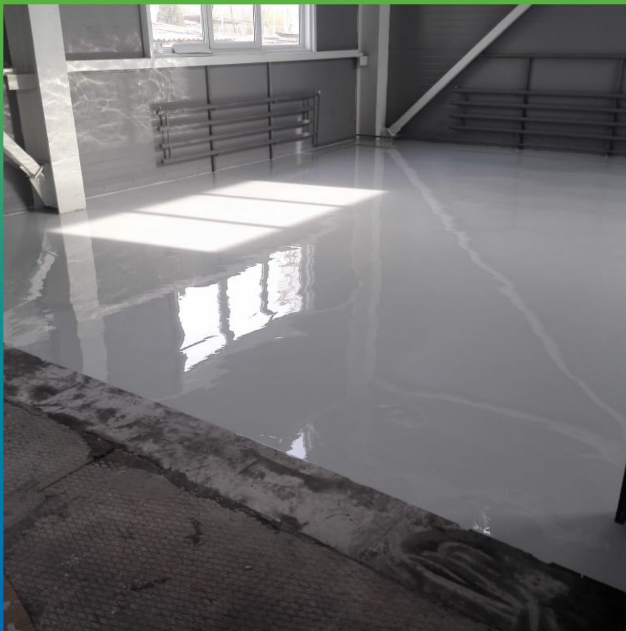
Финишное полимерное покрытие