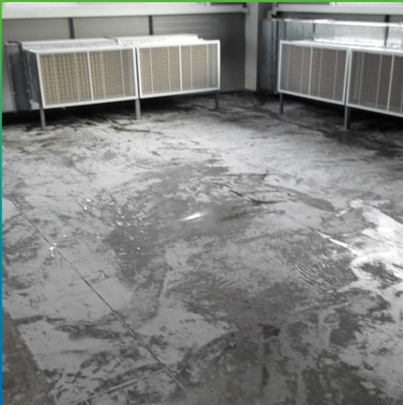
Поверхность, загрунтованная ДенсТоп ЭП 104