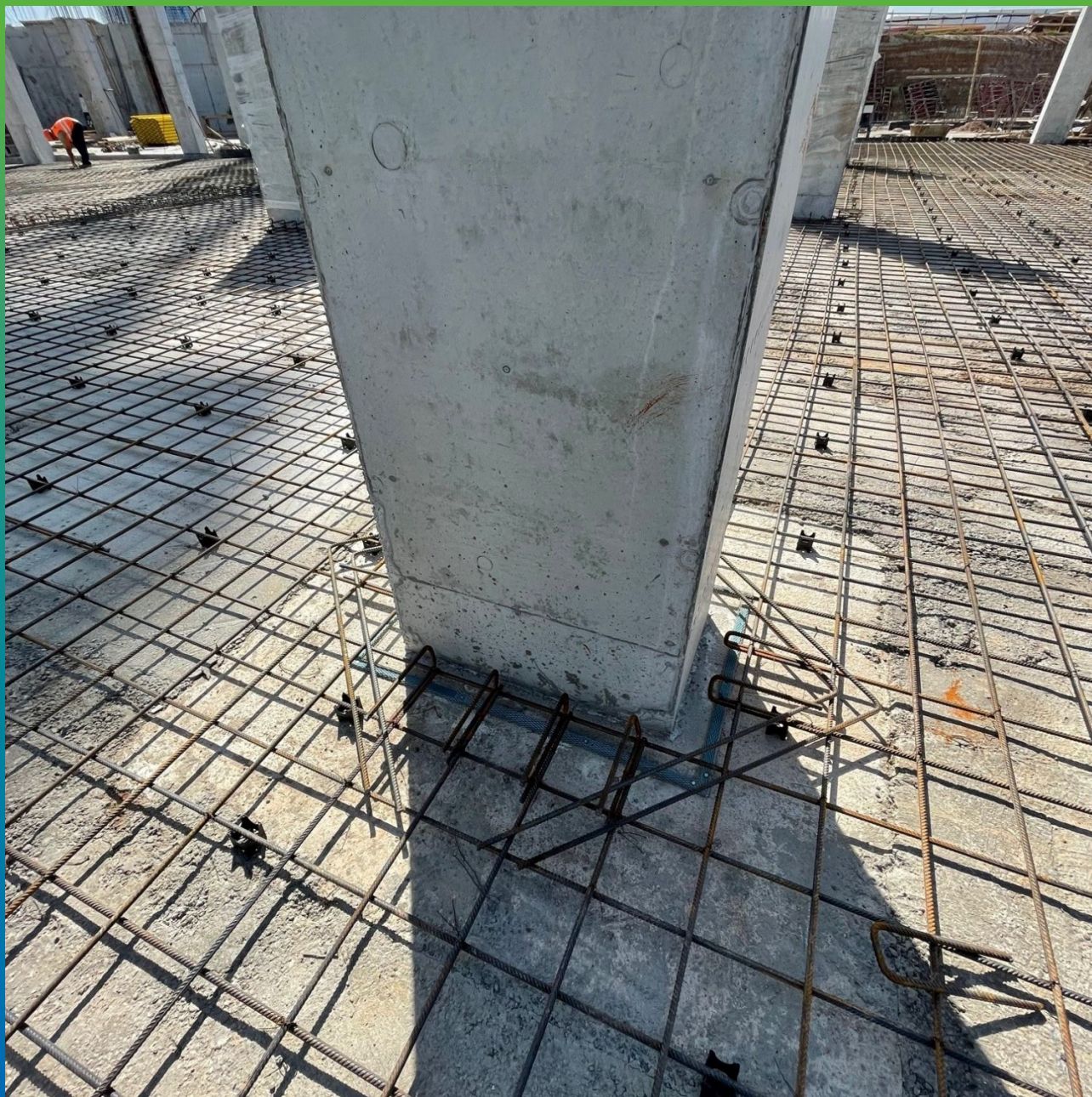
Манодил Свелл, монтированный в области колонн