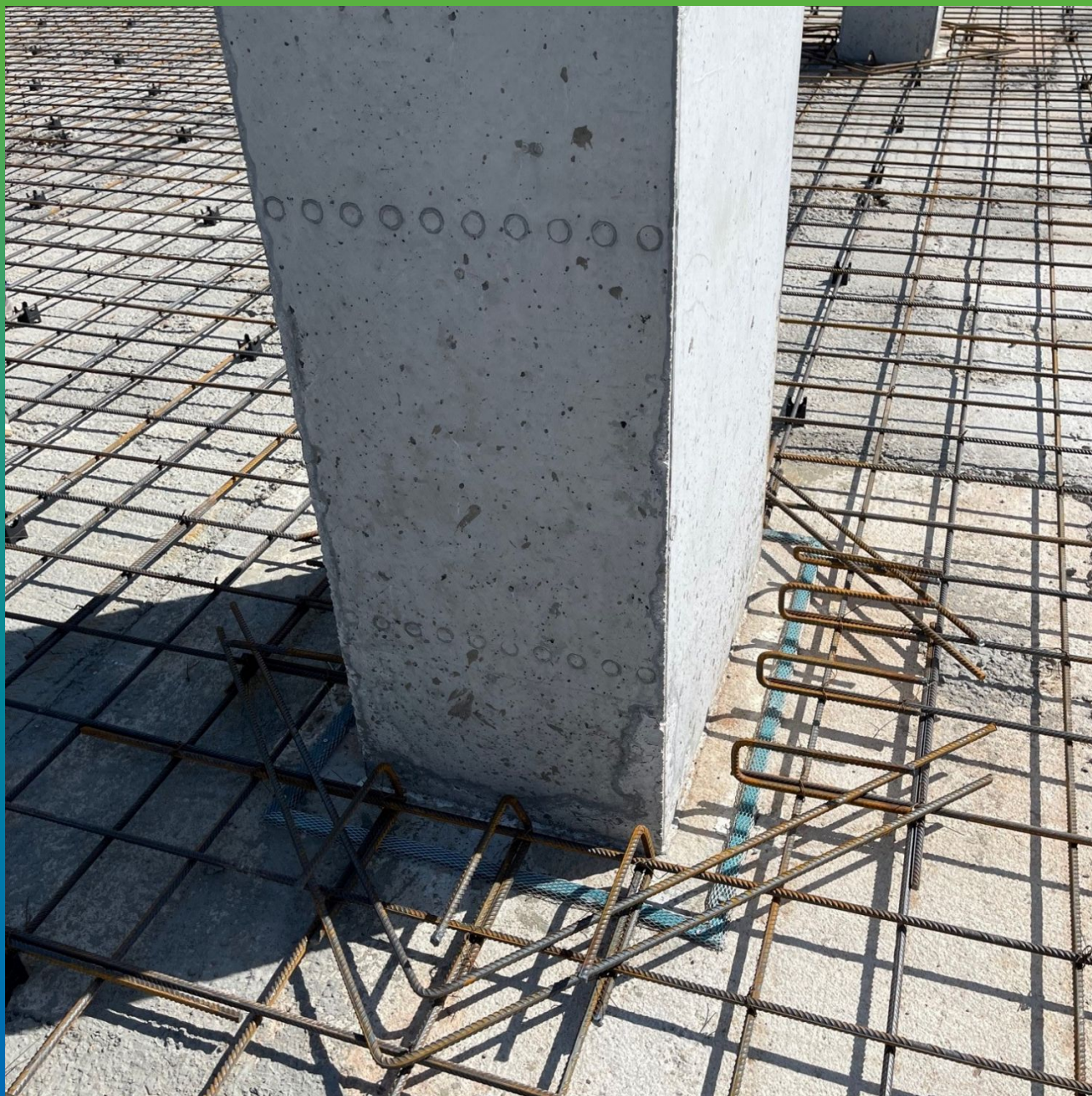
Монтаж профиля Манодил Свелл X 20*10 в области колонн