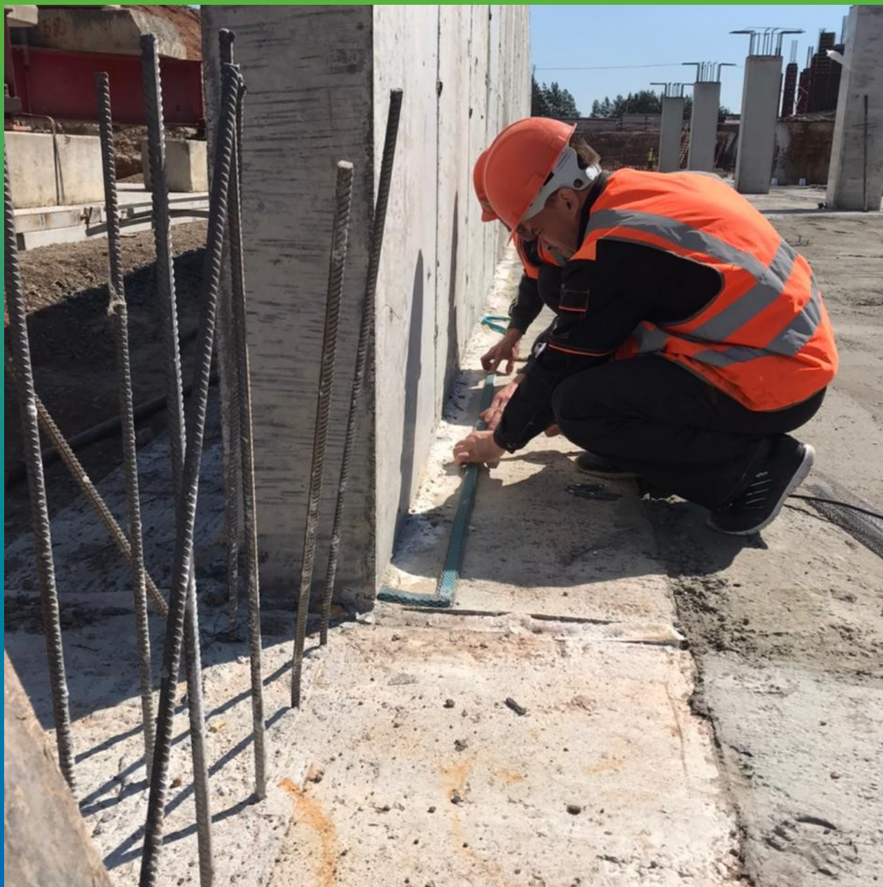
Монтаж профиля Манодил Свелл X 20*10 в области стен