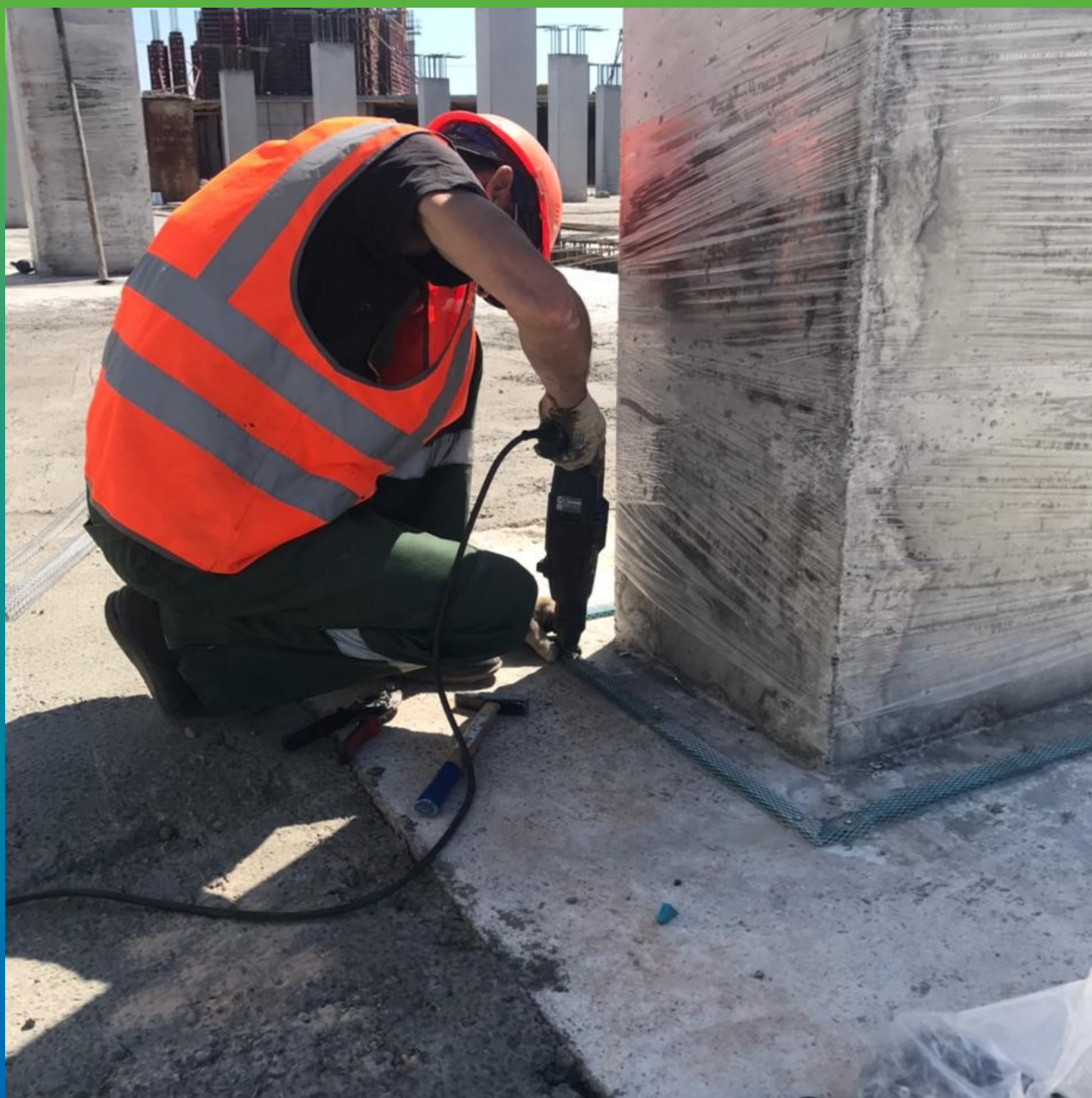
Монтаж профиля Манодил Свелл X 20*10 в области стен