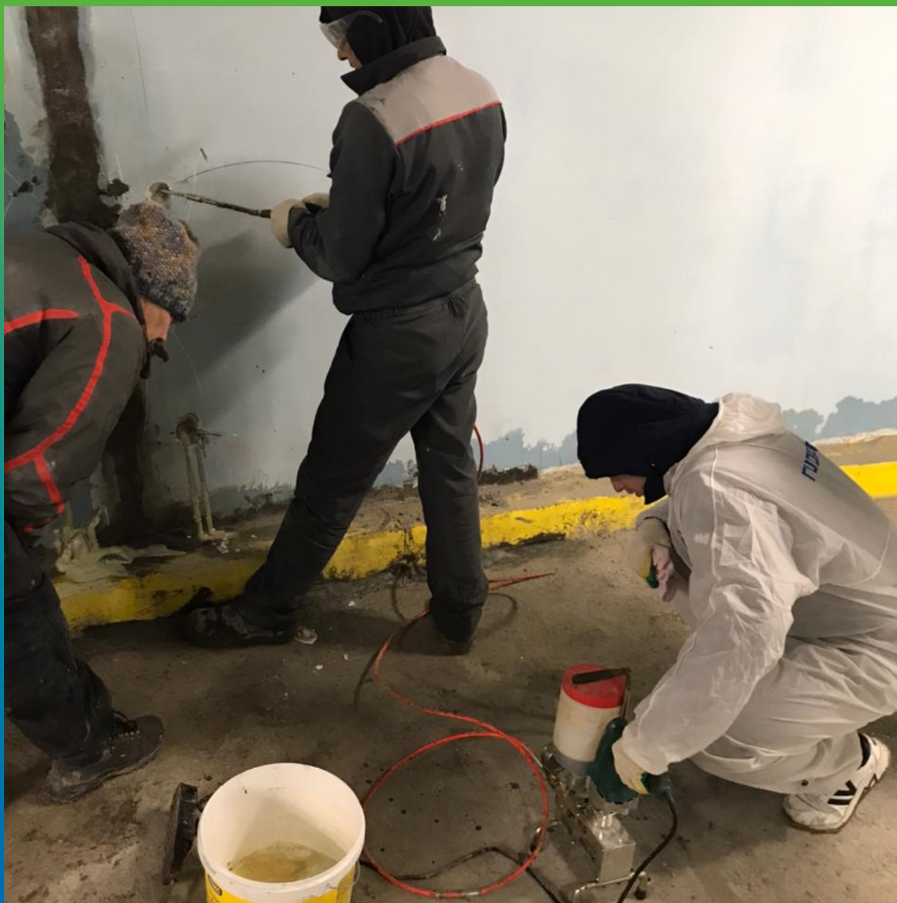
Инъектирование Манопур 15 при помощи электрического поршневого насоса