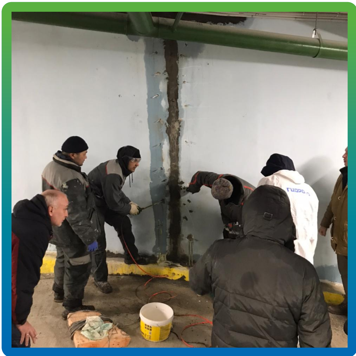
Зачеканка штрабы и установка пакеров