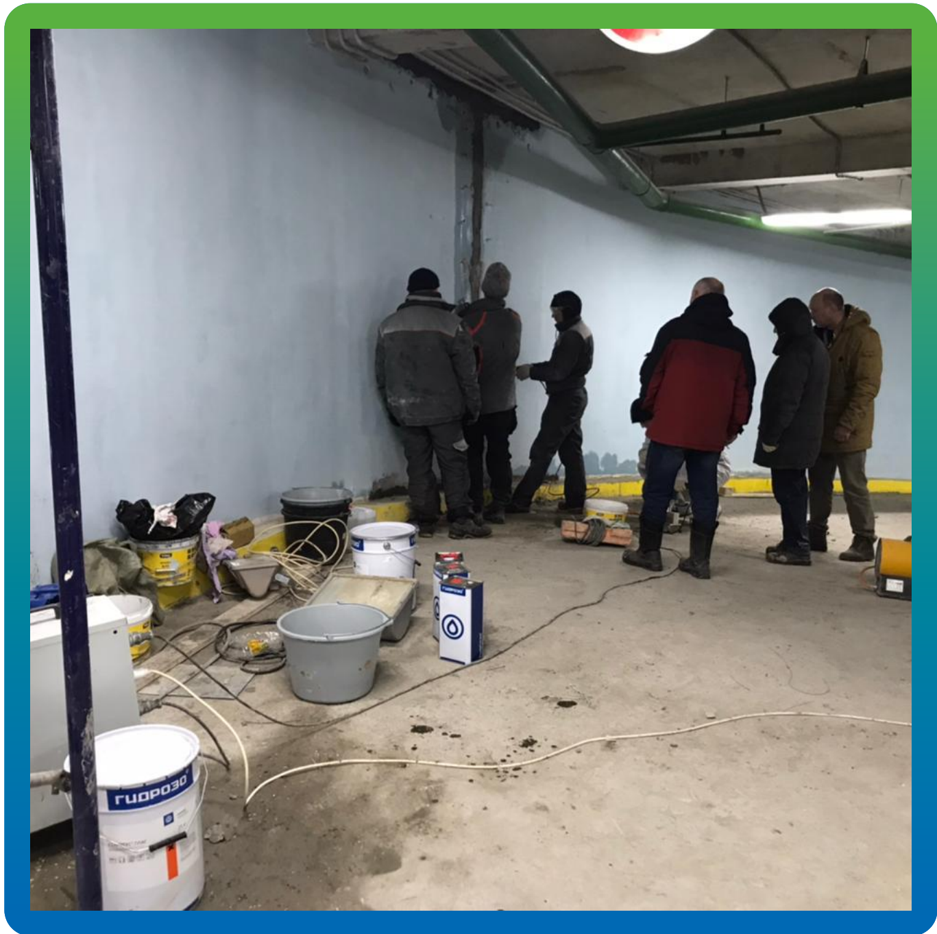
Манопур 15 и Манопур 143 на объекте