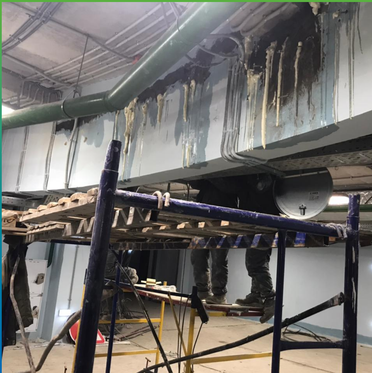
Инъектирование Манопур 15 + Манопур 143