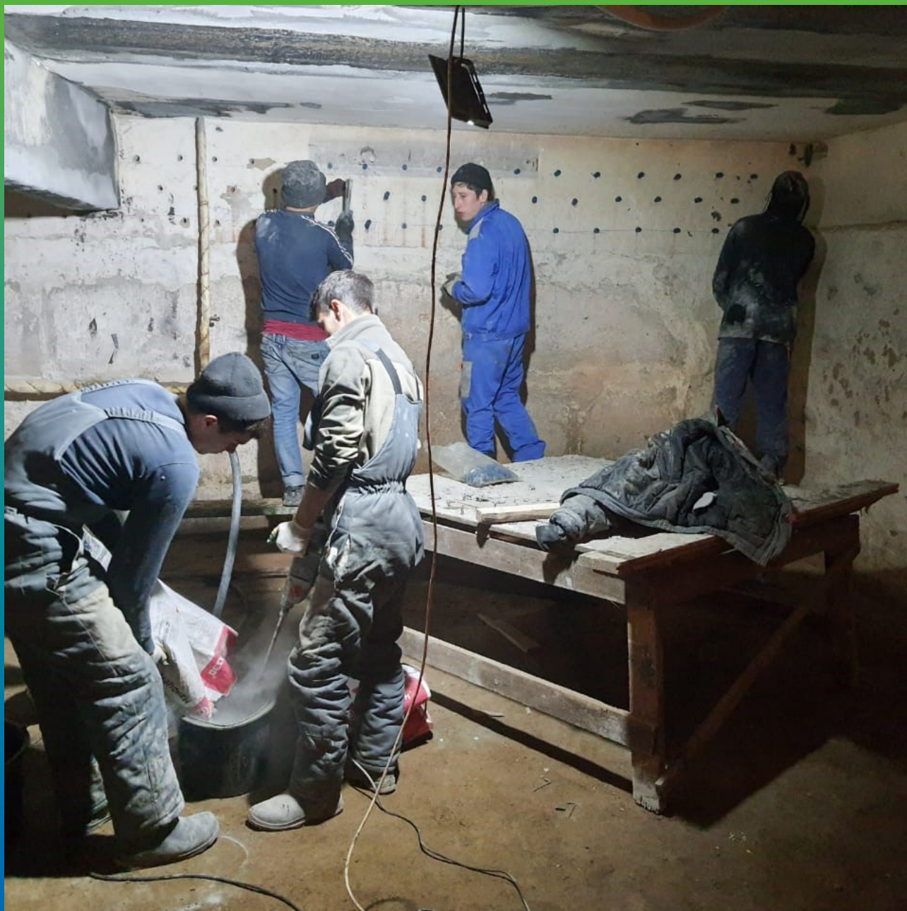
Подготовка стен к инъектированию составом Маноцем Гроут