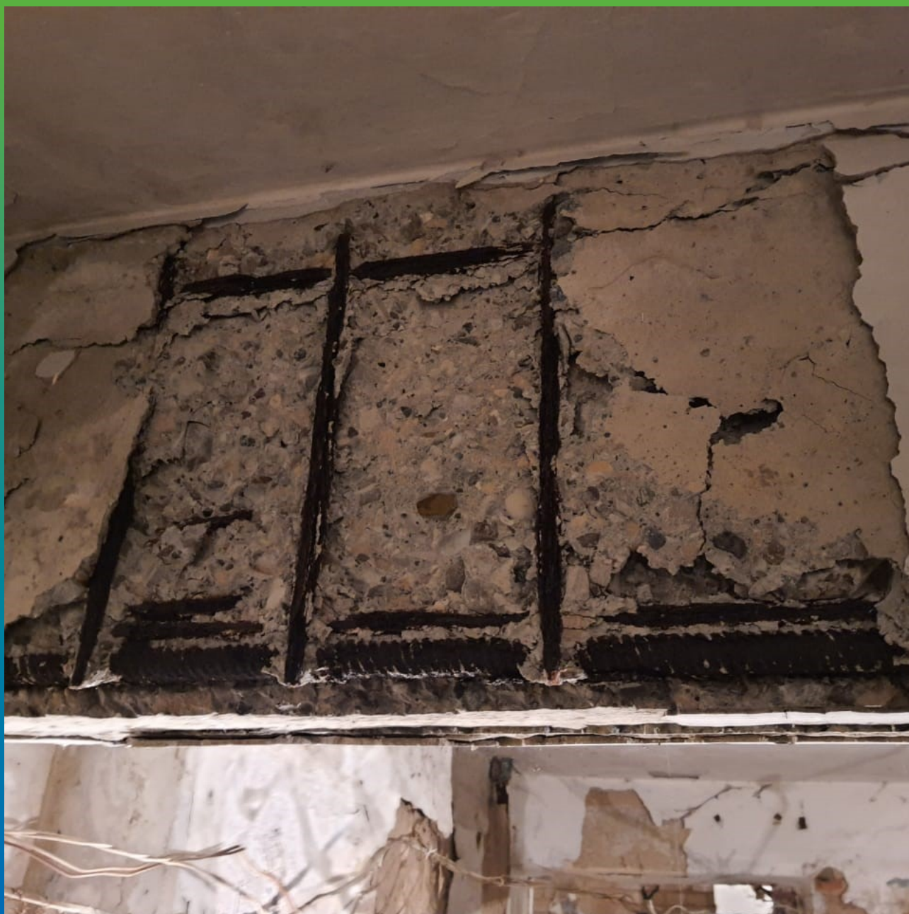
Внешний вид объекта до начала работ.