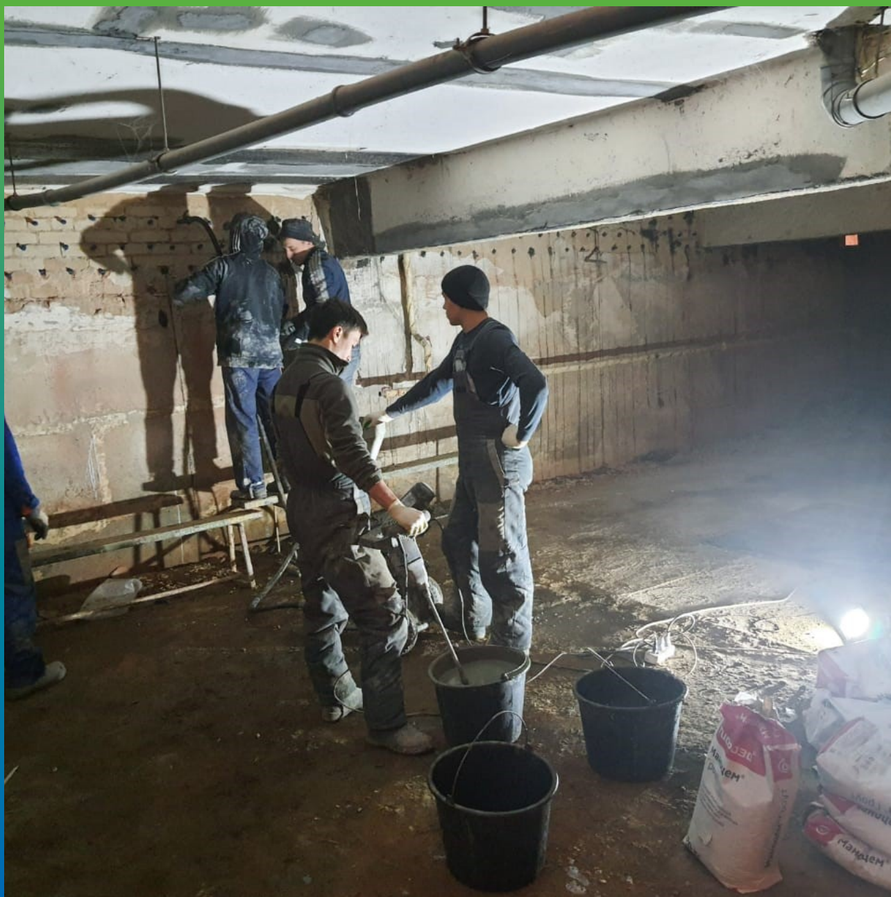
Инъектирование стен составом Манцем Грут