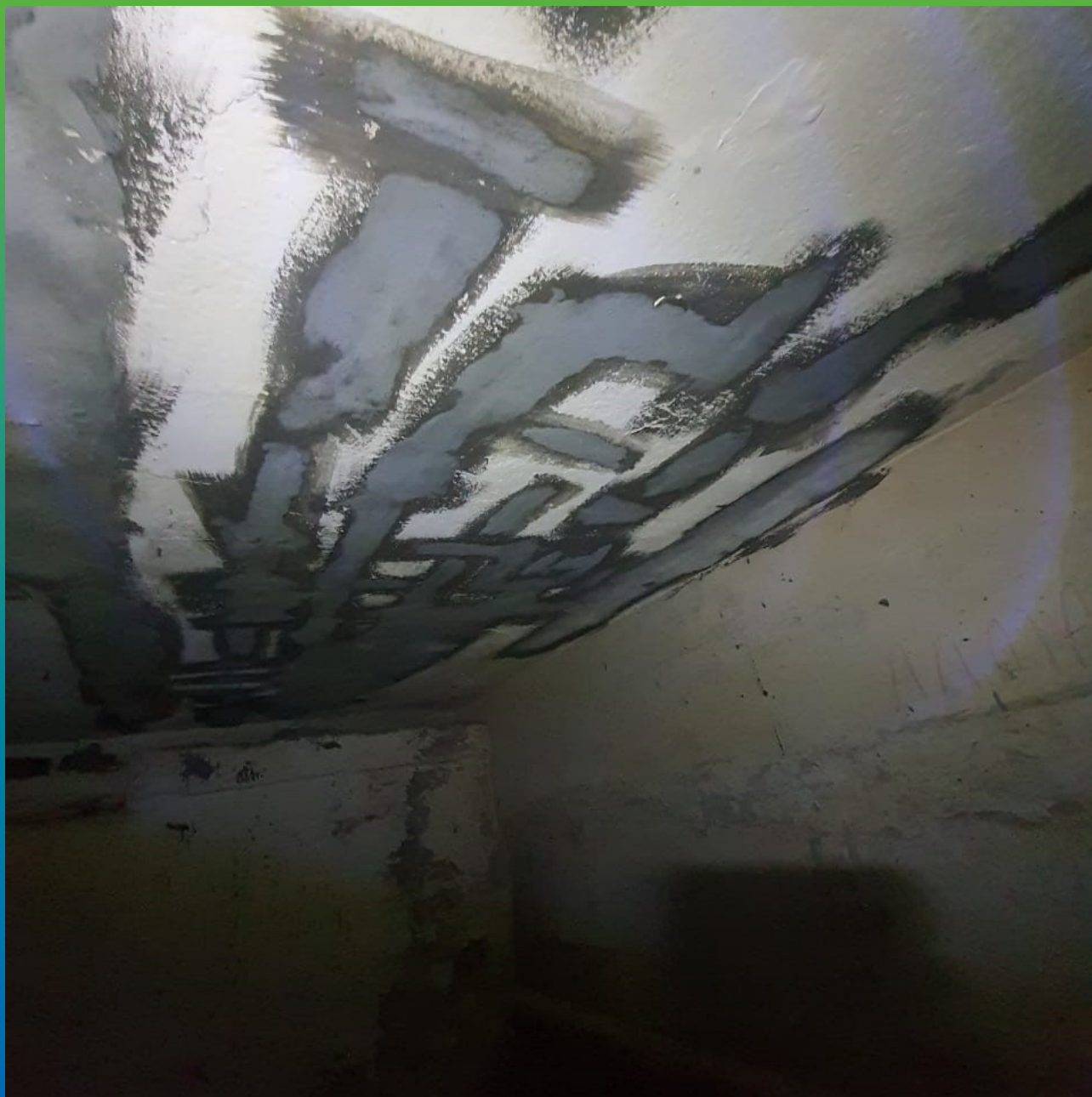
Отремонтированное основание составом Стармекс РМЗ