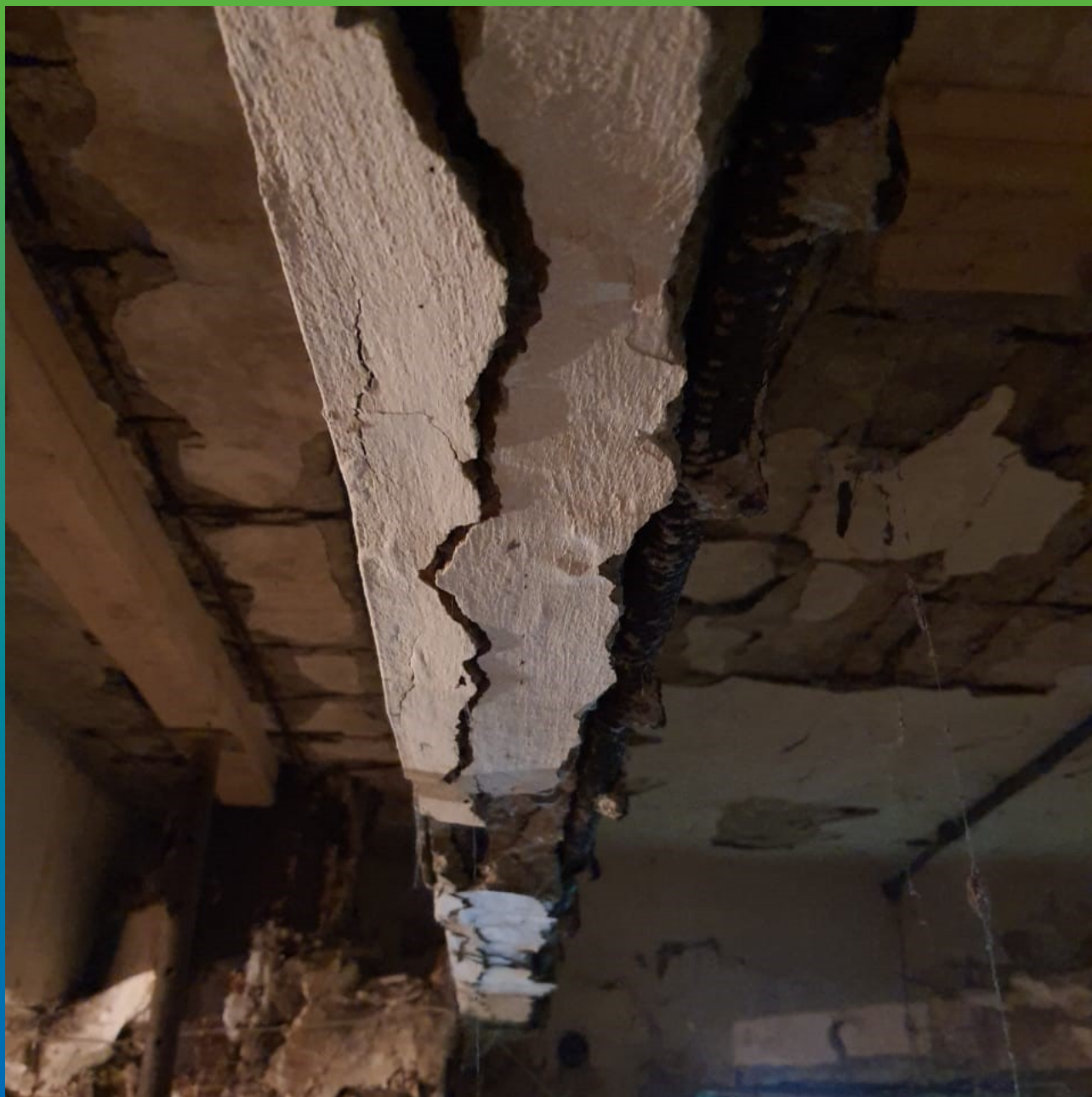
Внешний вид объекта до начала работ.