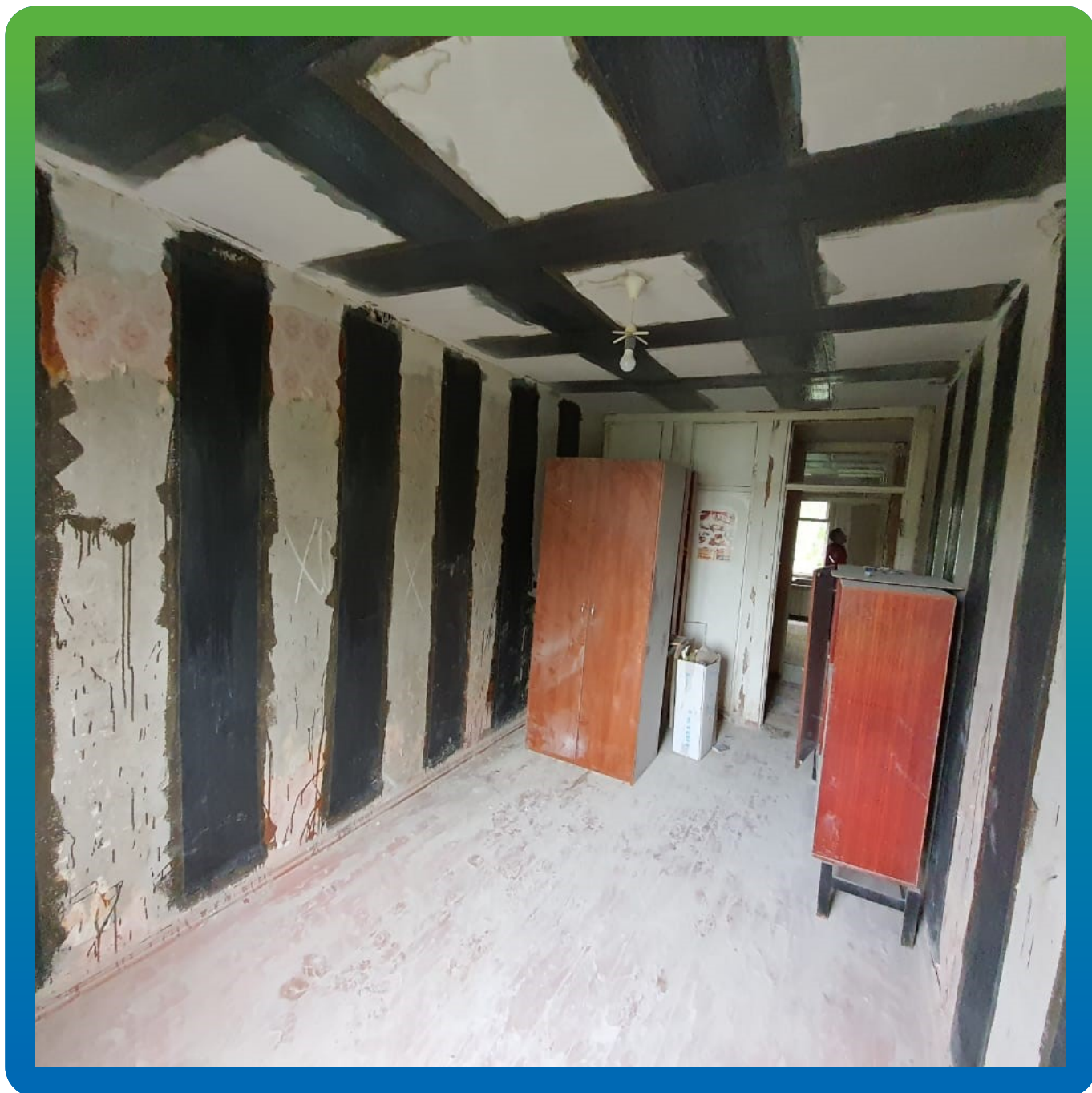
Монтаж КСУ на стеновых поверхностях