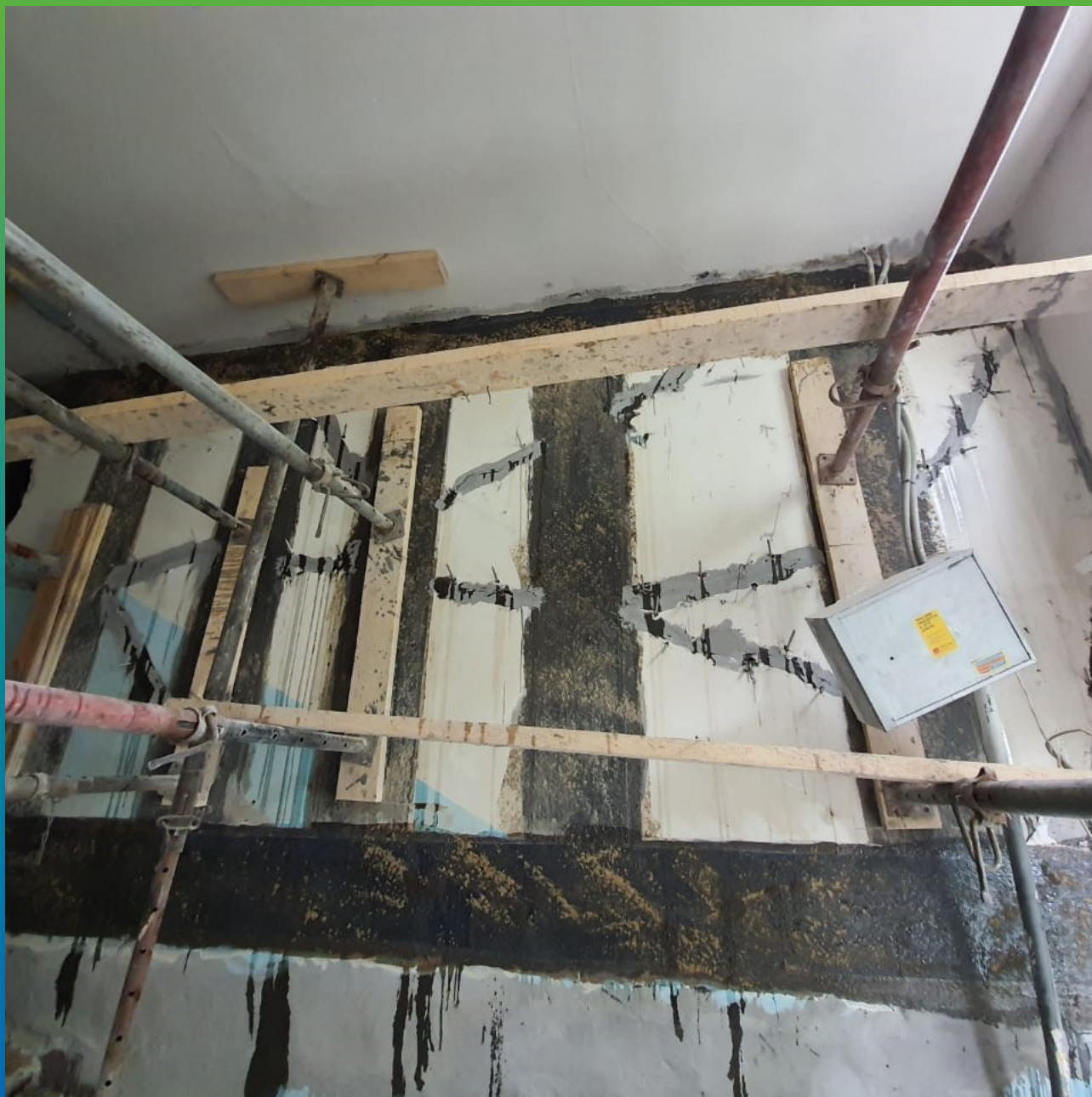
Внешний вид стены после проведения работ