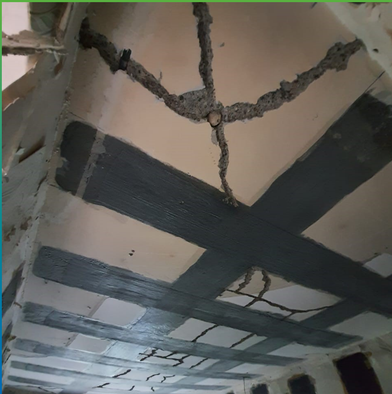
Подготовка трещин к инъектированию