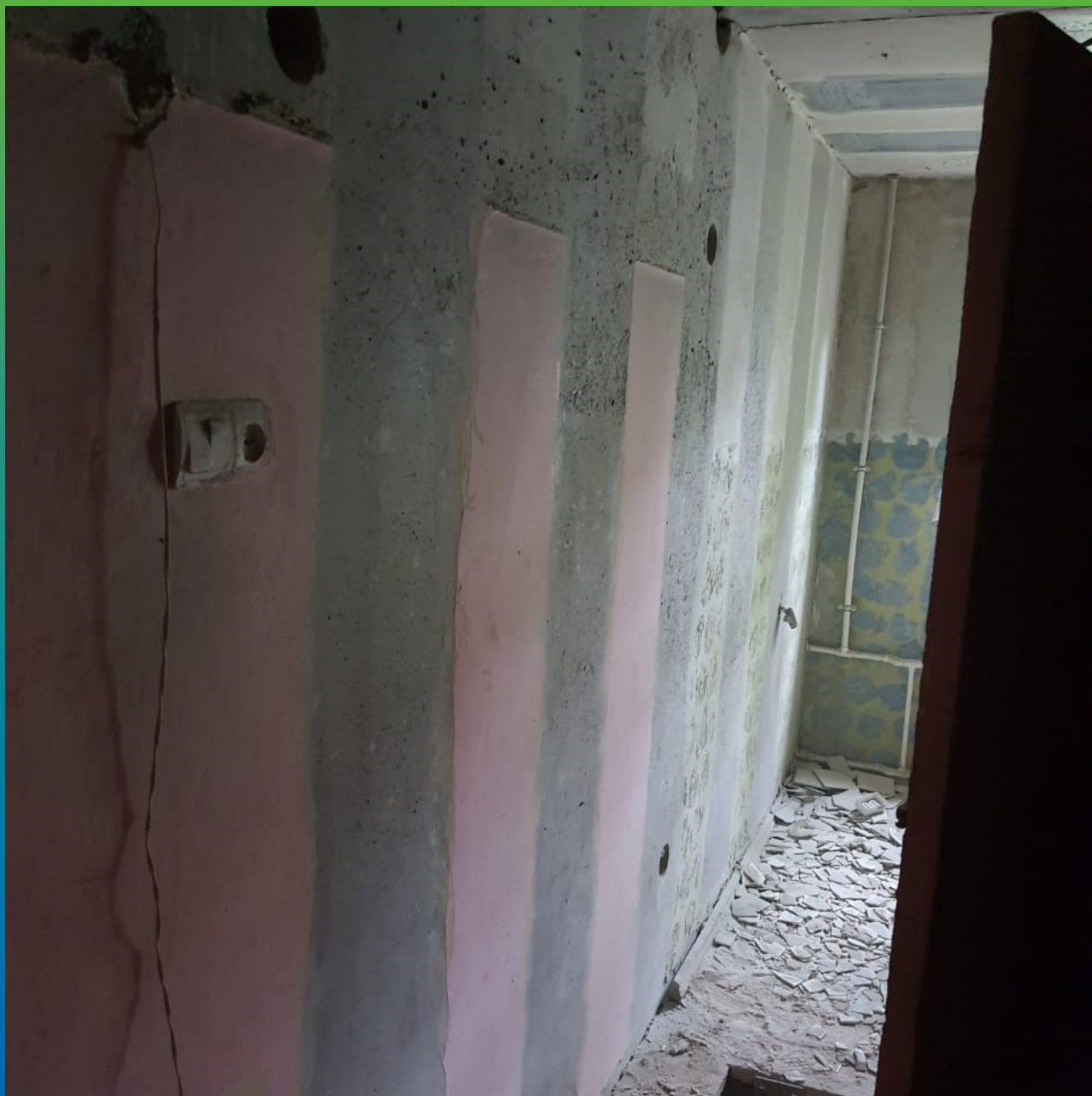
Подготовка основания для монтажа КСУ