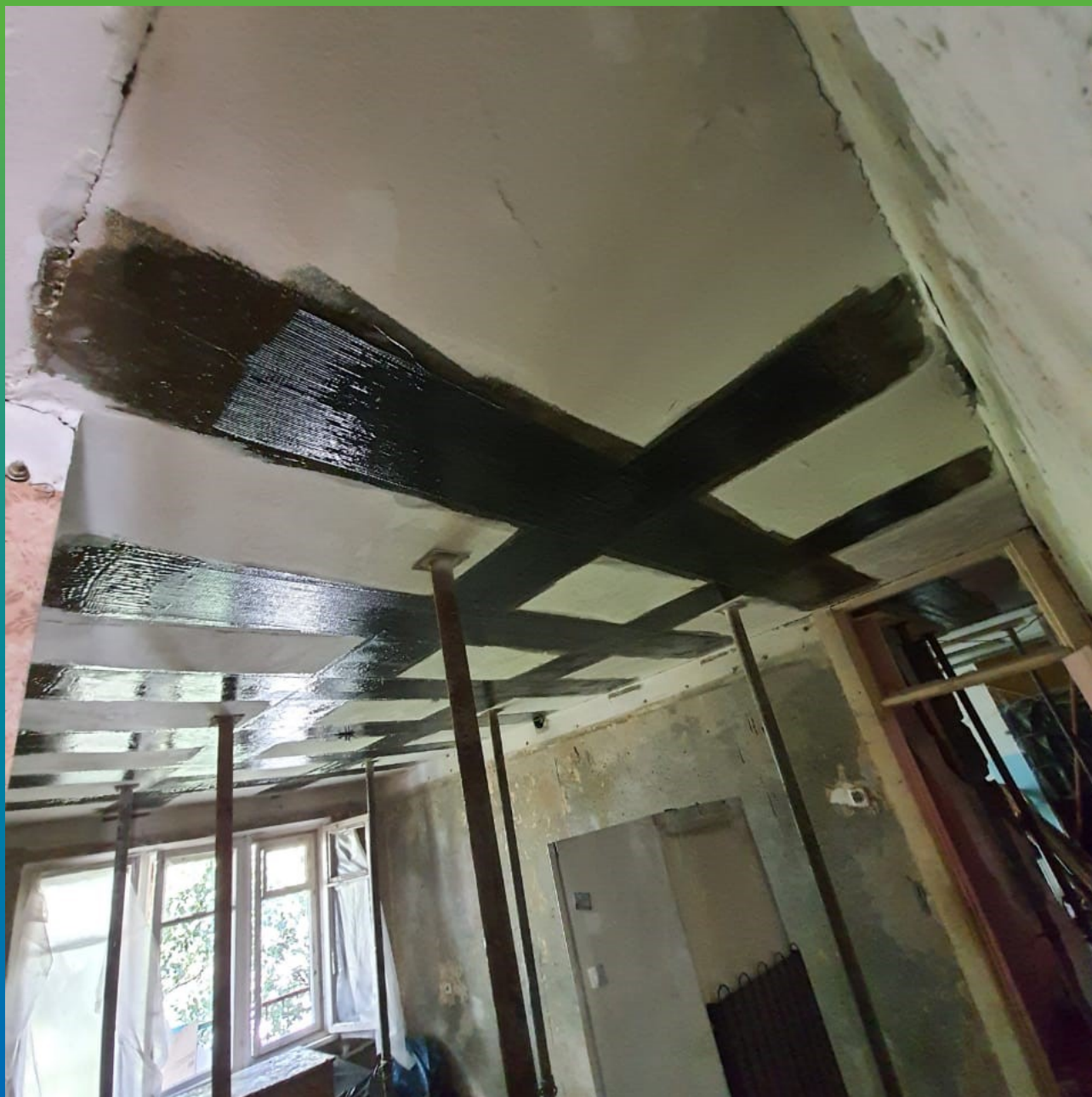
Монтаж КСУ на потолочных поверхностях