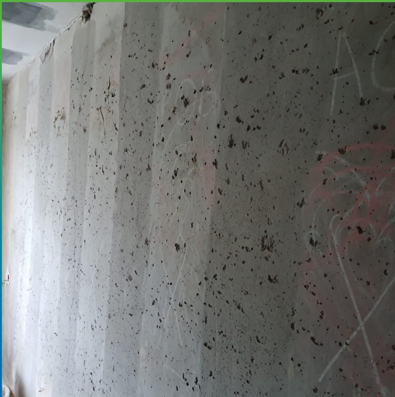
Подготовка основания для монтажа КСУ