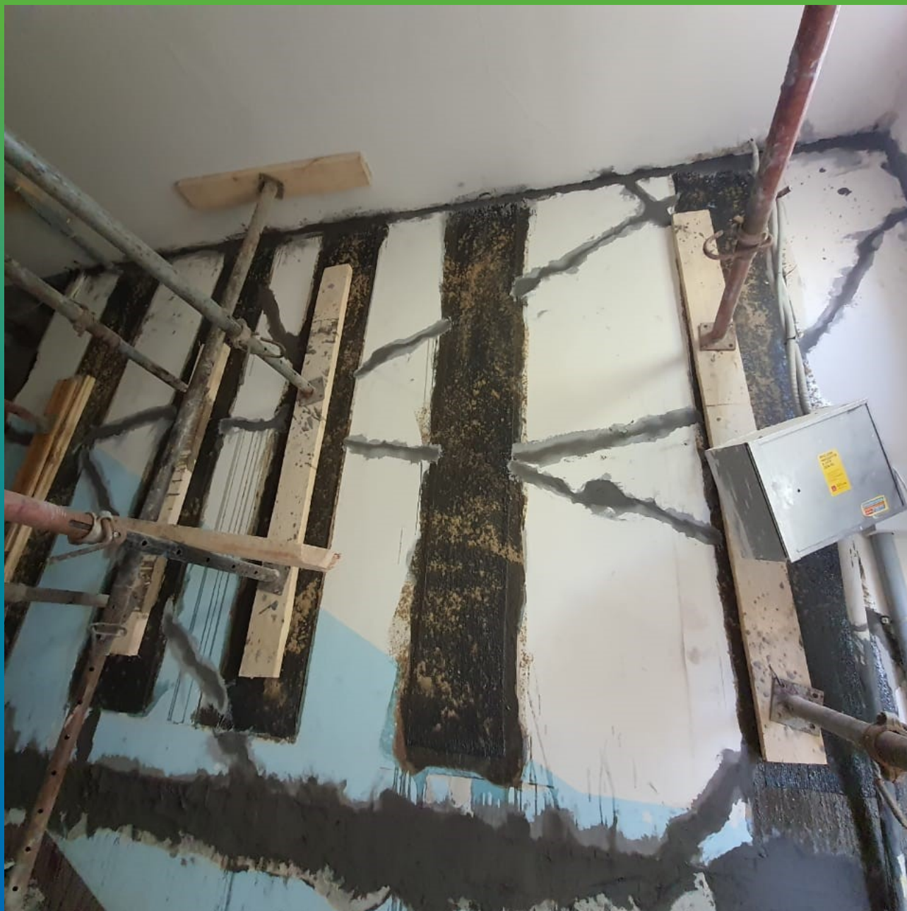
Внешний вид стены после проведения работ