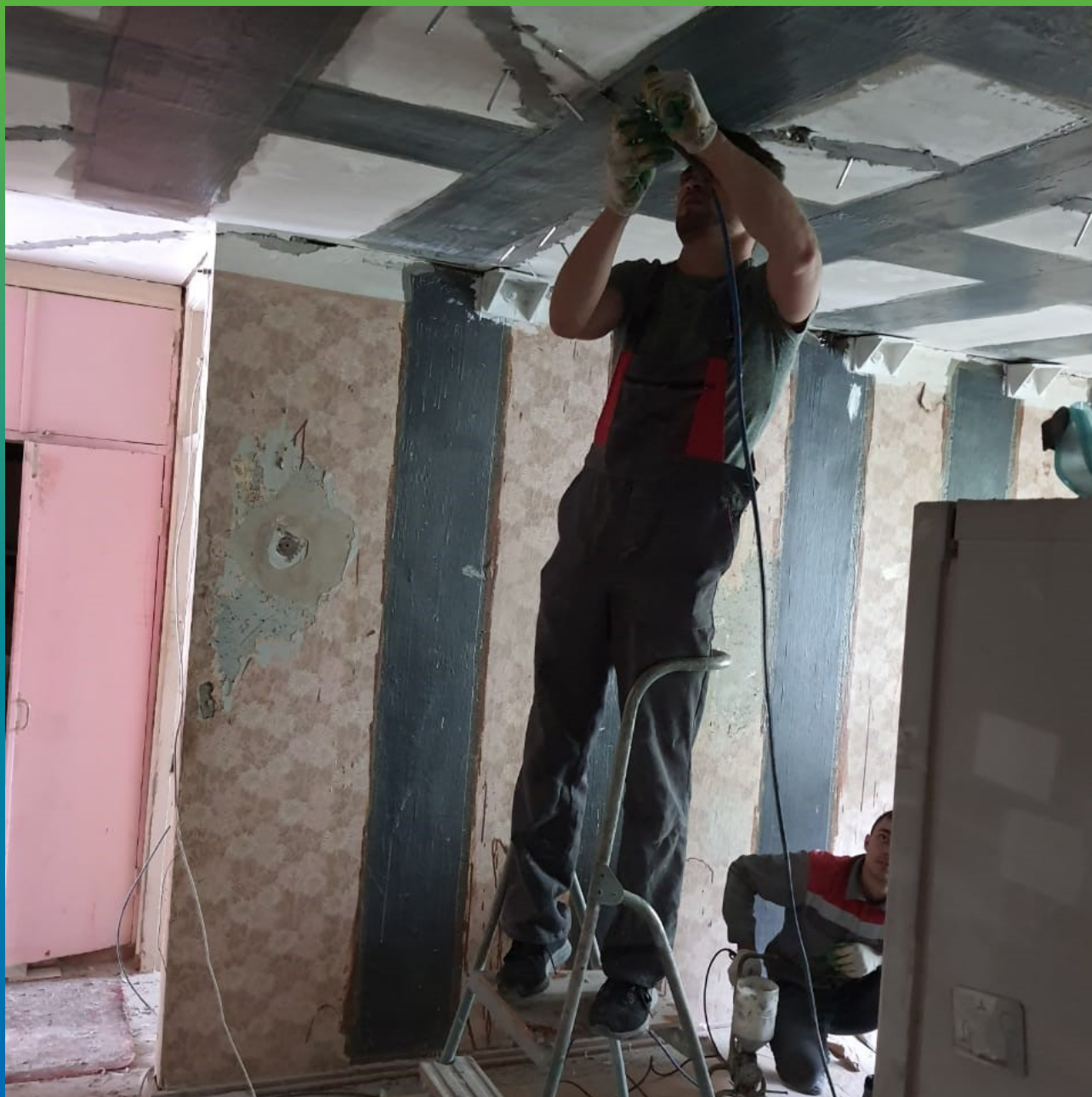
Инъектирование трещин эпоксидным составом Манопокс 352