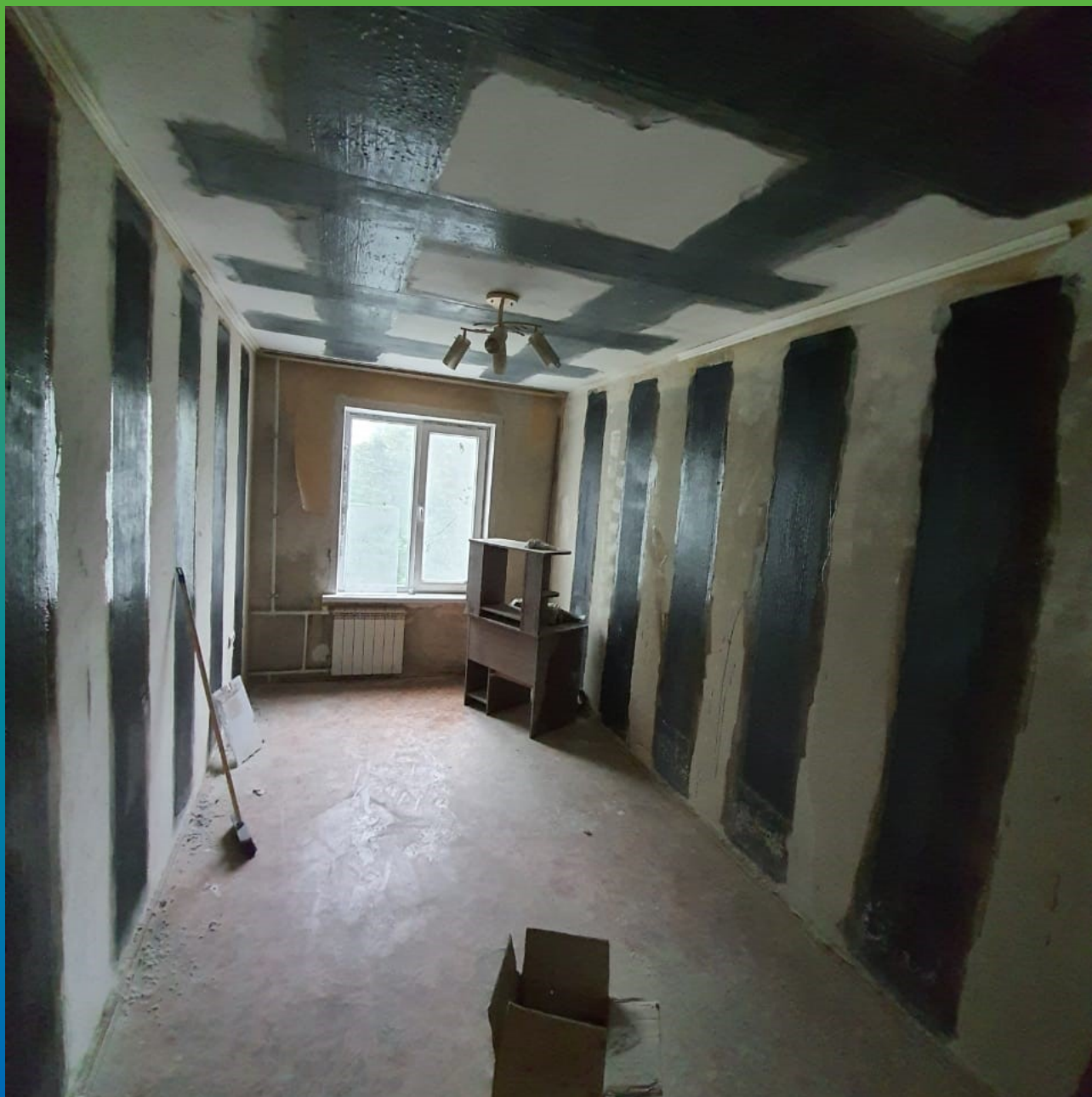
Монтаж КСУ на стеновых поверхностях