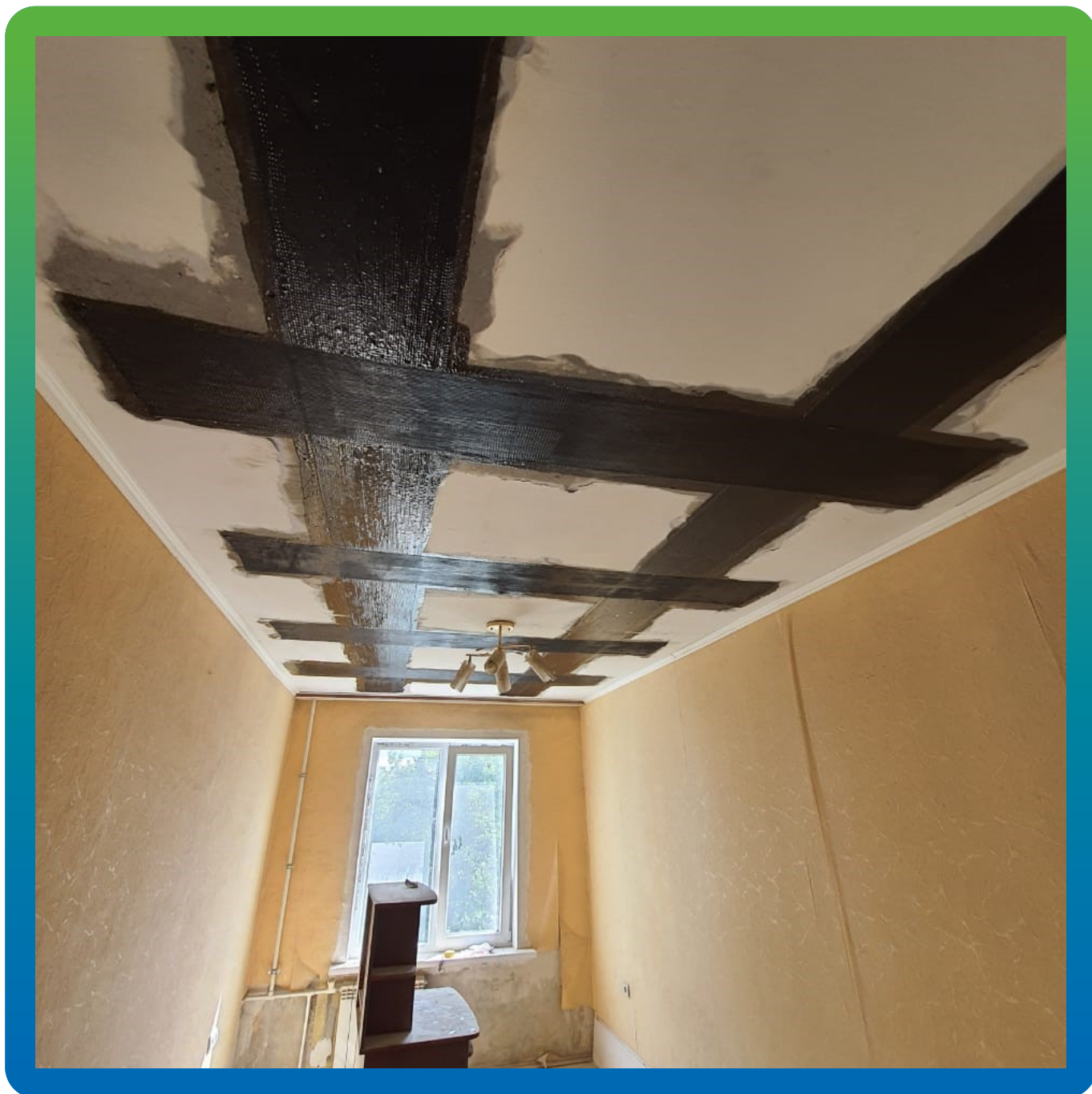
Монтаж КСУ на потолочных поверхностях