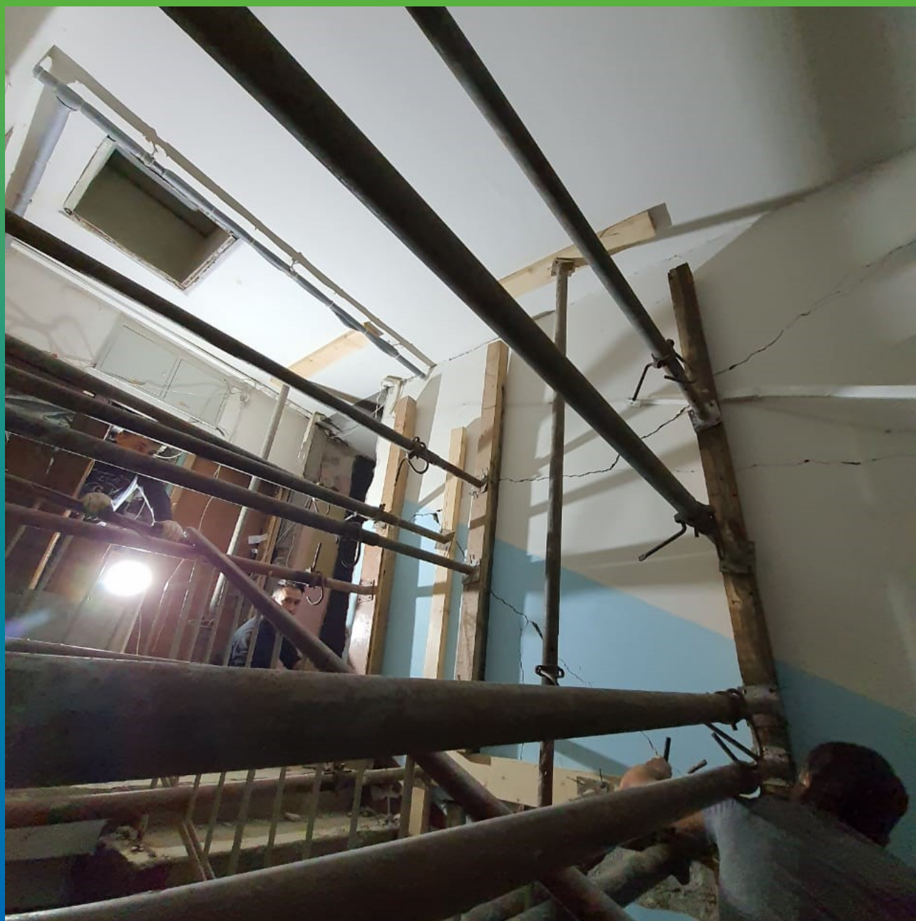
Подготовка к проведению восстановительных работ