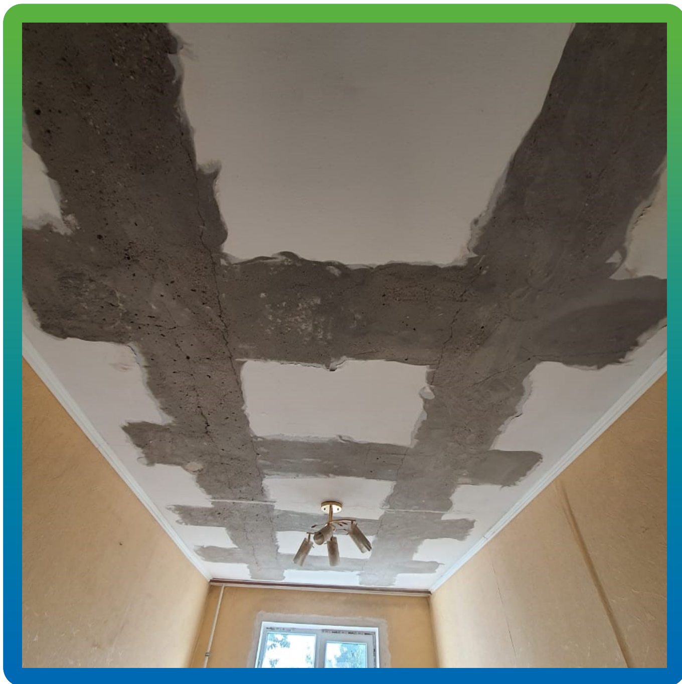
Подготовка основания для монтажа КСУ