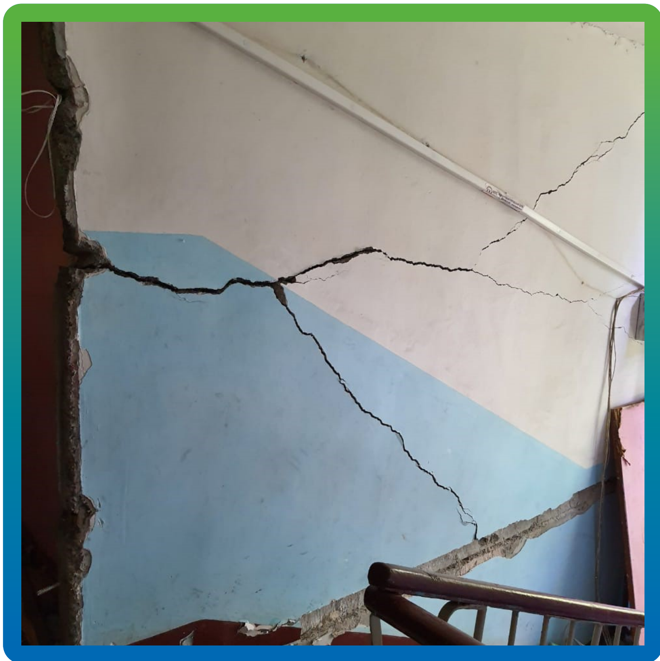
Вид объекта до начала работ.