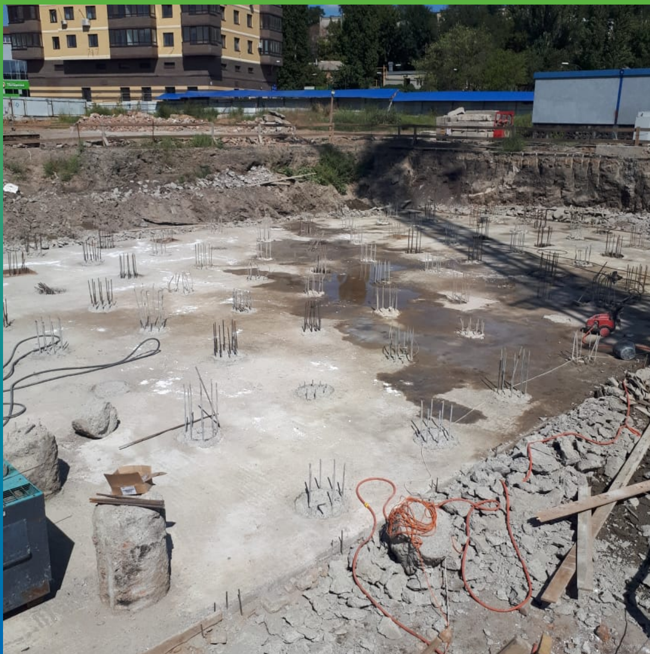
Поверхность до нанесения гидроизоляции