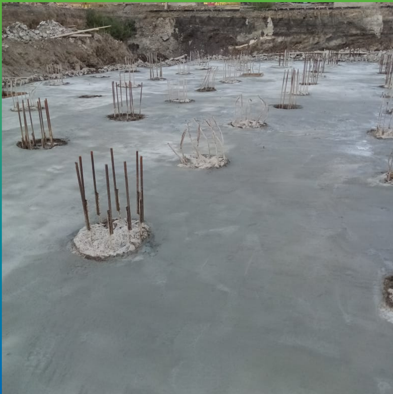
Нанесенный слой гидроизоляции Стармекс 111