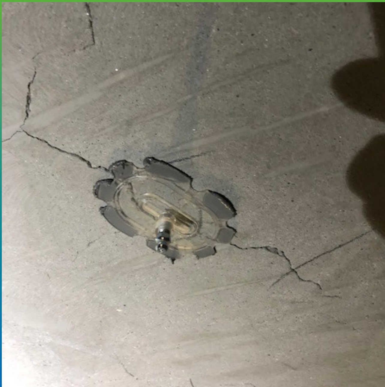
Монтаж адгезионного пакера БМ 0187