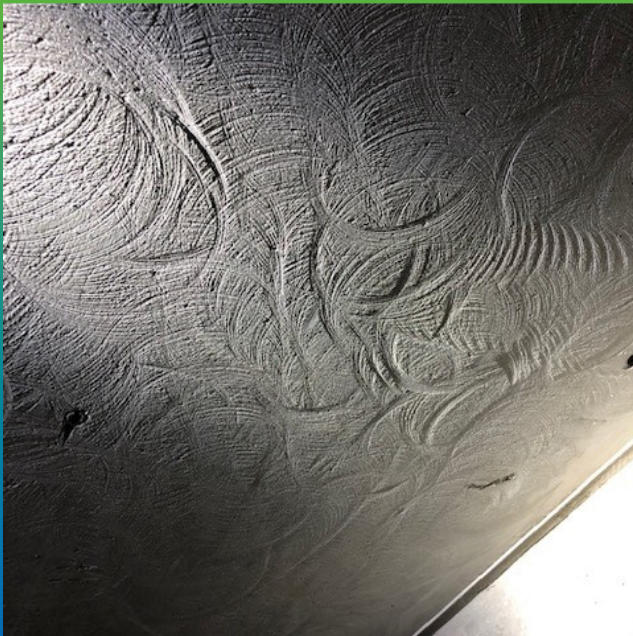
Подготовка основания шлифовкой