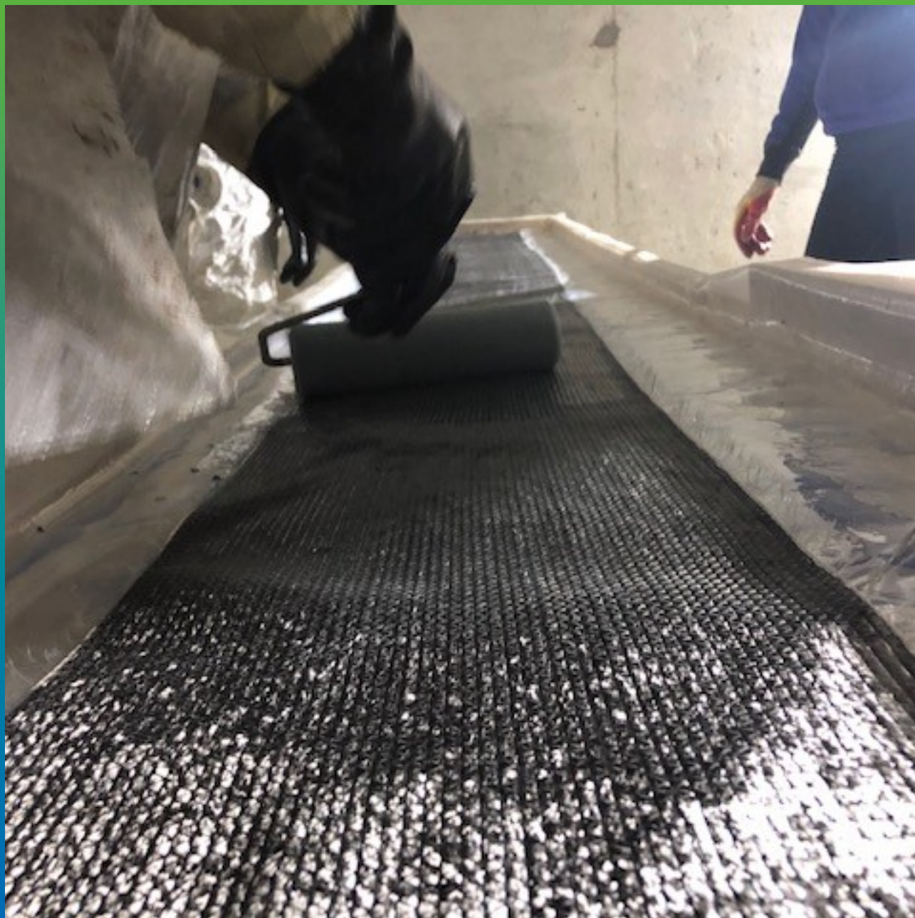
Процесс пропитки волокна