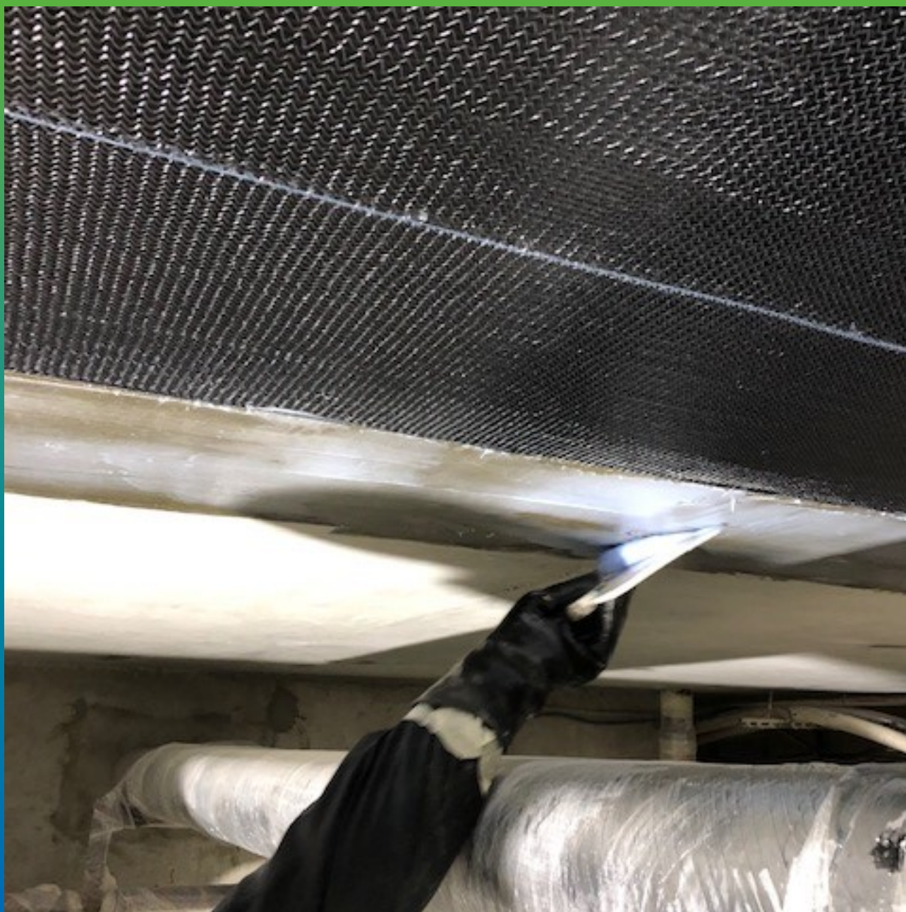
Нанесение загущенного клея Манопокс 372