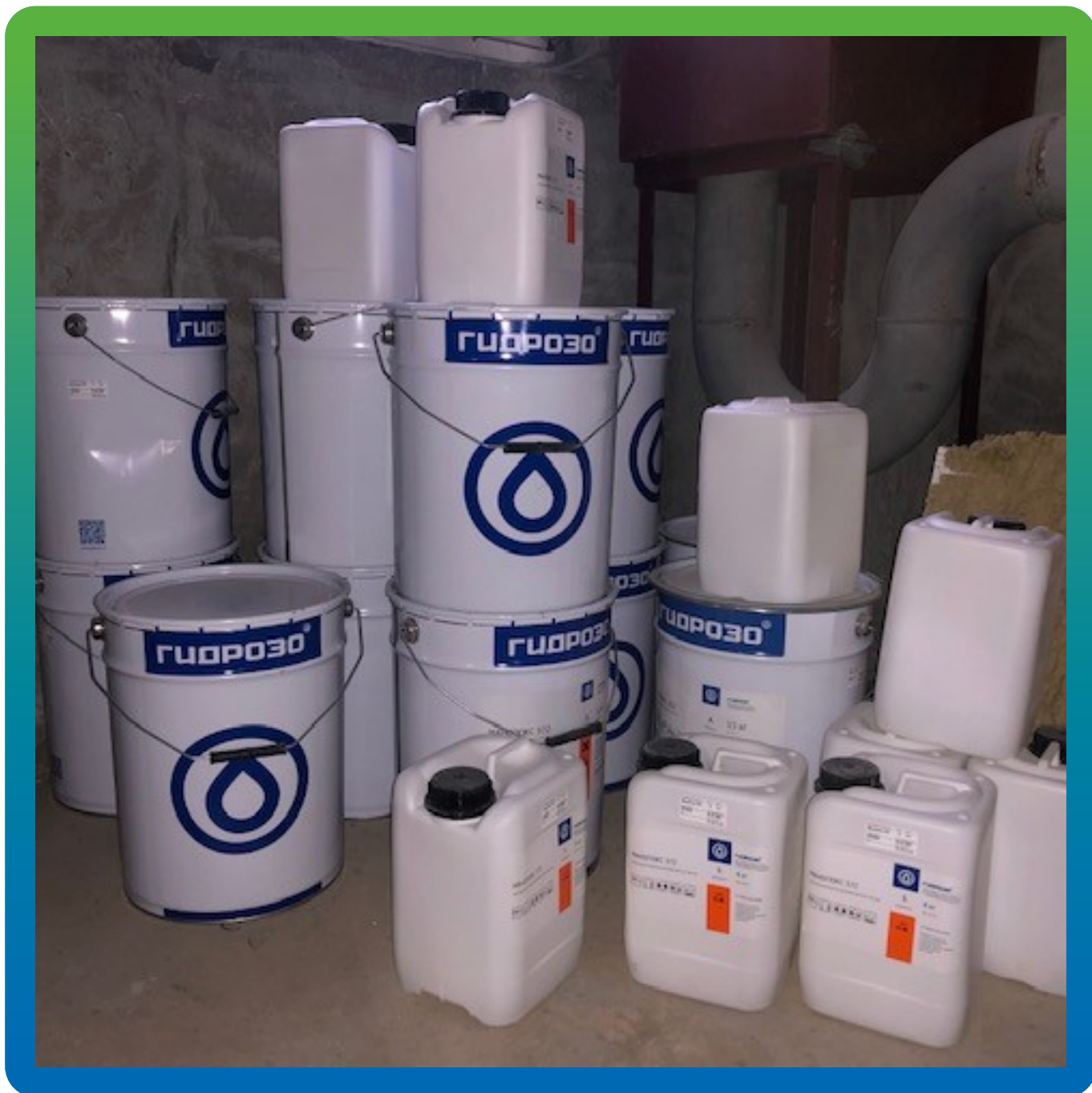
Материалы на объекте