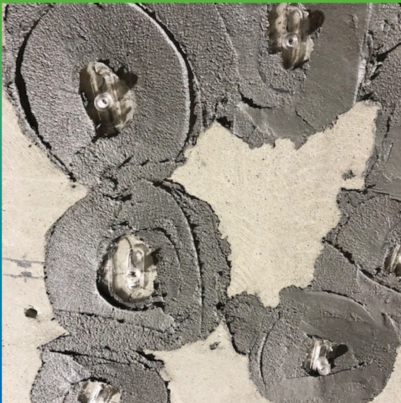
Шпаклевание трещин и пакера