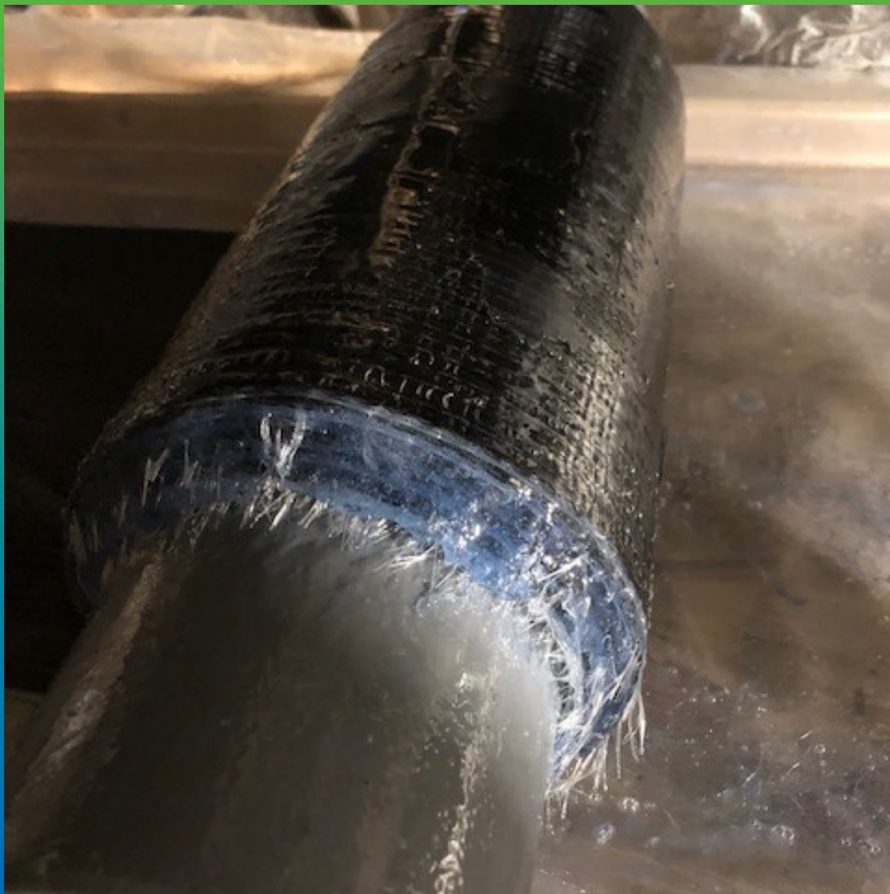
Вид подготовленного для монтажа рулона