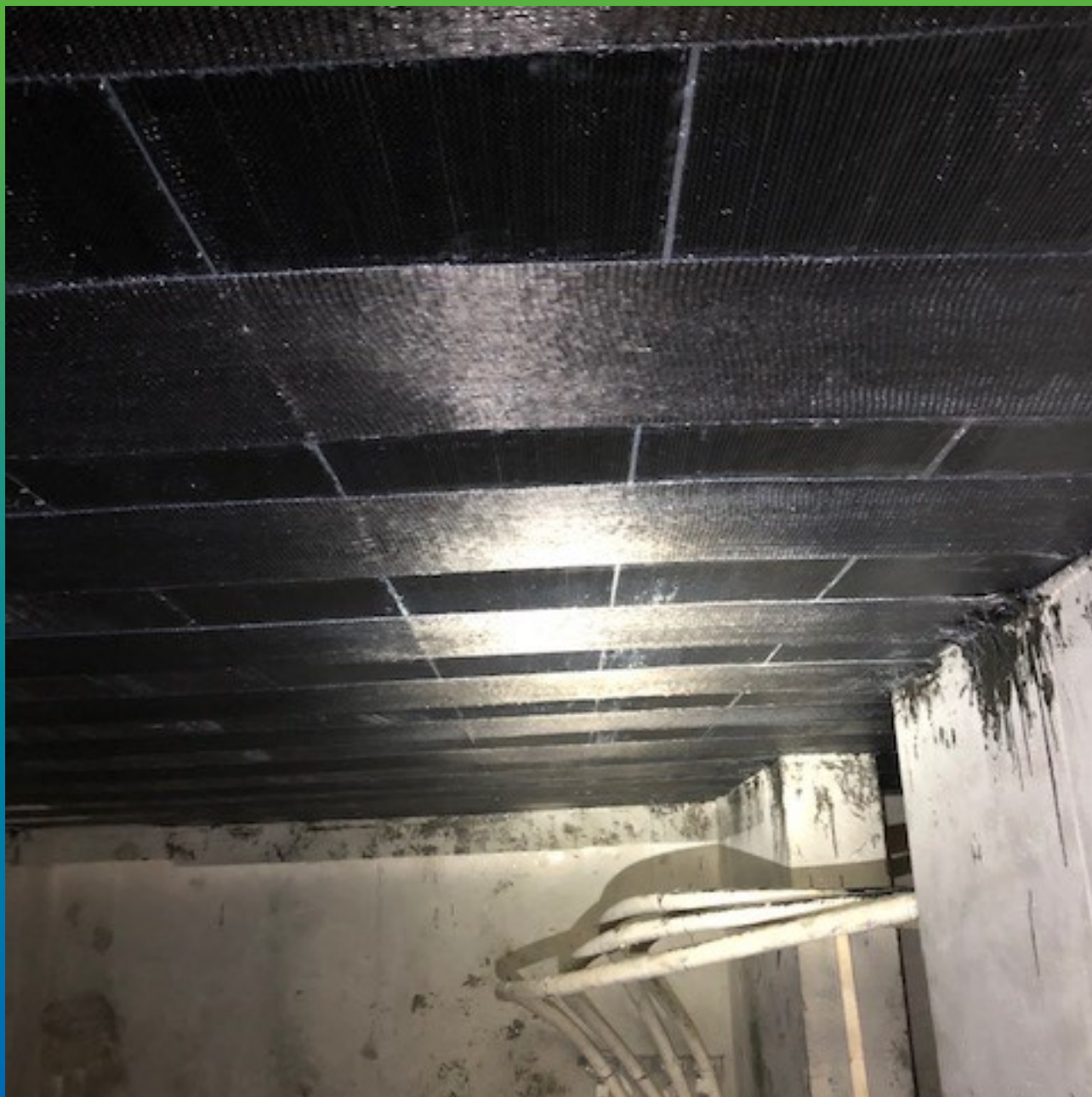
Вид смонтированной системы ФАП