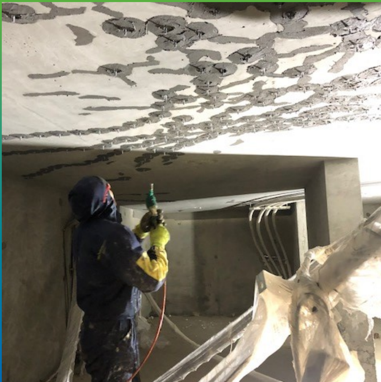
Инъектирование трещин составом Манопокс 352