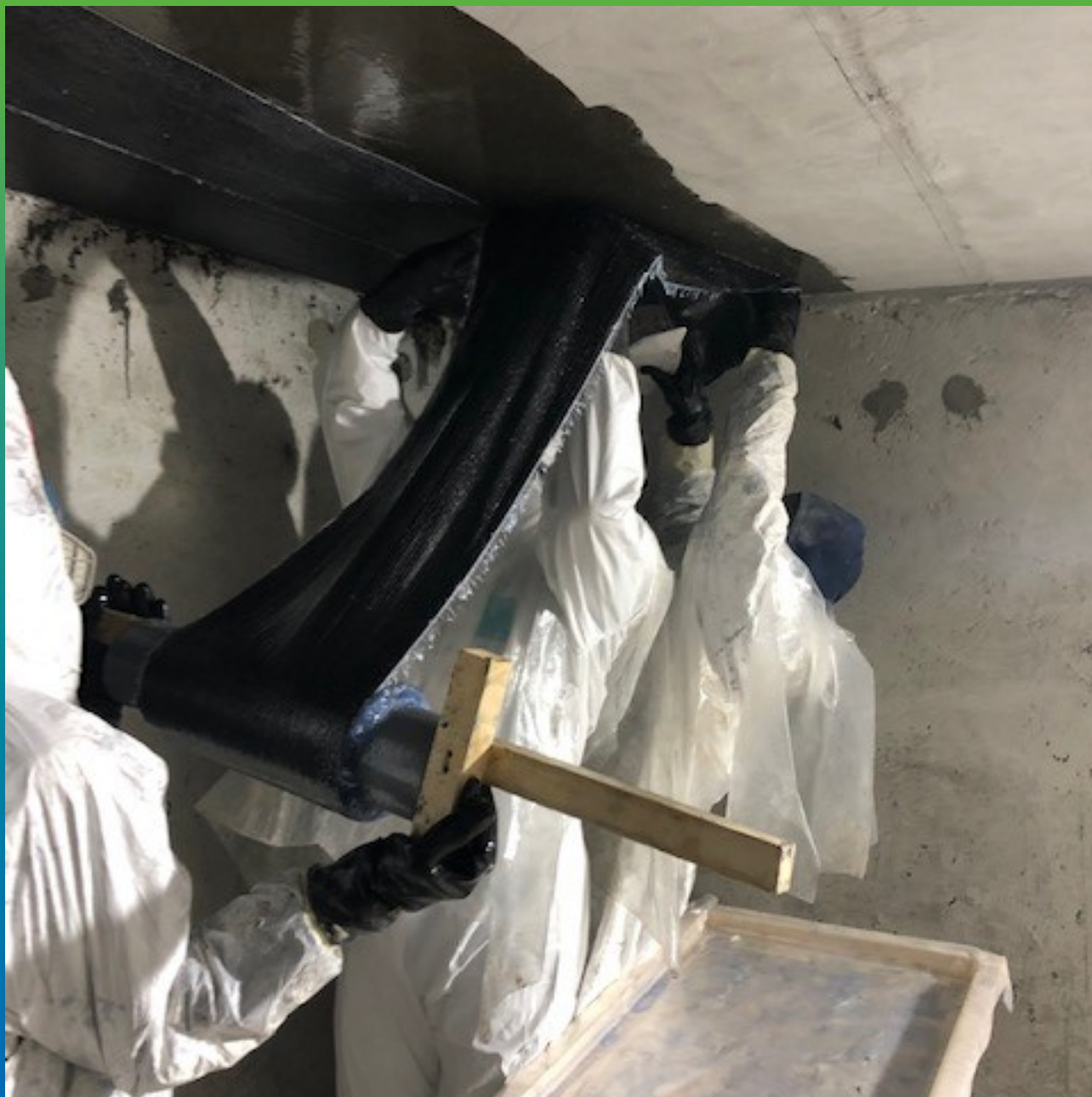
Монтаж волокна Армошел