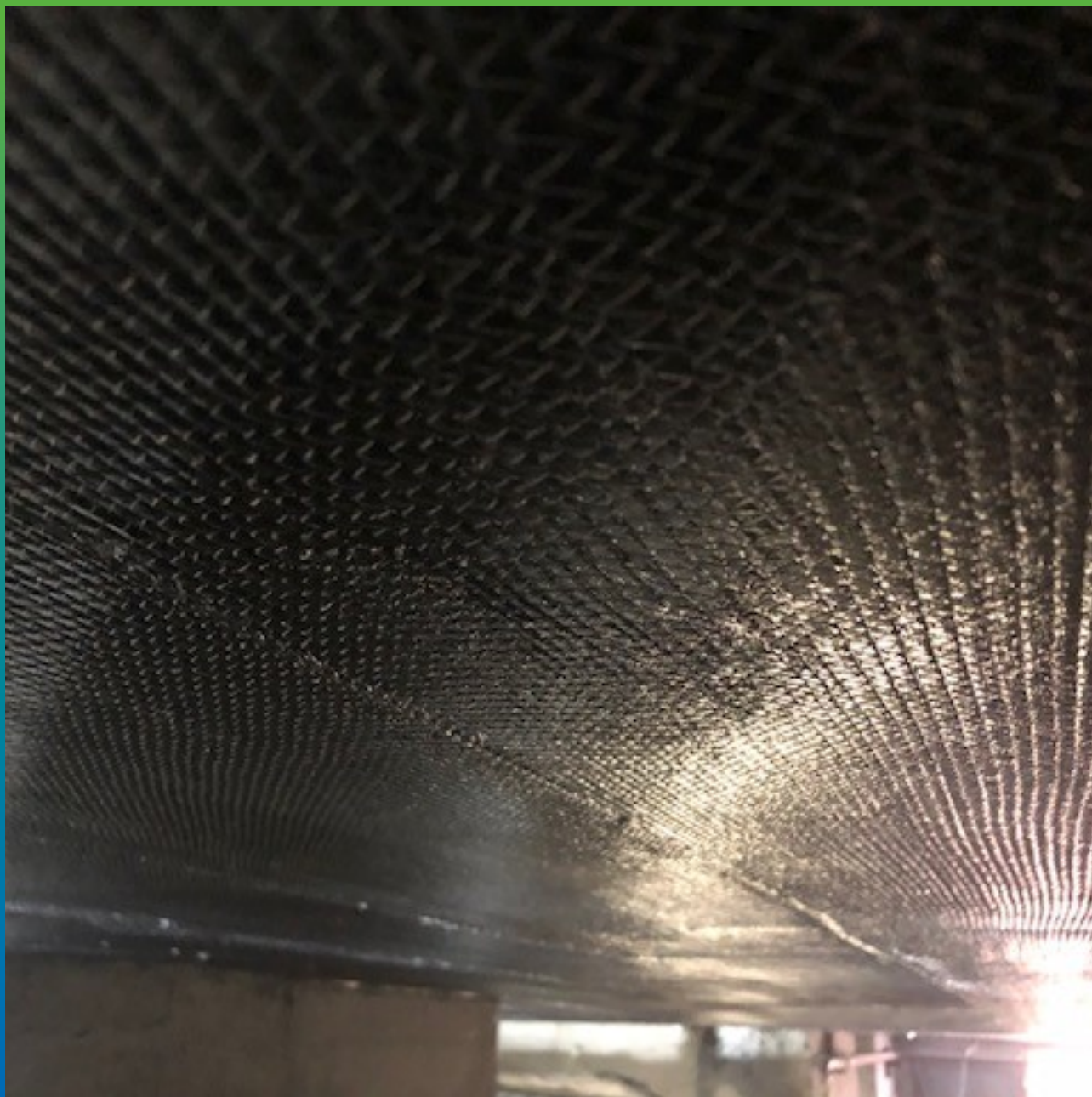
Вид смонтированной системы ФАП