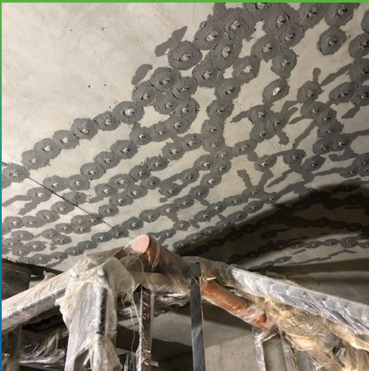
Общий вид смонтированного пакера