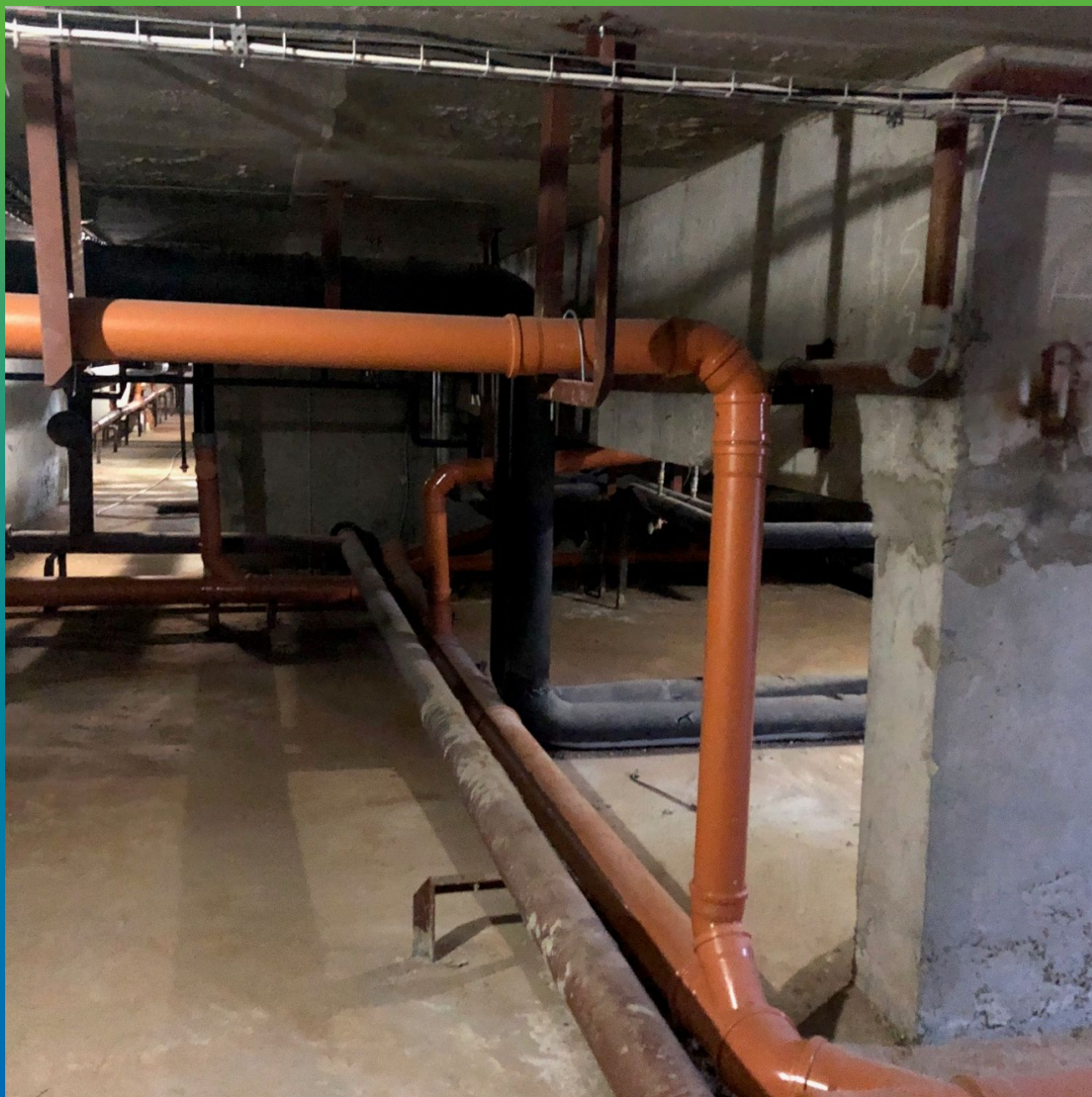
Частный вид объекта