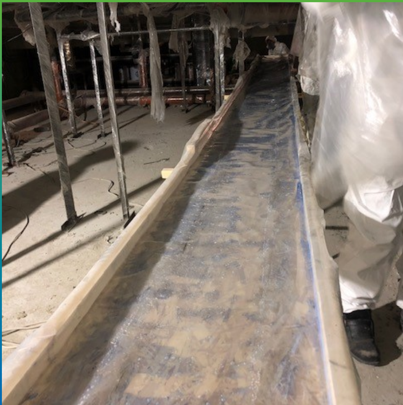
Подготовка рабочего места