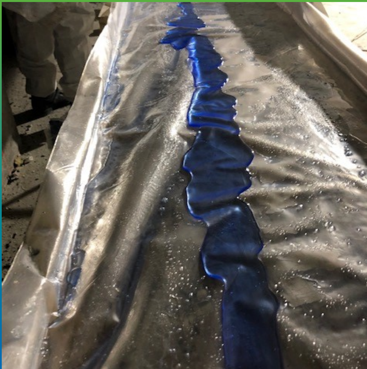
Процесс пропитки волокна