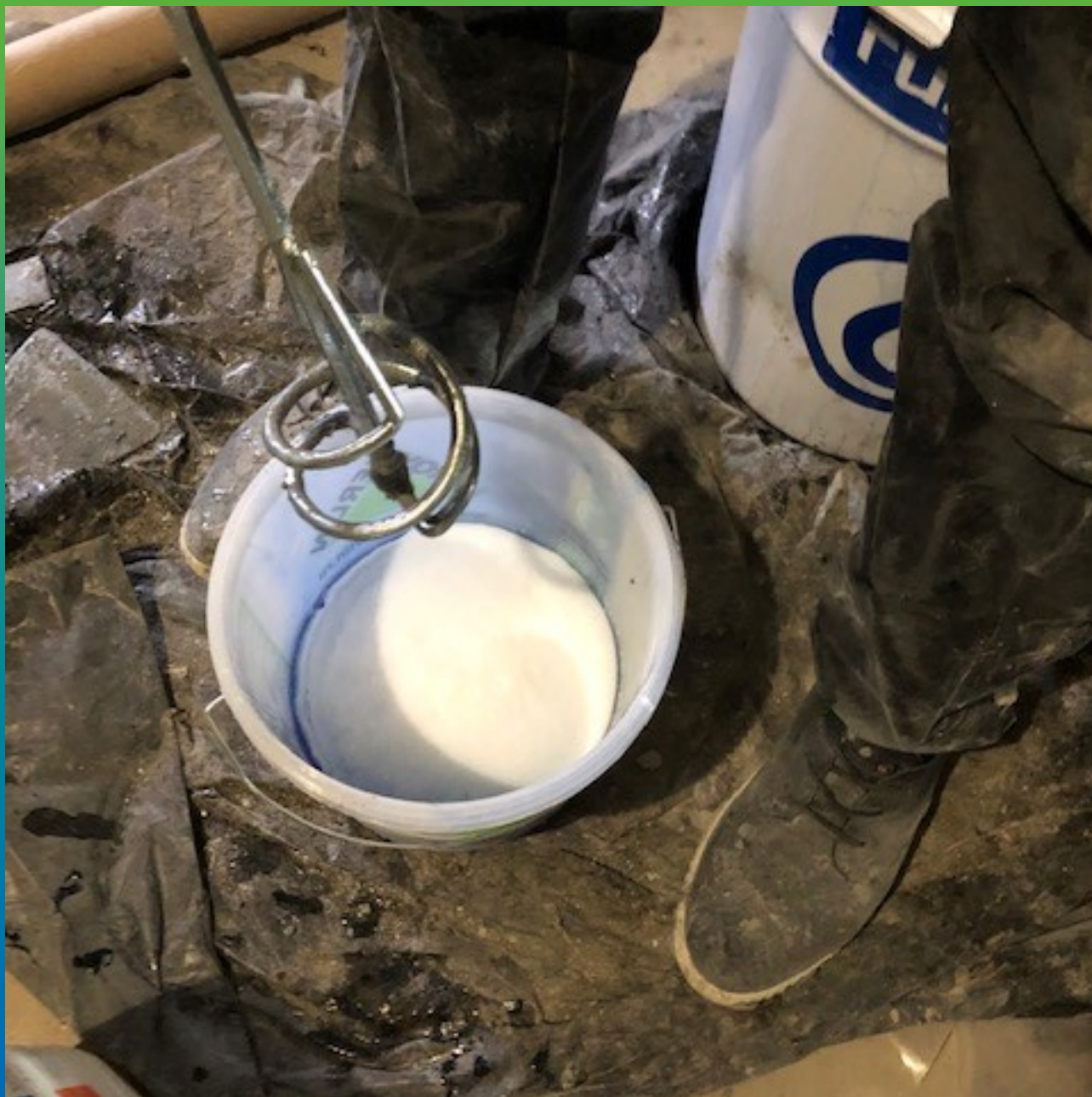
Загущение клея Манопкс 372 загустителем Манопкс Тикс