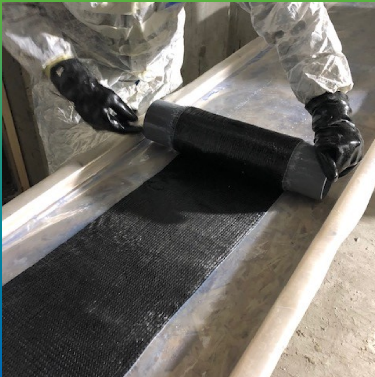
Подготовка пропитанного рулона