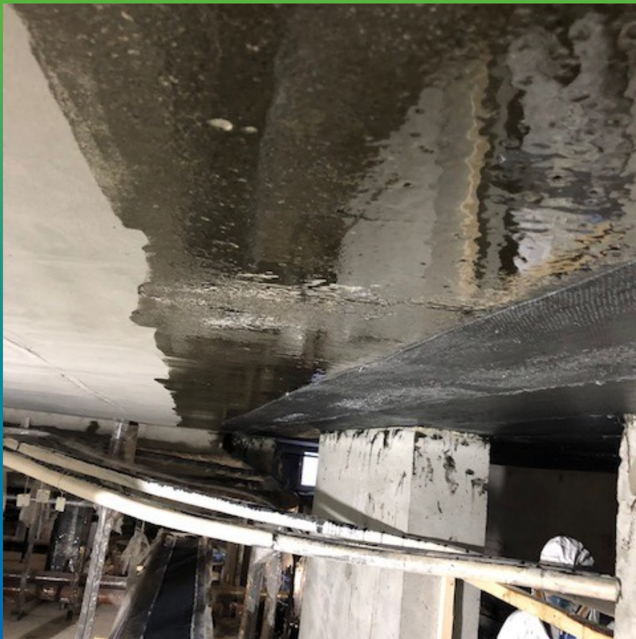
Вид загрунтованной поверхности