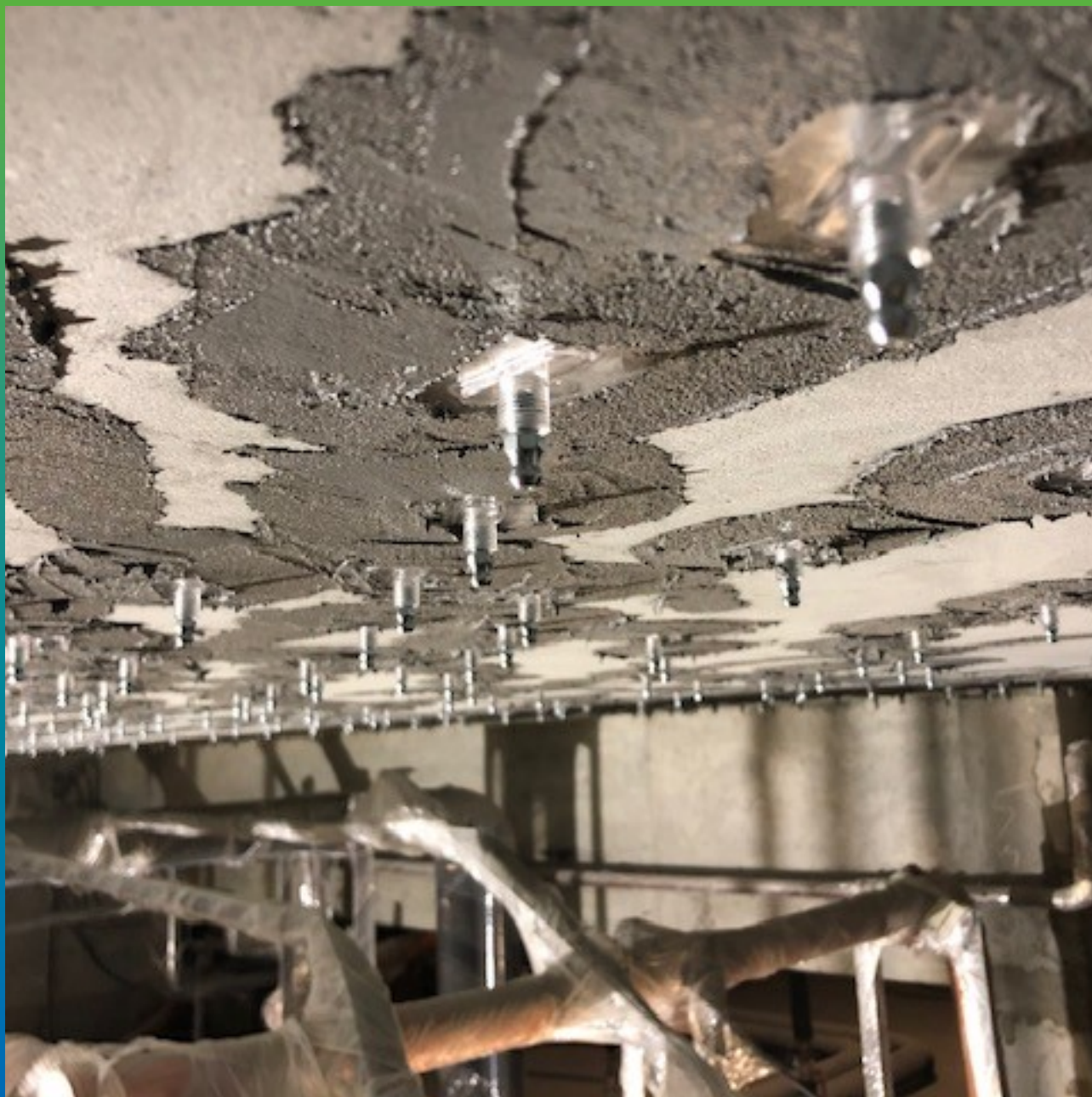
Вид смонтированных пакеров