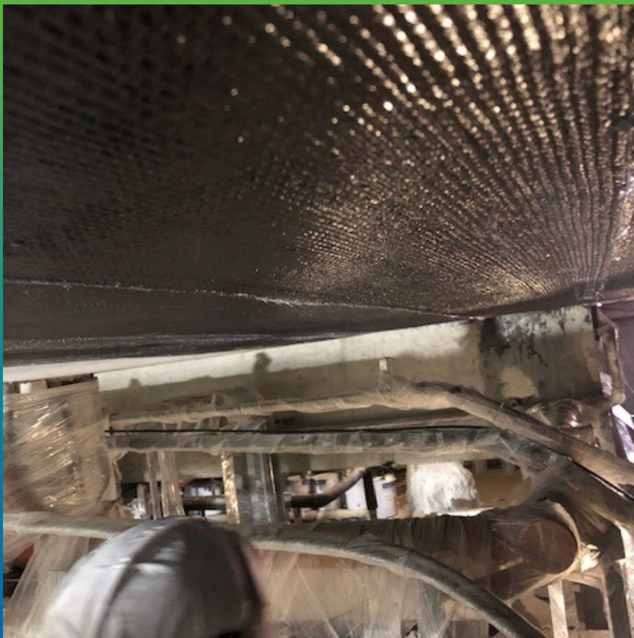
Вид смонтированной системы ФАП