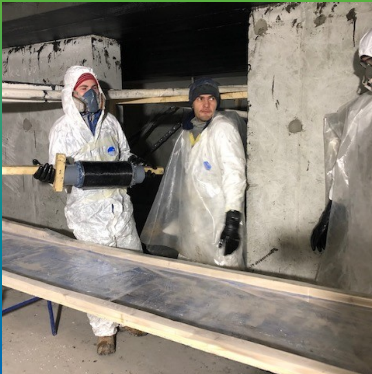
Передача подготовленного рулона для последующего монтажа