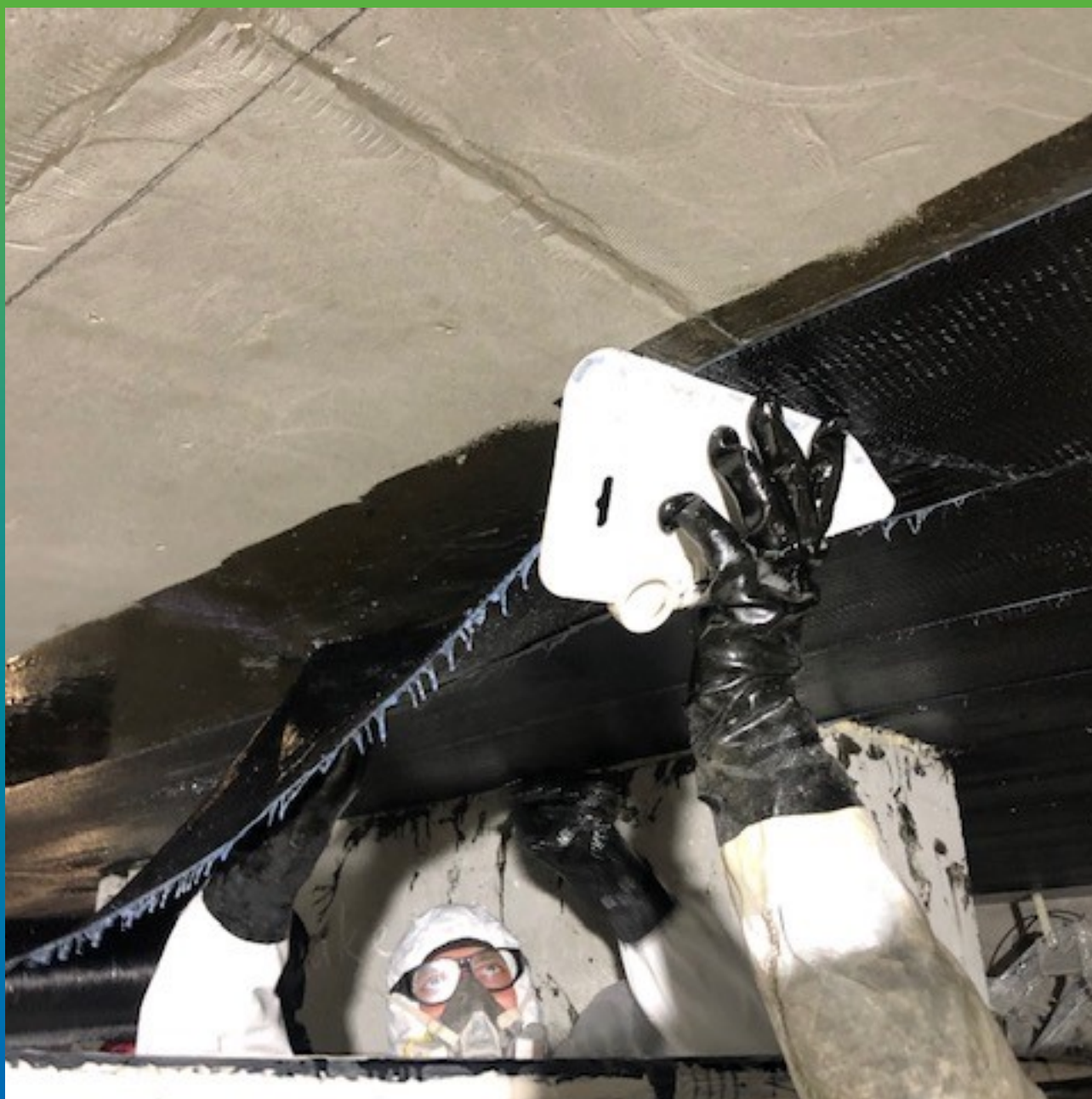
Разглаживание волокна и удаление воздуха