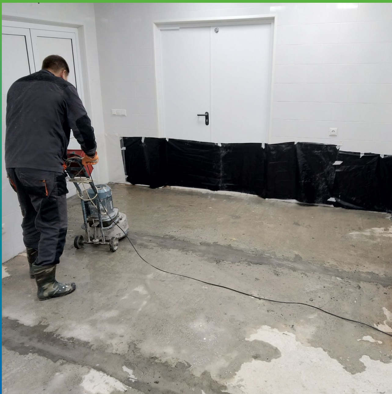
Подготовка поверхности фрезерование