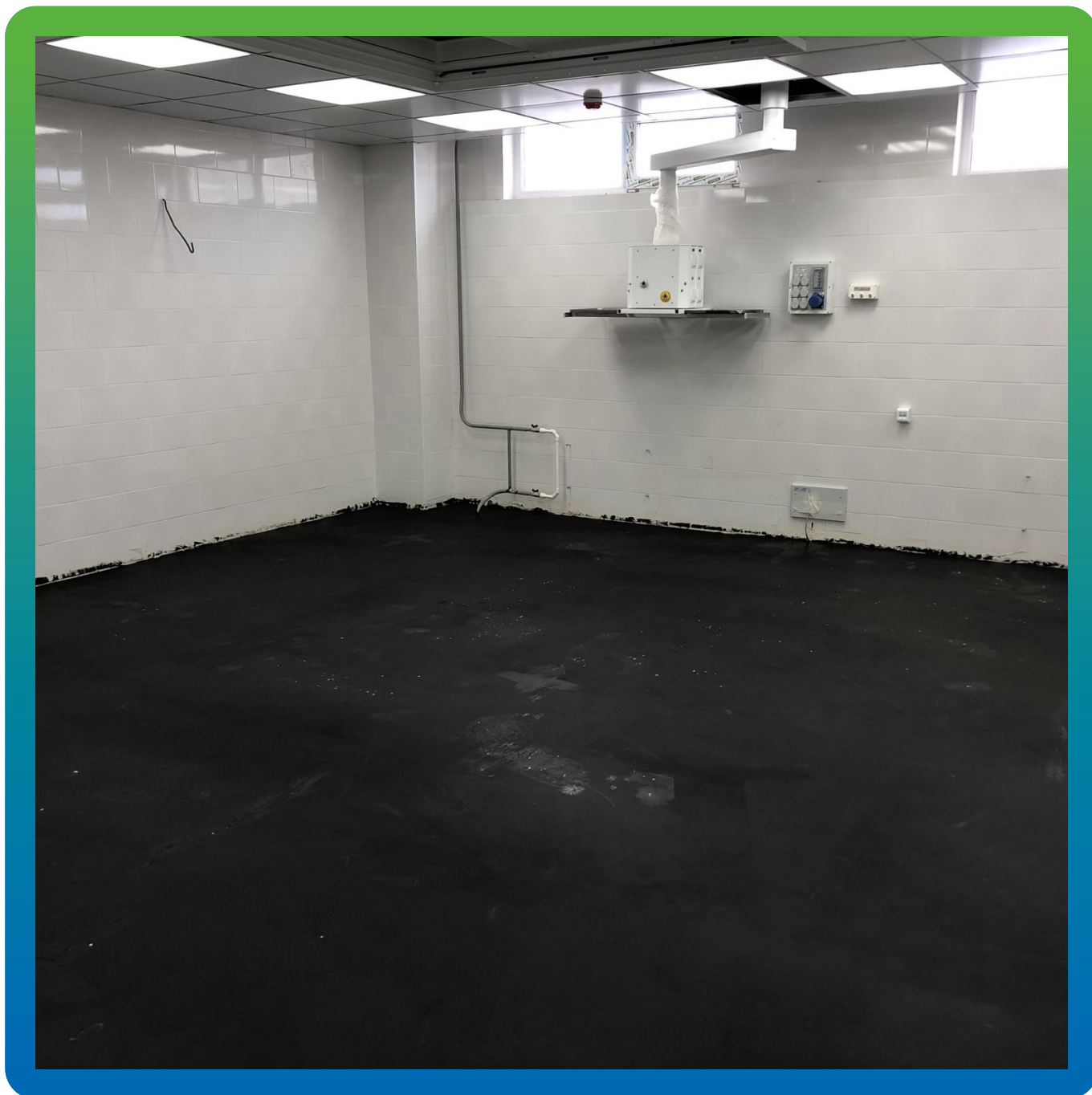
Грунтование антистатическим грунтом ДенсТоп ЭП 105 АС