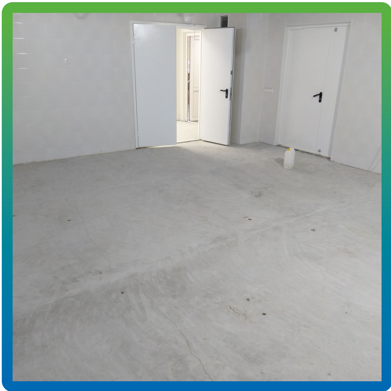
Общий вид объекта