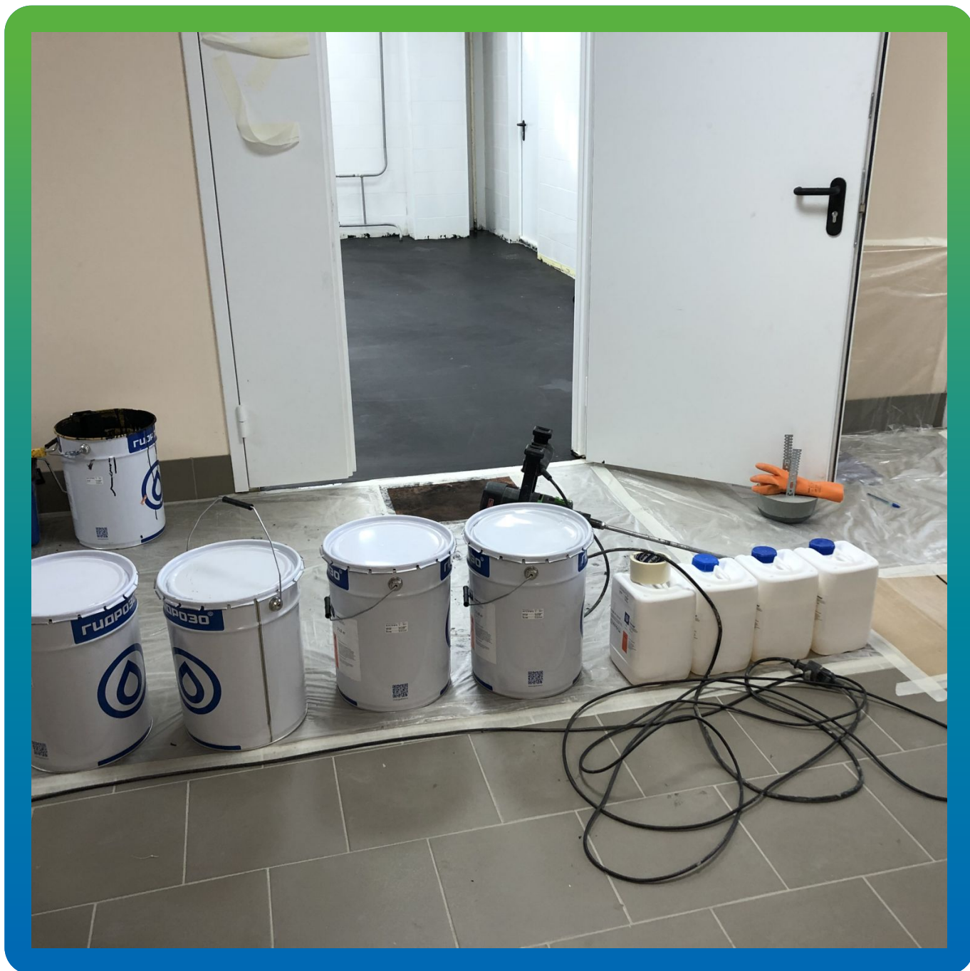
Подготовка материалов и оборудования