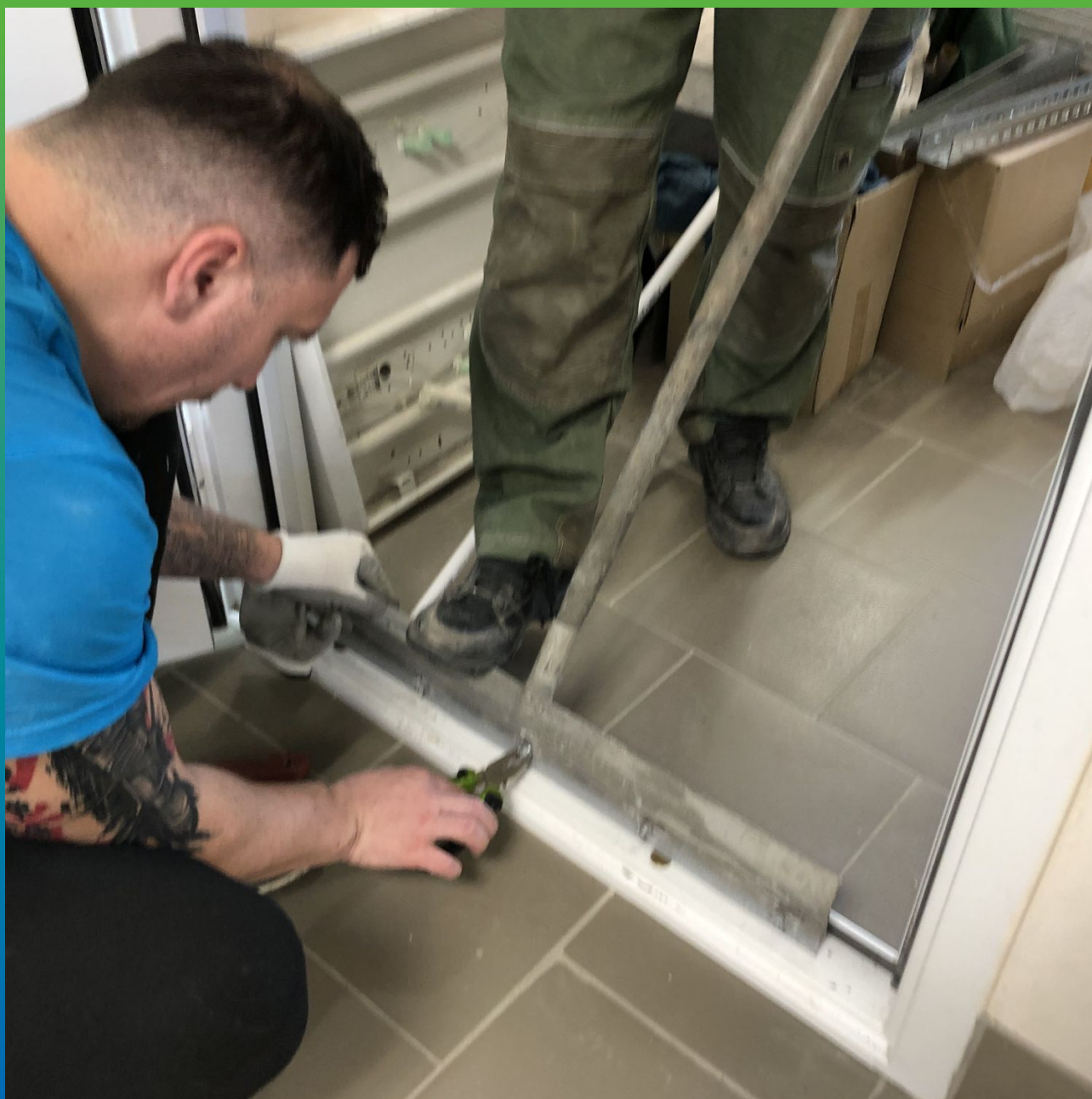
Проверка ручного инструмента и выставление зазора