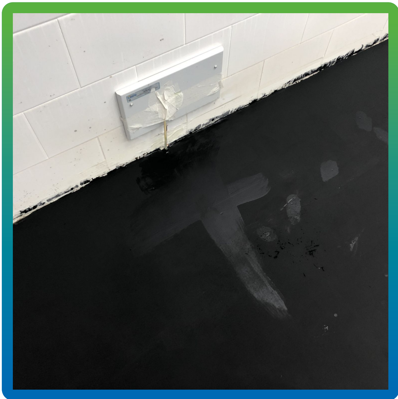
Подведение антистатической ленты к общей шине заземления