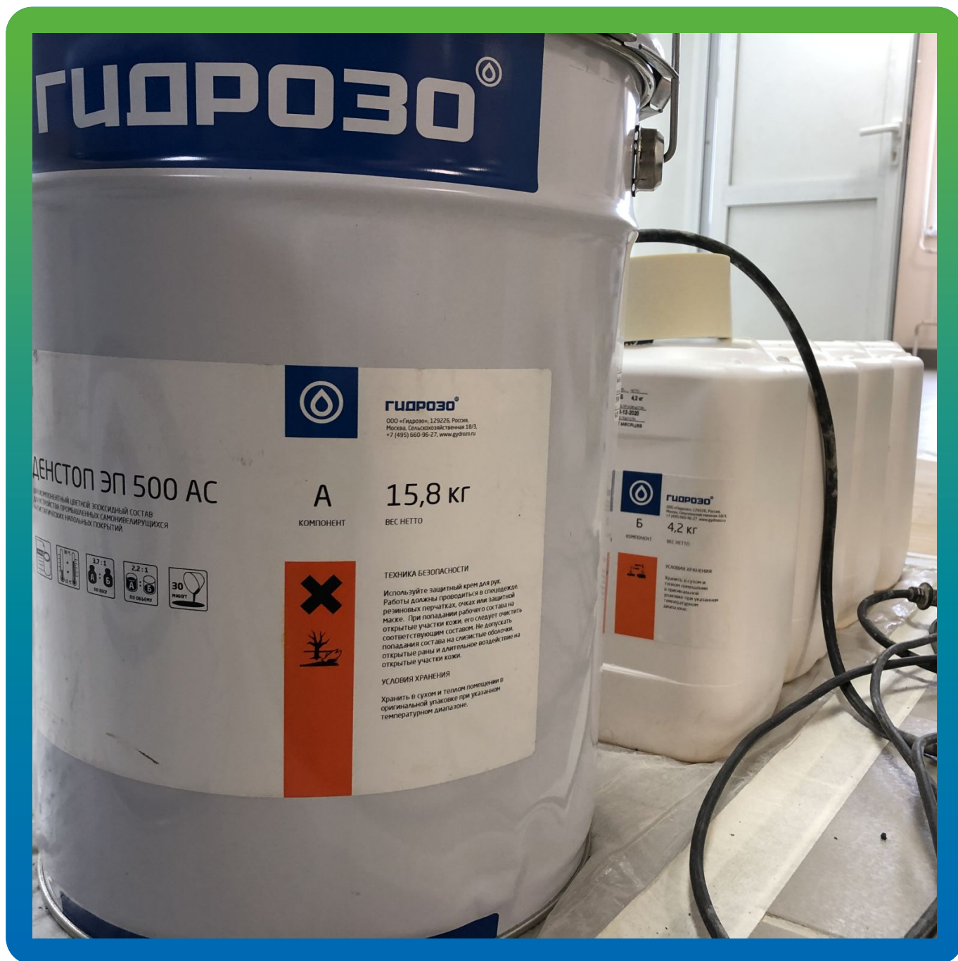
Материал на объекте