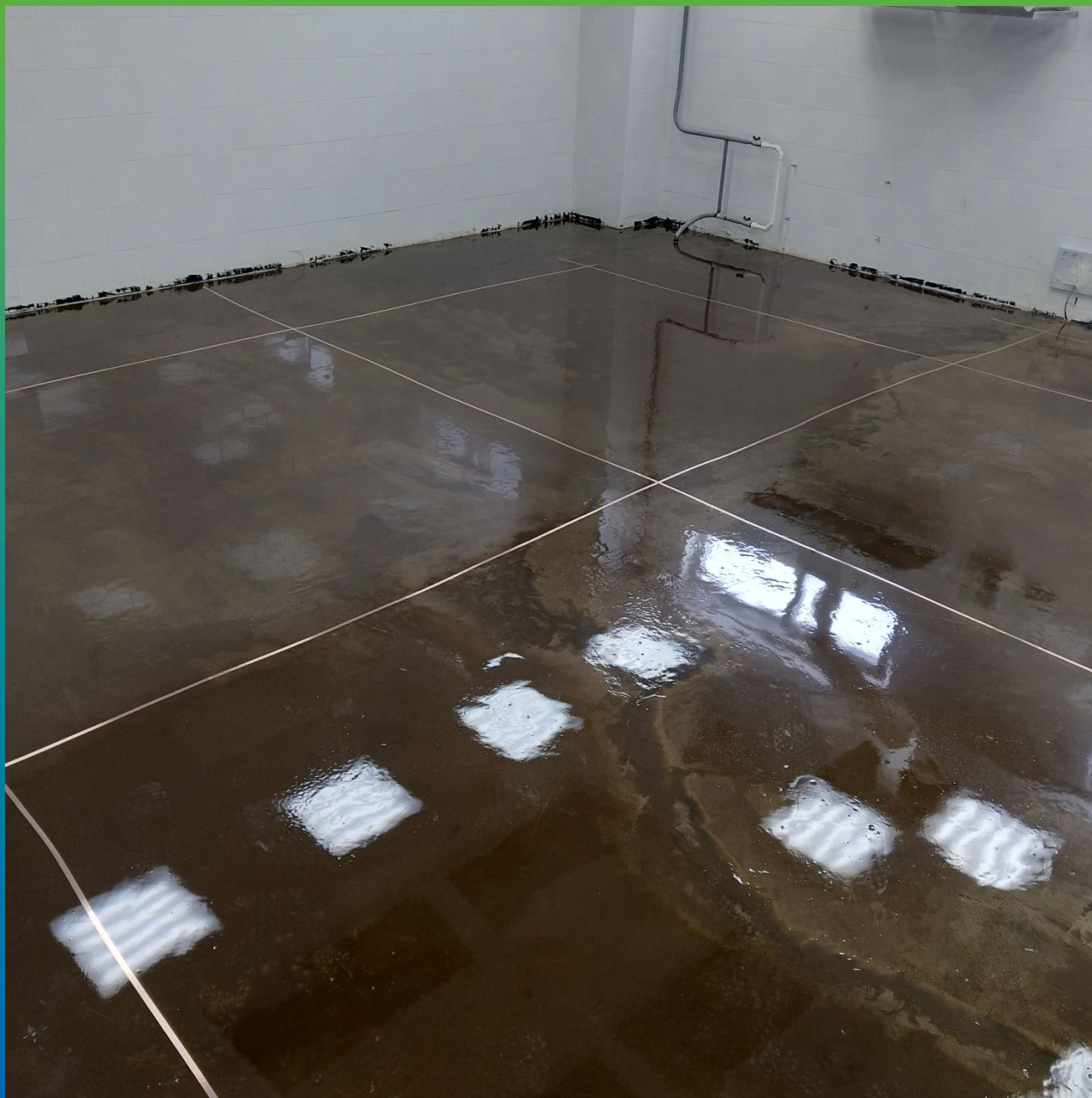
Общий вид приклеянной медной ленты