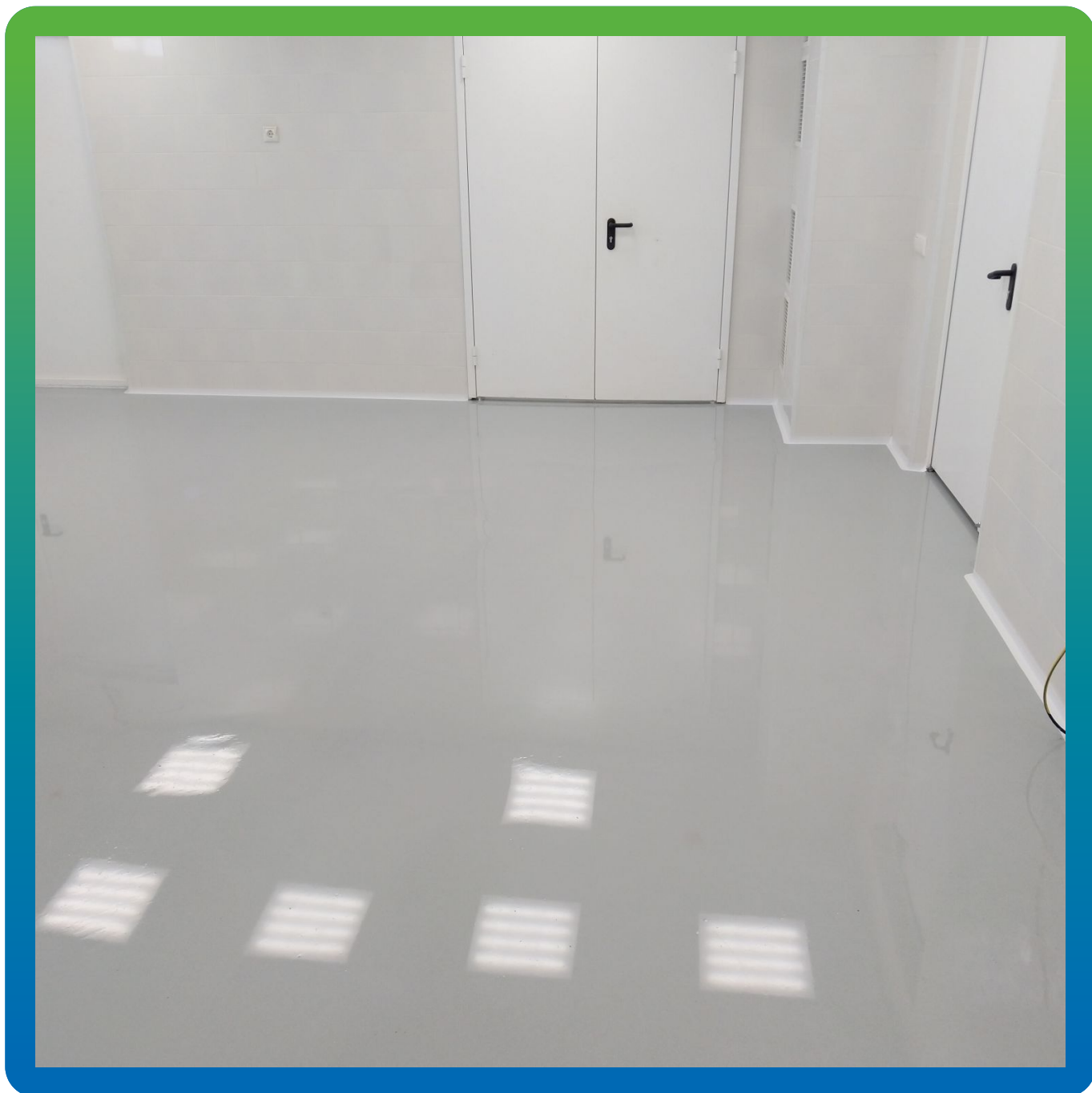
Общий вид смонтированного покрытия ДенСтол ЭП 500 АС