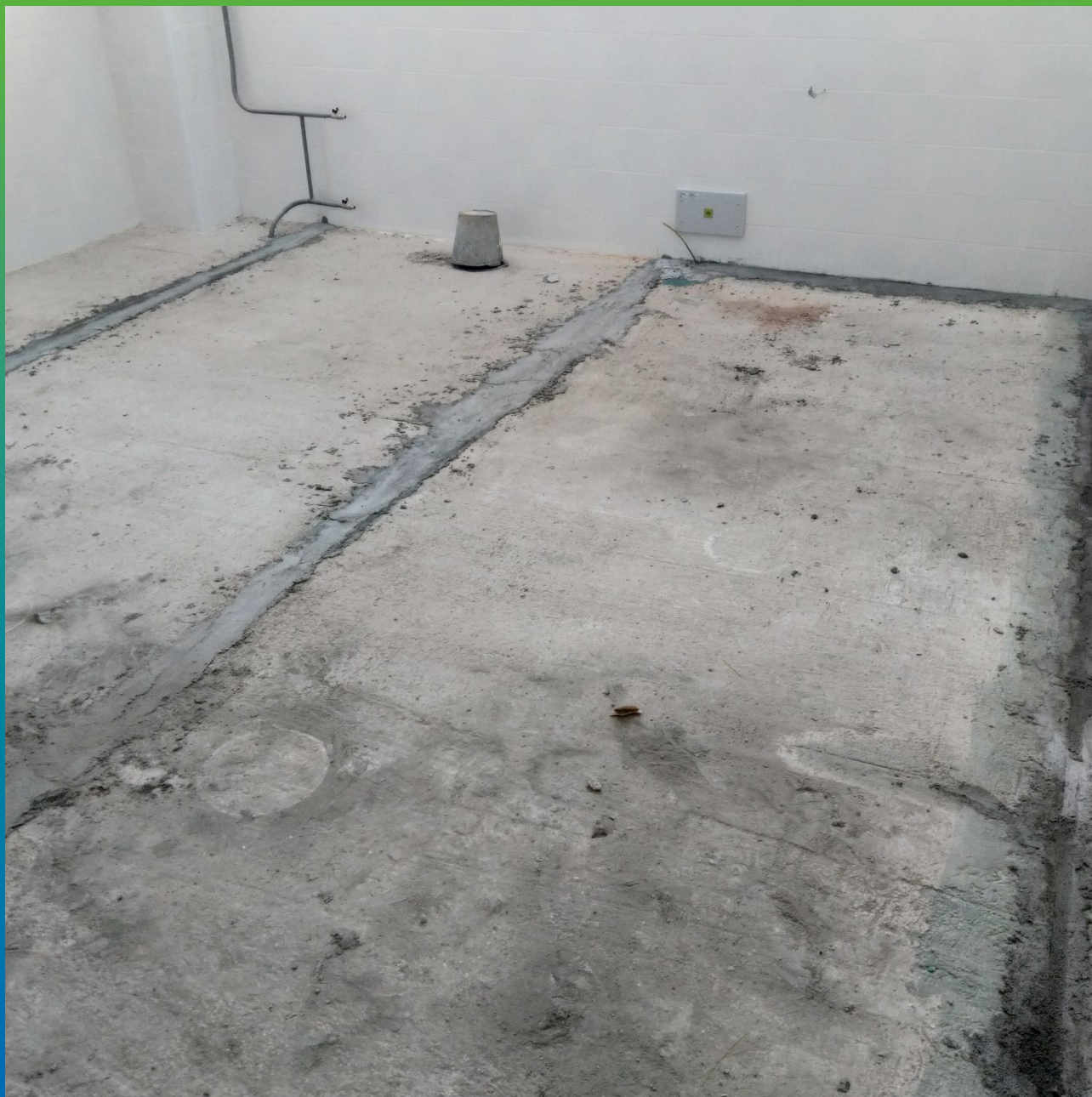
Удаление маяков и ремонт каверн