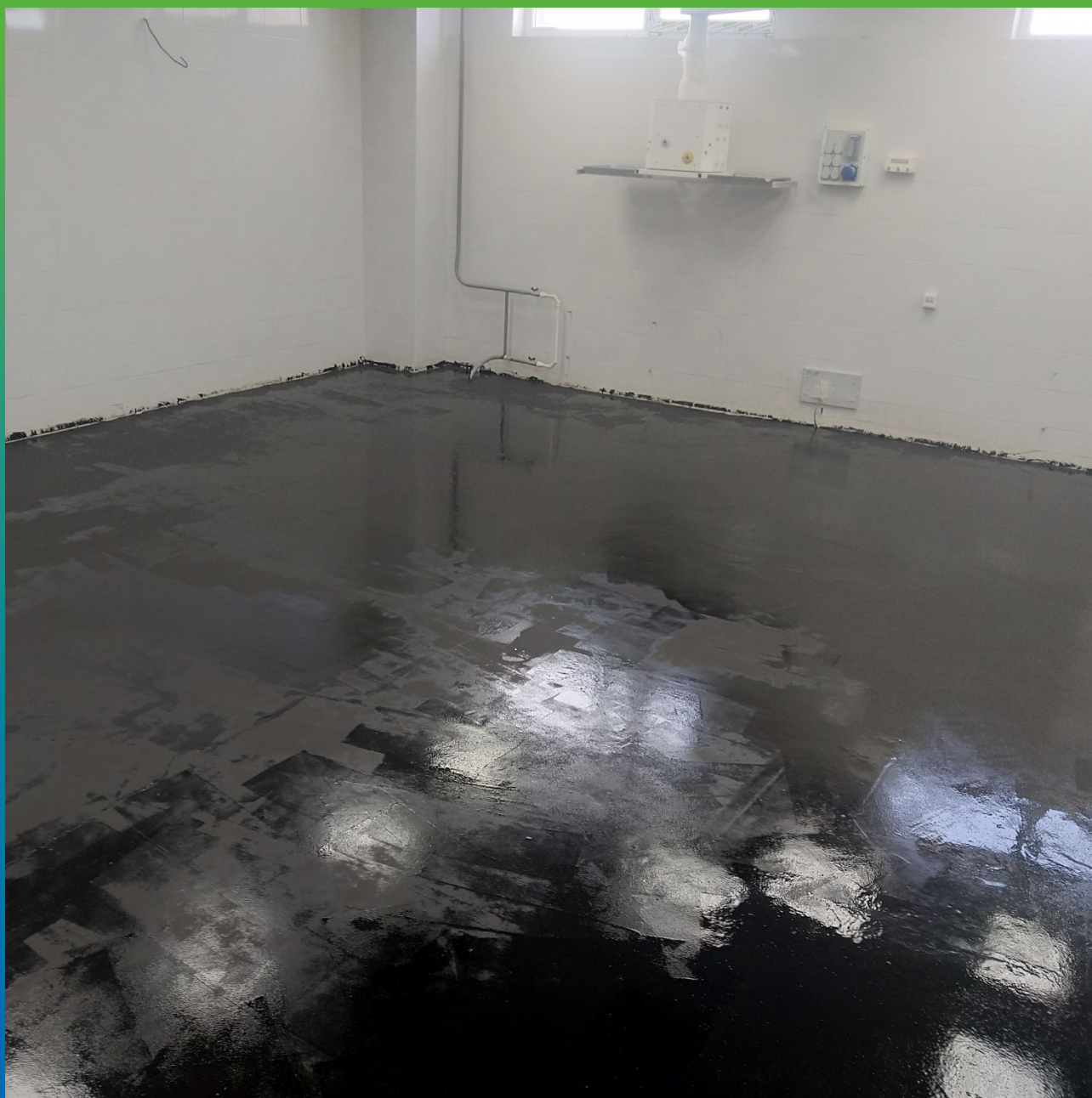
Грунтование поверхности составом ДенсТоп ЭП 106