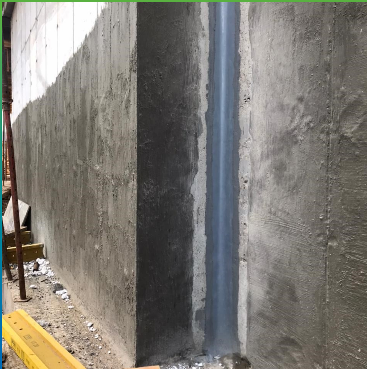
Манодил Про+Манопокс 331