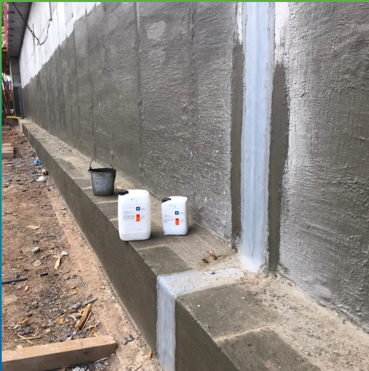
Манодил Про+Манопокс 331