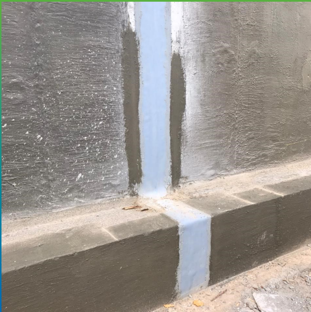
Манодил Про+Манопокс 331