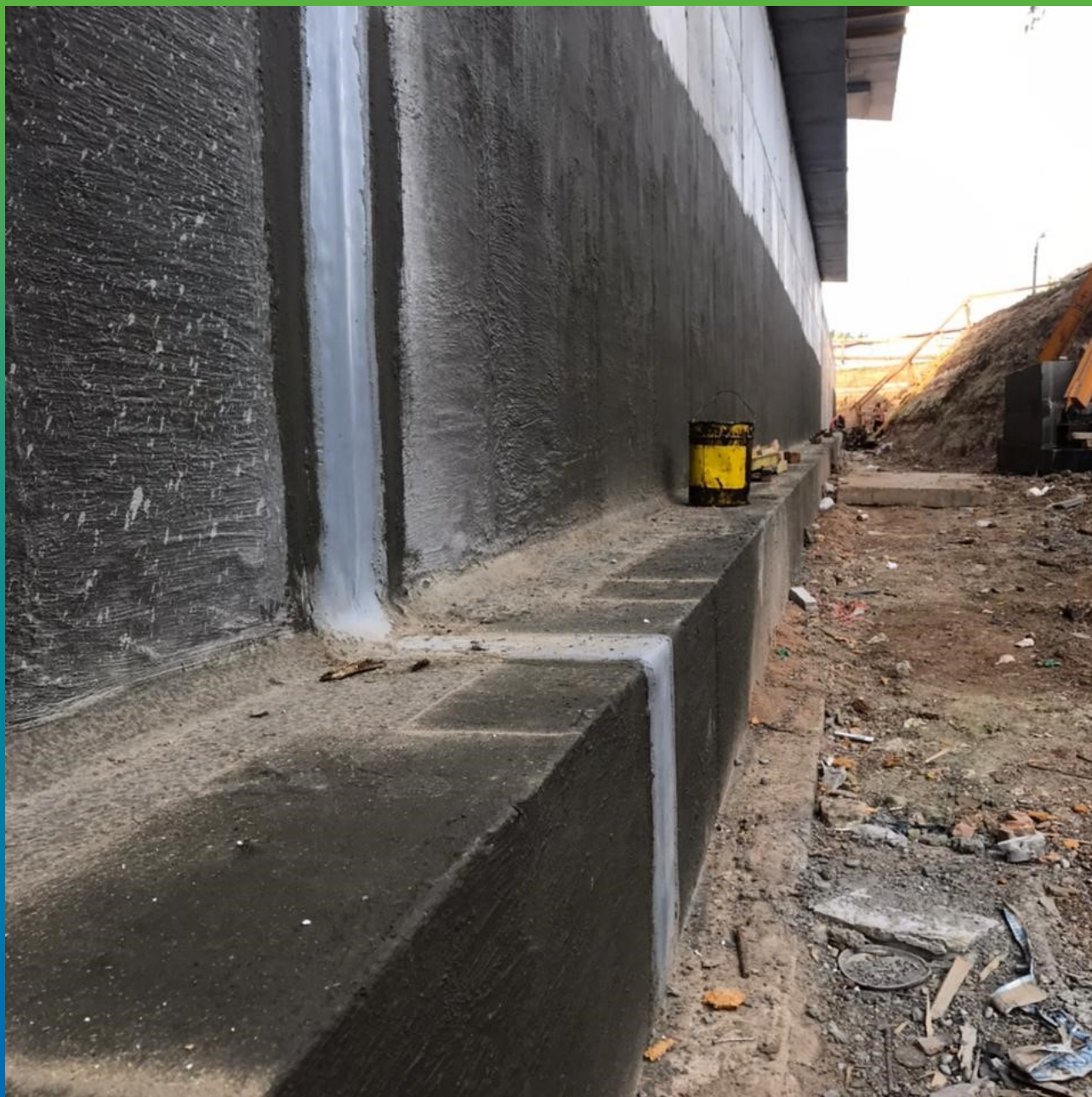
Манодил Про+Манопокс 331