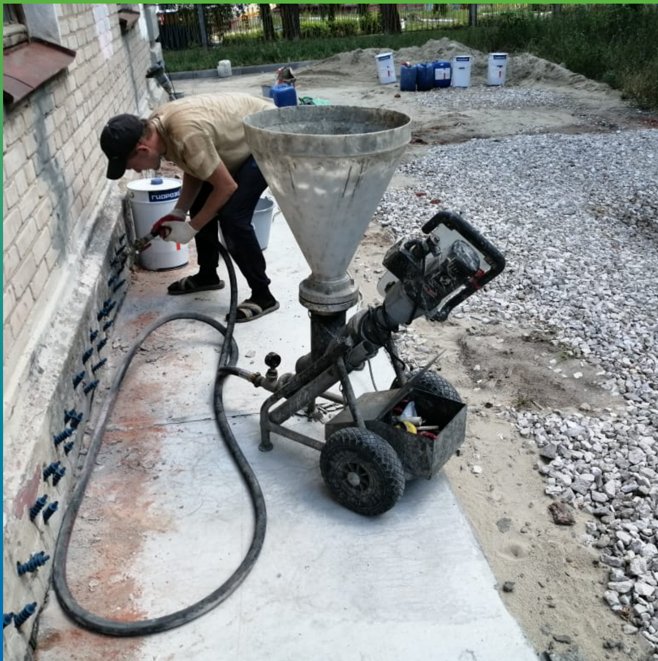
Устройство отсечной гидроизоляции по кирпичной кладке