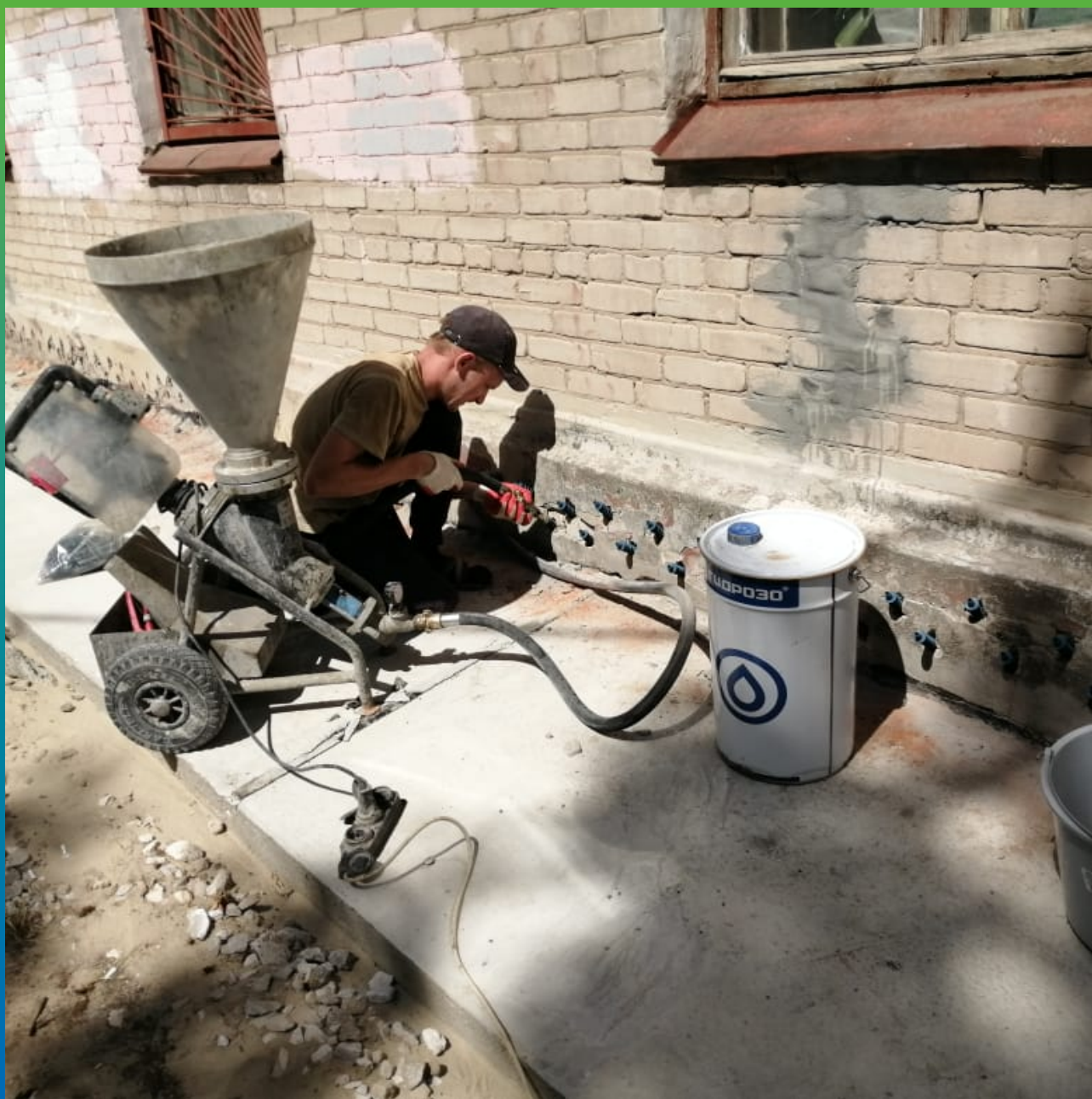
Устройство отсечной гидроизоляции по кирпичной кладке