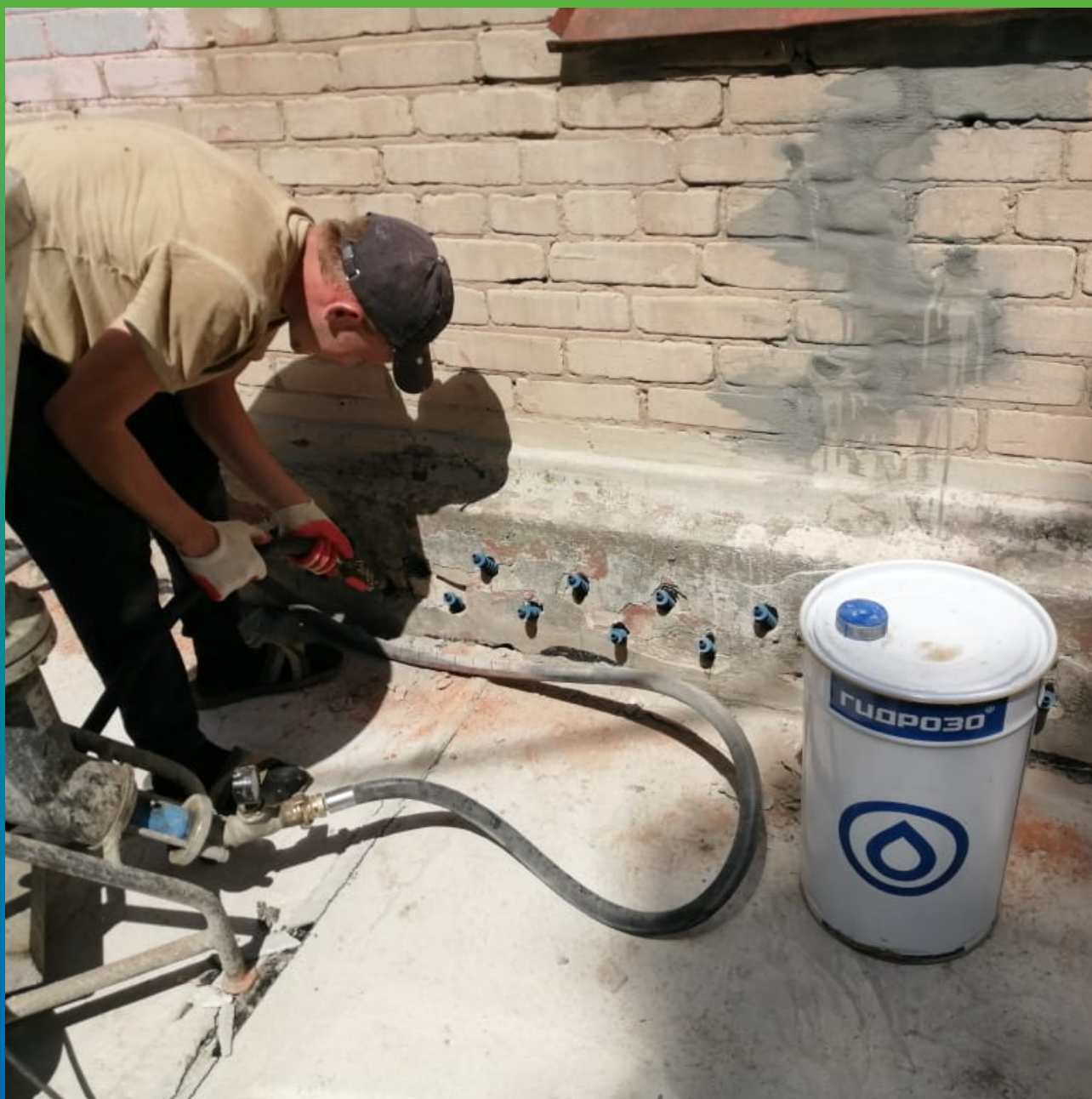
Устройство отсечной гидроизоляции по кирпичной кладке