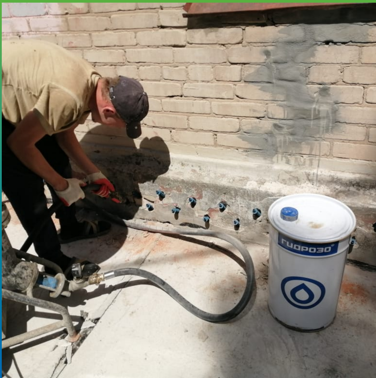
Закачивание инъекционного состава в шпур