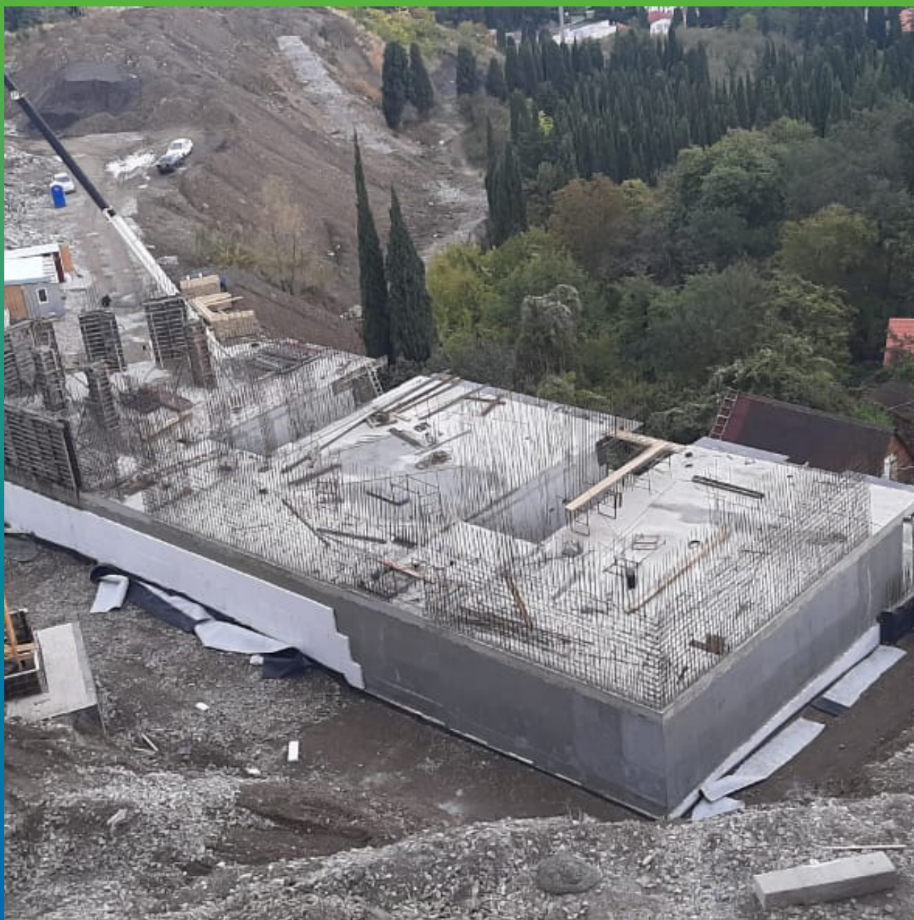
Нанесенный Стармекс Сил Флекс на заглубленной части комплекса