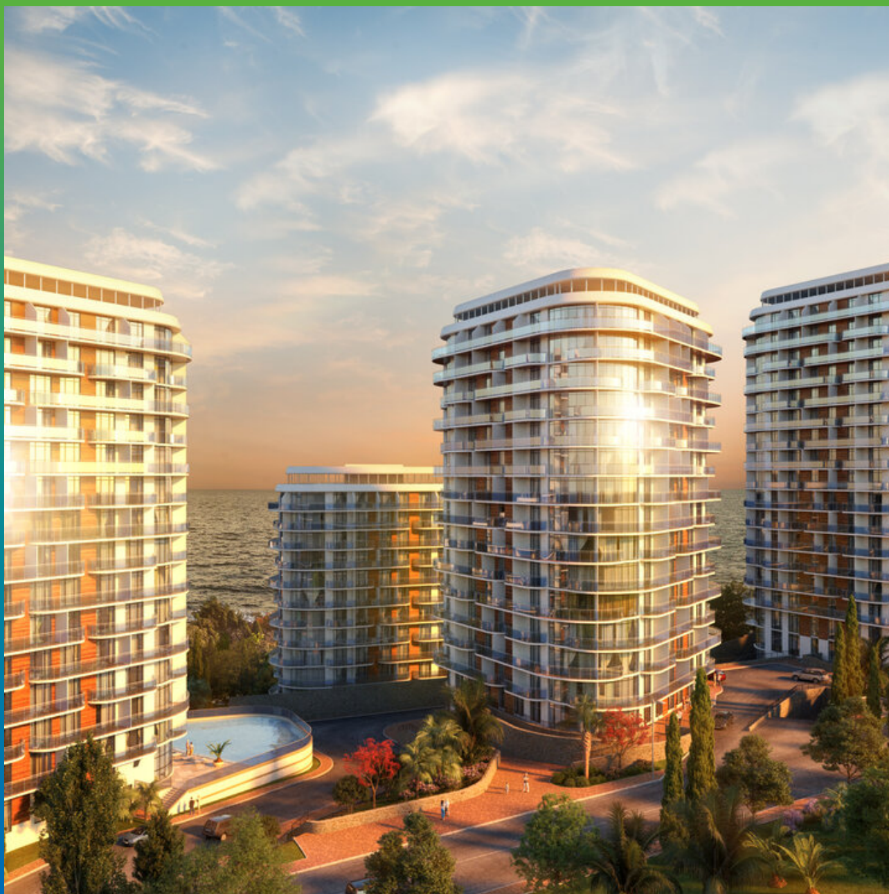
Вид будущего апарт-комплекса