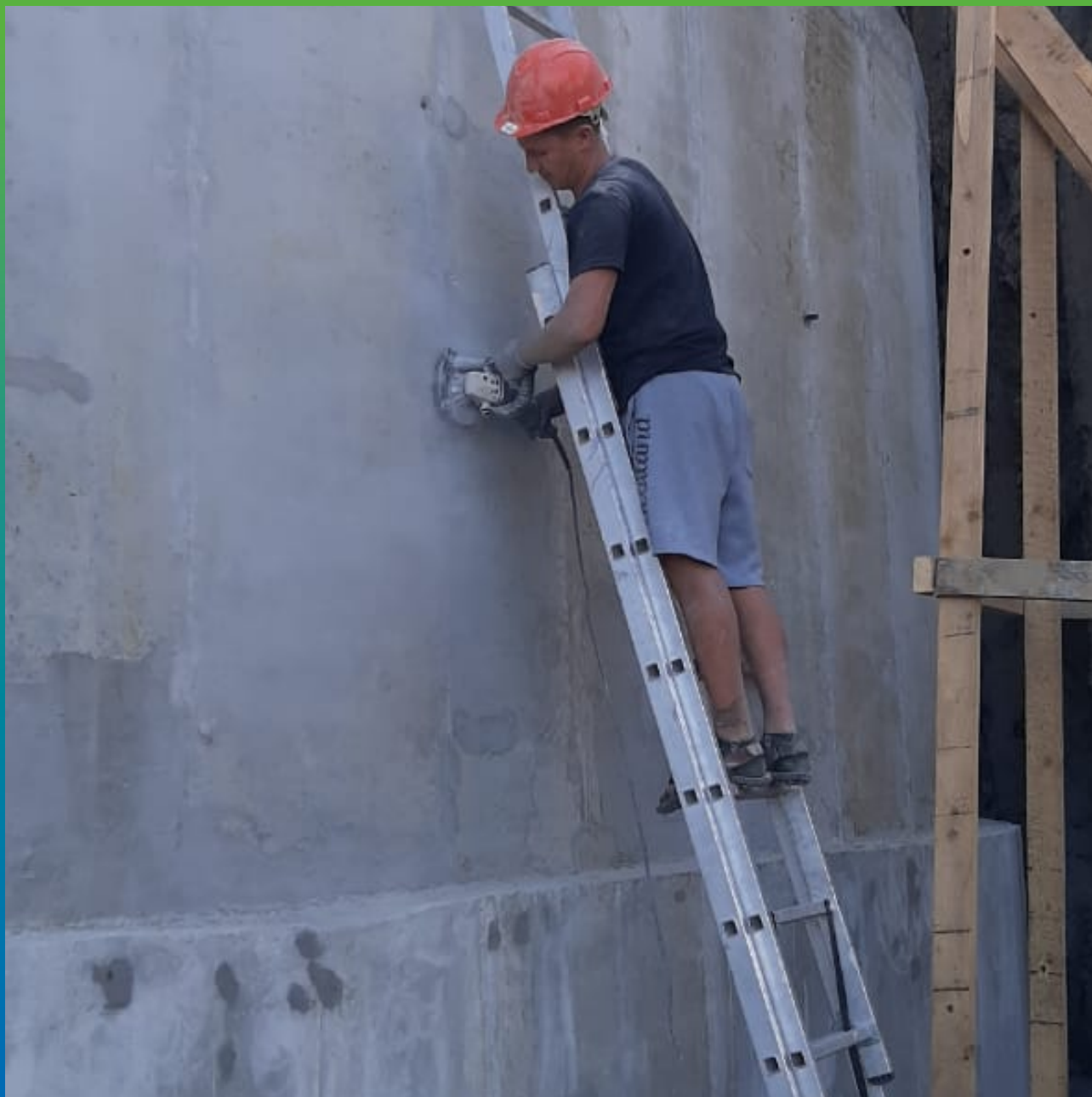
Подготовка бетонной поверхности