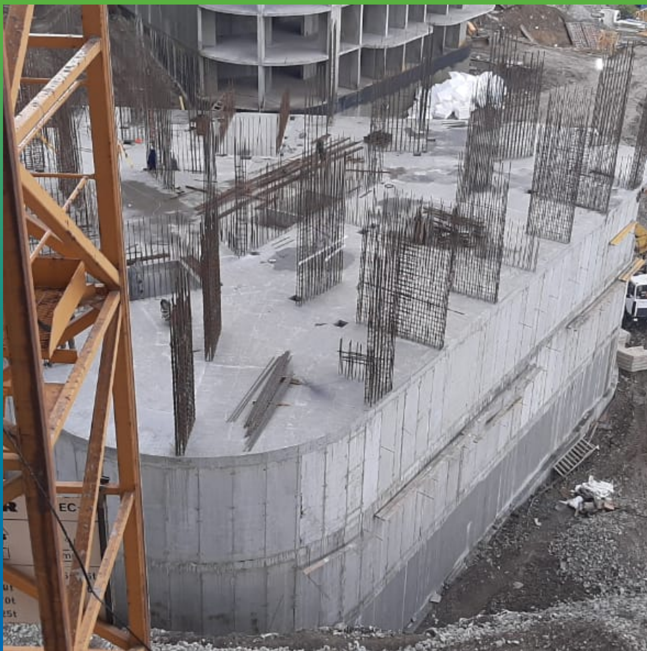
Нанесенный Стармекс Сил Флекс на заглубленной части комплекса