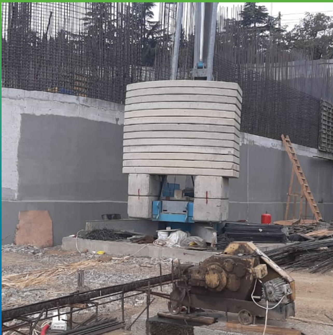
Нанесенный Стармекс Сил Флекс на заглубленной части комплекса