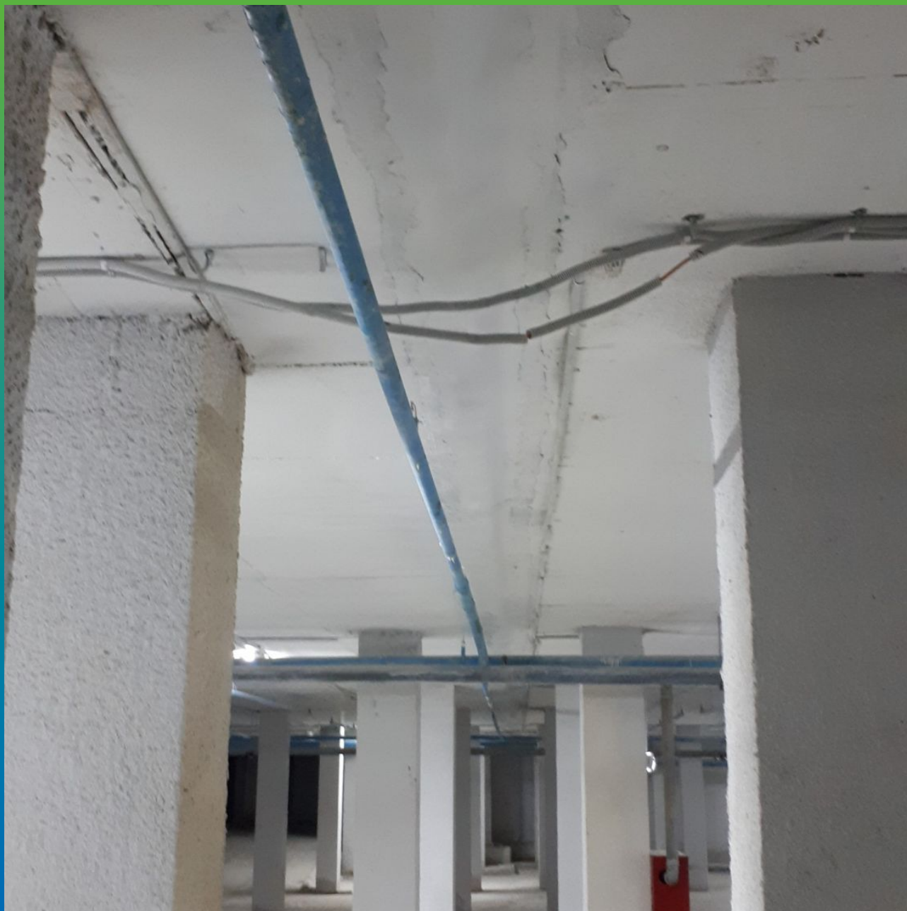
Вид деформационного шва после монтажа ленты