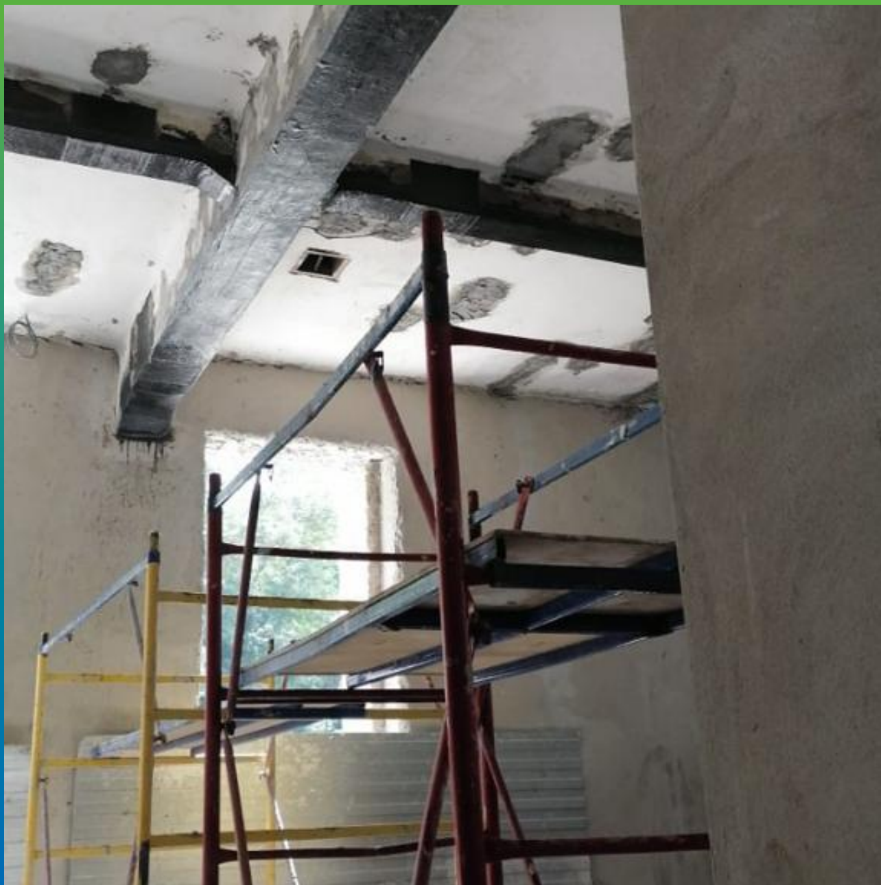
Несущие конструкции после процесса усиления композитной системой