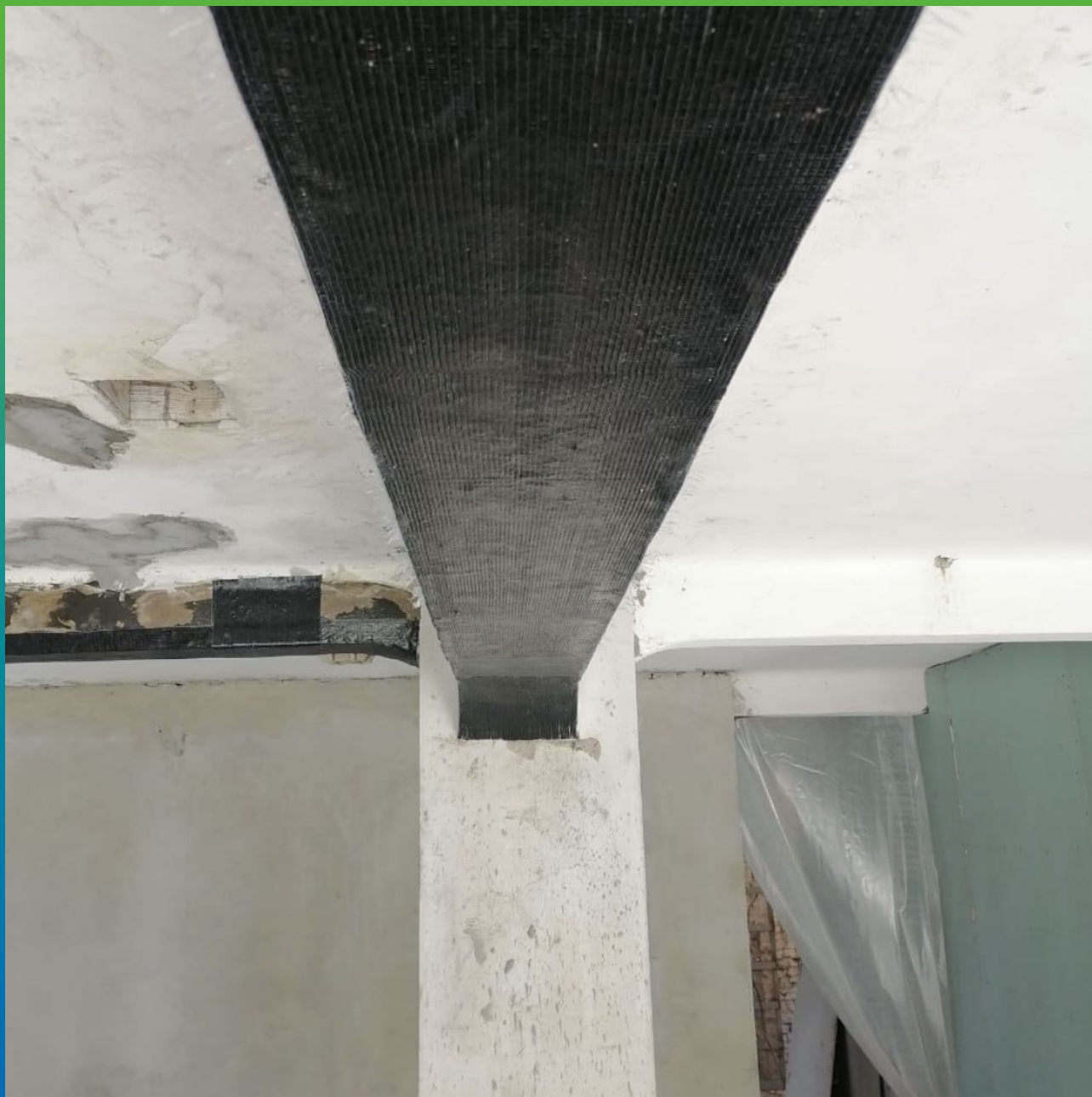
Несущие конструкции после процесса усиления композитной системой