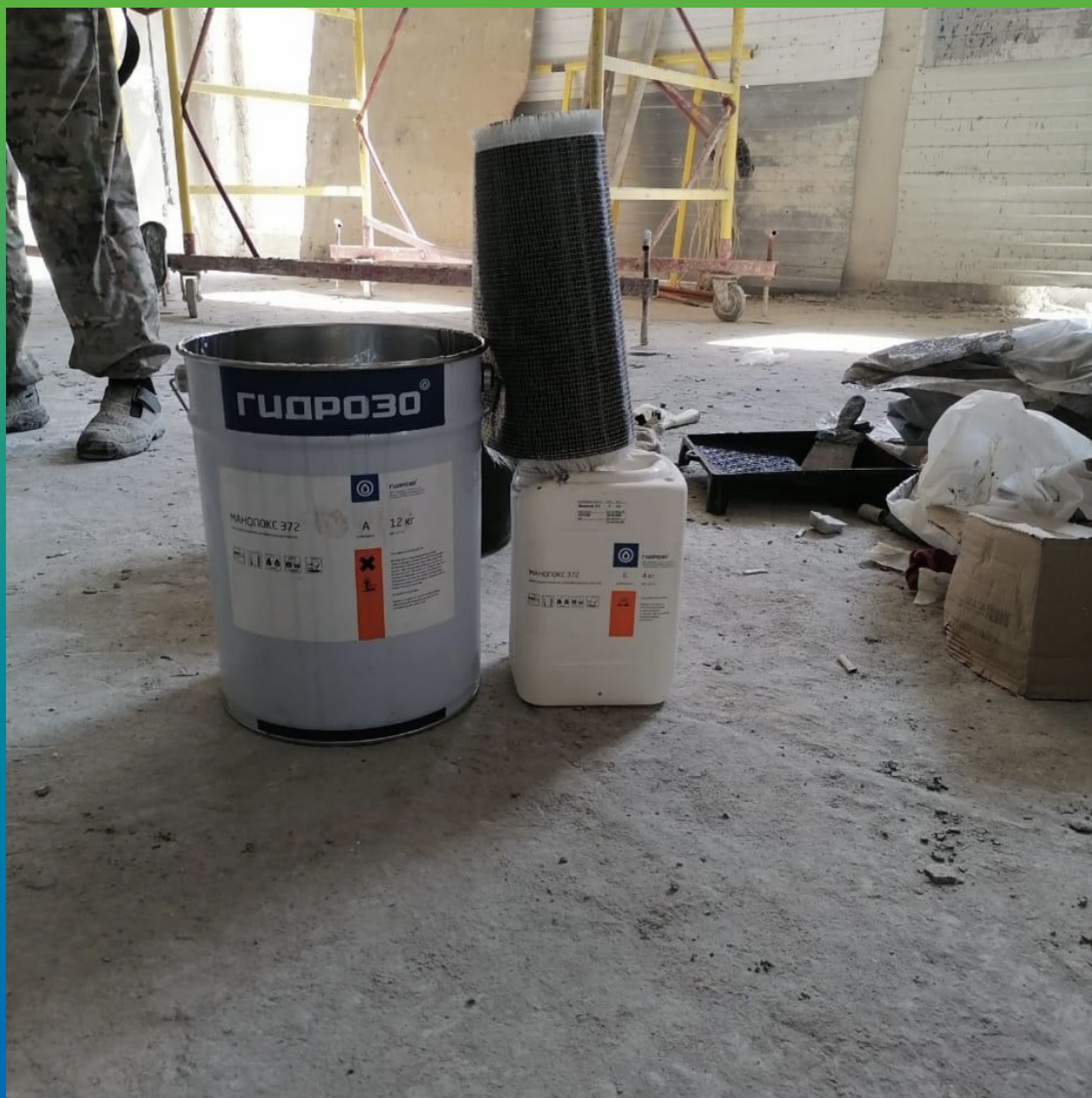
Углекхолст Армошел КВ 500