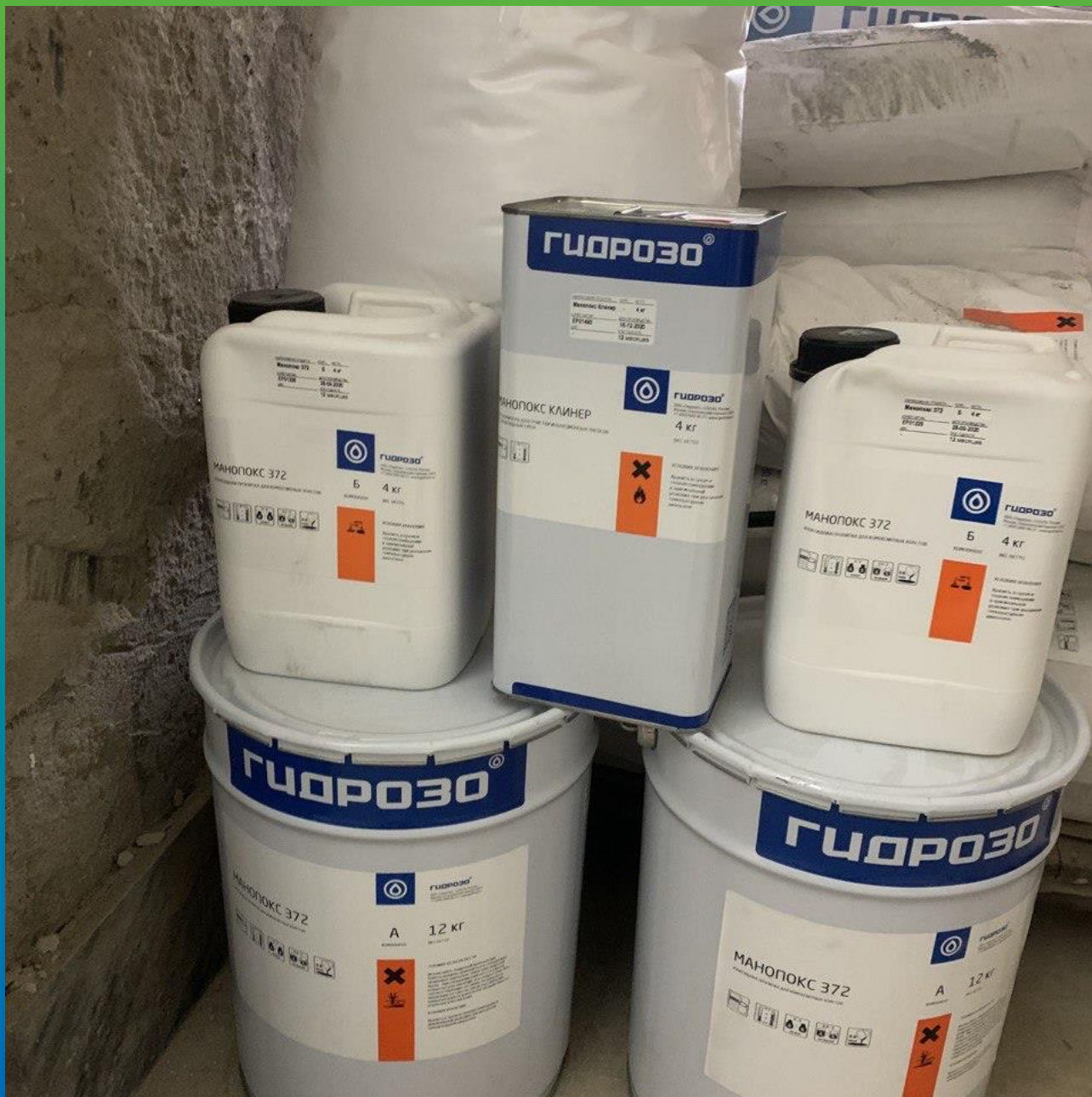
Эпоксидная пропитка с низкой плотностью - Манопокс 372