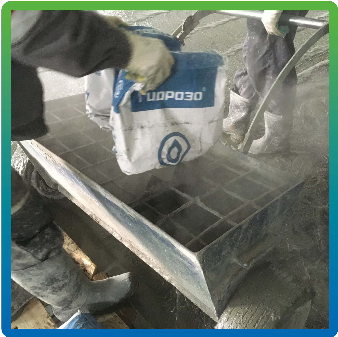
Нанесение Стармекс Топ