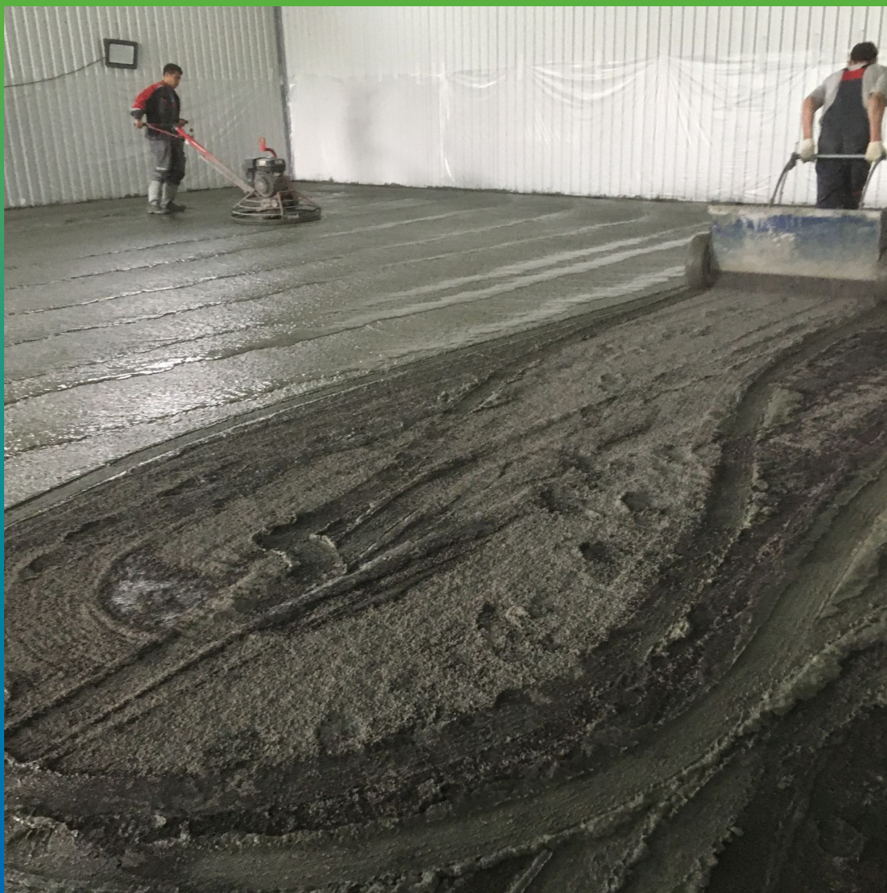
Нанесение Стармекс Топ