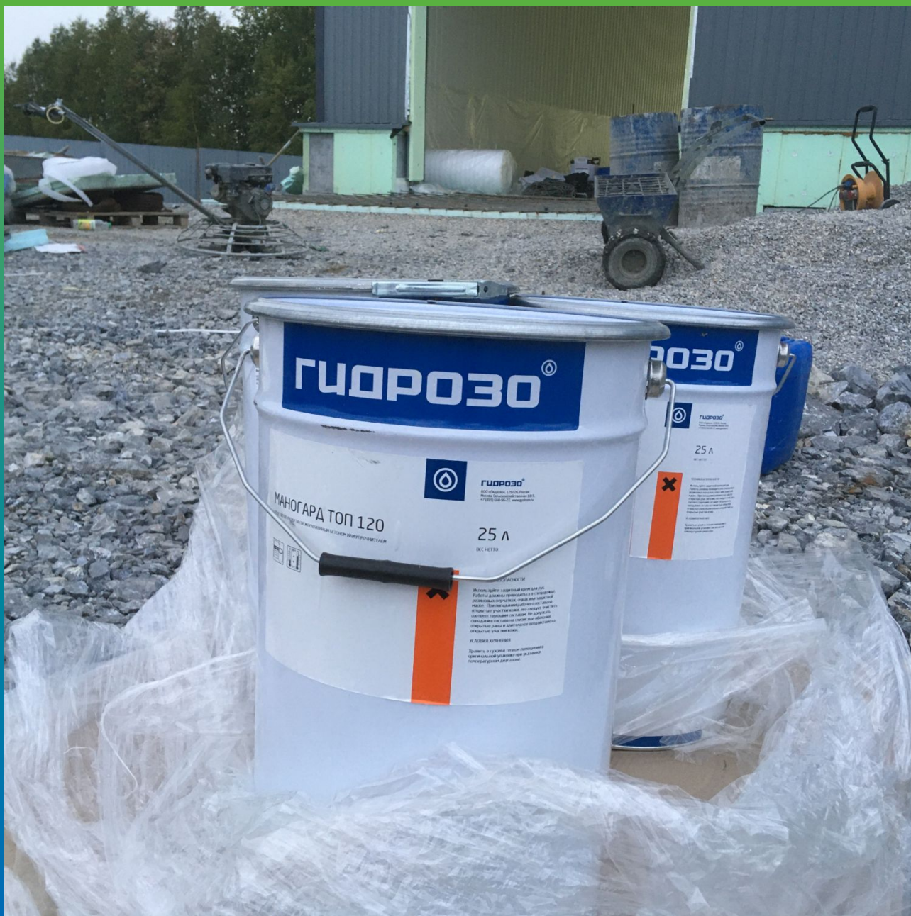
Кьюринг Маногард Топ 120 на объекте