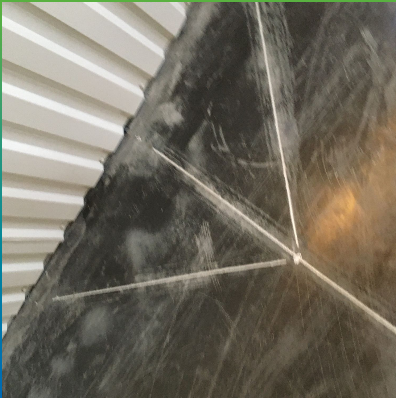
Анкерные пропилы на выполненном покрытии