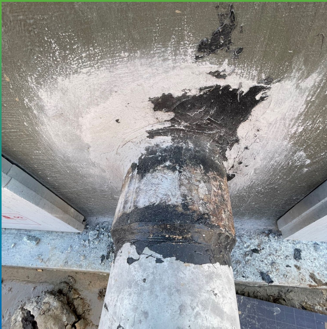
Ввод коммуникаций, заполненный Стармекс РМЗ