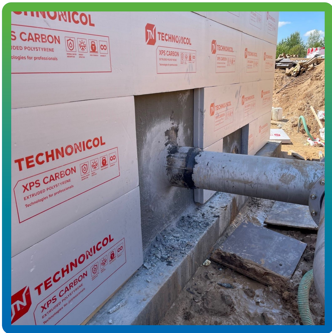
Ввод коммуникаций, заполненный Стармекс РМЗ