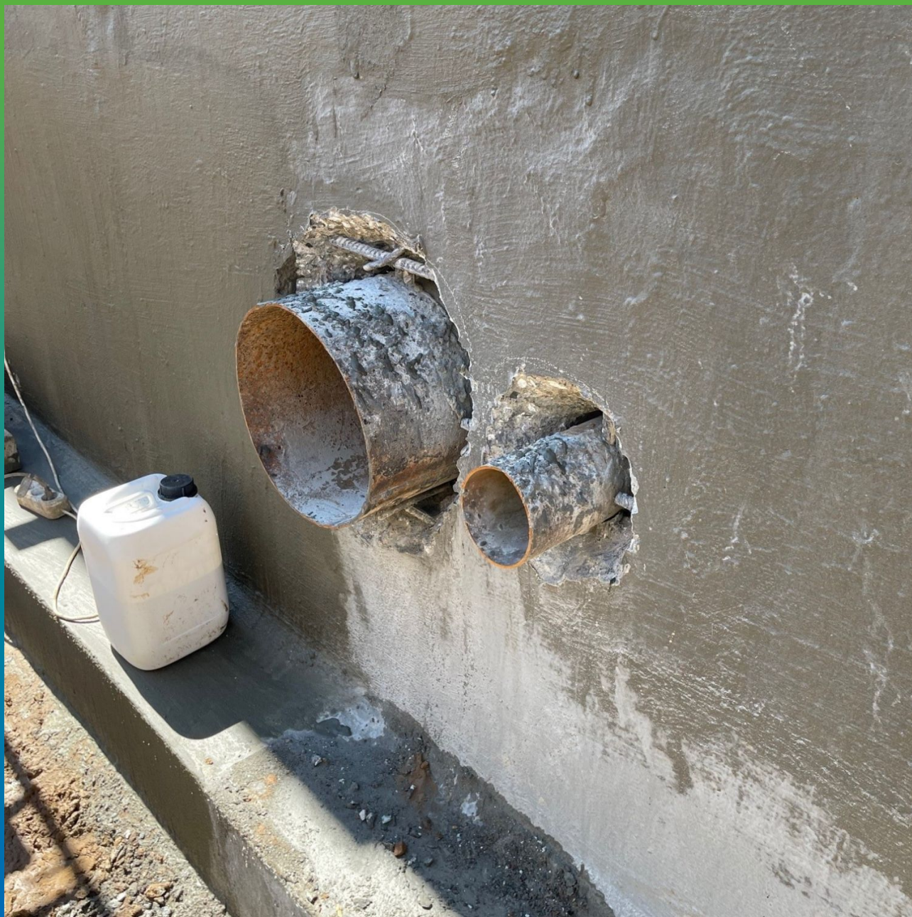
Расшивка ввода коммуникаций