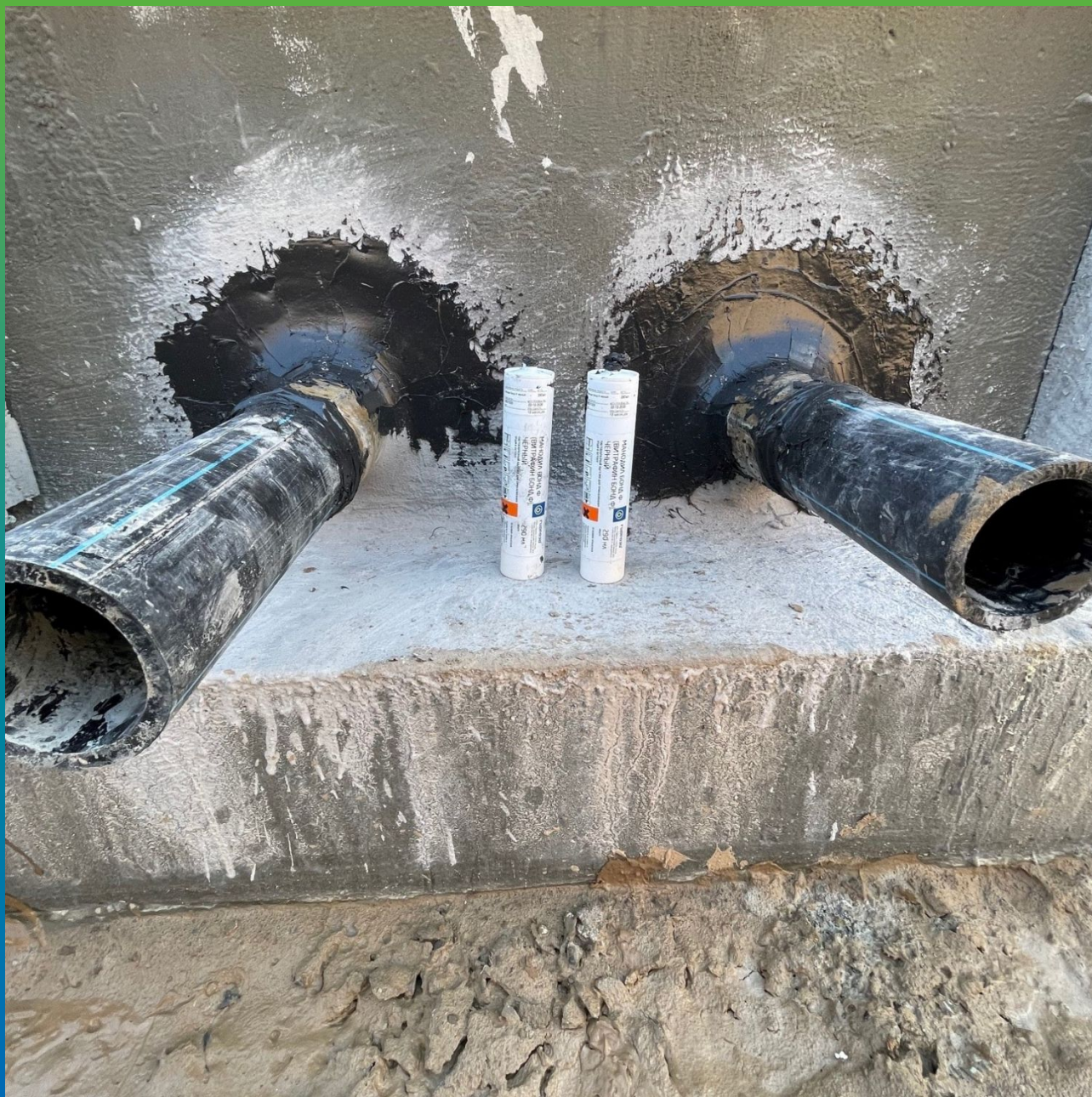
Манодил Бонд ф, нанесенный на ввод коммуникаций