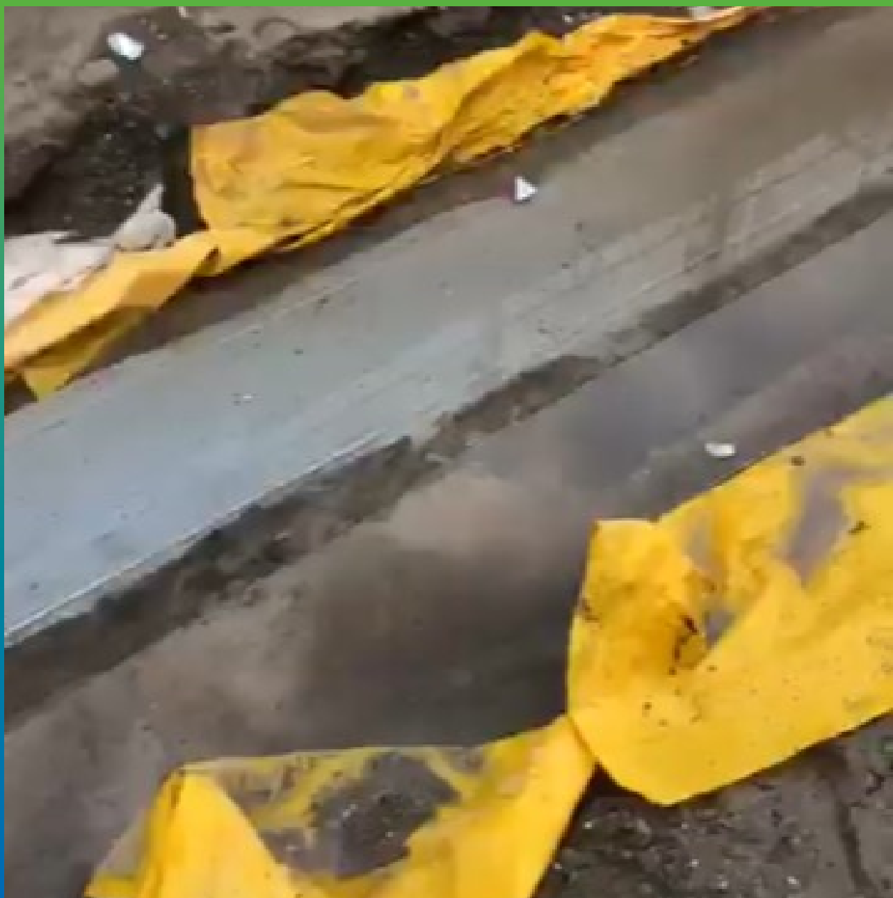
Фото шва после выполнения работ, стадия пролива раскрытие 80мм