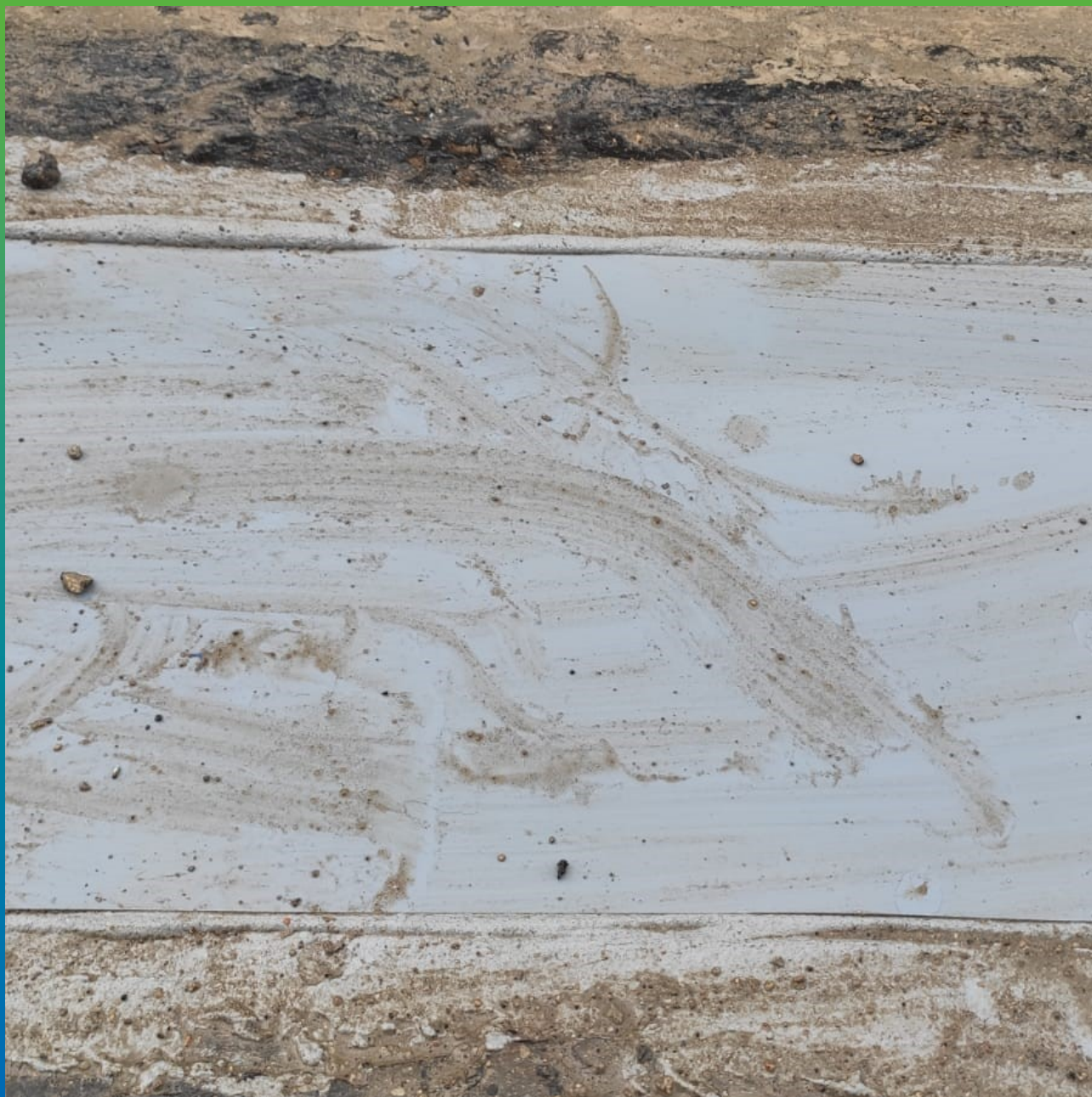
Фото шва после выполнения работ раскрытие 80мм