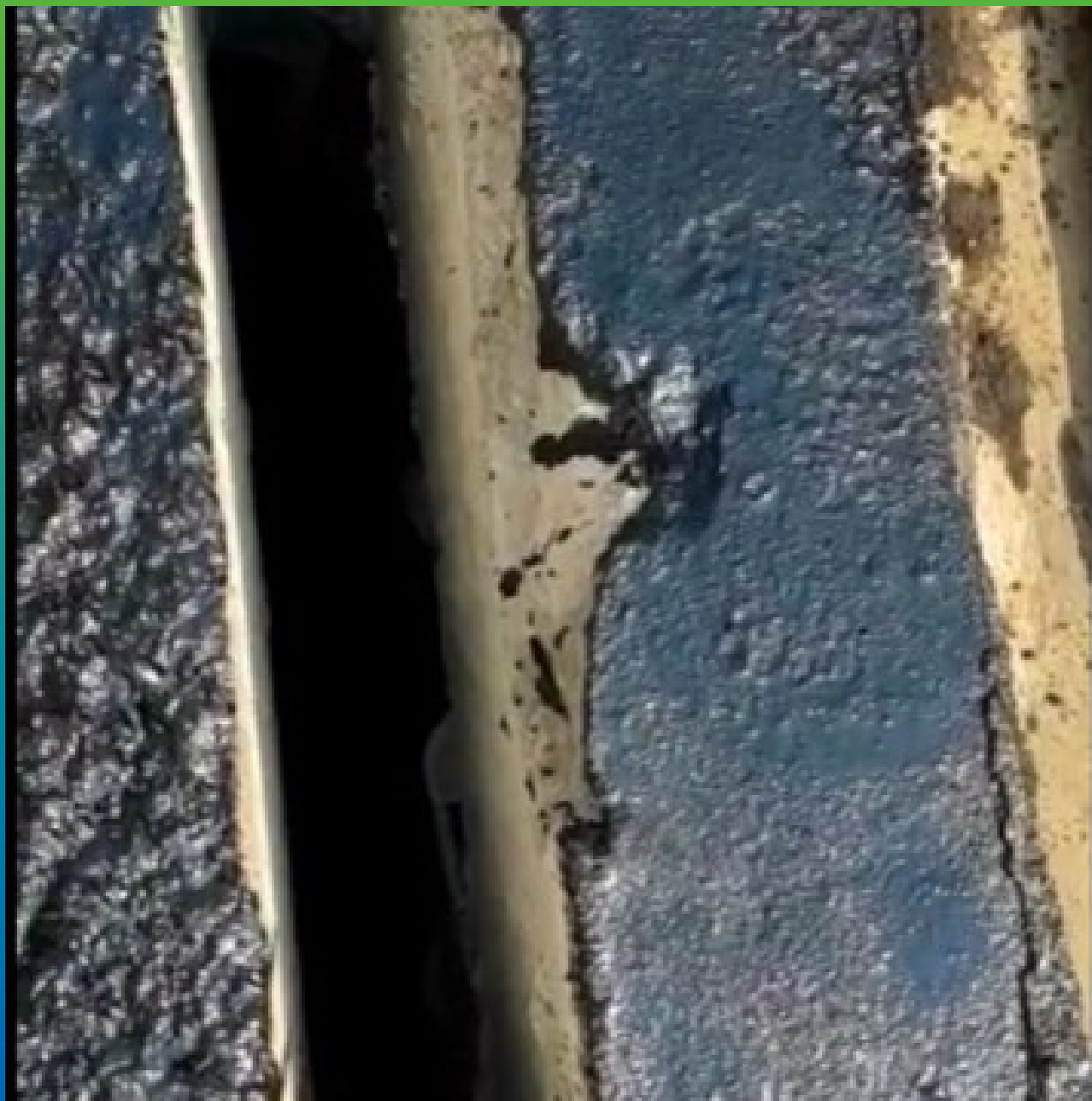
Фото шва до выполнения работ раскрытие 80мм