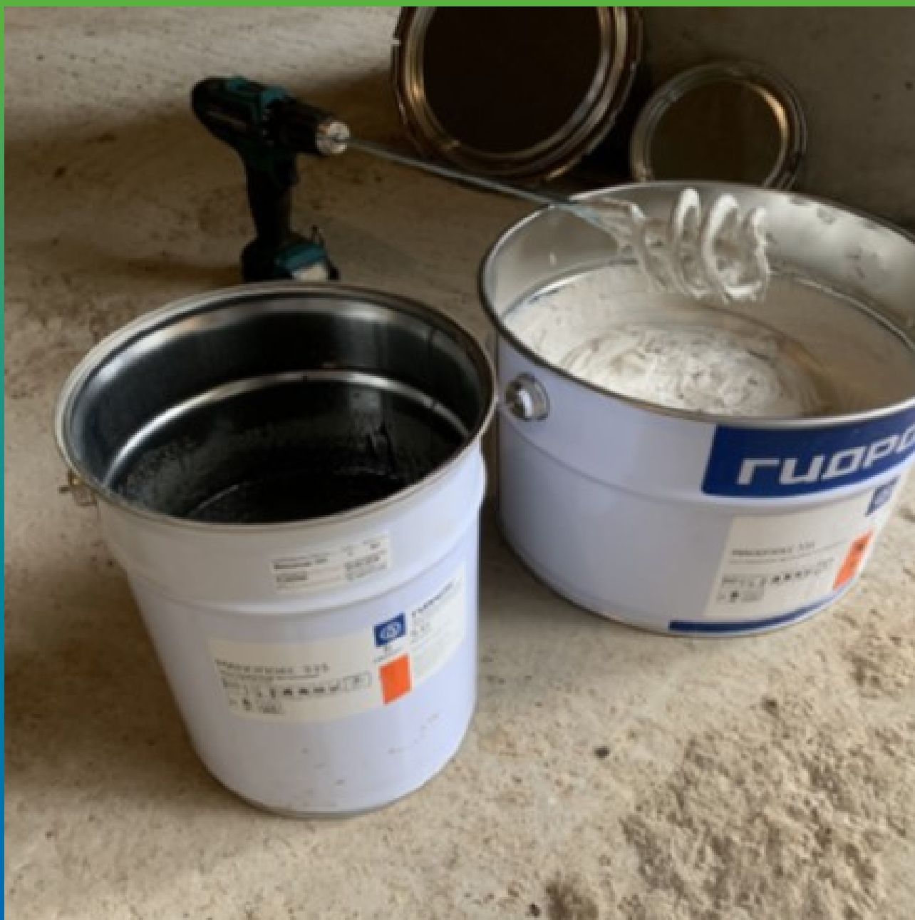
Материал на объекте