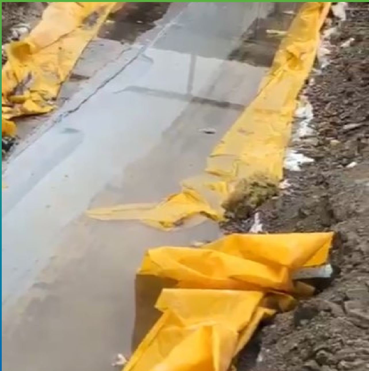
Фото шва после выполнения работ, стадия пролива раскрытие 80мм