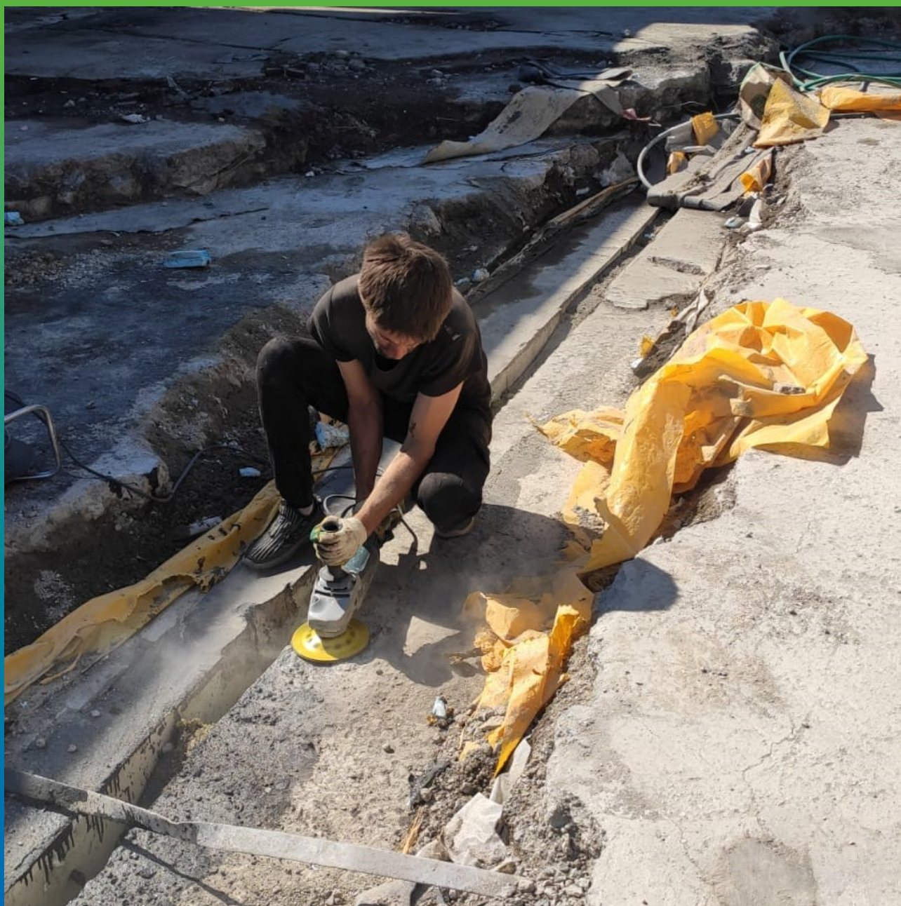
Подготовка шва, фрезеровка основания.