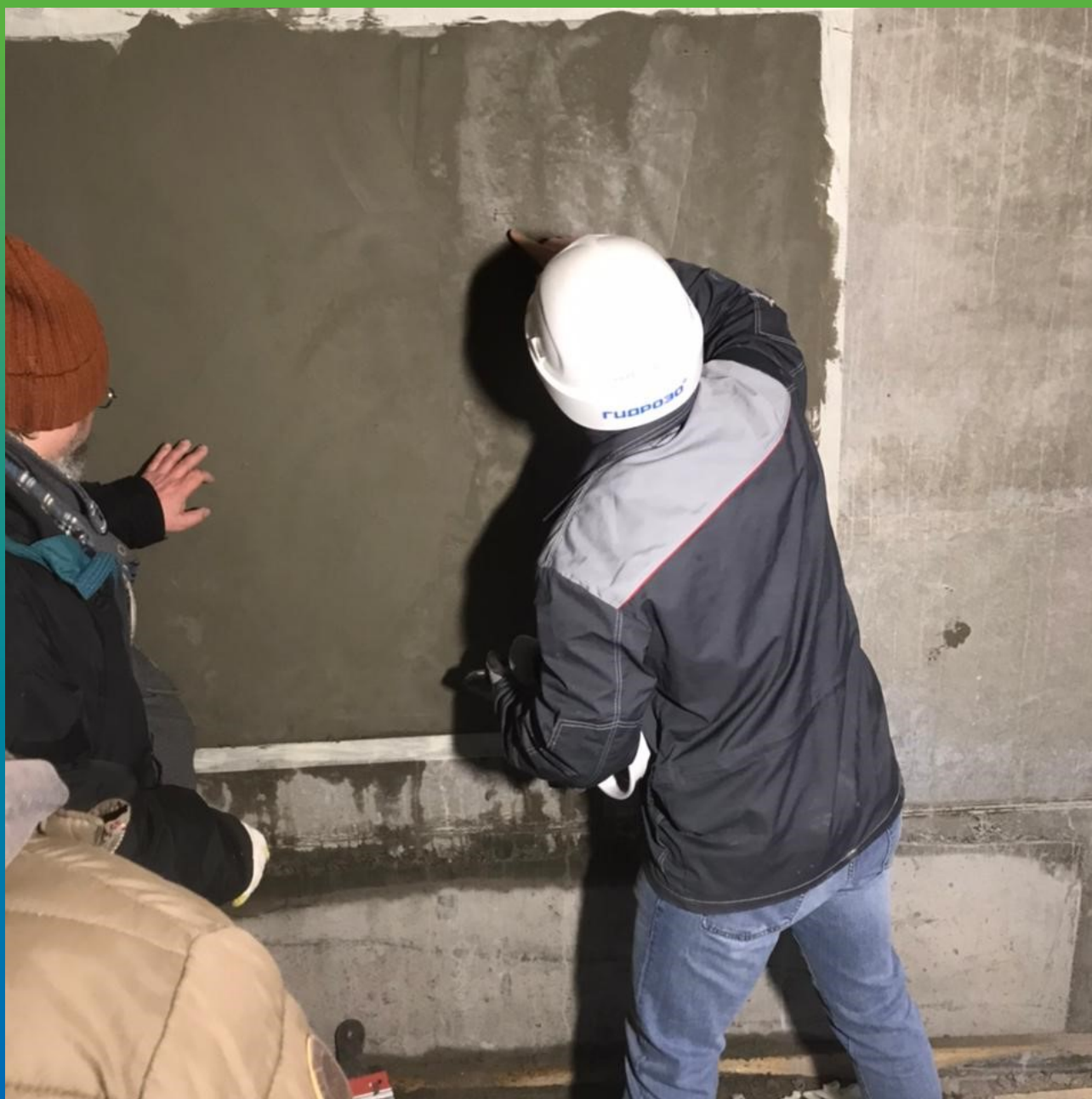
Выведение финишной плоскости резервуара Ластоногих составом Стармекс РМ2 (пробный участок с шеф монтажем)