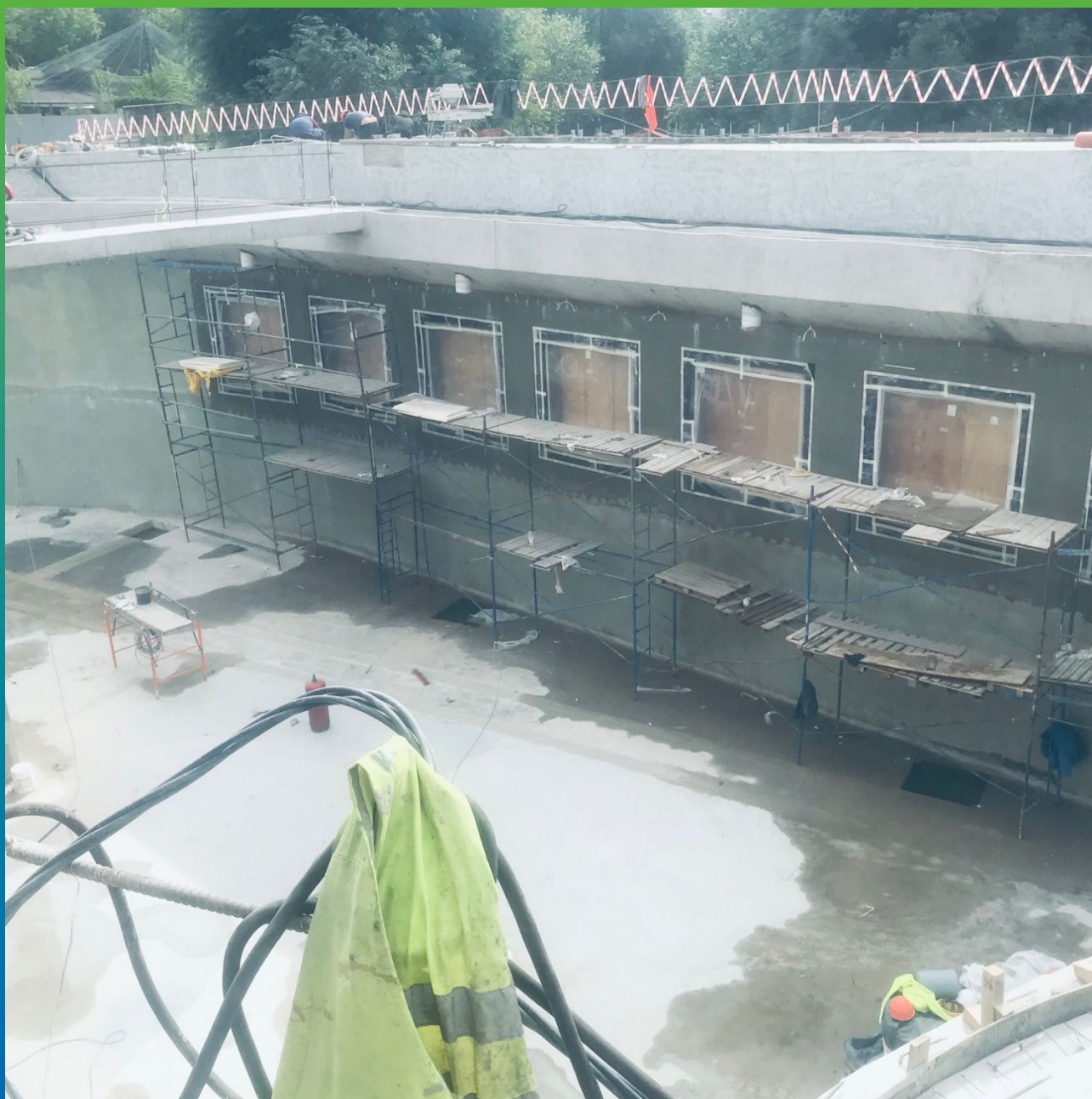
Ремонт поверхностей оконных проемов Манопоксом 331