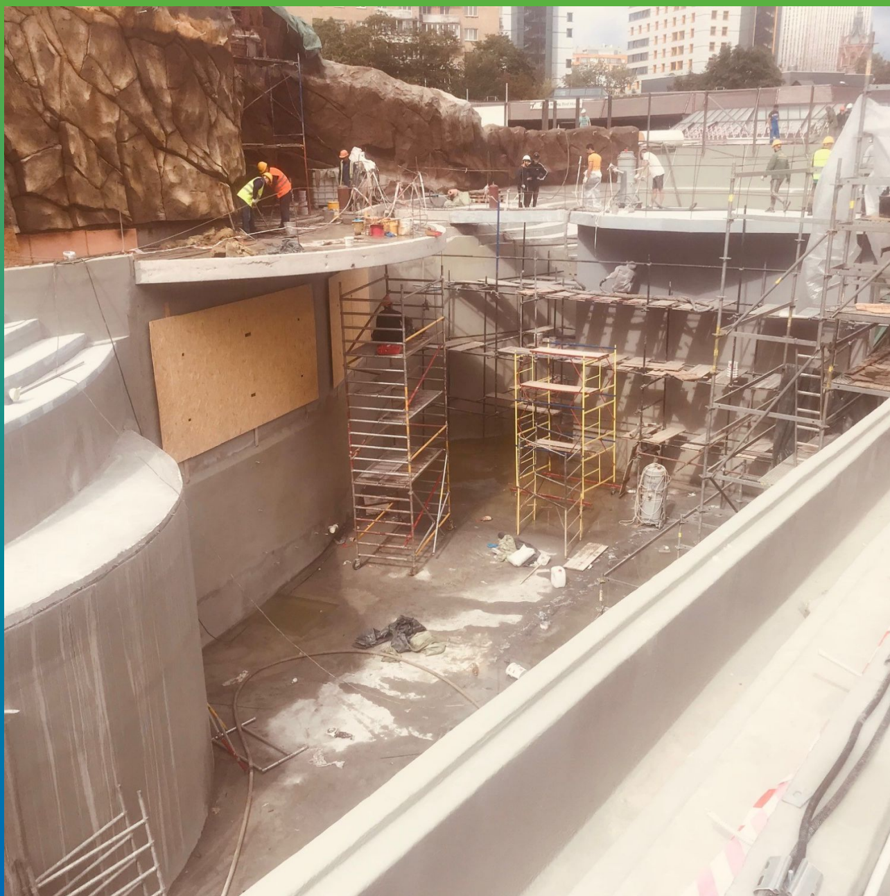
Объект до начала работ