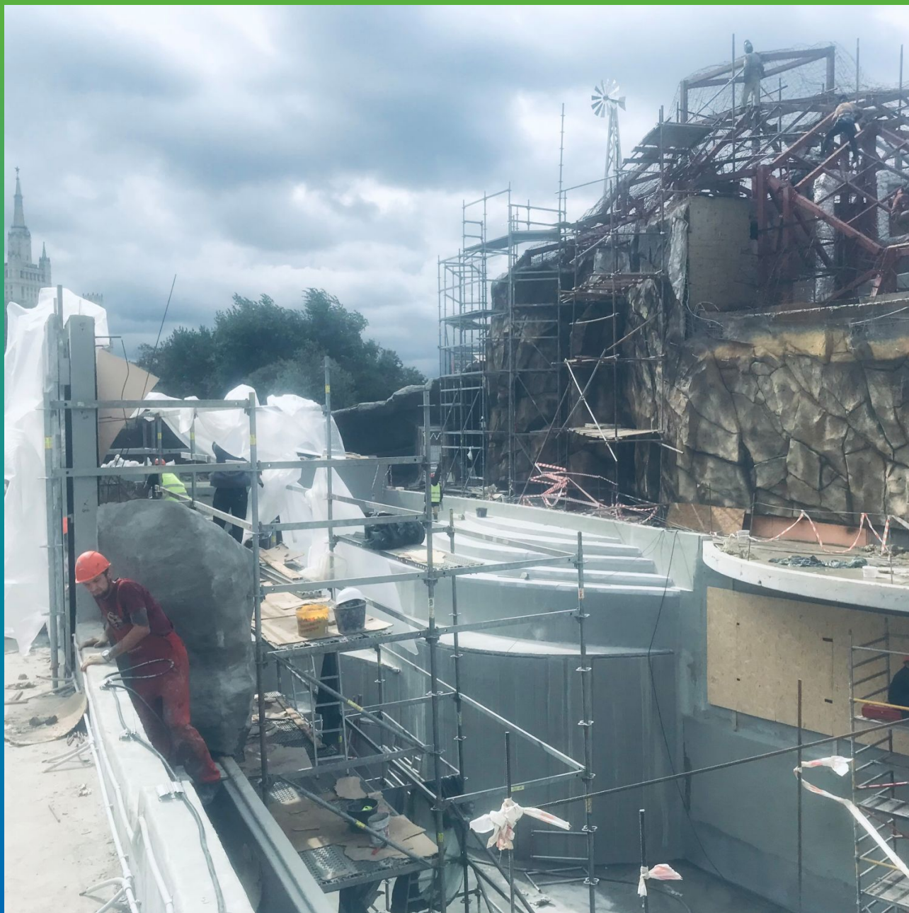
Работы по нанесению Стармекс Сил Флекс