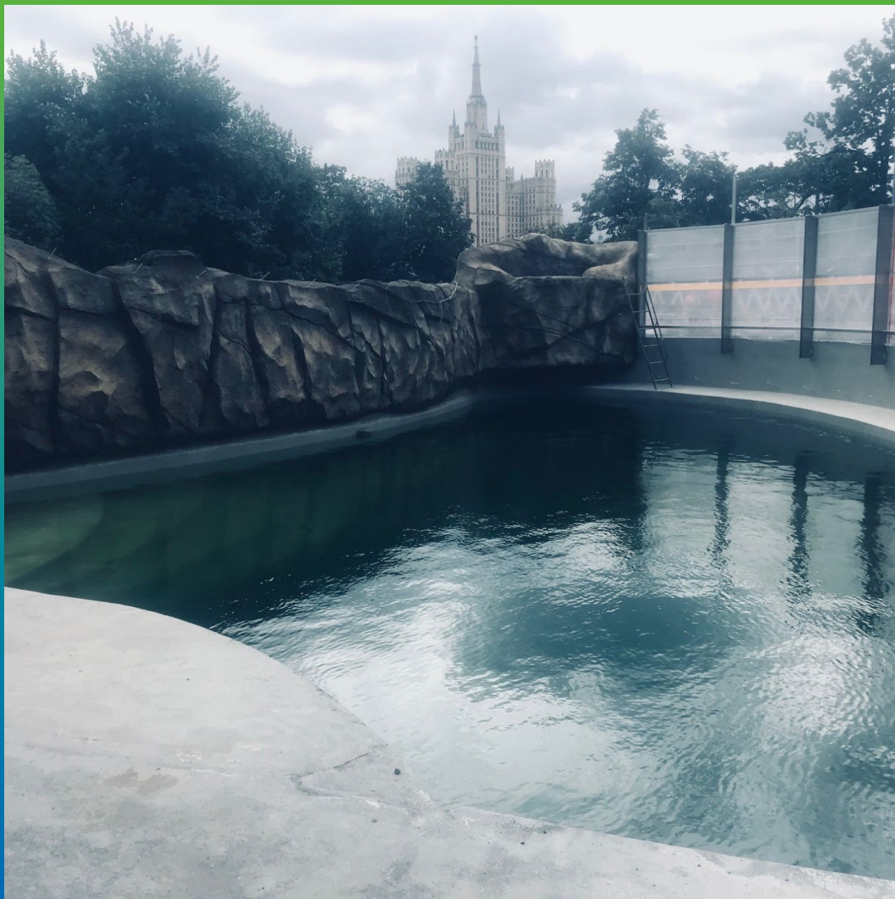
Гидростатические испытания второго бассейна