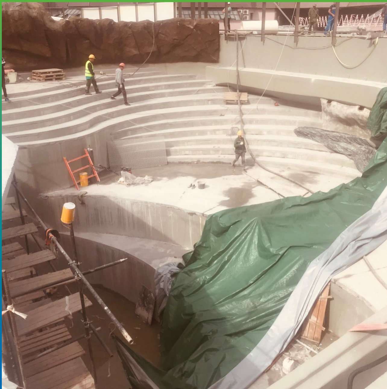
Устройство гидроизоляционного слоя Стармекс Сил Флекс в бассейнах