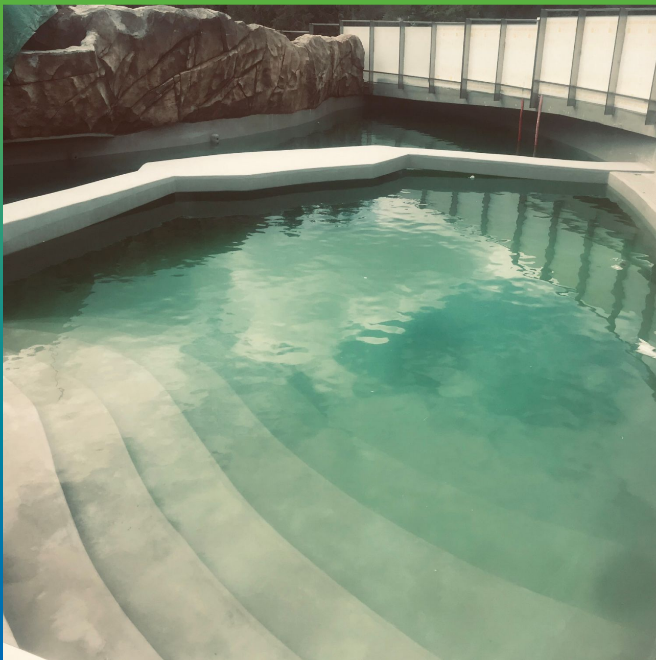
Первый бассейн - гидростатические испытания