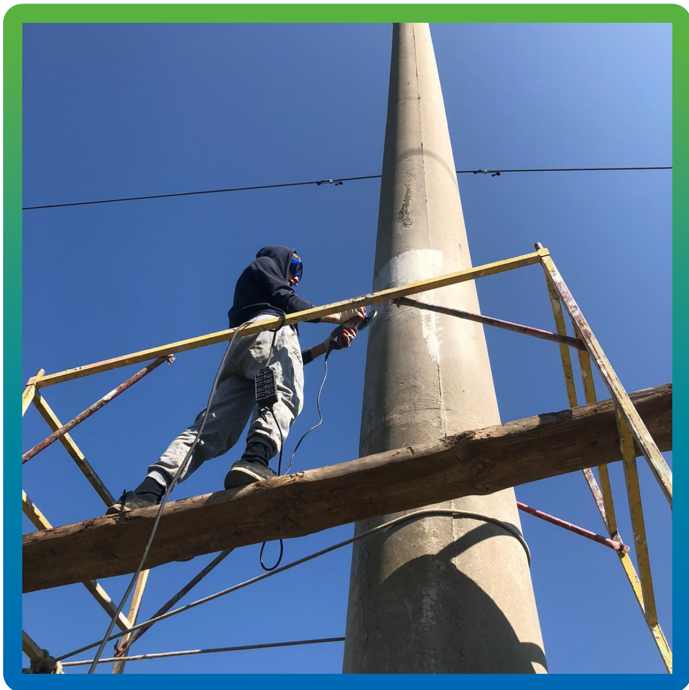
Подготовка основания к монтажу КСУ