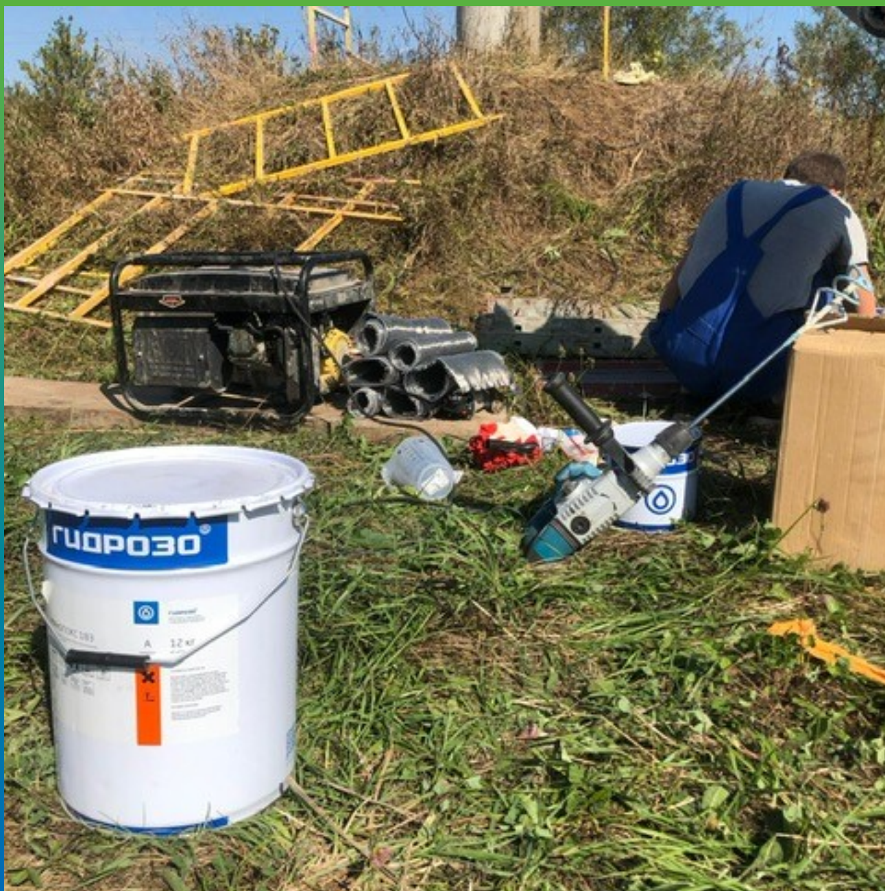
Материал на объекте