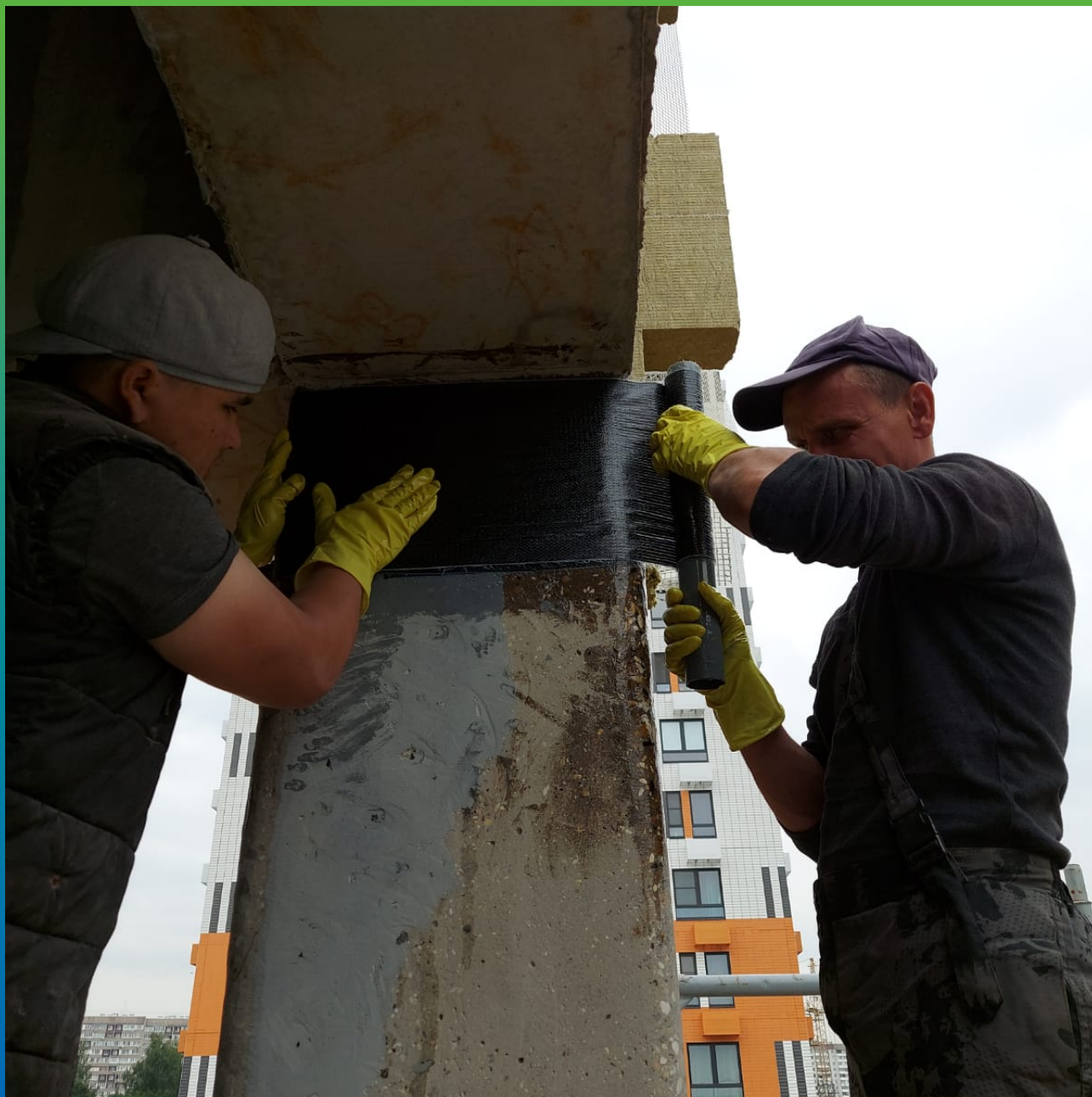
Приклеивание Армошел КВ 200 при помощи эпоксидного клея Манопокс 372