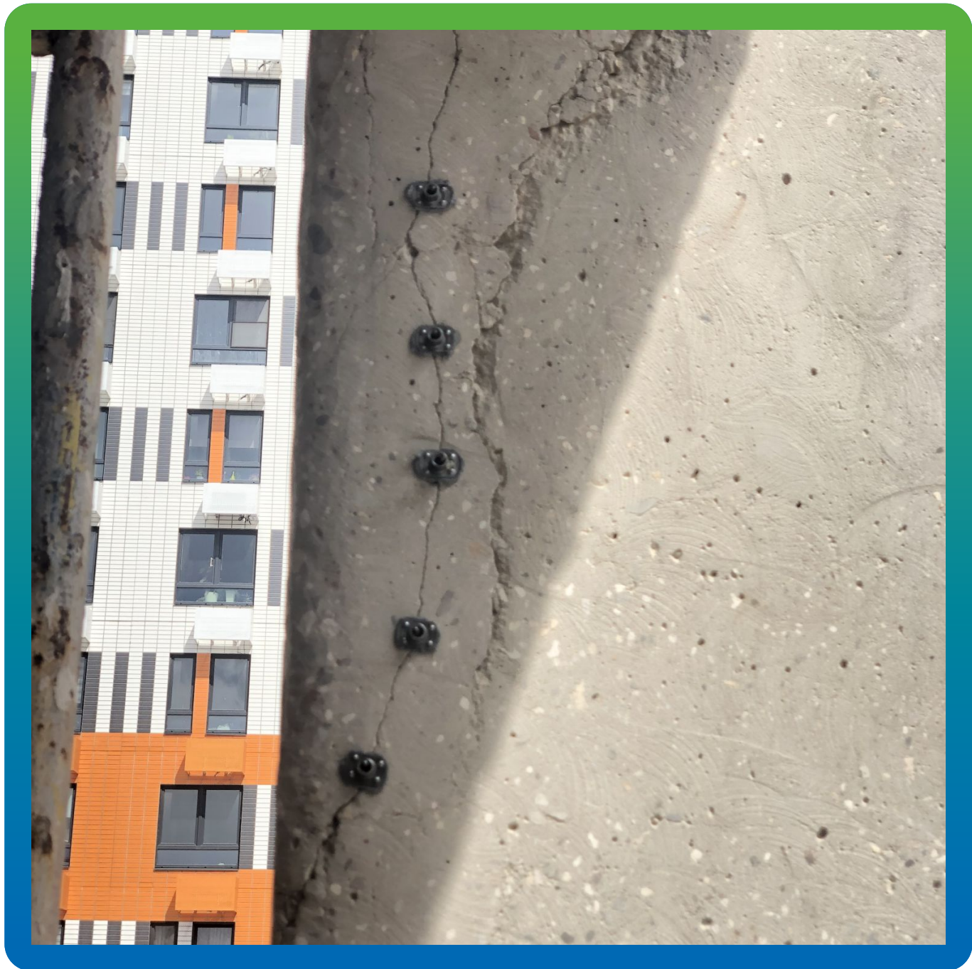
Приклеивание адгезионных пакеров на эпоксидный клей Манопокс 331