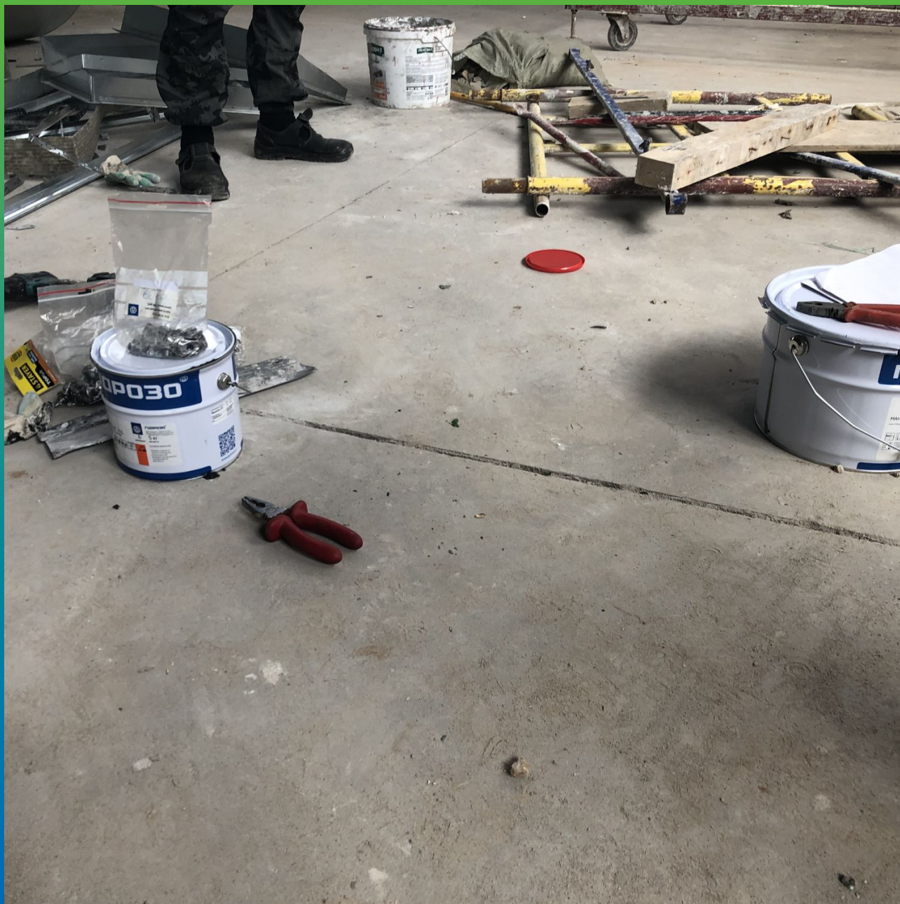
Материал на объекте