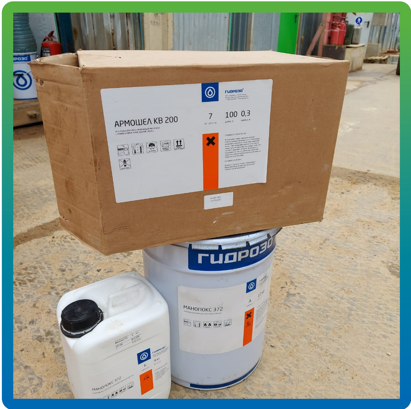
Система усиления на объекте