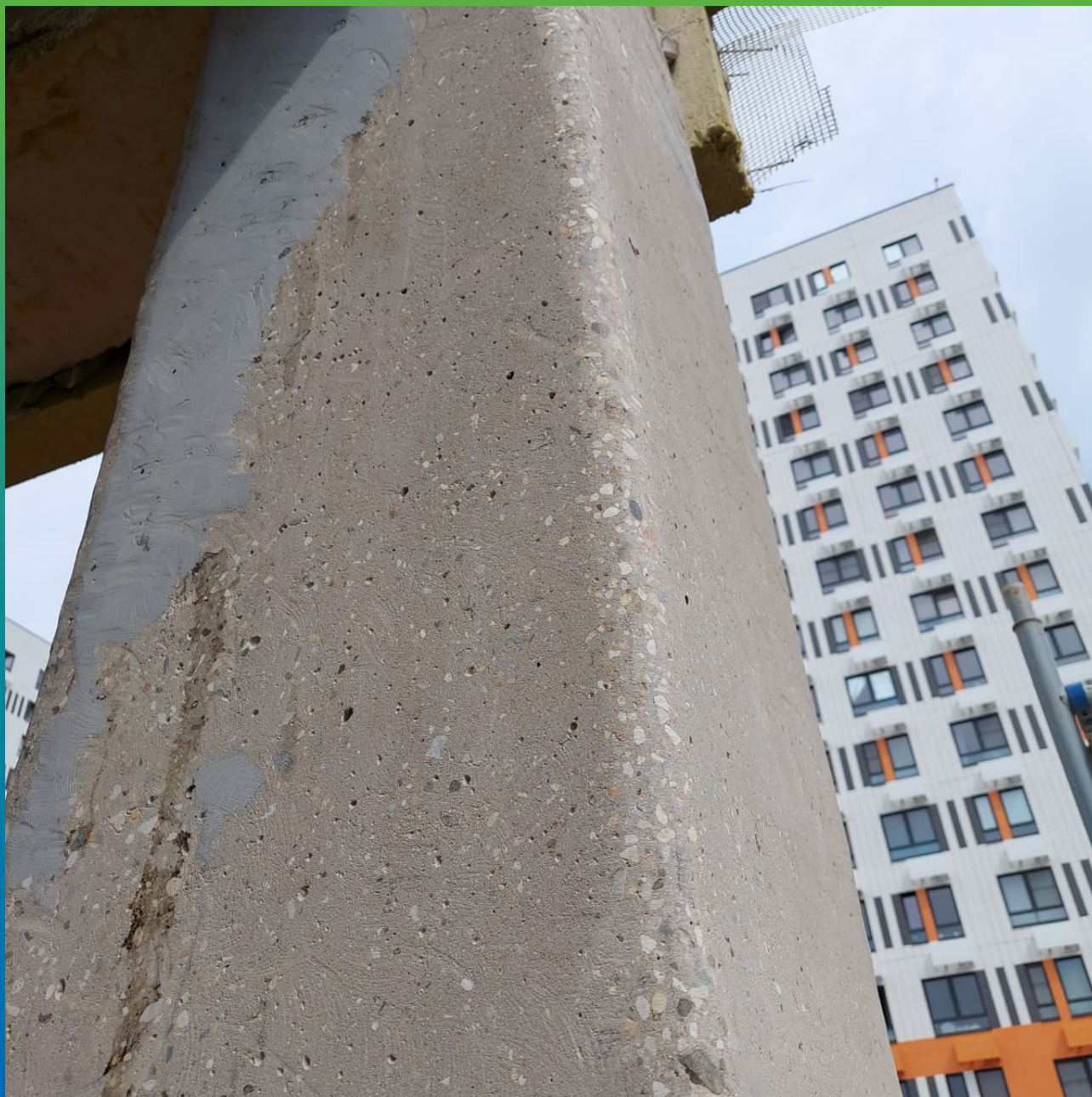
Подготовленная поверхность к нанесению внешней системы армирования