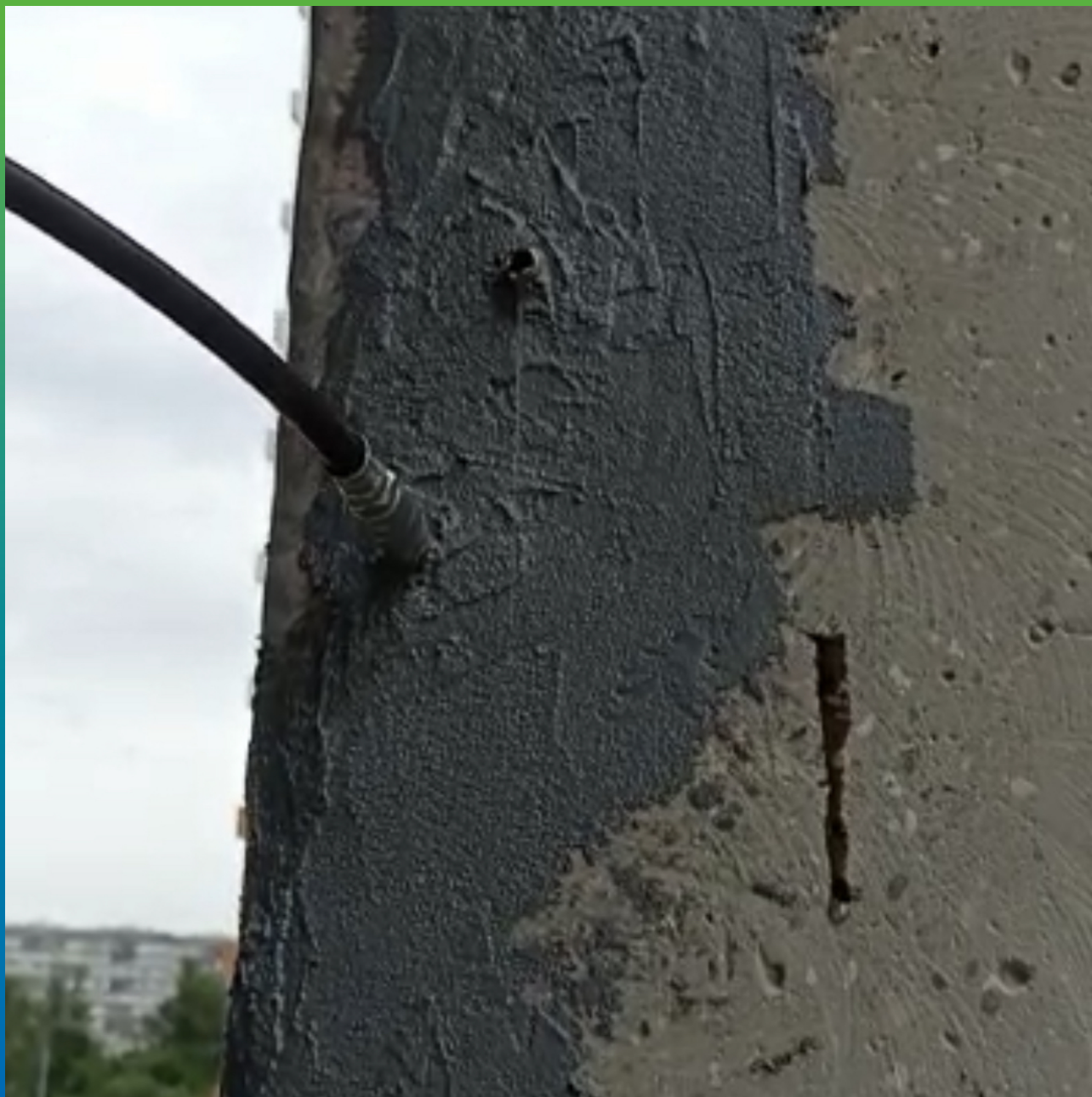
Нагнетание состава Манопокс 352 ЛВ в трещину