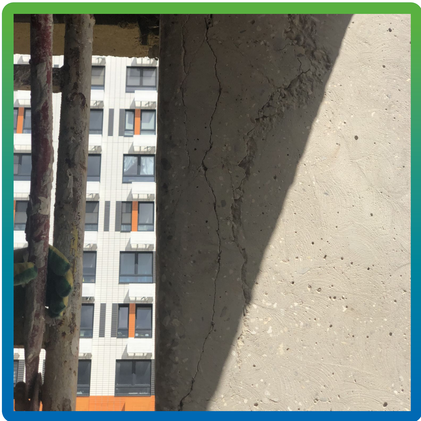
Состояние железобетонной конструкции до ремонта