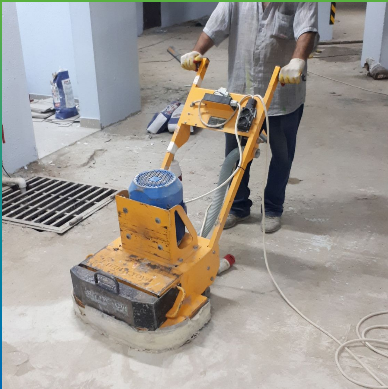
Шлифовка поверхности бетона