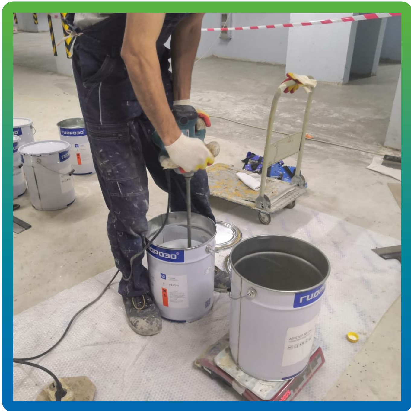
Подготовка финишного эпоксидного состава ДенТоп ЭП 501