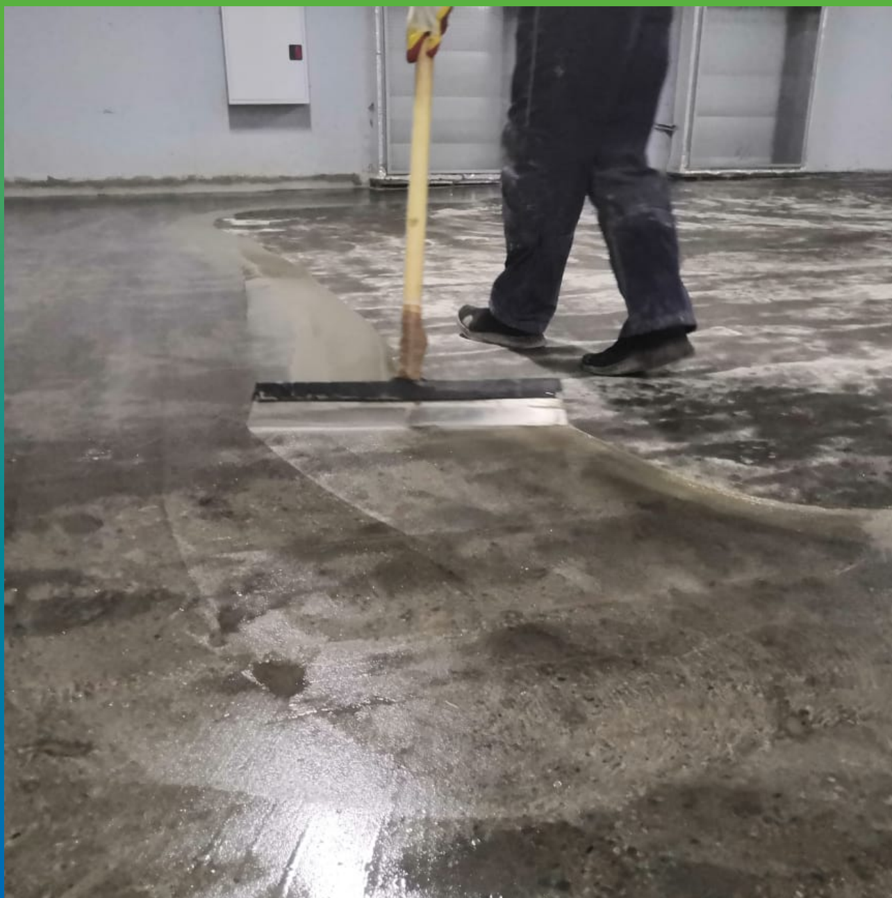
Выравнивание поверхности бетона грунтовкой ДенсТоп ЭП 104 с кварцевым песком