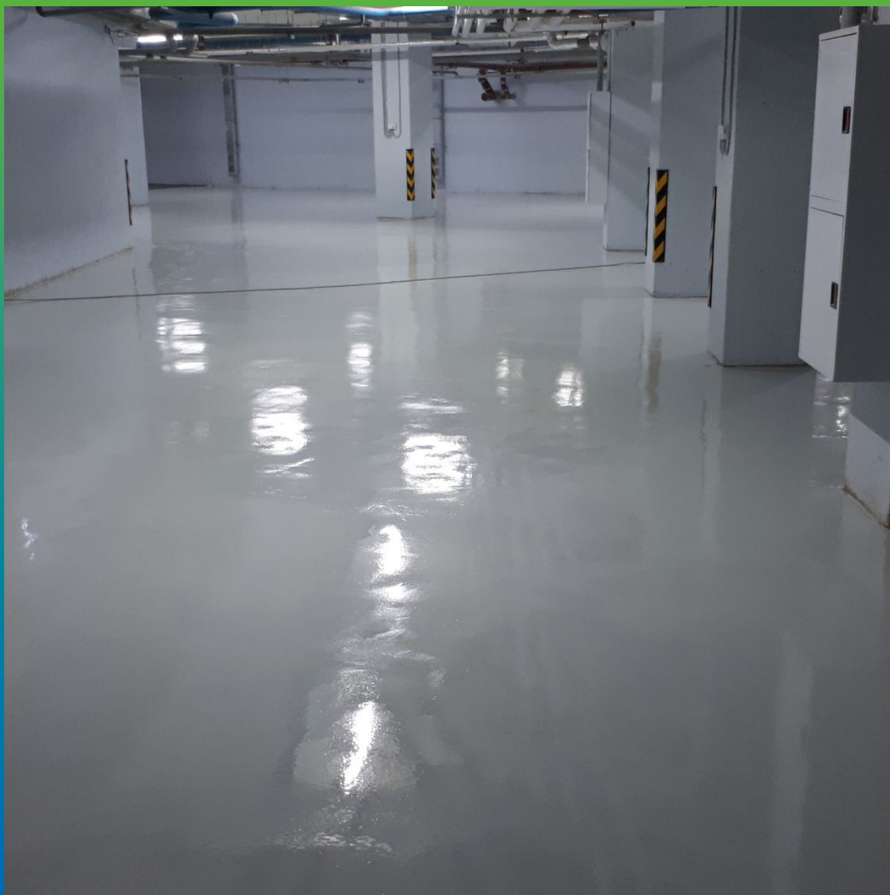
Нанесенный ДенТоп ЭП 501