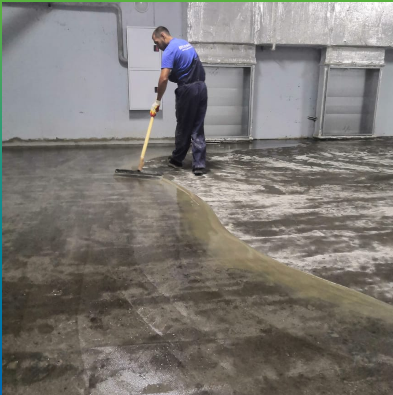
Грунтование предварительно наполненной грунтовкой ДенсТоп ЭП 104