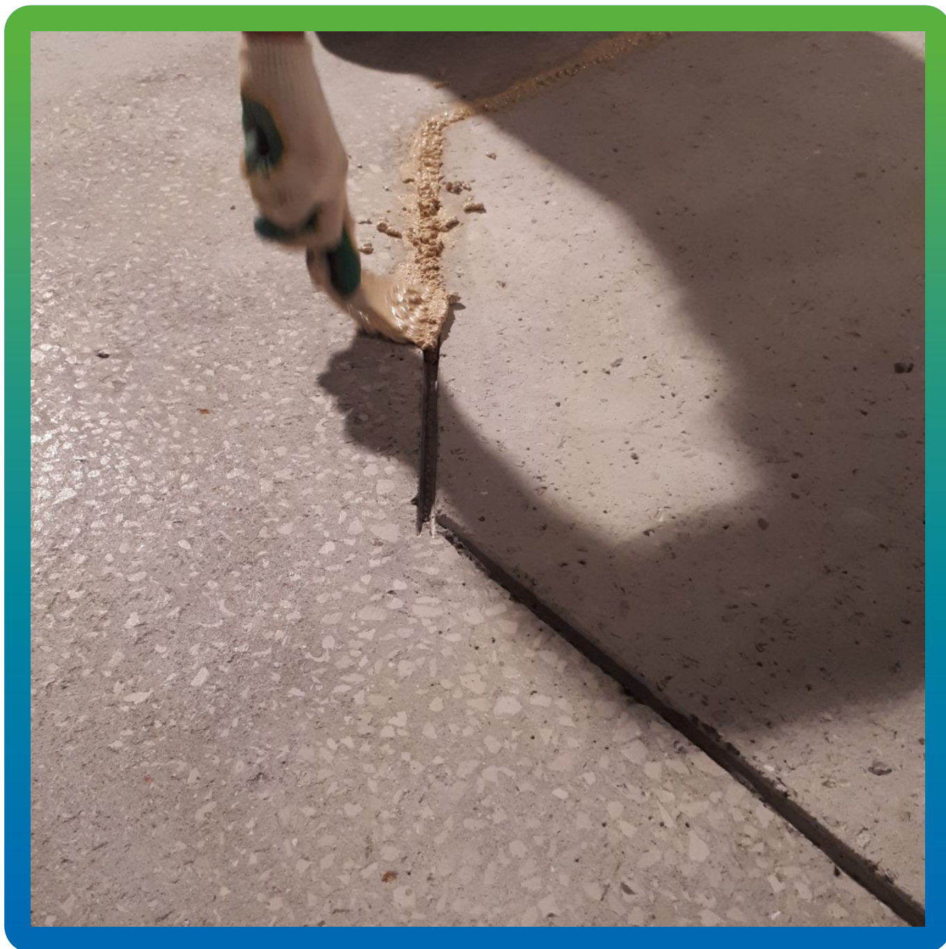
Заполнение анкерных пропилов материалом