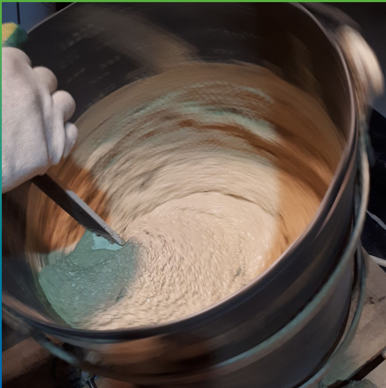
Перемешивание ДенТоп ПМ 605 Тровел