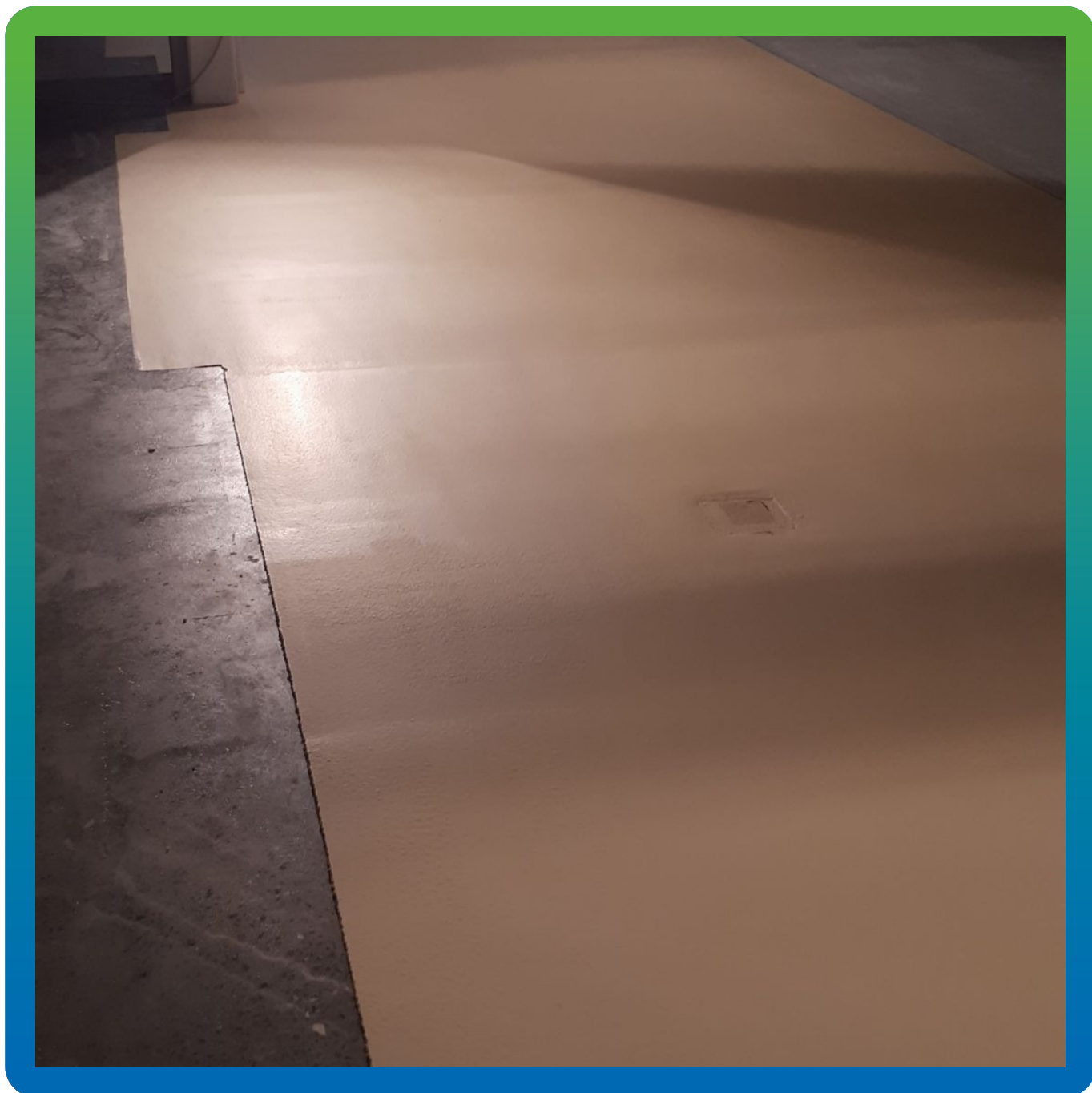
Финишный вид выполненного участка