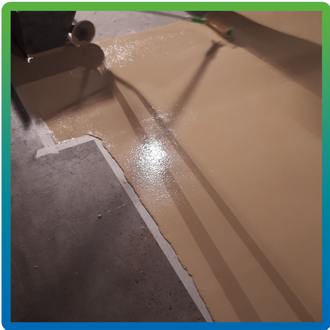
Прикатка валиком состава