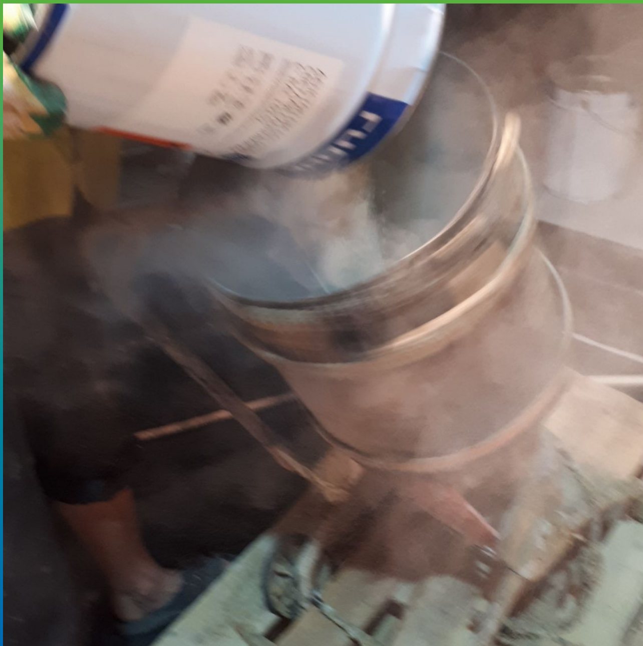
Добавление сухого сыпучего компонента