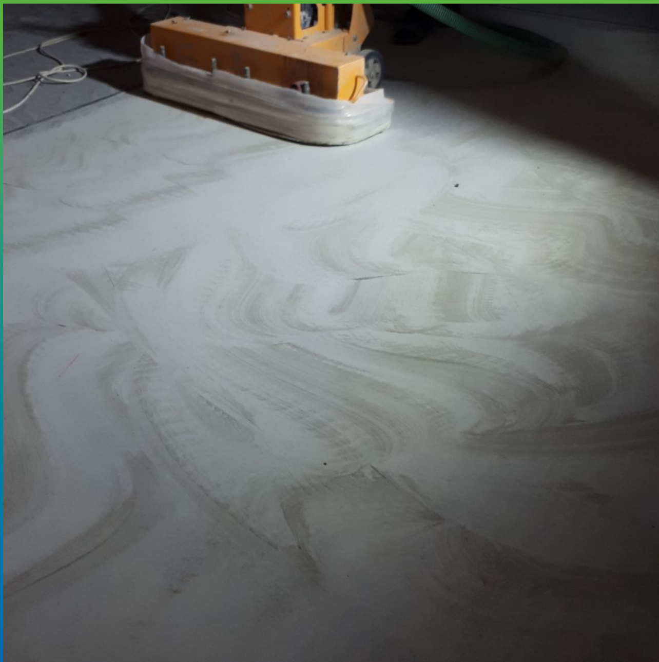
Шлифование поверхности бетона