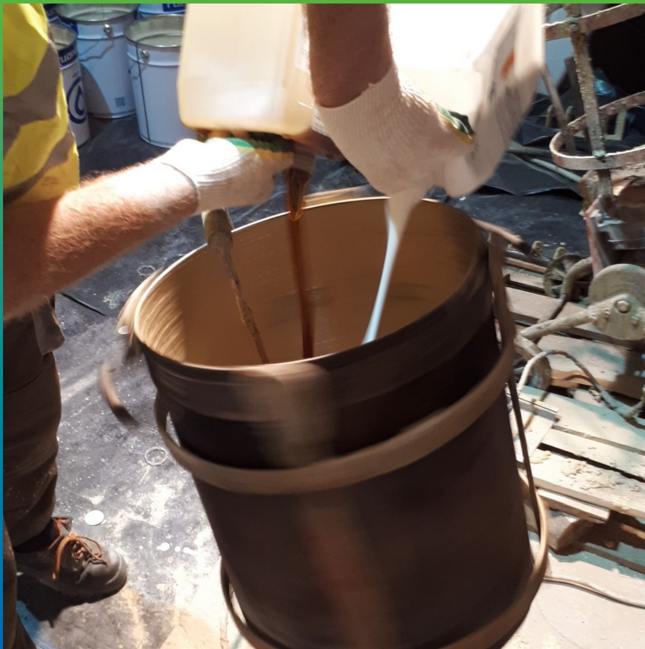
Смешивание жидких компонентов ДенСтол ПМ 605 Тровел