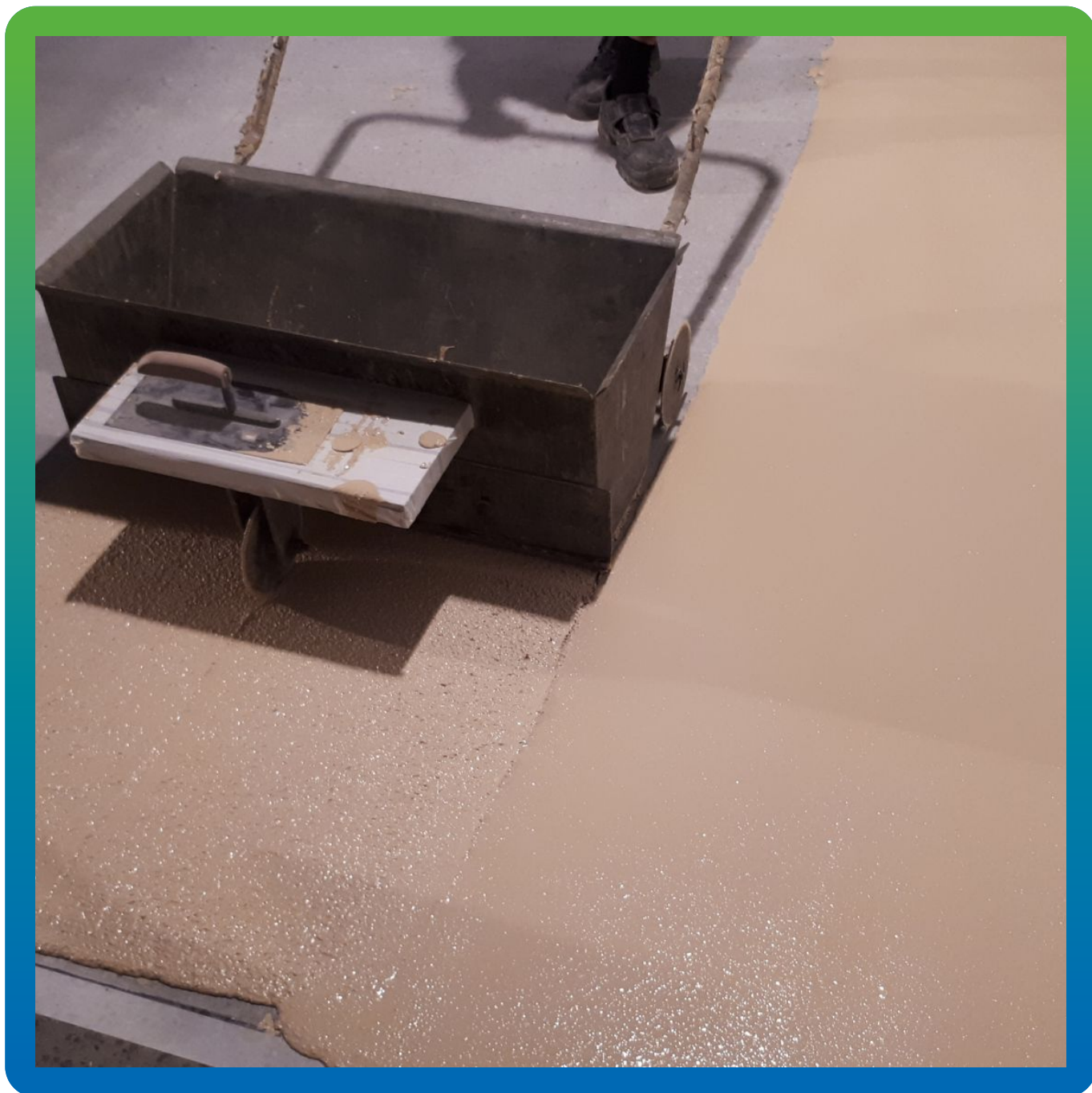
Распределение скридбоксом состава