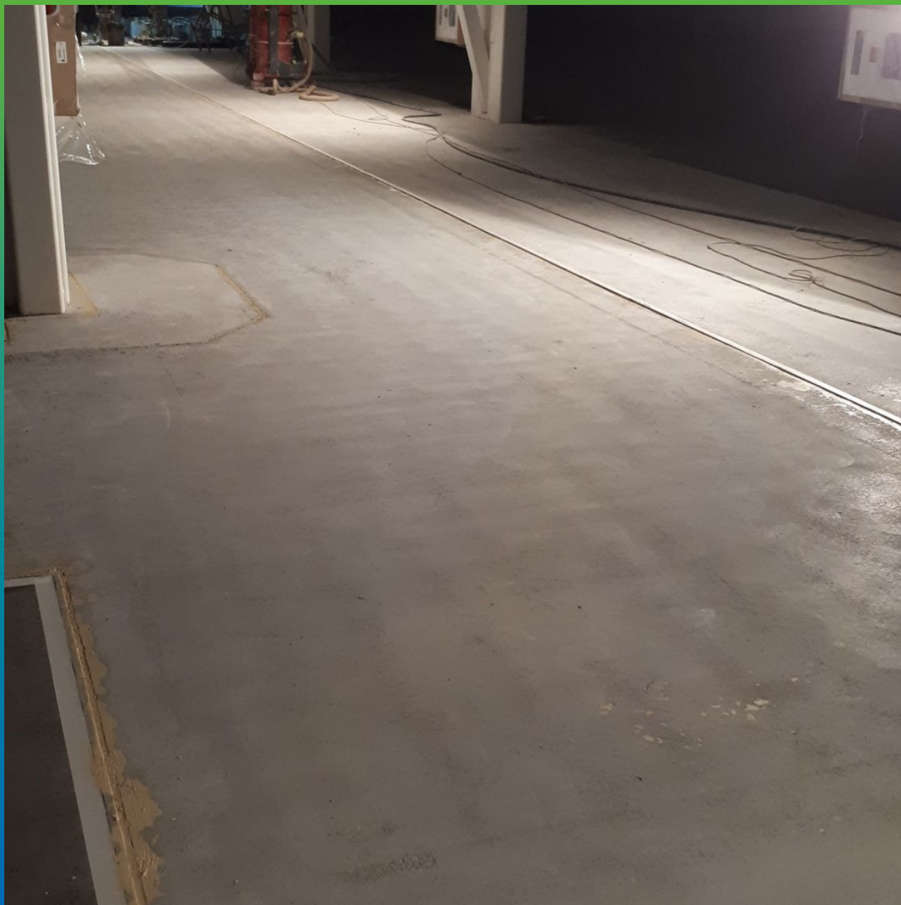
Подготовленная к нанесению поверхность