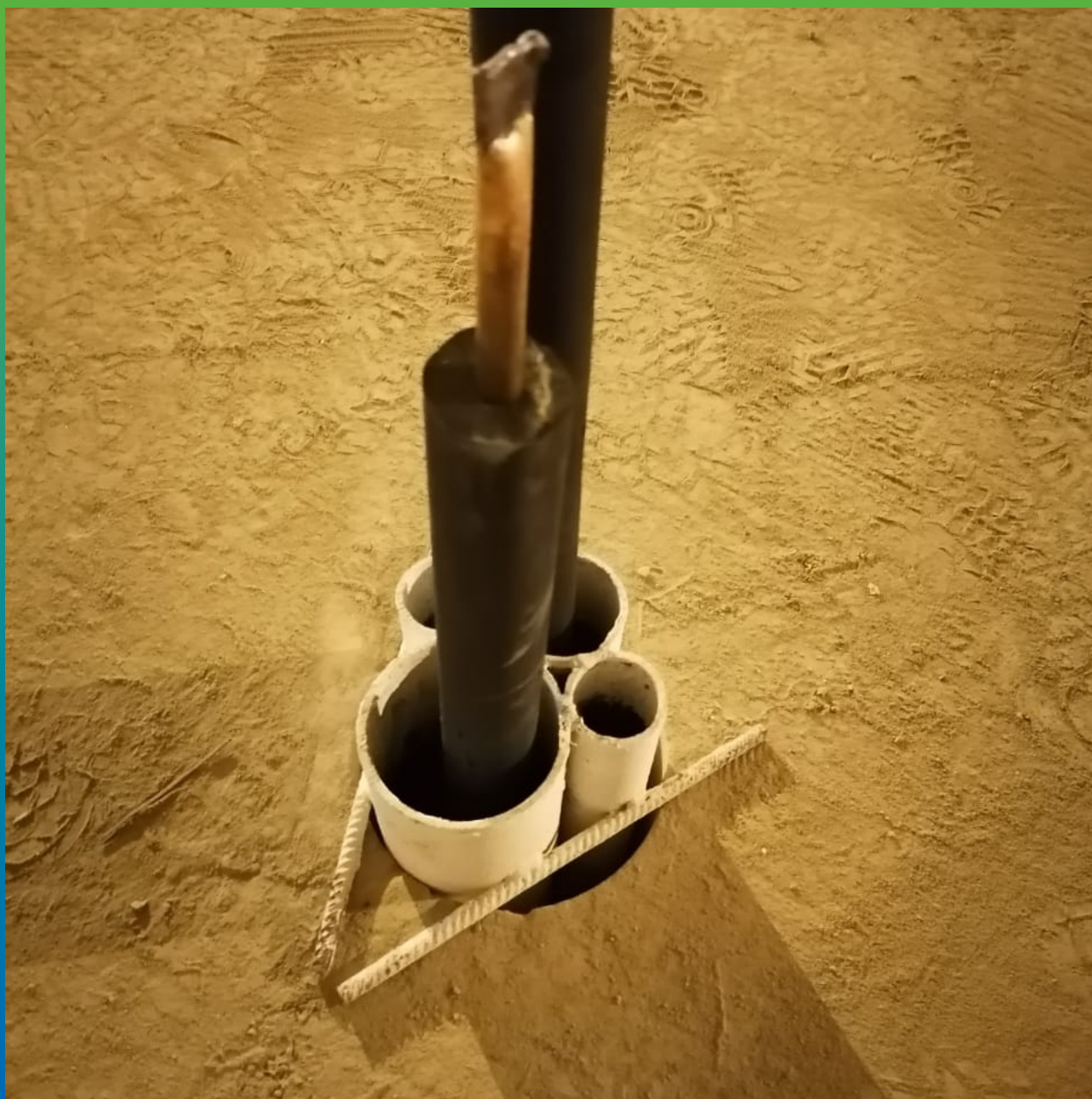
Ввод коммуникаций в плите пола, требующие герметизации.