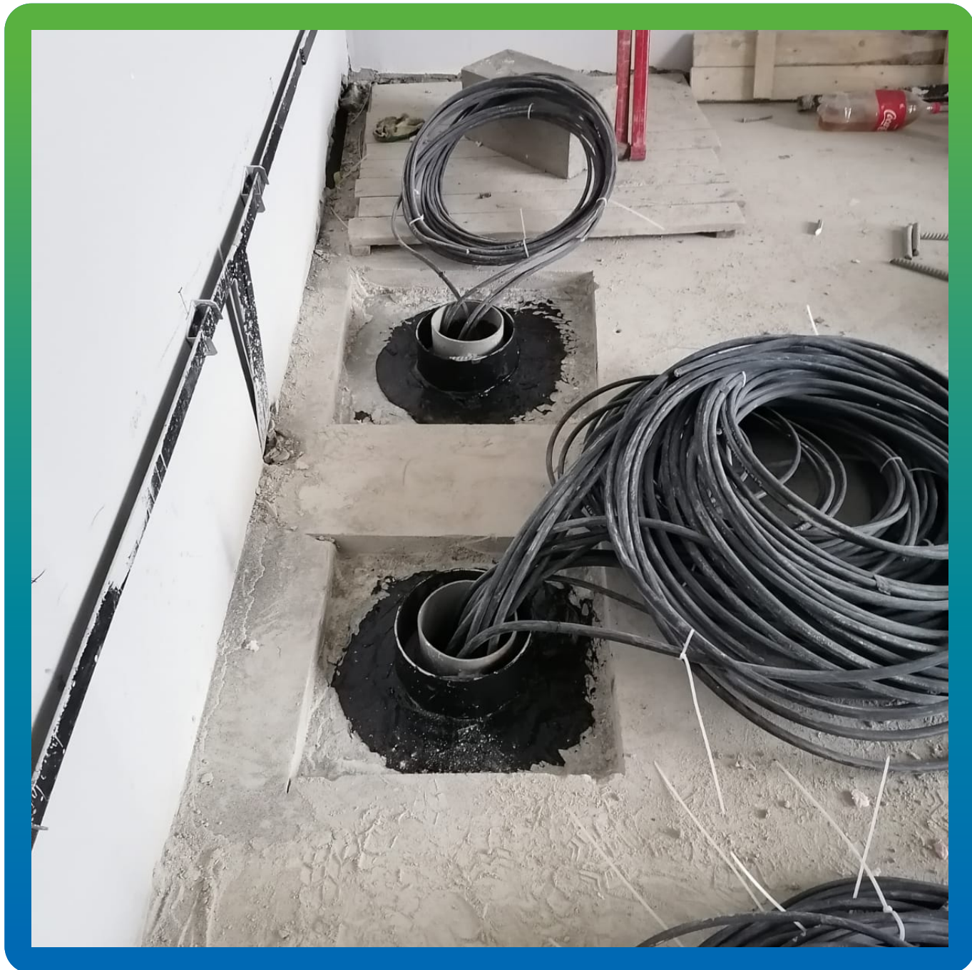
Герметизация ввода коммуникаций при помощи Манодил Бонд Ф.