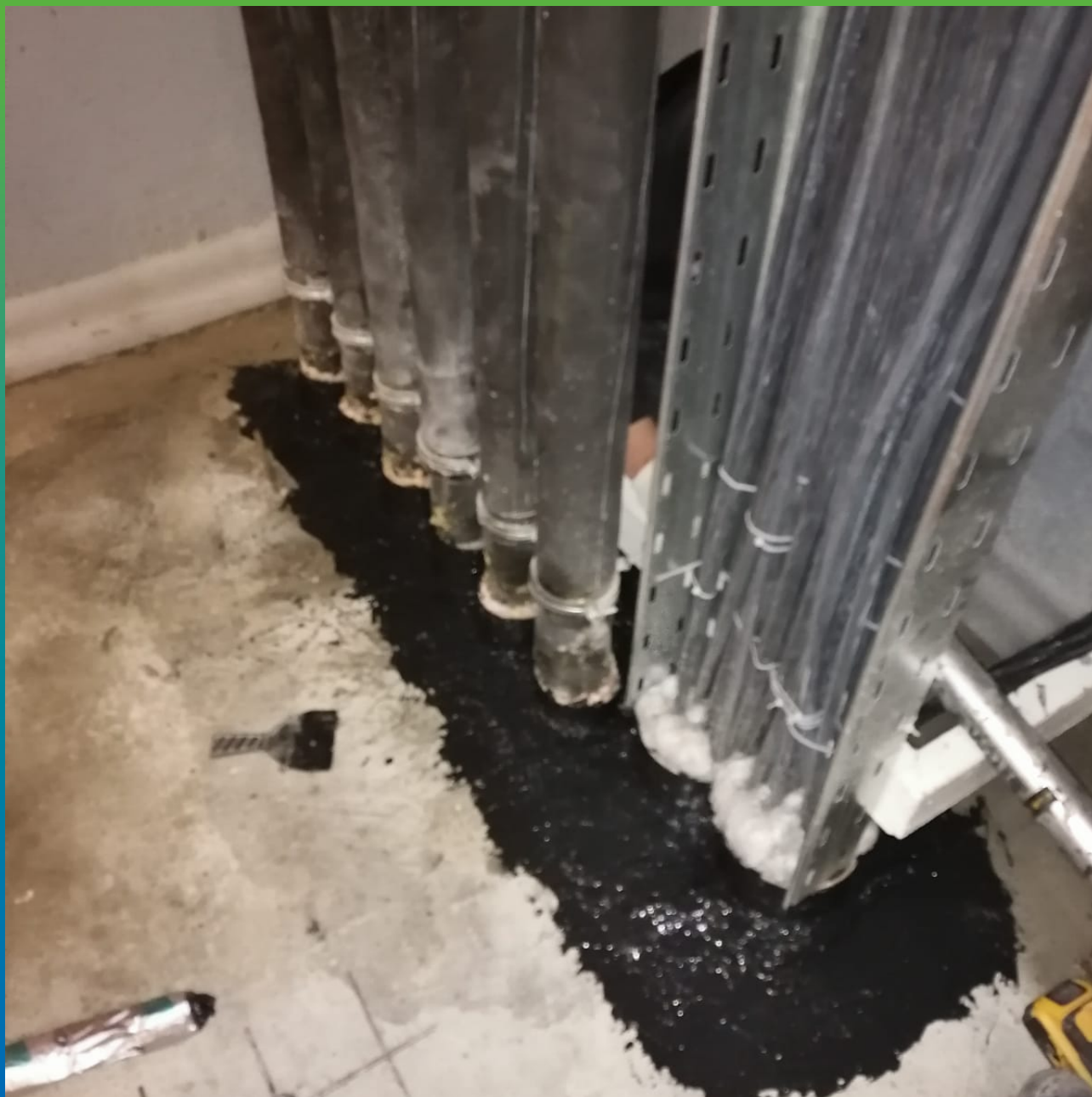
Герметизация ввода коммуникаций при помощи Манодил Бонд Ф.