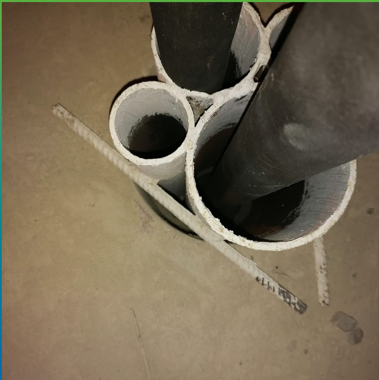
Ввод коммуникаций в плите пола, требующие герметизации.