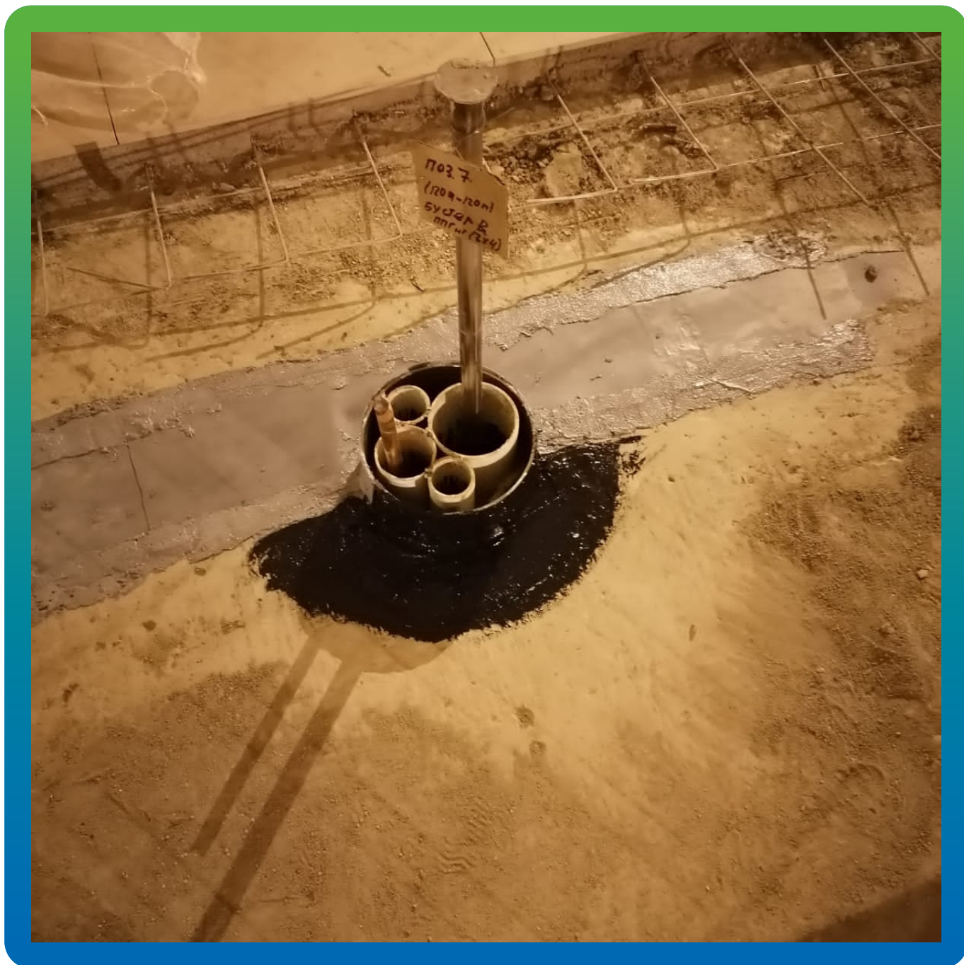
Герметизация ввода коммуникаций при помощи Манодил Бонд Ф.