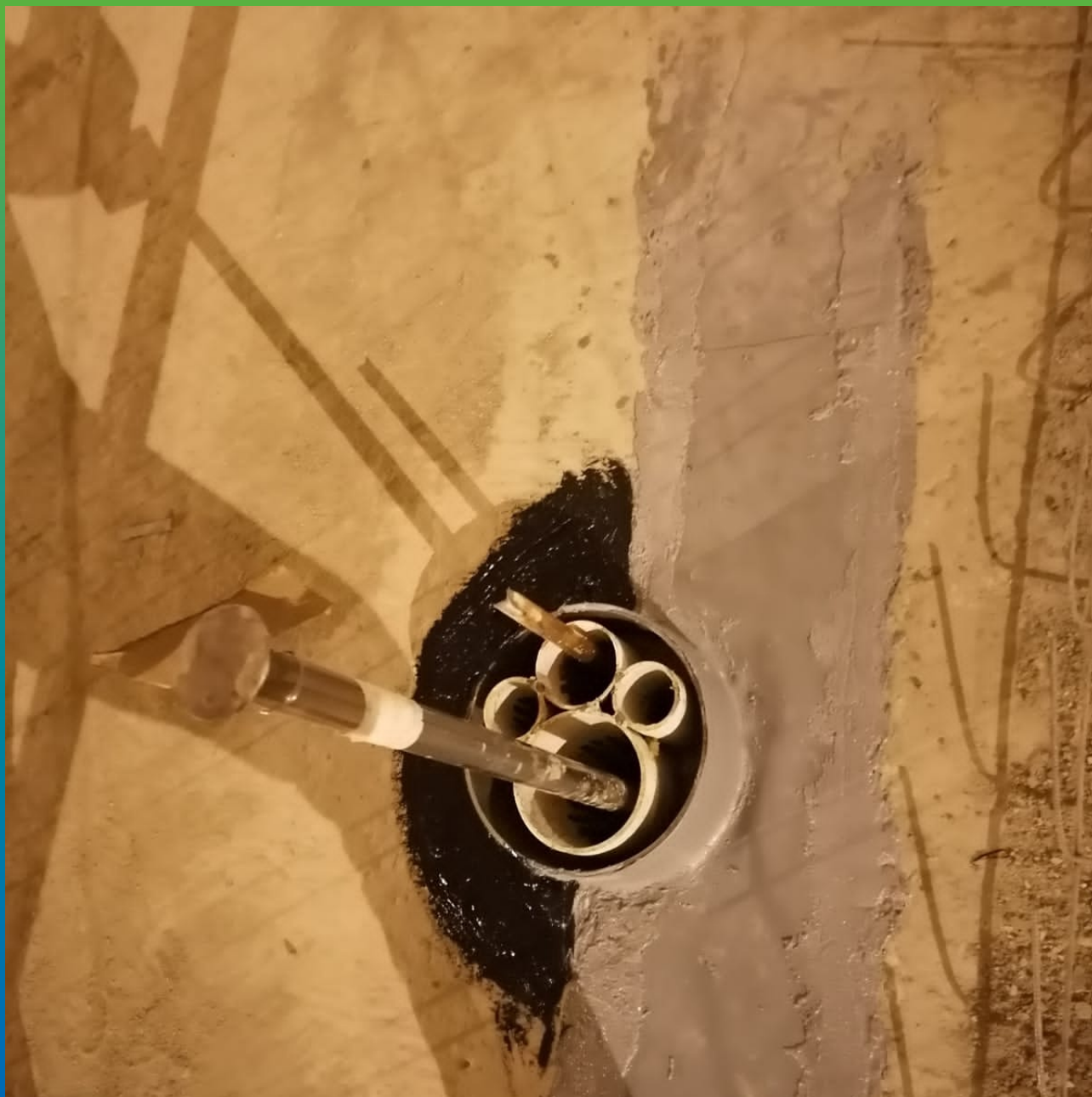
Герметизация ввода коммуникаций при помощи Манодил Бонд Ф.