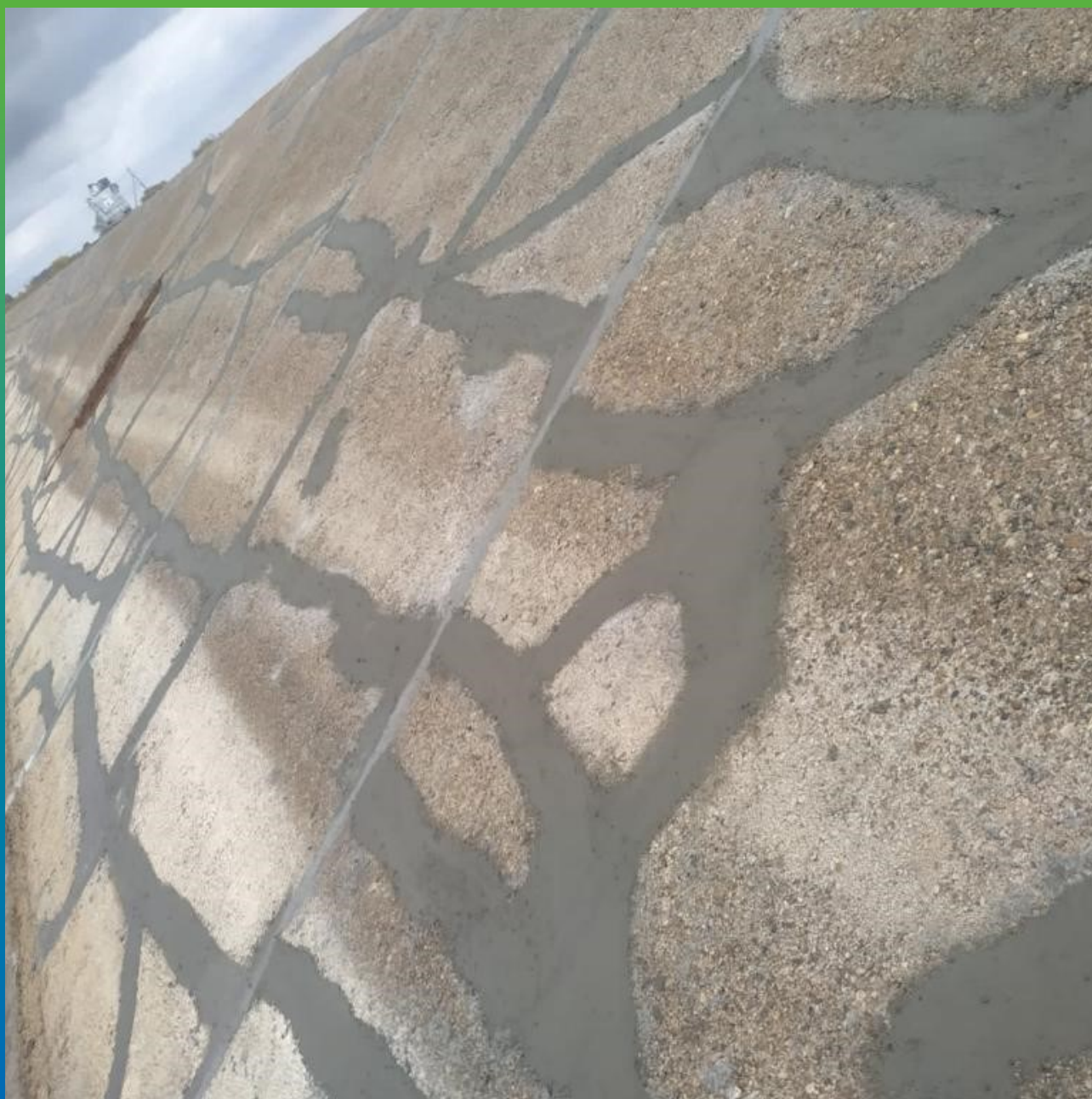
Швы и трещины, отремонтированные составами Манодил Цем и Стармекс РМЗ