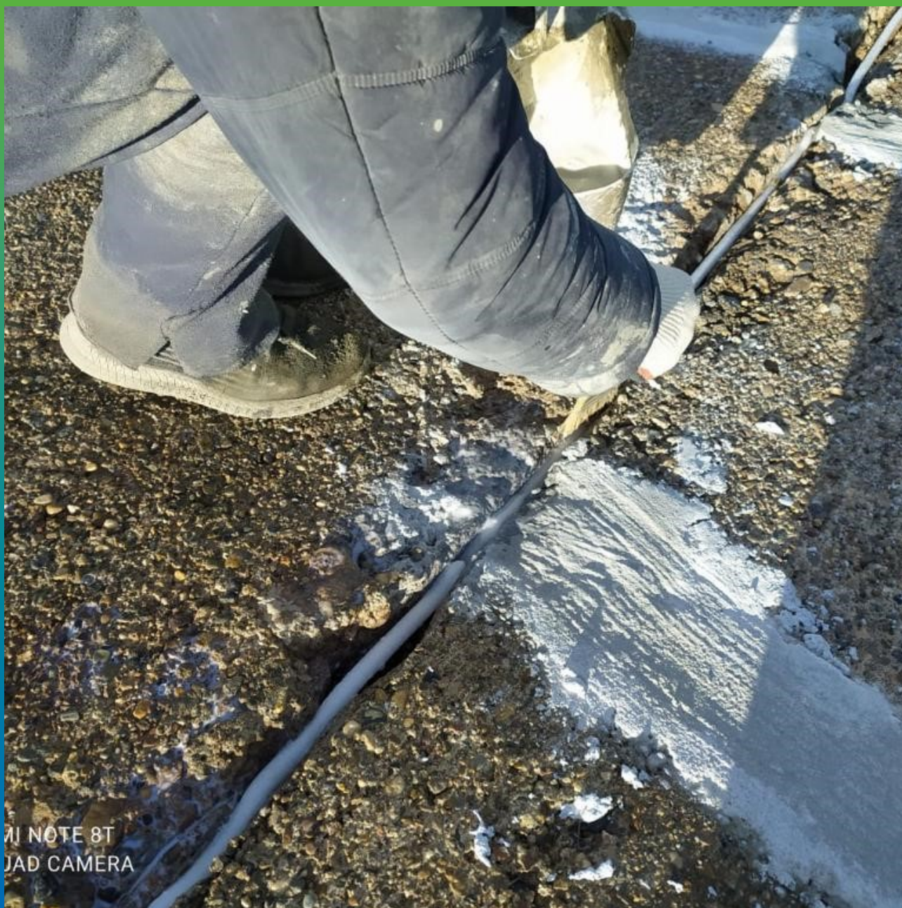
Очистка и грунтование шва