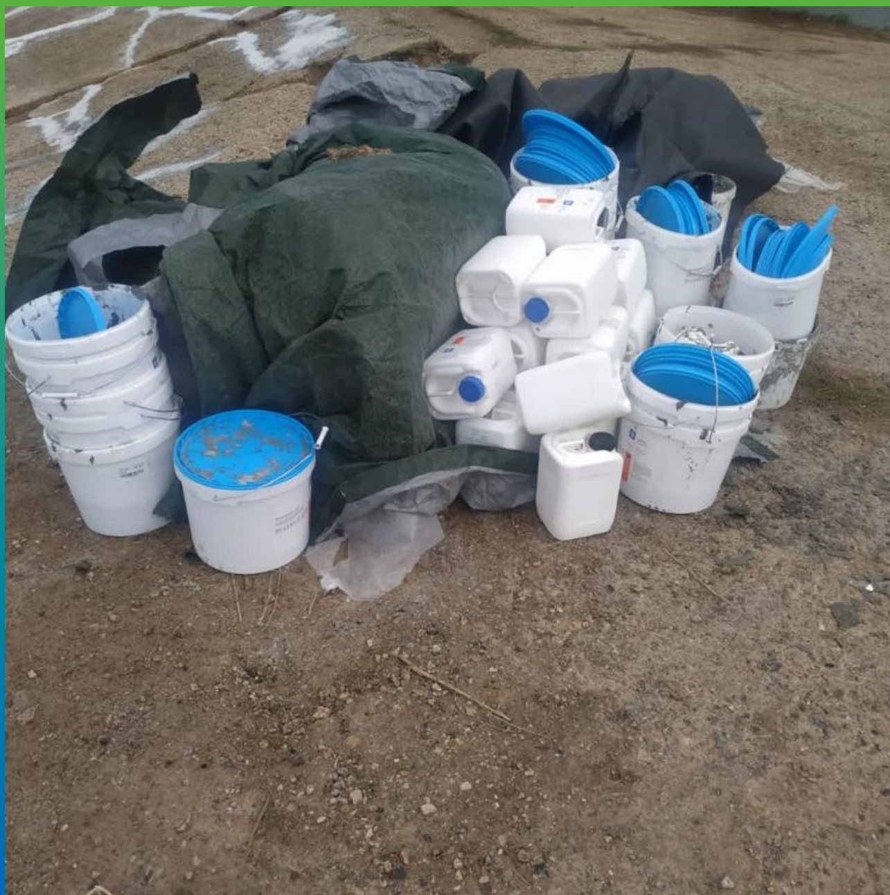
Материал на объекте