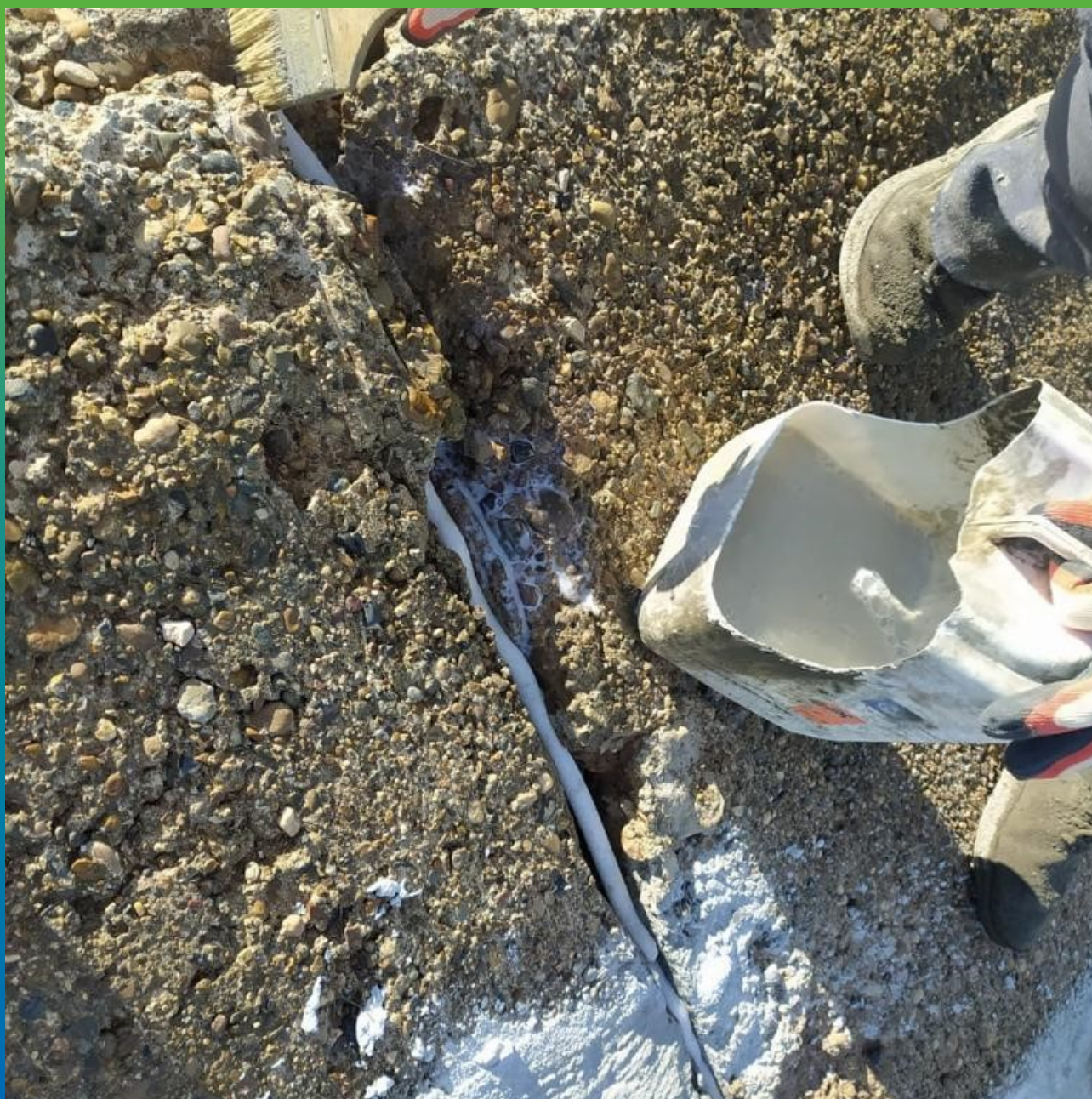
Очистка и грунтование шва