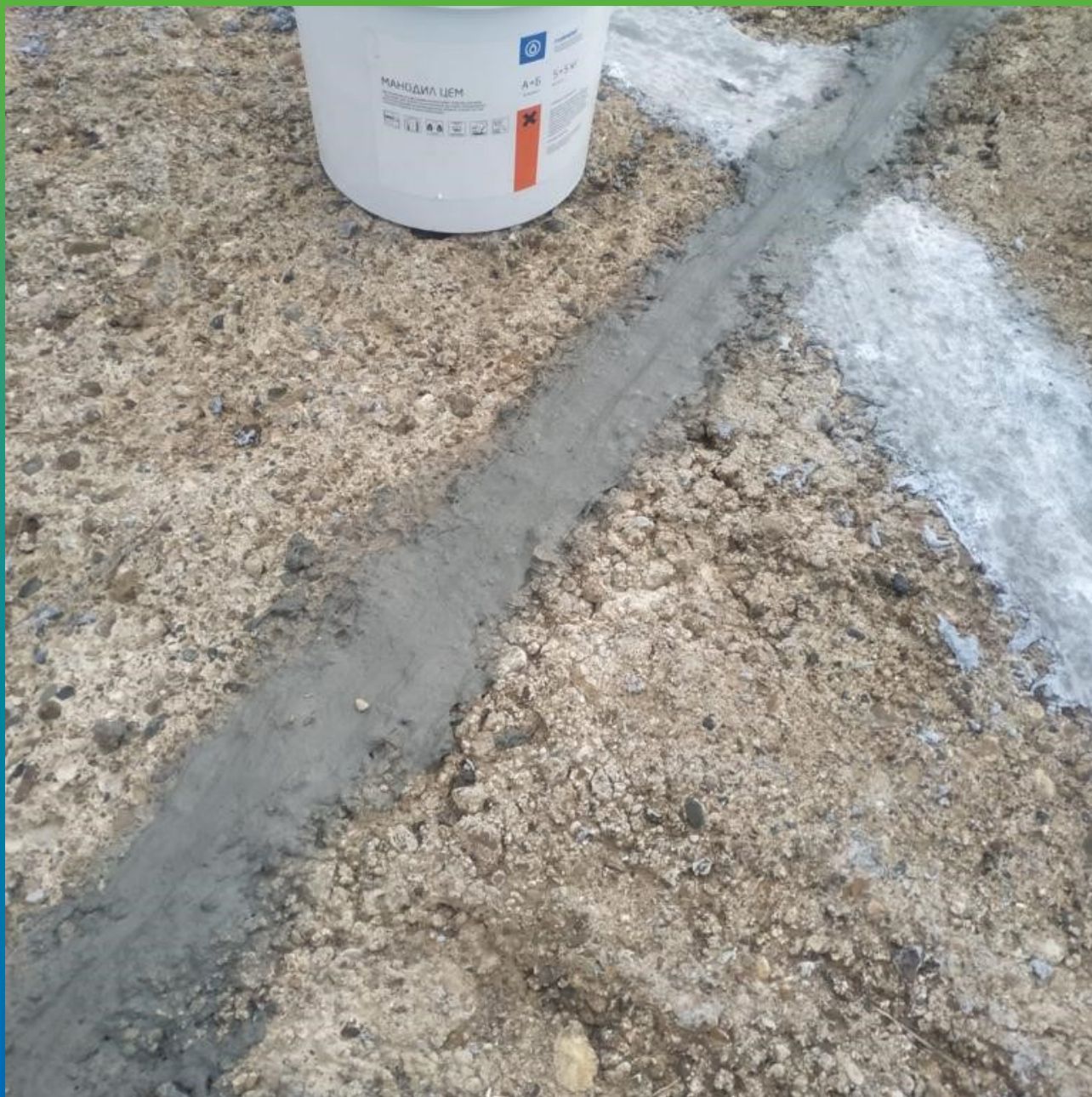
Материал на объекте