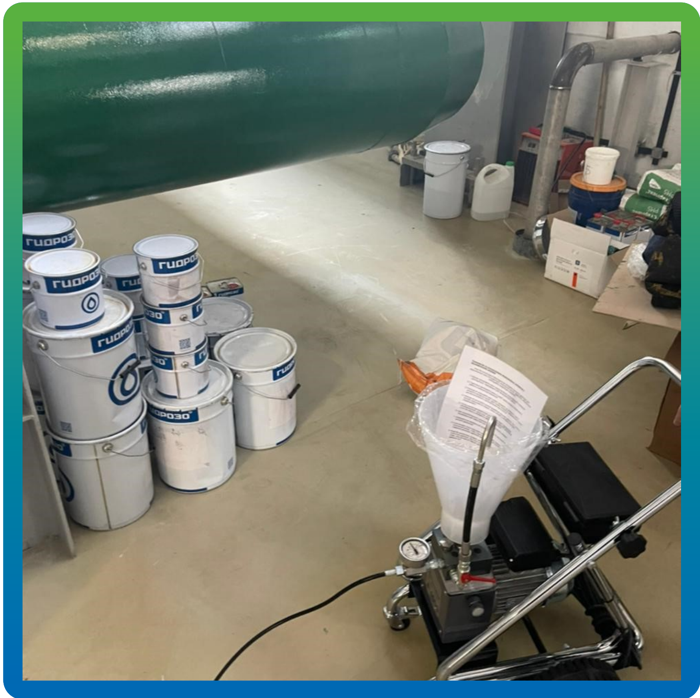
Насос БМ 1200 и Манопур 143